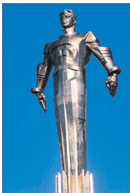
Реставрация памятника завершена

Отреставрировали и макет спускаемого аппарата космического корабля «Восток». Он вновь занял своё место у подножия памятника.