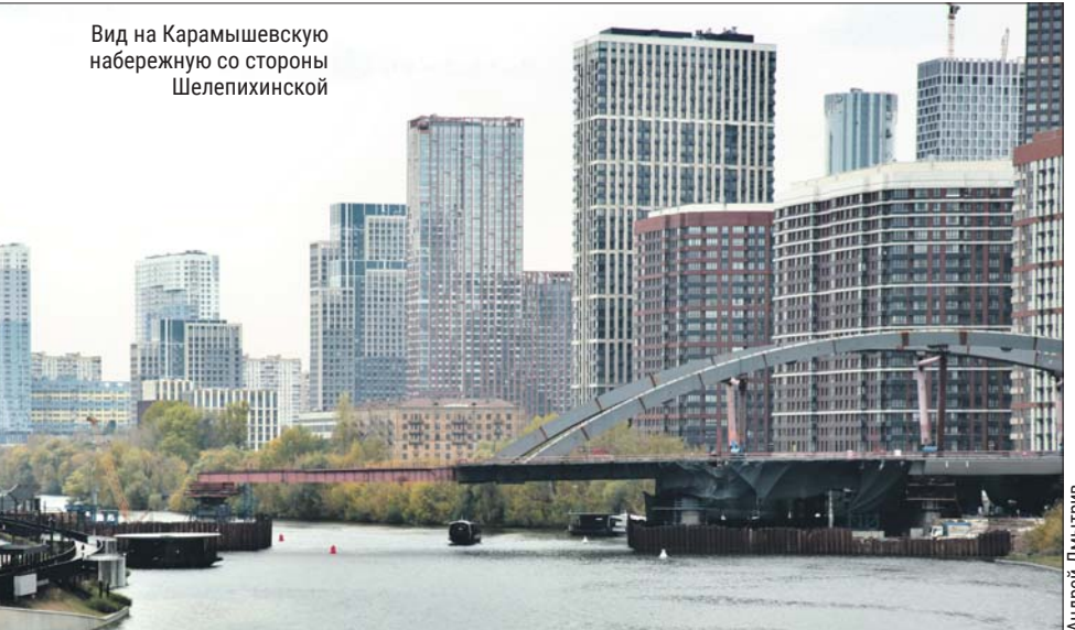
Вид на Карамышевскую набережную со стороны Шелепихинской

Пешеходные тротуары расширили и замостили гранитной плиткой, воздушные кабельные линии перенесли в подземные коллекторы, проложили более 100 метров водосточной сети, установили 113 фонарей, 100 скамеек и урн, организовали 35 велопарковок, разбили газоны, высадили деревья и сирень.