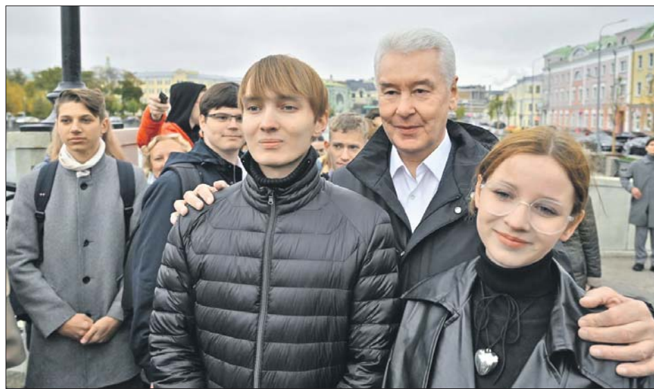
На Кадашёвской набережной Сергей Собянин пообщался с москвичами

— Одна из самых старинных набережных Москвы-реки — Кадашёвская набережная, историческая, и вот дошла до неё очередь. Мы соединили Овчинниковскую набережную, Якиманскую набережную, создав единый прогулочный маршрут. Так что можно действительно гулять и