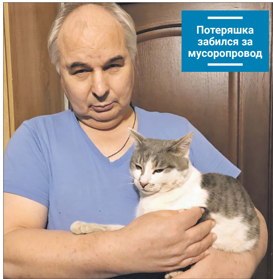
Потеряшка забился за мусоропровод