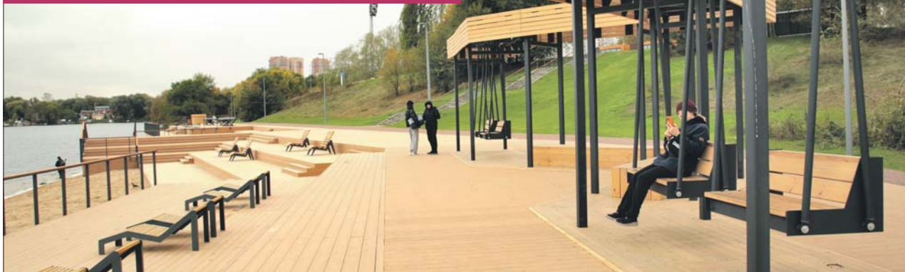
Большой Строгинский затон. Теперь здесь можно будет не только позагорать с комфортом, но и покачаться на качелях

Завершается реабилитация природно-исторического парка «Москворецкий»