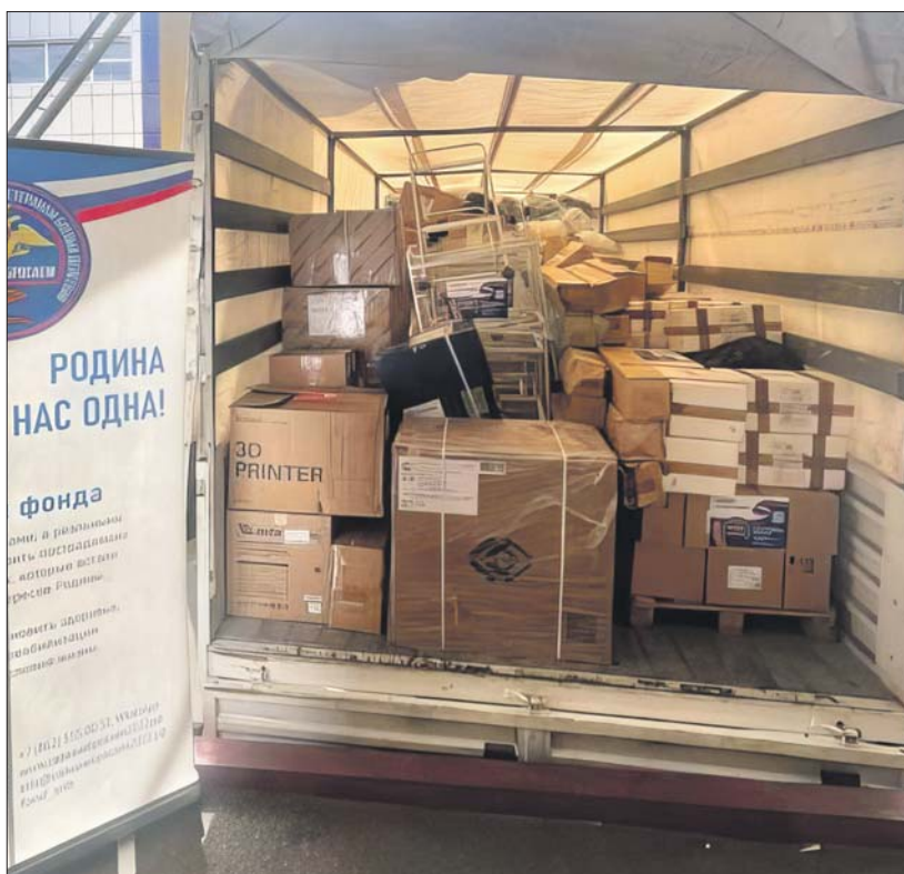
Гуманитарный груз скоро отправится на передовую