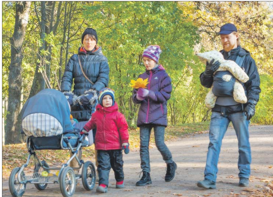
Пособия семьям с детьми подрастут

«Будем внедрять более гибкие и эффективные инструменты, улучшать качество обслуживания за счёт цифровой трансформации и упрощать порядок получения услуг», — написал Сергей Собянин.