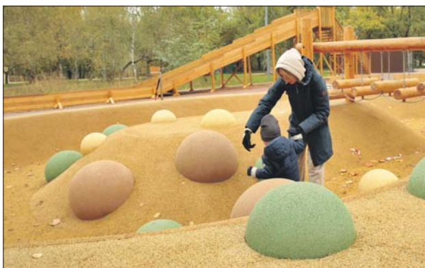
На такой детской площадке интересно поиграть

В парке 70-летия Битвы под Москвой обновили детскую и спортивную пло-