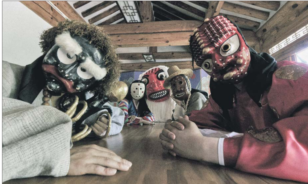
Представления с масками дошли до наших дней из глубины веков

В «Салюте» пройдёт фестиваль корейской культуры