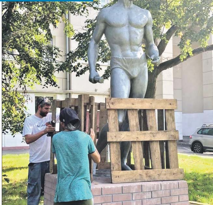
«Физкультурник» стоит во дворе уже 90 лет. Пришла пора привести его в порядок

По его словам, двор в военном городке Щукино — чуть ли не единственное место, где скульптуры советского периода не просто сохранились в первозданном виде, но и стоят на тех местах, где их и устанавливали 90 лет назад.