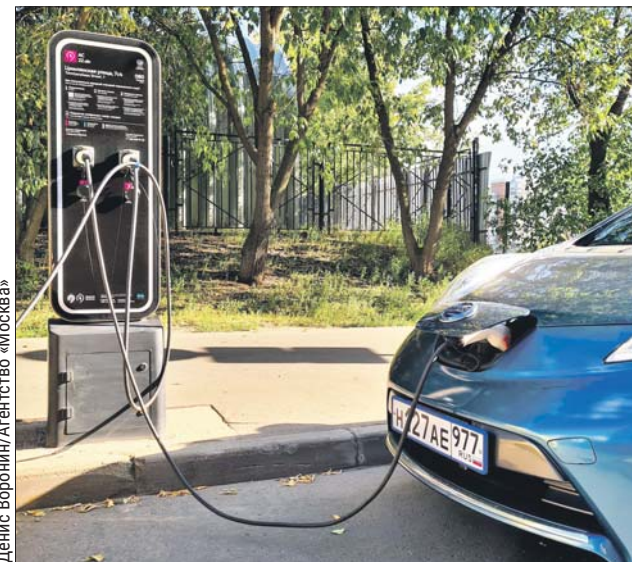
Денис Воронин/Агентство «Москва»

К 2030 году в Москве должно появиться до 30 тысяч зарядок