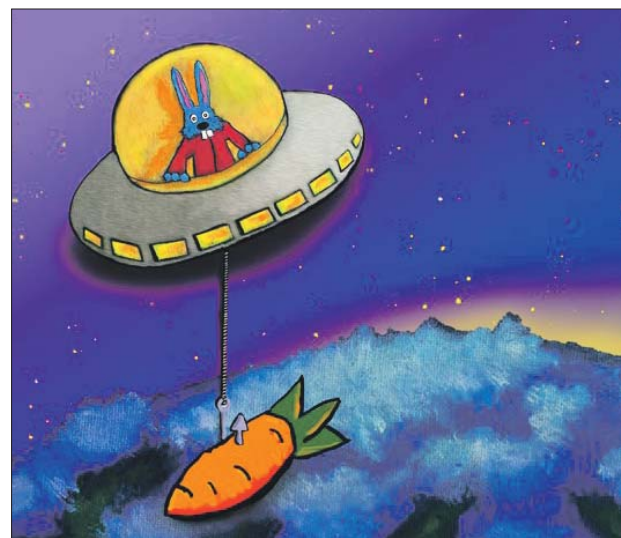
Картина художника Морковкина (Никиты Лыткина) «Пират»

Галерея «Ходынка»: ул. Ирины Левченко, 2