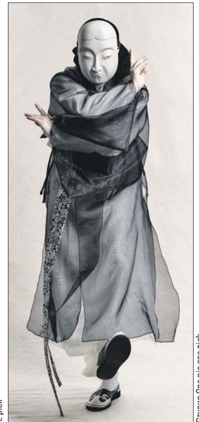
Танец бонсан признан нематериальным культурным наследием Кореи

— Его главная изюминка — показать движениями, как веер, слив-