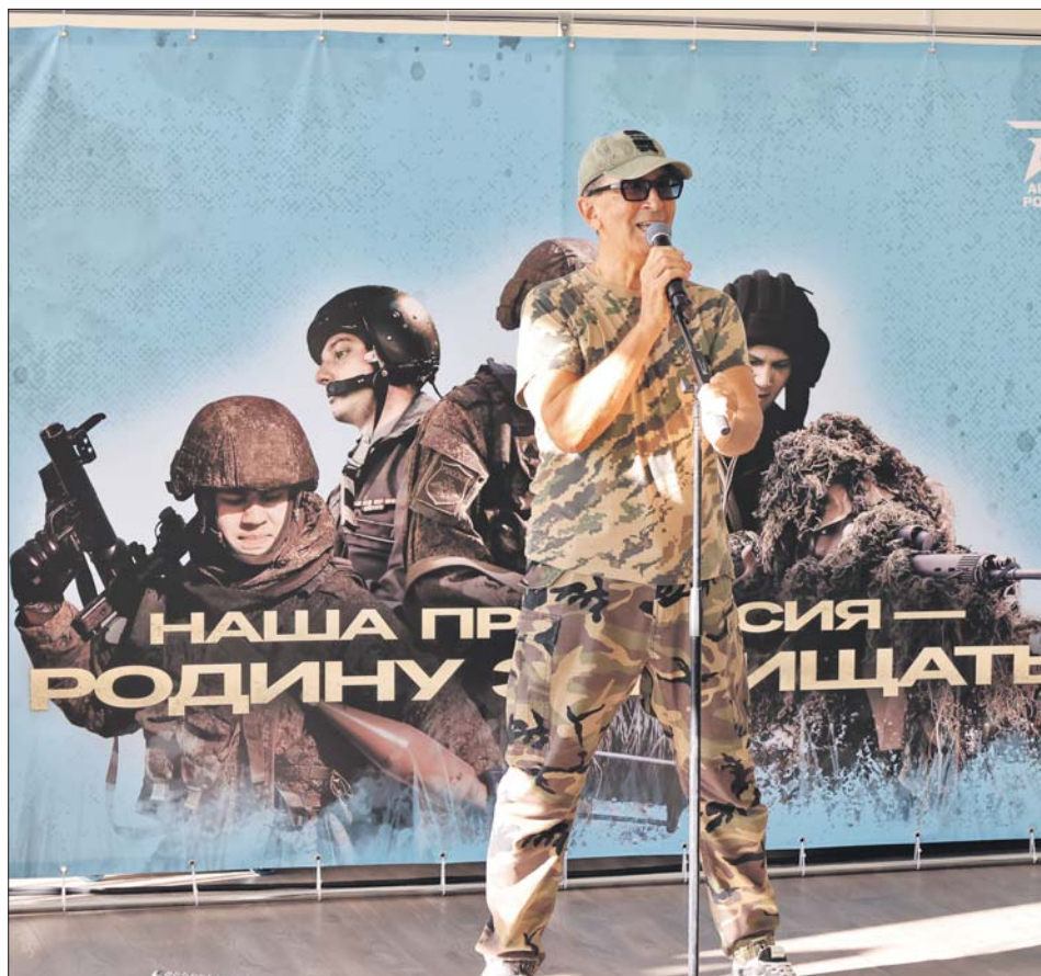
Александр Буйнов не раз выступал «за ленточкой», теперь он спел для тех, кому предстоит отправиться на передовую