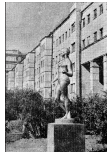
Из книги: Жуков К.В. Архитектура жилых домов из крупных блоков / Акад. архитектуры СССР. М., 1956

— Для меня это самое интересное, — говорит Пасхин. — Сначала скульптура выглядит,