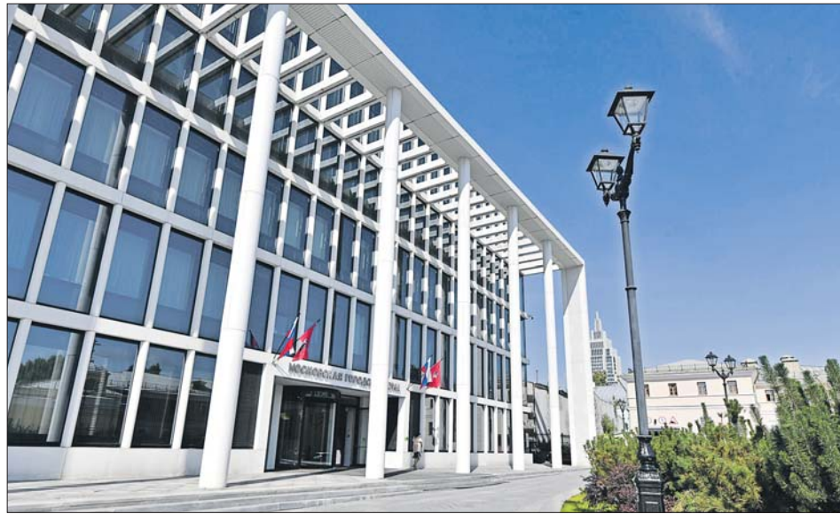
6-8 сентября нам предстоит выбрать депутатов Московской городской думы 8-го созыва

— Мы не наблюдаем никаких скандалов, столкновений. И в этом смысле все зарегистрированные кандидаты достаточно однозначно понимают работу с избирателем и, соответственно, двигаются к до-