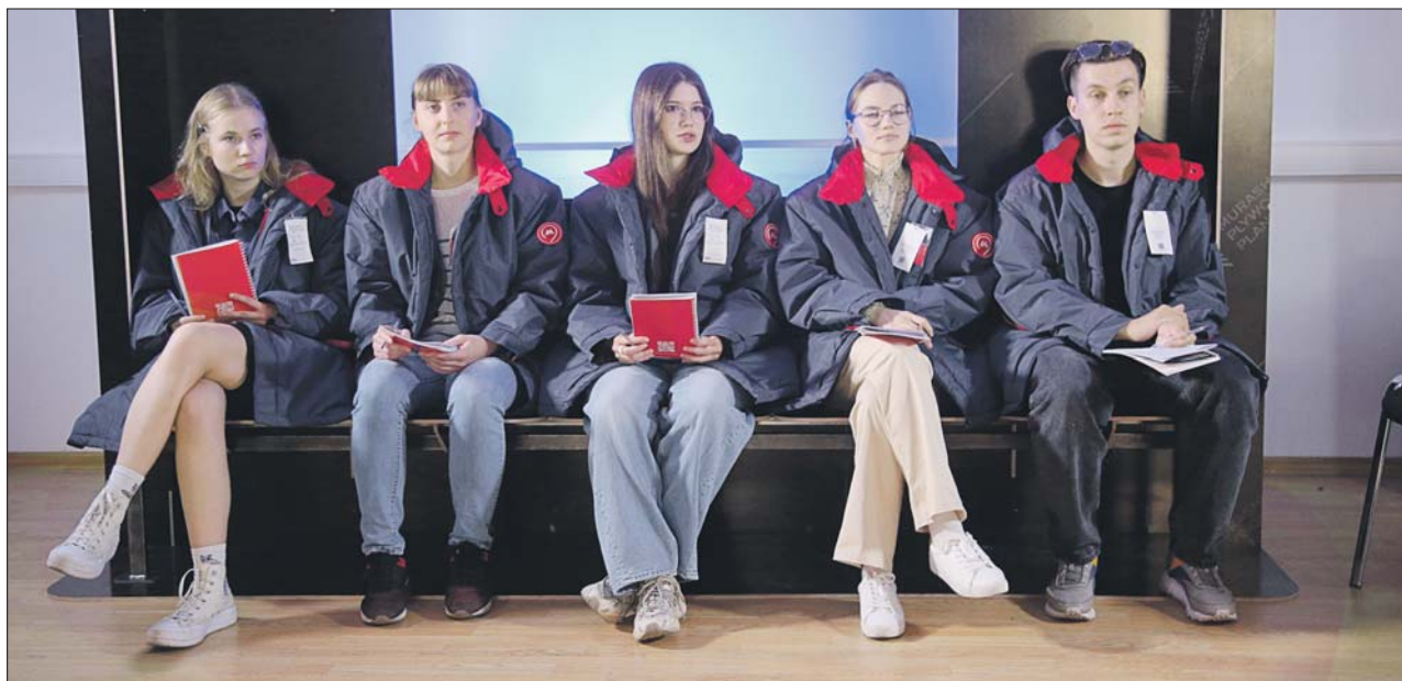
В центре на Тушинской улице установили стенд, имитирующий часть вагона поезда метро с моделями сидений разной ширины