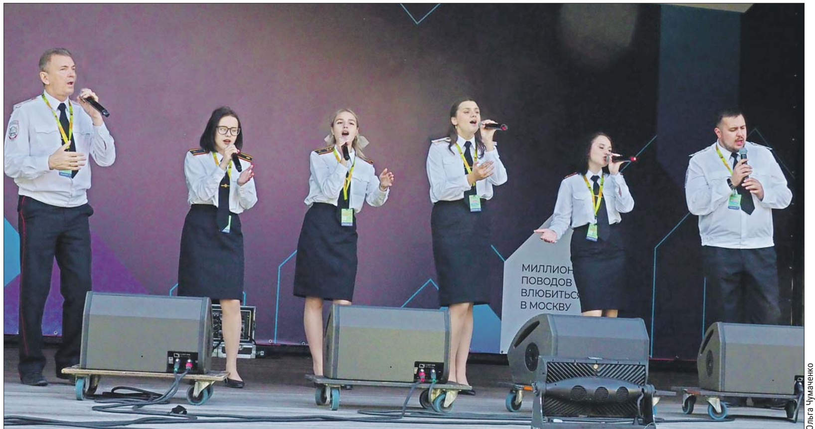
Фестивальная площадка на Авиационной. Выступают участники конкурса A Capella

Для любителей игр на свежем воздухе провели открытые тренировки по волейболу