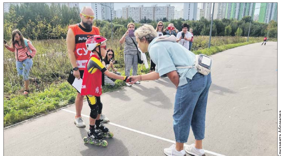
Двукратная олимпийская чемпионка по биатлону Ольга Зайцева дала старт состязаниям