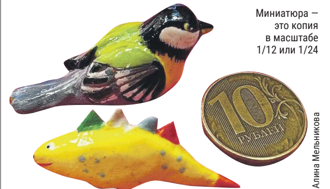
Миниатюра — это копия в масштабе 1/12 или 1/24

Дворец творчества детей и молодёжи «Неоткрытые острова» в Митине: Ангелов пер., 2, корп. 2, тел. (495) 751-9994