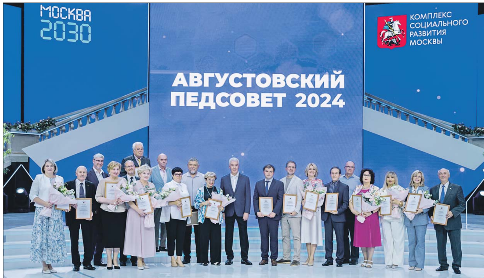
Гостиный Двор, августовский педсовет. Сергей Собянин с лучшими педагогами Москвы

По словам мэра, изменения коснулись системы