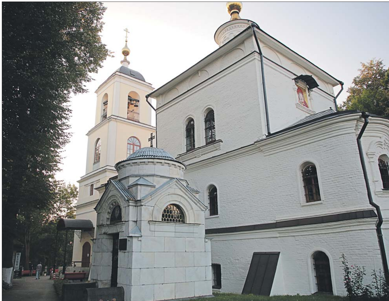
Храм поражает древней лаконичной красотой. Он сложен из кирпичей, белённых известью

Храм Владимирской иконы Божией Матери подарил мне особенную благодать