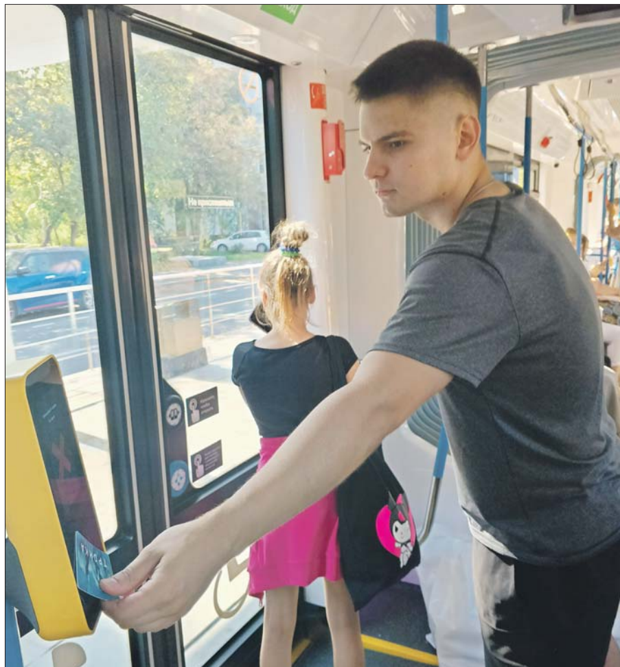
Приложив «Тройку» к валидатору, пассажир активирует онлайн-пополнение карты