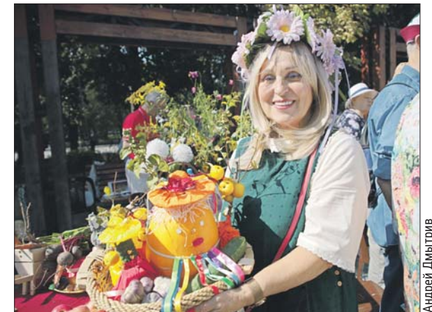
Яркие поделки из овощей и фруктов понравились всем