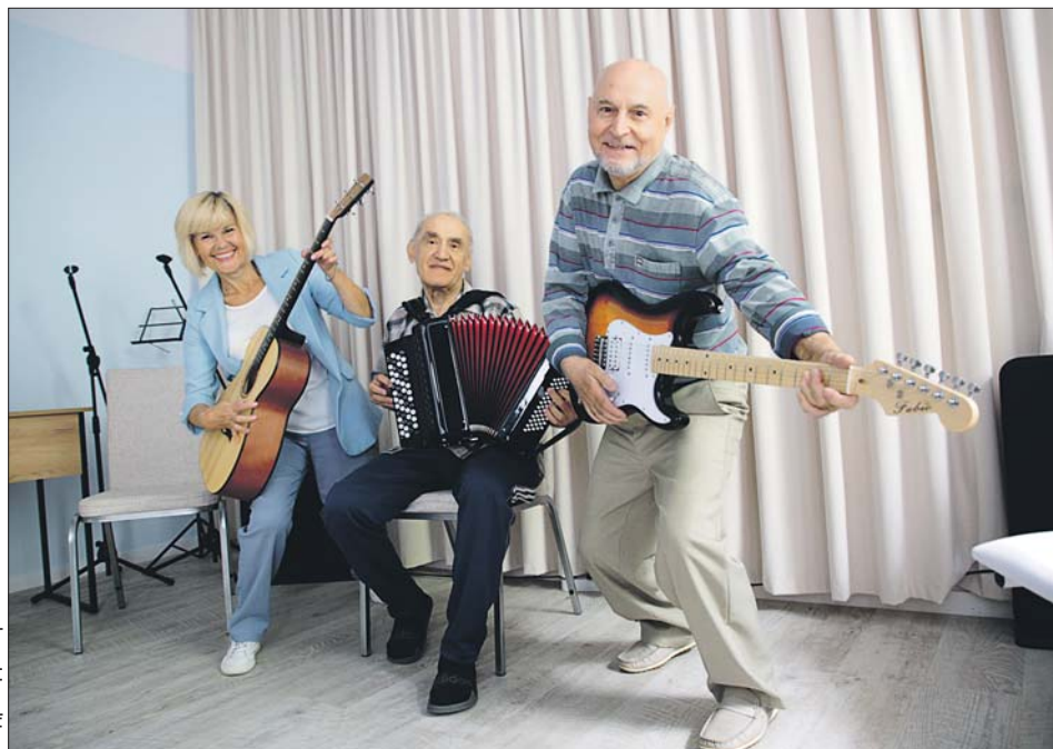
В актовом зале можно устроить импровизированный концерт — здесь есть музыкальные инструменты

— В нашем центре 10 тематических локаций. В актовом зале можно проводить не только концерты, но и смотреть фильмы на большом экране. Есть мастерские для занятий изобразительным искусством, столярным делом, художественно-прикладными видами творчества, — расска-