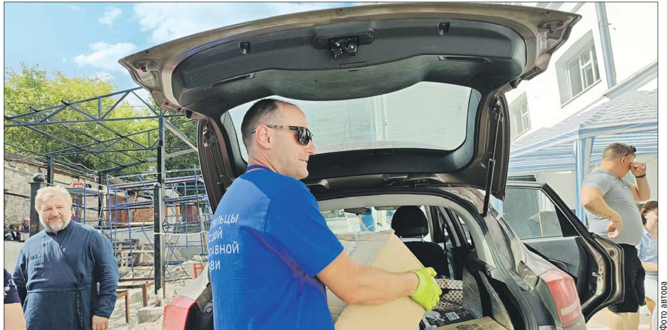
Собранные прихожанами продукты доставили в центр помощи переселенцам, созданный РПЦ в Курске

Ежедневно сюда приходят сотни человек. Все они лишены домов и имущества. Но есть и так называемые двойные беженцы. Так, один житель потерял свой дом в результате обстрела, получил жилищный сертификат и купил жильё в Судже. А после вторжения нацистов снова остался без дома. Недавно его направили в ПВР.