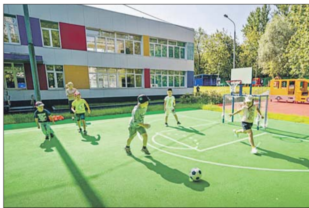
Сделали спортивную зону с верандой и универсальным полем

По его словам, в этом году были благоустроены территории более 120 школ и детских садов.