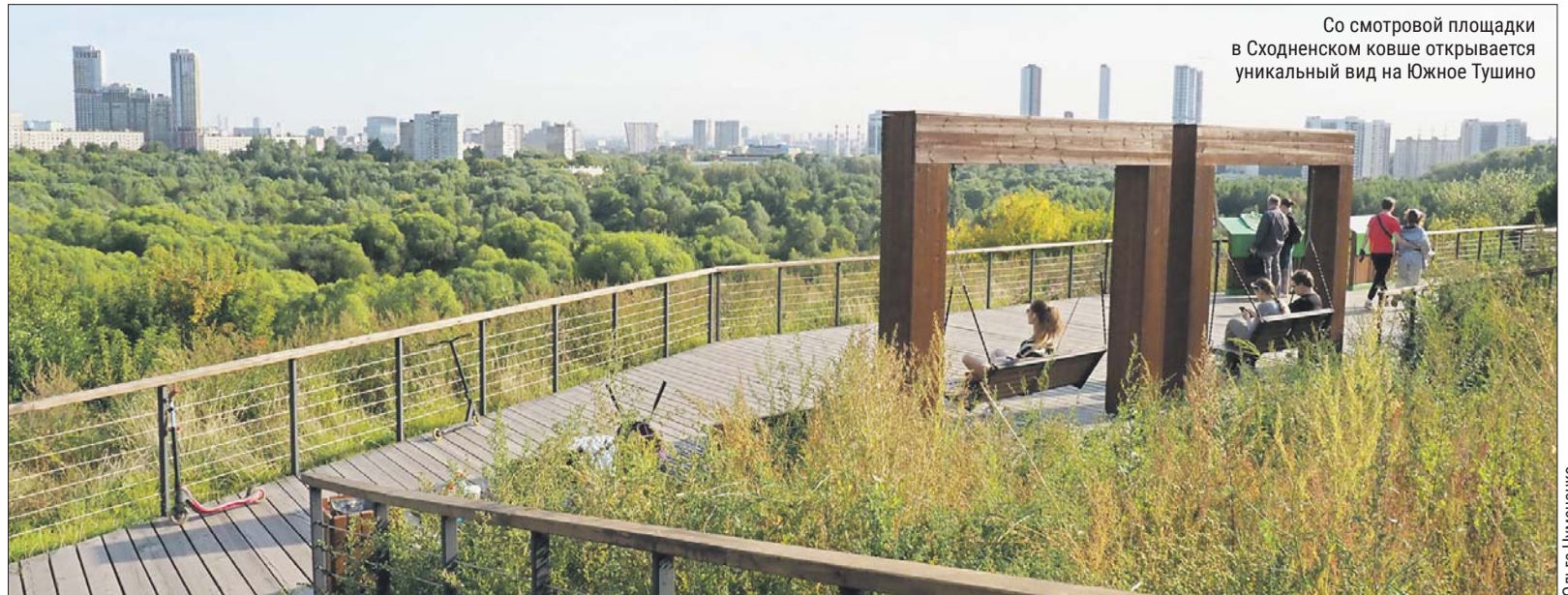
Со смотровой площадки в Сходненском ковше открывается уникальный вид на Южное Тушино

Интересные подробности об истории района можно узнать на экскурсии