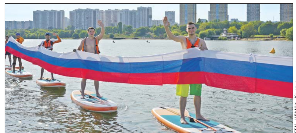
Знаменосцы встали на сапборды

— Участники сделали маленький флаг России, писали письма солдатам, изготовили армейский «сухой душ», научились оказывать первую медицинскую помощь, — рассказыва-