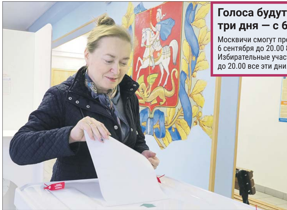
Москвичи старшего поколения часто предпочитают голосовать по старинке. Такая возможность сохранится

Как сообщает пресс-служба мэра и Правительства Москвы, получить бумажный бюллетень можно только на участке по месту постоянной регистрации.