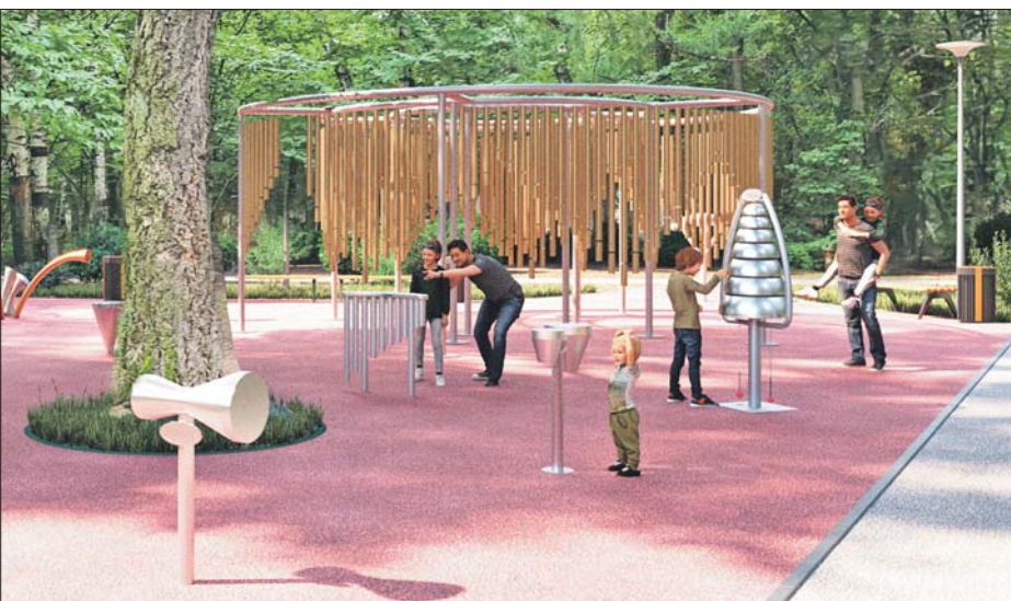
Пресс-служба префектуры СЗАО

В парке можно будет отдохнуть, и поиграть на детских площадках