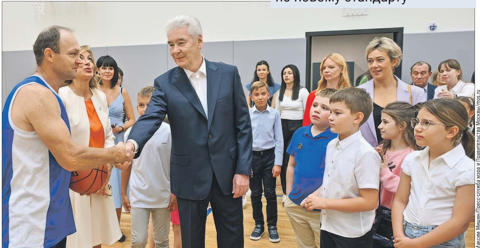
Оборудовали три новых зала — спортивный, гимнастический и хореографический. Мэр побывал в одном из них

Здесь отремонтировали фасад и кровлю, заменили окна, коммуникации и обновили внутреннюю отделку, установили новую