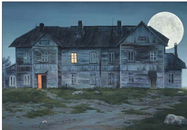
Работа «Дом» была написана на Соловках