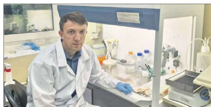
Пресс-служба НИЦ эпидемиологии и микробиологии им. Н.Ф.Гамалеи