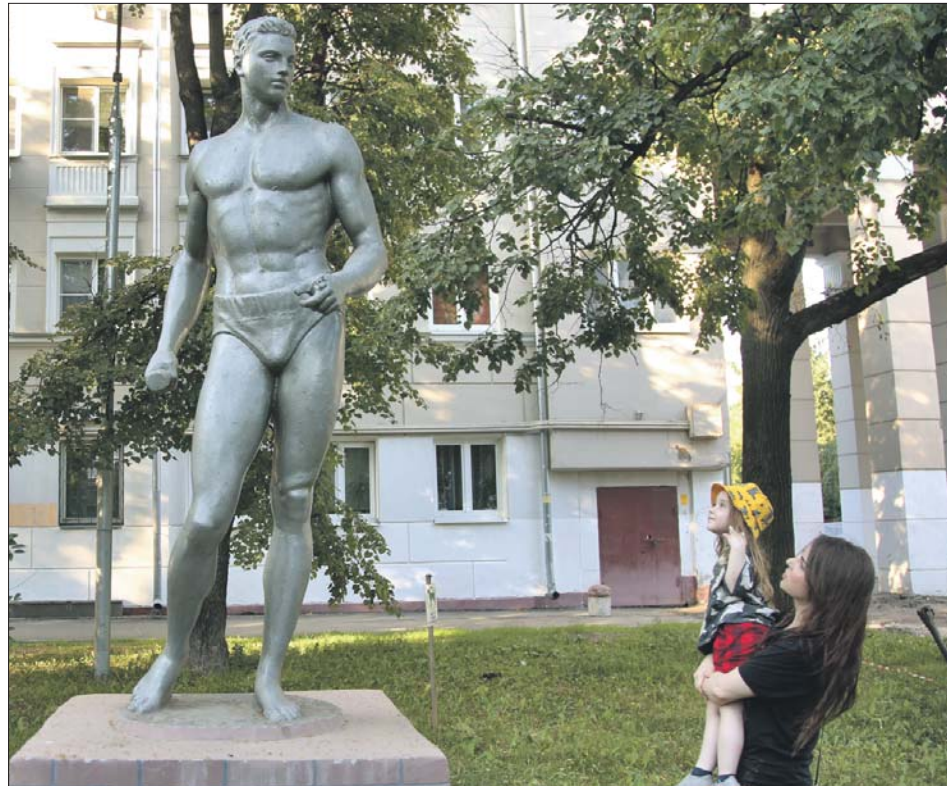
Эта статуя была установлена в бывшем военном городке в Щукине в 1930-х