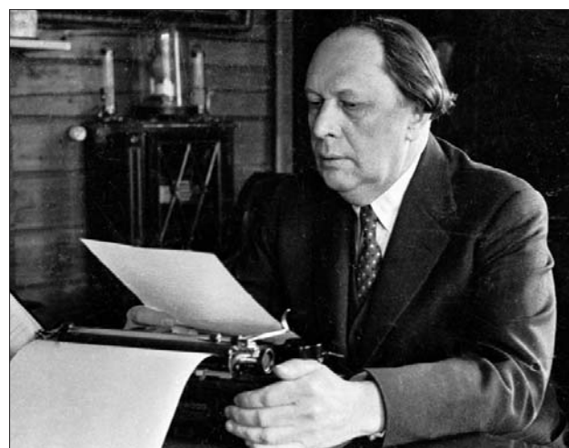
Алексей Толстой за работой, 1940 год

До последних дней жизни Толстой писал в «Красную звезду»