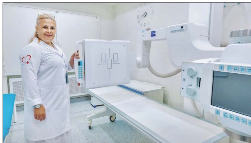
Телеграм-канал мэра Москвы Сергея Собянина t.me/mos_sobyainin

формационный сервис ЕМИАС, где их сразу видят врачи-рентгенологи. Пациент же может посмотреть изображения и описания исследований в электронной медкарте, — написал мэр. — Единый контур повышает качество и скорость диагностики и позволяет начать внедрение в практику столичных врачей современных сервисов на основе искусственного интеллекта».