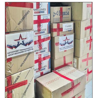
Груз группы «Автопробег солидарности с ВС РФ» готов к отправке