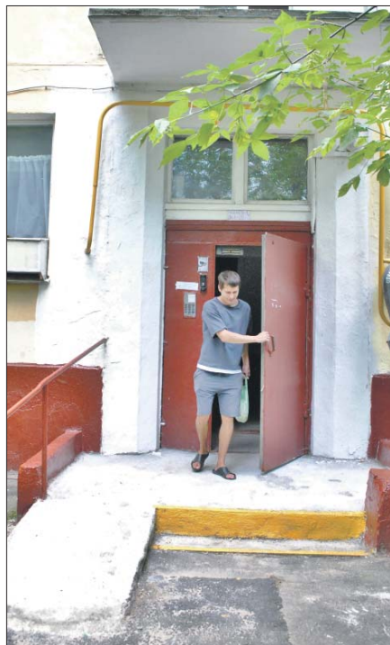
Сейчас крыльцо исправно

Управа района Хорошёво-Мнёвники: ул. Народного Ополчения, 33, корп. 1, тел. (499) 192-2556. Эл. почта: szao-hormn@mos.ru . ГБУ «Жилищник района Хорошёво-Мнёвники»: Карамышевская наб., 12, корп. 1, тел. (499) 191-4086. Эл. почта: info@dez-hm.ru