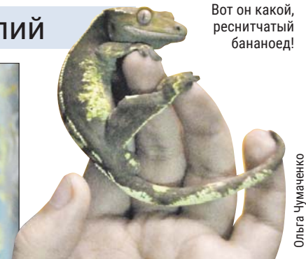
Вот он какой, реснитчатый бананоед!