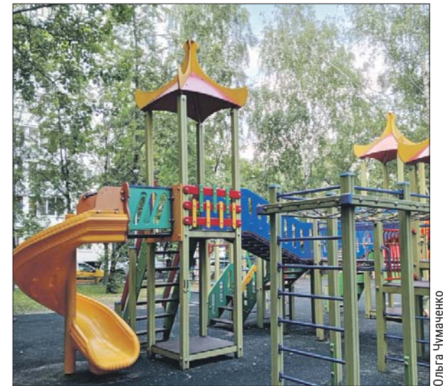
Площадку очистили от мусора, горки промыли

ГБУ «Жилищник района Строгино»: ул. Маршала Катукова, 9, корп. 3, тел. (495) 758-3822. Эл. почта: gbu-strogino@mail.ru