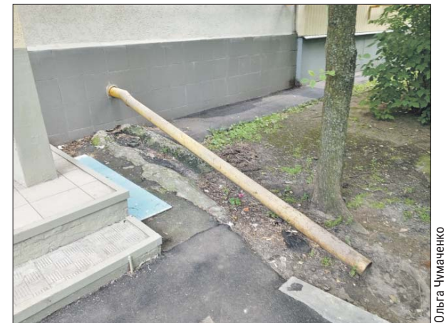
Сейчас вода отводится на газон