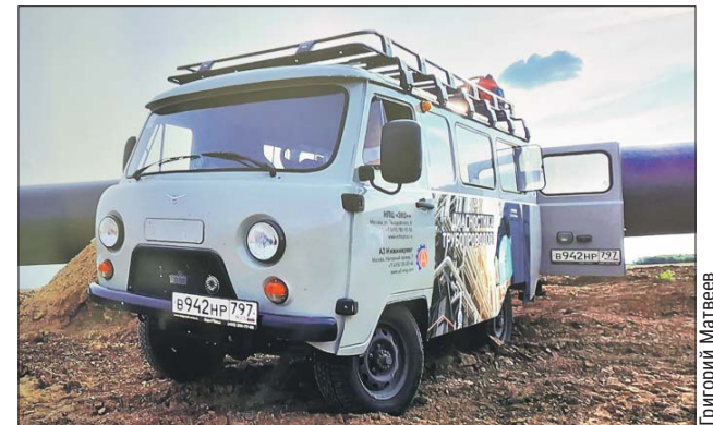
В этой «буханке» разместилась целая лаборатория

— Я даже пошёл на рискованный шаг: продал свою