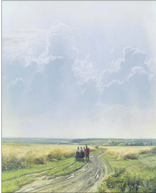
Картина «Полдень. Окрестности Москвы» была написана через три года после создания этюда в Братцеве

Мокрицкий, он хотел и доставить удовольствие Третьякову, и самому не остаться в убытке: «Потому что вещь в самом деле прекрасная и достойная украшать любой альбом».