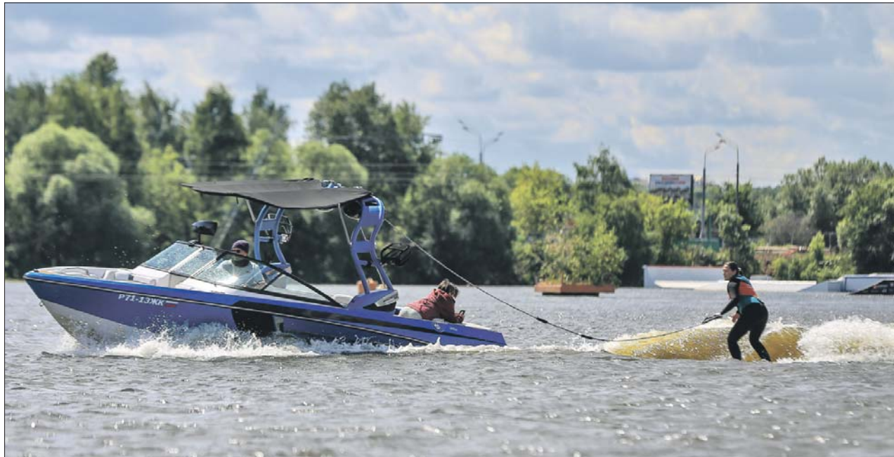
Компания едет мало того что по судовому ходу, так ещё и против течения. А это всё равно что езда по встречке