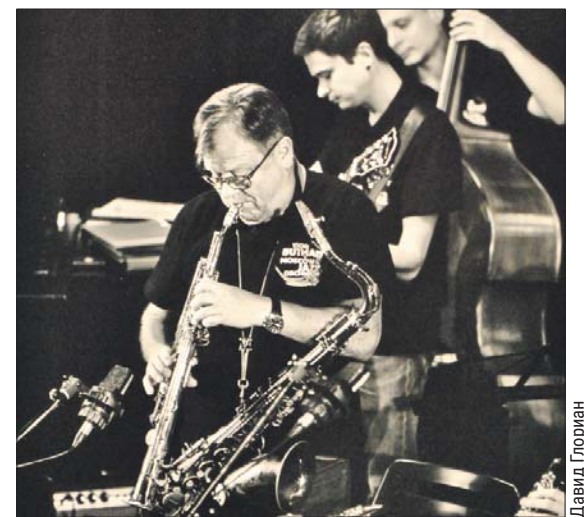
Все фотографии были сделаны на разных площадках в прошлом году

Галерея «Тушино»: бул. Яна Райниса, 19, корп. 1. Выставка работает ежедневно с 11.00 до 20.00 до 4 августа. Цена билета — 100 рублей, льготного — 50 рублей