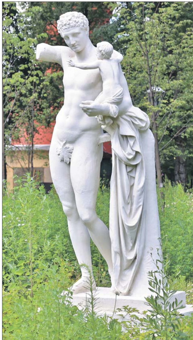
Скульптура «Гермес с младенцем Дионисом» появилась в парке в 1910-х годах