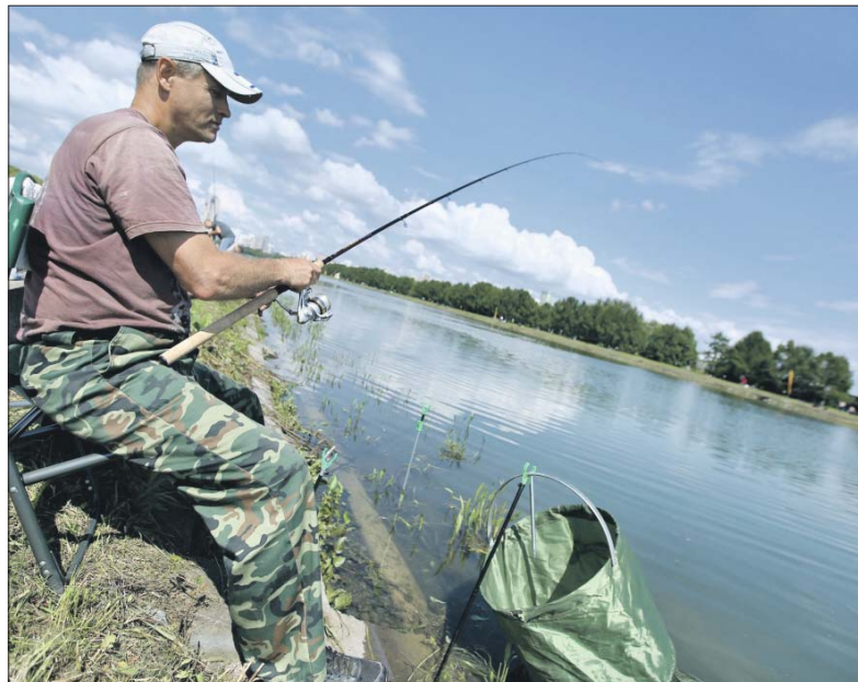
Сегодня в Москве-реке ловятся (сверху вниз на снимках справа) плотва, лещ, окунь, уклейка, судак

— Вплоть до XX века в реку сбрасывались сточные воды и нечистоты со всего города. Исторические документы свидетельствуют, что вода была мутной и меняла цвет до свинцово-чёрного, — рассказывает Заев. — Загрязнённость была такой сильной, что в центре города не водилась рыба и обычные реч-