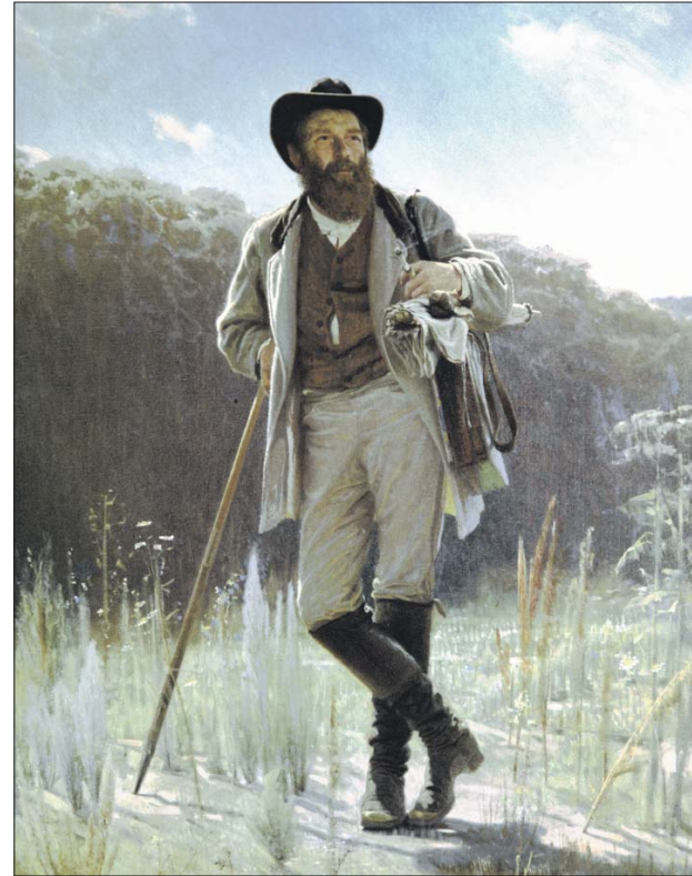
Иван Крамской. «Портрет художника И.И.Шишкина», 1873 год

Откровенно восхищался Шишкиным во время его