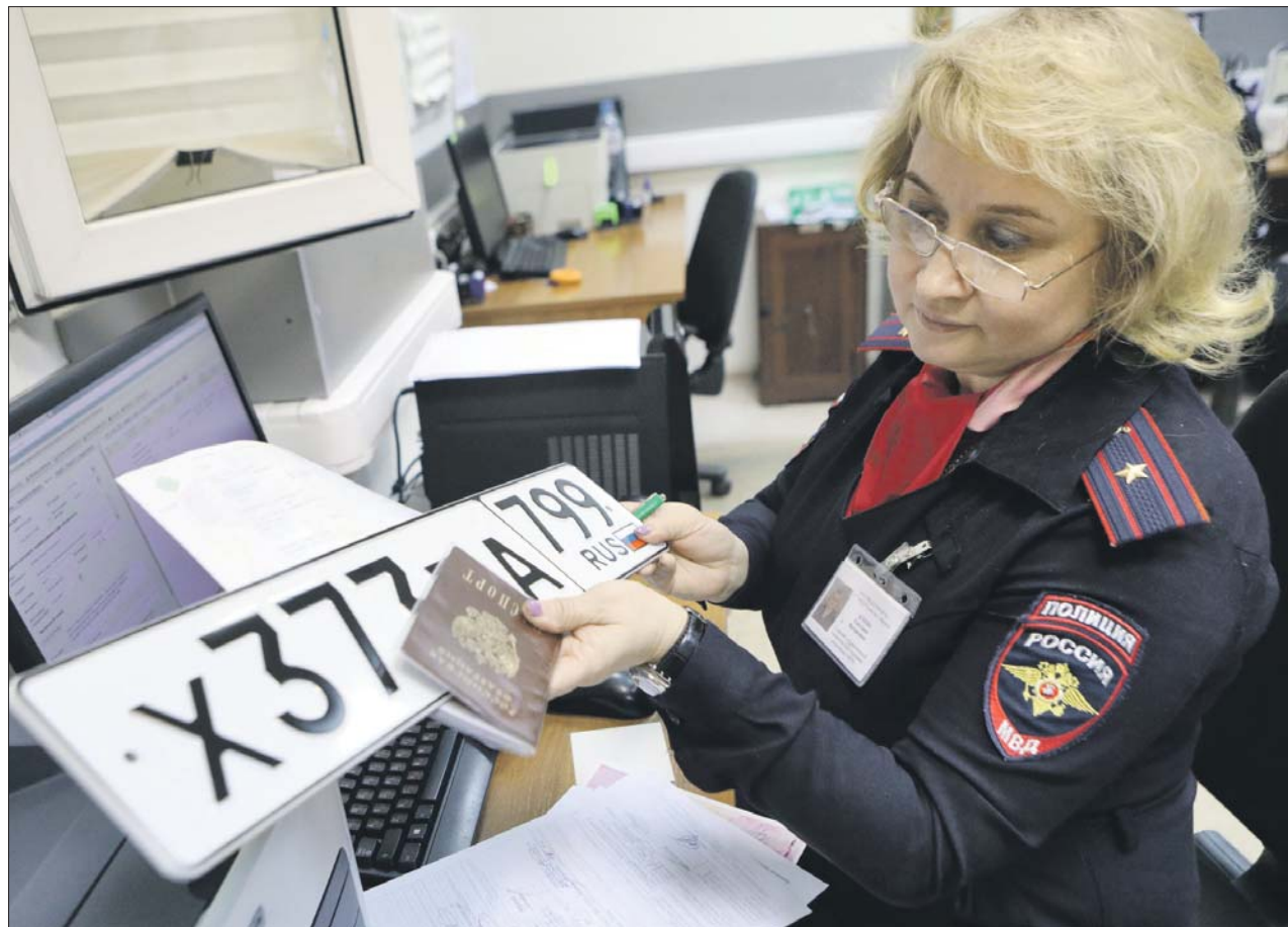
Нововведение снизит нагрузку на сотрудников ГАИ при проверке документов

Штраф за поездку без полиса — 800 рублей. А если устроите аварию, готовьтесь к гораздо большим