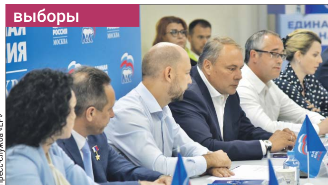
Пётр Толстой: «Мы все — команда мэра Москвы»