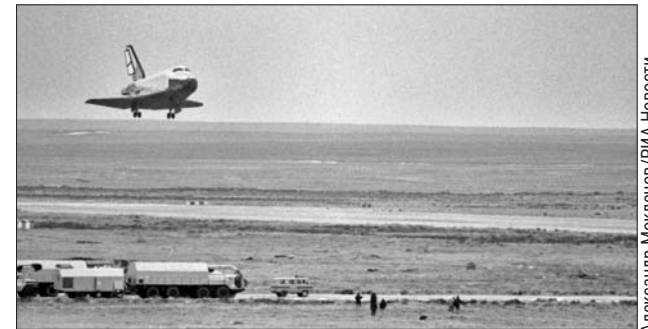
Полёт «Бурана». Ноябрь 1988 года

— «Буран» запустили с космодрома Байконур с по-