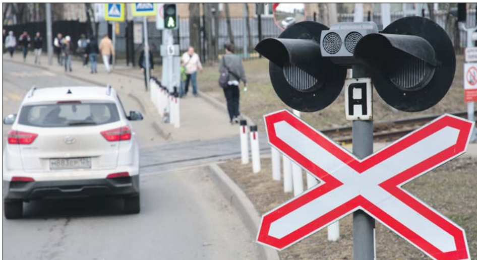
При приближении поезда на светофоре загорается красный свет, а система просигнализирует, если на путях препятствие

За железнодорожными путями в районе Щукино теперь следит система видеоконтроля нового поколения