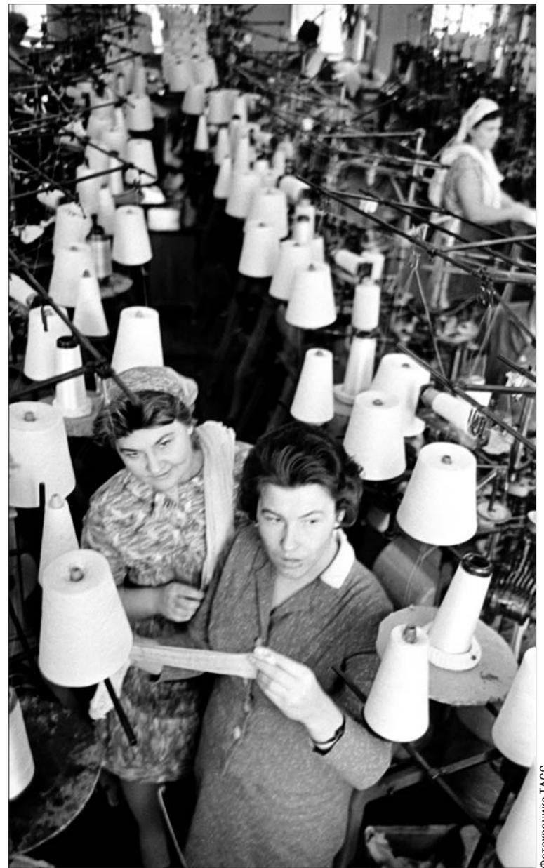
1965 год. Сотрудники предприятия за работой

Например, в одном из кадров художественного фильма 1930 года «Наши девушки» о женской бригаде токарей можно увидеть белые носки — ещё без резинки, с рыхлыми складками. А уже в конце 1930-х белые носки тонкой выработки, с оборочками были частью летнего женского наряда. В художественном фильме «Подкидыш» 1939 года, действие которого разворачивается на столичных улицах, их можно увидеть на ногах почти каждой москвички.