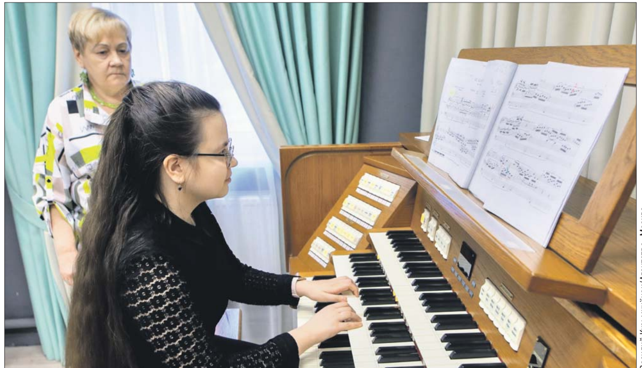
Урок в музыкальной школе им. С.М.Майкапара. Орган — один из самых сложных инструментов

В это трудно поверить, но освоить фетиш молодёжи — электро- и бас-гитару — можно тоже в музыкальной школе. Этому учат на эстрадно-джазовом отделении шукинского филиала детской музыкальной школы им. Я.В.Флиера. И оно очень популярно не только среди мальчиков, но и среди девочек!