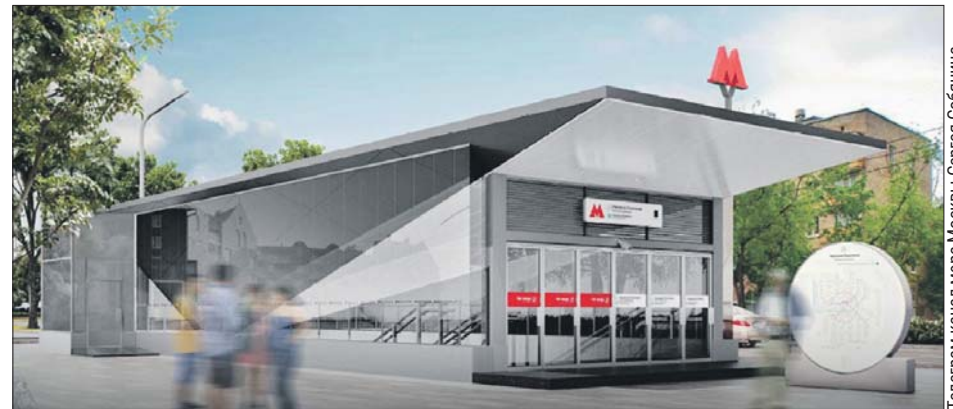
Так будет выглядеть павильон станции «Народное Ополчение»

Готовятся к прокладке тоннелей до «Бульвара Генерала Карбышева»