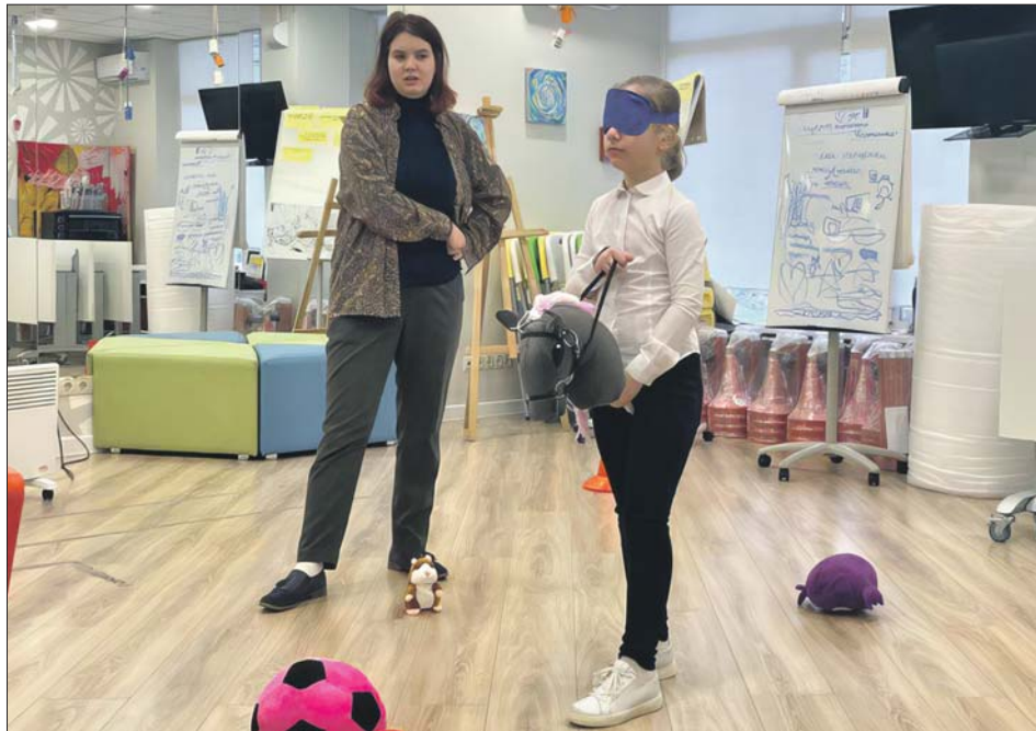
Занятия в центре раскрепощают ребят, развивают реакцию и умение ориентироваться в пространстве