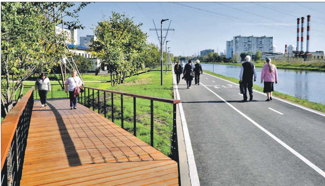
Между Западным и Восточным мостами Сходненского деривационного канала в прошлом году появился променада