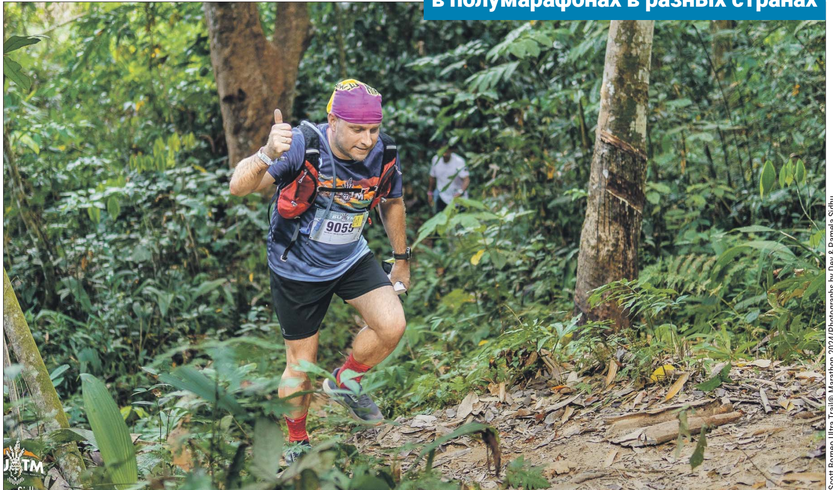
Scott Borneo Ultra Trail® Marathon 2024

— Я люблю путешествовать и как раз собрался поехать в Румынию. Вдруг меня осенило: а не проведут ли трейлы и там? Стал искать информацию и нашёл трейл как раз на нуж-