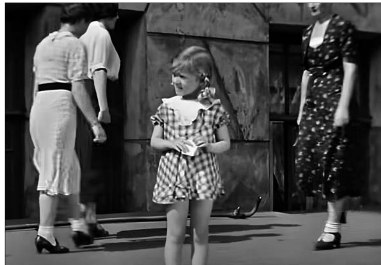
На кадре из фильма «Подкидыш» 1939 года хорошо видно, какой популярностью у дам пользовались белые носки

Достоверно неизвестно, каких цветов были первые носки и чулки Тушинской фабрики. Но белые носки выпускались в огромном количестве. Сначала их носили только спортсменки. Но вскоре они вошли в повседневный быт.