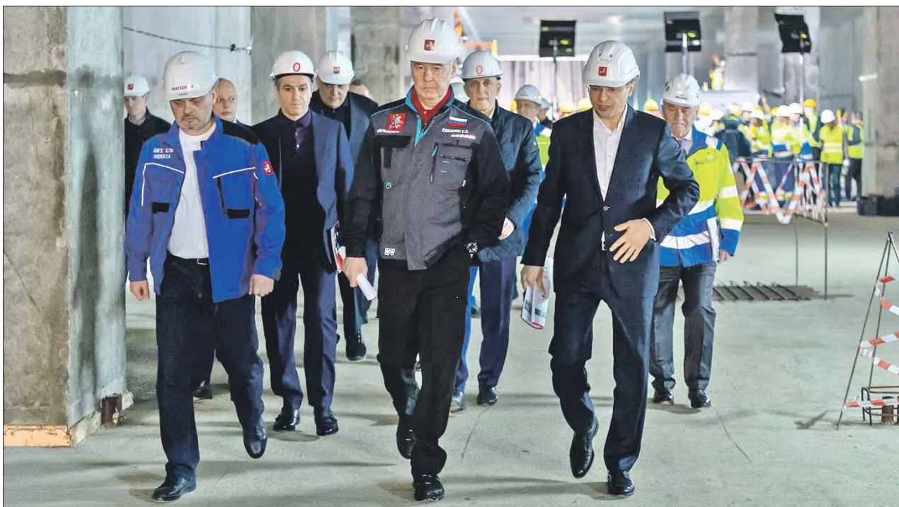
Сергей Собянин осмотрел станцию. Треть работ здесь уже выполнена

На станции установят турникеты с возможностью оплаты проезда банковской картой и по биометрии, автоматы по продаже билетов. Будет понятная навигация в едином стиле.