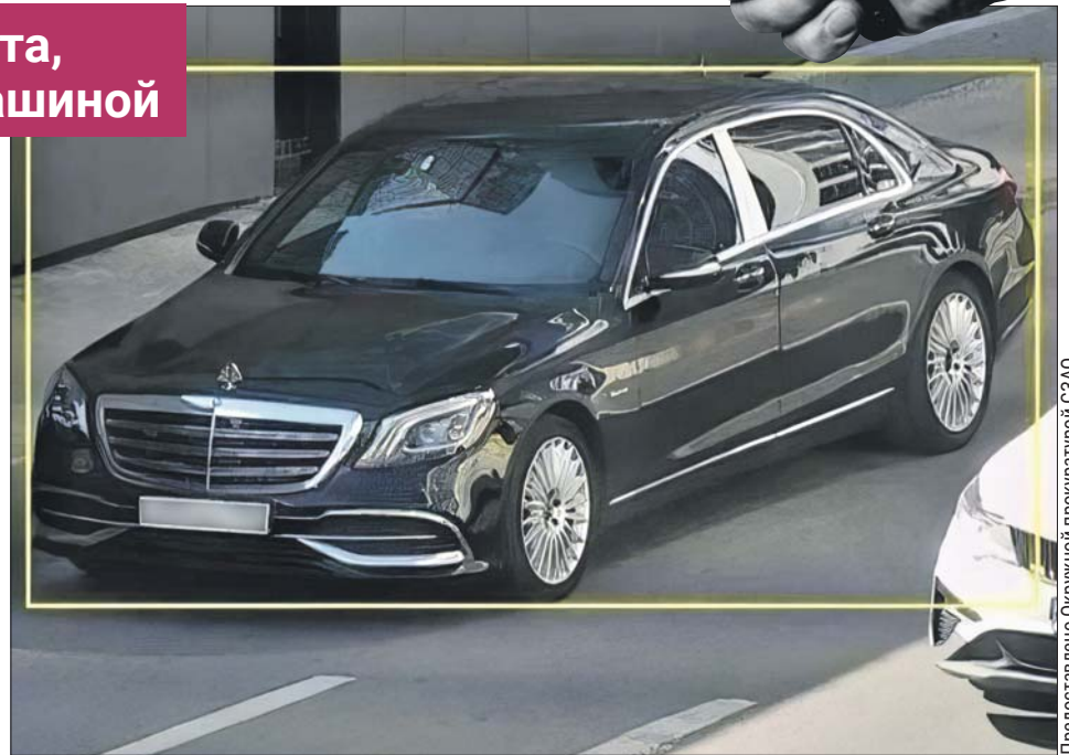
Тот самый автомобиль. Оперативная съёмка

Тем временем стало известно, что последний клиент таксиста купил билет на