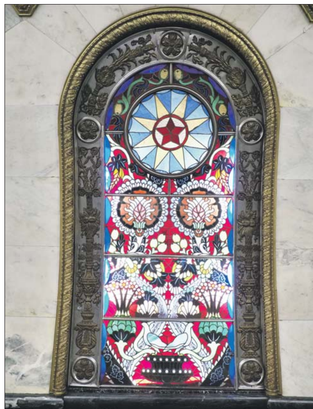
На станции «Новослободская» чеканка обрамляет витражи

«У художественной чеканки — большое будущее», — цитировала слова Рысина «Вечерняя Москва» в декабре 1951 года. — Она не только позволяет получить ясный и чёткий рисунок, но и даёт огромную