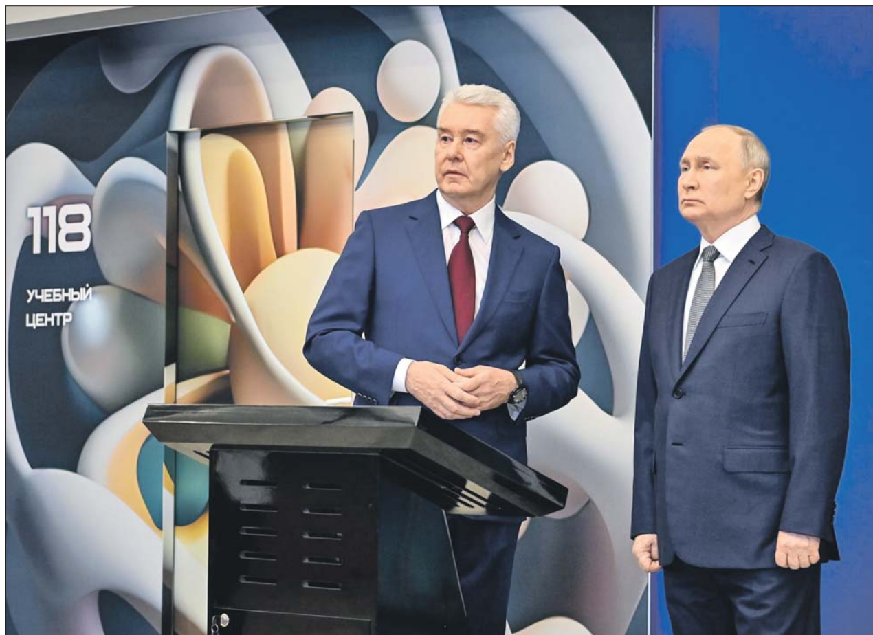
Президент и мэр побывали в Центре диагностики и телемедицины — одном из крупнейших в мире

Мэр рассказал Президенту, как меняется столичное здравоохранение