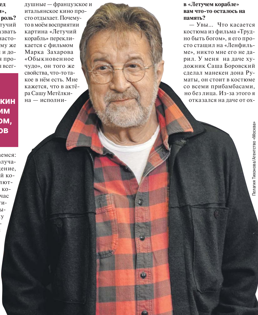
Пелагия Тихонова/Агентство «Москва»

Артист Саша Метёлкин станет таким же символом, как Абдулов