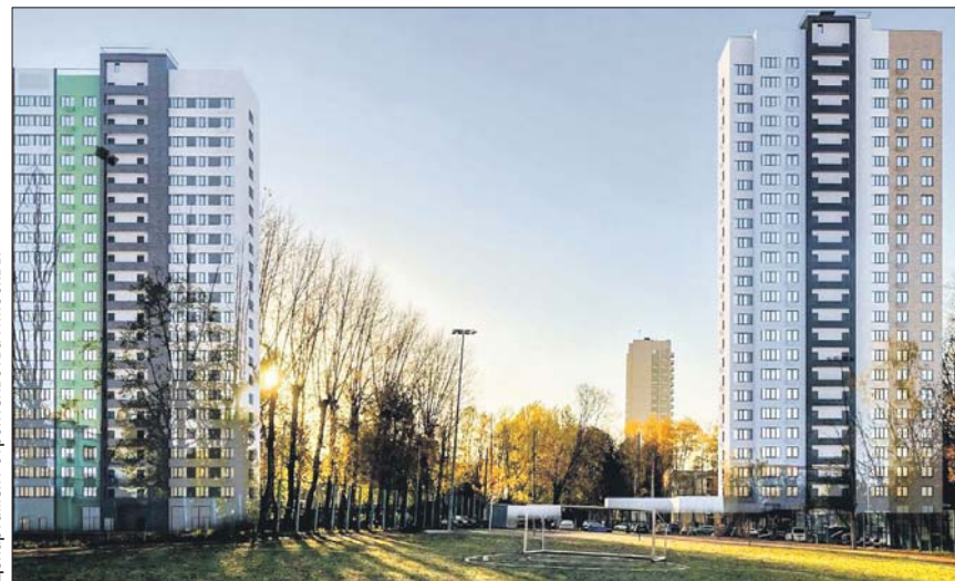
Департамент строительства г. Москвы