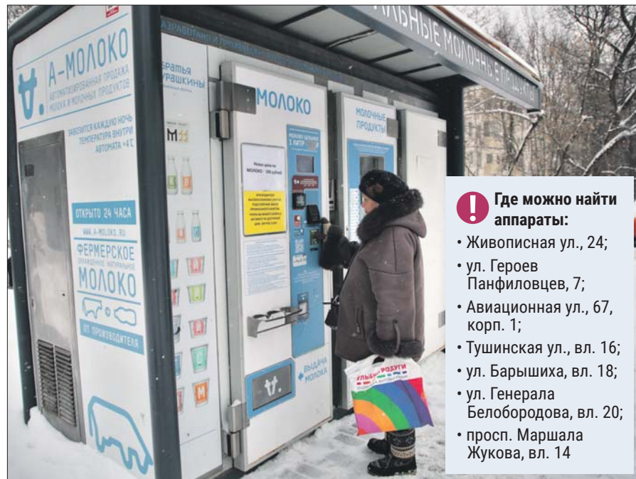
Молокомат на проспекте Маршала Жукова, владение 14. Горожане уже освоились с аппаратом