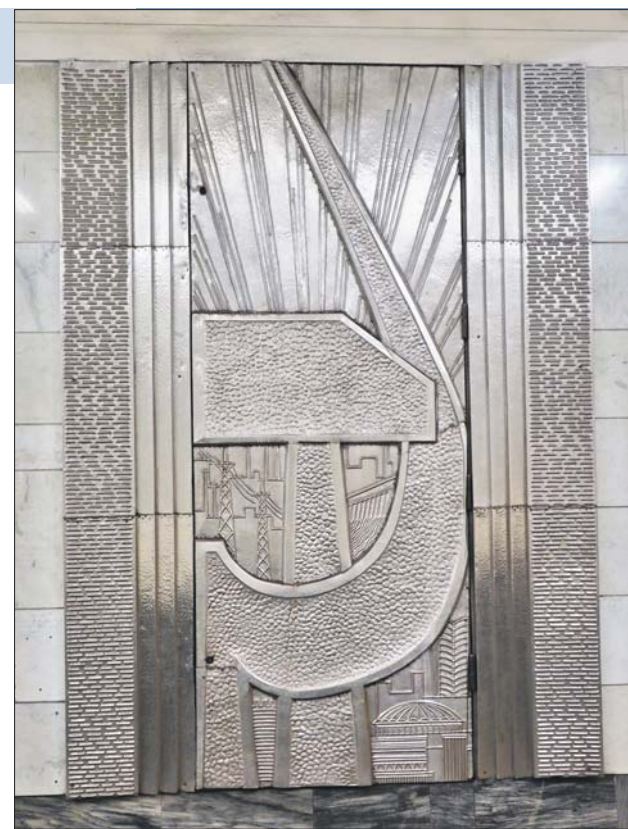
Панно на станции «Октябрьское Поле» посвящено 50-летию создания СССР

В 1941 году фашистская Германия оккупировала