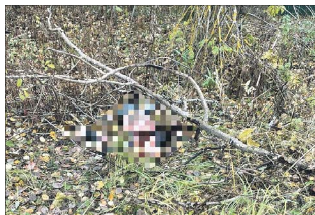
Всё произошло здесь. Оперативная съёмка

поезд до Сочи. В одном из отелей курортного города его и нашли в окружении девиц. На его лице и руках были глубокие ссадины, словно он с кем-то подрался. Когда молодому человеку сообщили, что найдено тело Михаила, он закричал в раже: «Да, это я завалил таксиста!» Позже, на допросе в Москве, он отказался от этих слов.