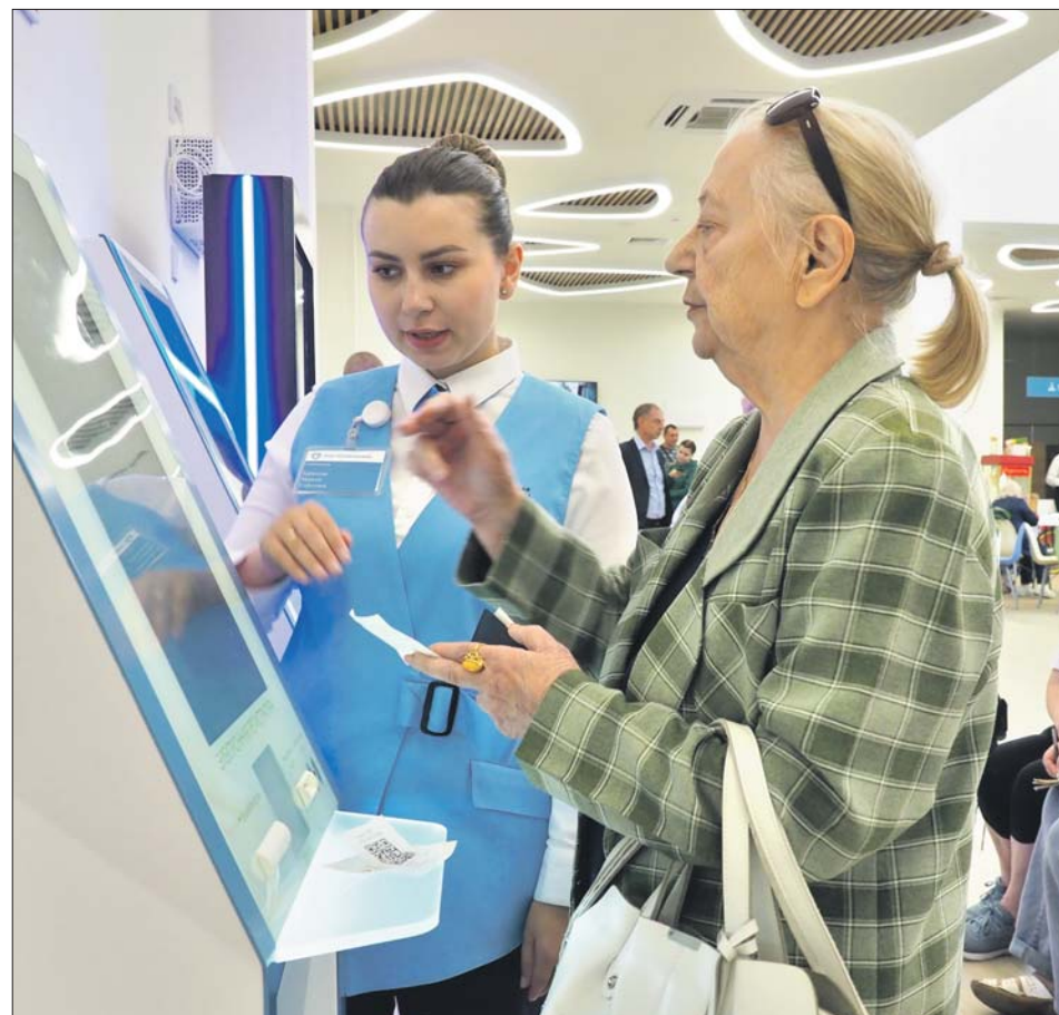
В 2023 году в районе Строгино открылась новая поликлиника, оснащённая по московскому стандарту