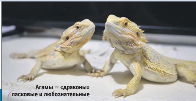
Агамы — «драконы» ласковые и любознательные