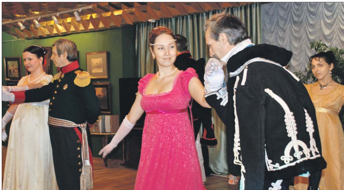
Так проходили исторические балы в прошлые годы

Балльные традиции в столице и провинциальных городах сильно различались