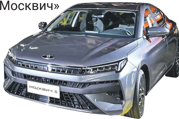
Так выглядит новая модель «Москвича»

В городе так резко набирать скорость не нужно. Однако на трассах необходимо. Когда обгоняешь грузовики, разогнаться машина должна быстро, иначе не