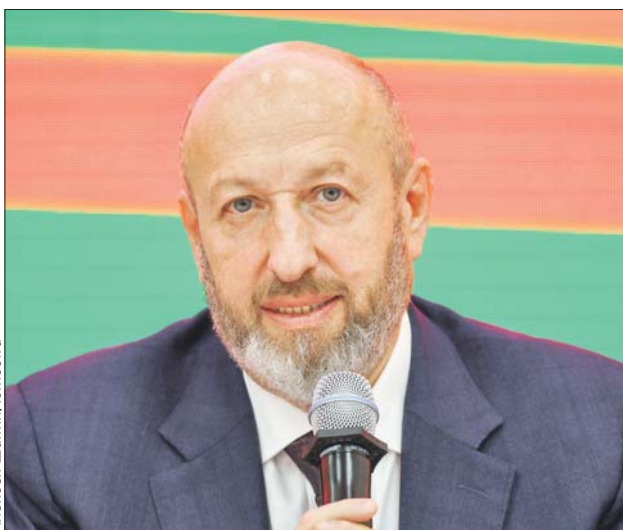
Алексей Мазус: опыт Москвы в борьбе с ВИЧ используют по всей России