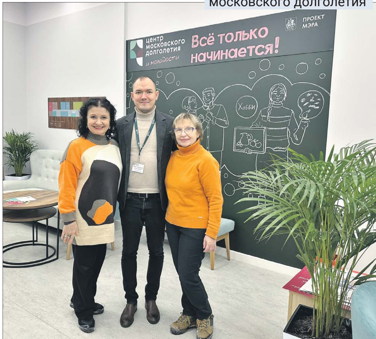
Центр московского долголетия «Северное Тушино» каждый день посещают не меньше 100 человек