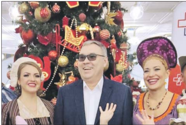
Ёлки традиционно посещают тысячи детей медработников

В канун Нового года профсоюз работников здравоохранения г. Москвы традиционно организовал новогодние ёлки для детей медицинских работников столицы.