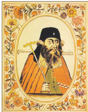
Патриарх Макарий оставил воспоминания об эпидемии