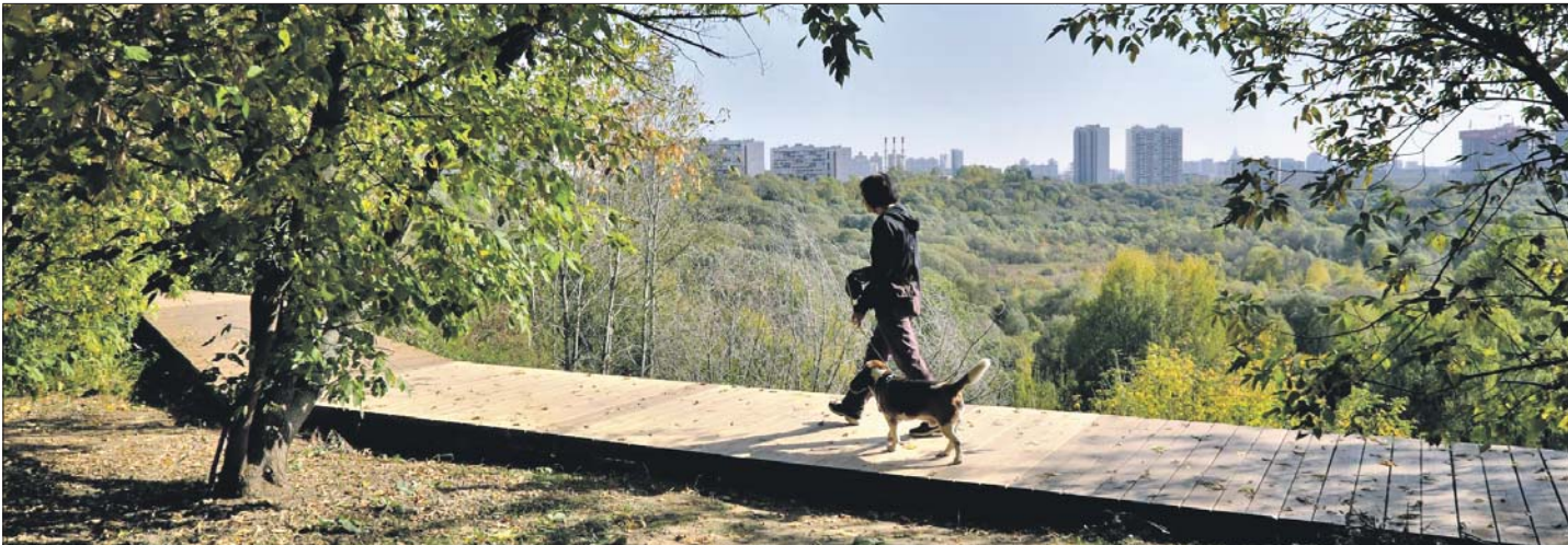
По природному амфитеатру в Южном Тушине теперь можно гулять с комфортом

Сайт мэра Москвы Сергея Собянина sobyainin.ru