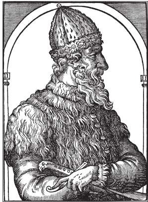
При Иване III необходимость в кружных путях к Великому Новгороду отпала

П ятницкое шоссе в древности было частью Волоцкой дороги. Она вела от Кремля через Всехсвятское до Волока Ламского (Волоколамск) и далее, в Великий Новгород. Это был один из старейших торговых путей Москвы. Большая часть Волоцкой дороги совпадает с нынешним Волоколамским шоссе.