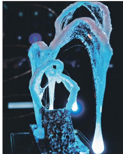
Инсталляция «Течение мыслей»

Место встречи: ул. Габричевского, 8 (холл библиотеки №234). Участие в экскурсии бесплатное. Обязательна запись по тел. 8-985-132-4565