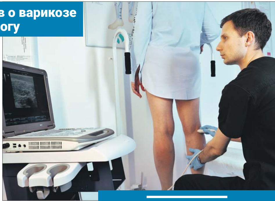
Чтобы не запустить болезнь, нужно при первых симптомах обратиться к флебологу

В основе варикоза — нарушение функции клапанного аппарата вен нижних конечностей. При этом кровь неполноценно оттекает от ног к сердцу, и возникают застойные явления. Визуально варикозная болезнь проявляется в виде звёздочек, сеточек, узлов. К