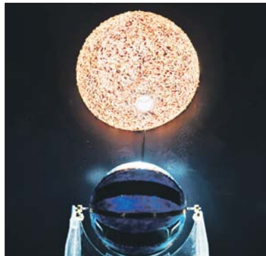
Мендосинский двигатель просто парит в воздухе

— Несколько картин посвящены открытию элементарной частицы — бозона Хиггса, — говорит художница. — Британский физик-теоретик Питер Хиггс ещё в 1964 году предположил, что в природе существует частица, которая отвечает за механизм появления массы у некоторых других элементарных частиц. Её даже окрестили «частицей Бога». В 2012 году, спустя некоторое время после запуска большого адронного коллайдера,