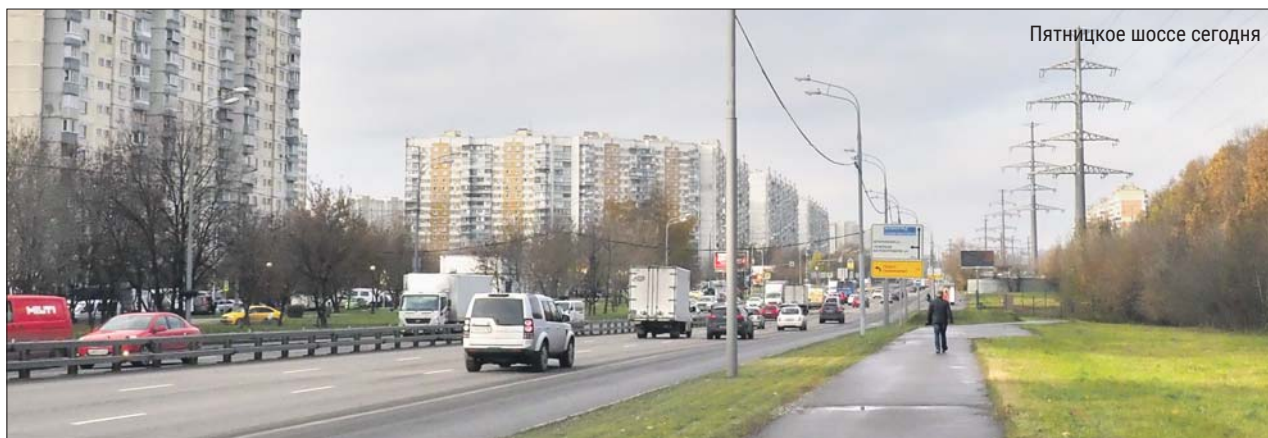
Пятницкое шоссе сегодня