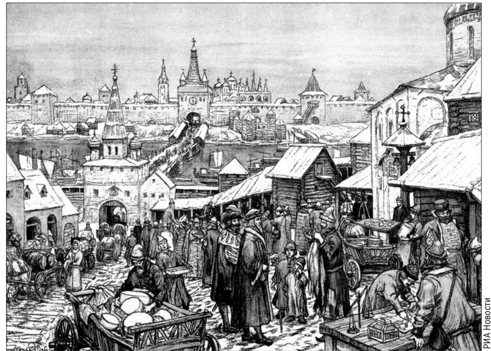
Новгородский торг. Картина Аполлинария Васнецова

По Волоцкой дороге тянулись караваны возов, нагруженных мехами соболей, волков, горностаев, белок — обычно они были сложены в бочки. «Меха эти добываются на севере и северо-востоке, но приво-