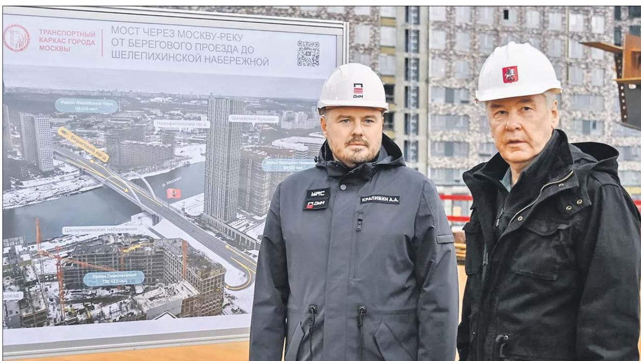
Мэр Сергей Собянин и гендиректор АО «Дороги и мосты» Алексей Крапивин на строительной площадке моста от Берегового проезда до Шелепихинской набережной