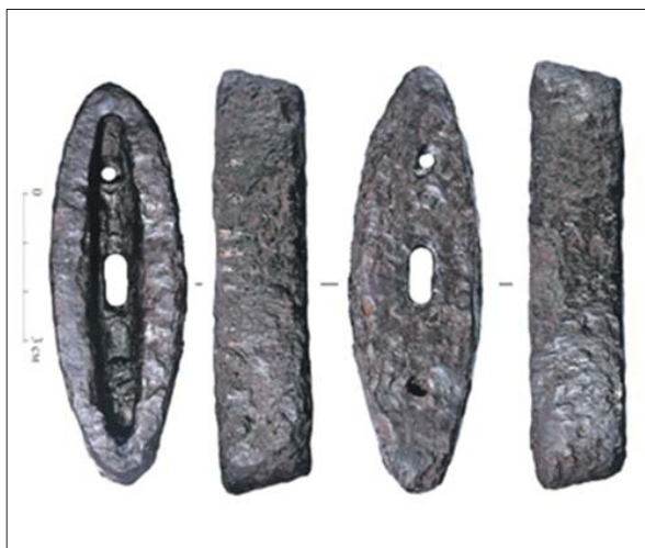
Основание навершия меча в разных ракурсах

— Один из них — с рукояткой, на основании которой под толстым слоем ржавчины еле просматривался рисунок из светлого металла, — рассказали в институте. — Для работы с хрупким артефактом мы использовали неразрушающие методы — нейтронную и синхротронную визуализацию и рентгенофлуоресцентное картирование. Это разновидности рентгеновских лучей.