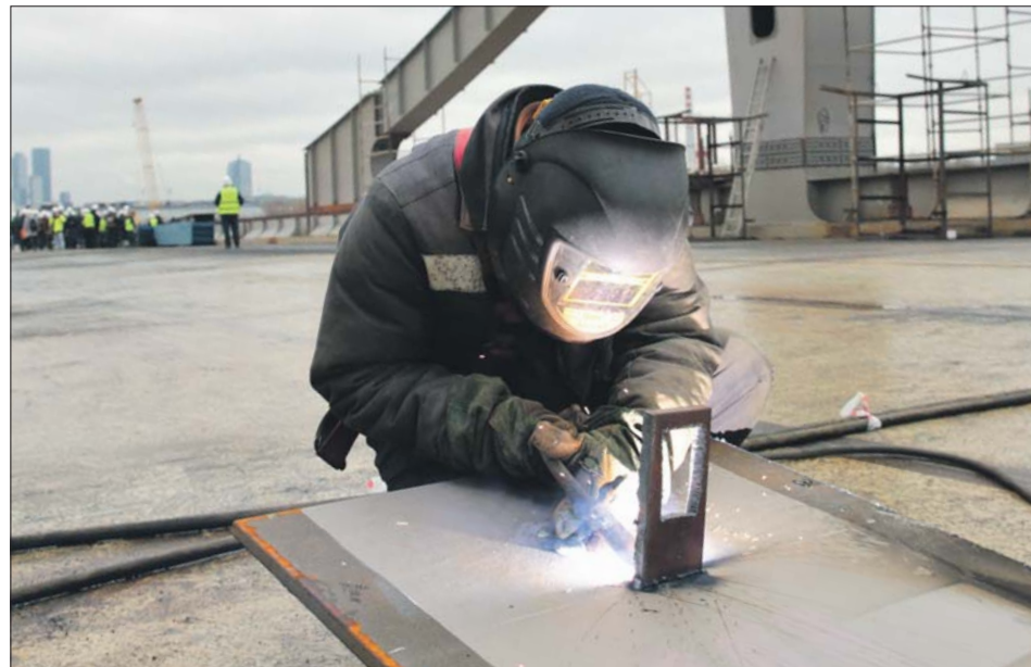
На другом изгибе реки строят мост от улицы Мяснищева в сторону станции метро «Мнёвники»

Помимо моста, на Шелепихинской набережной, уже на другом изгибе