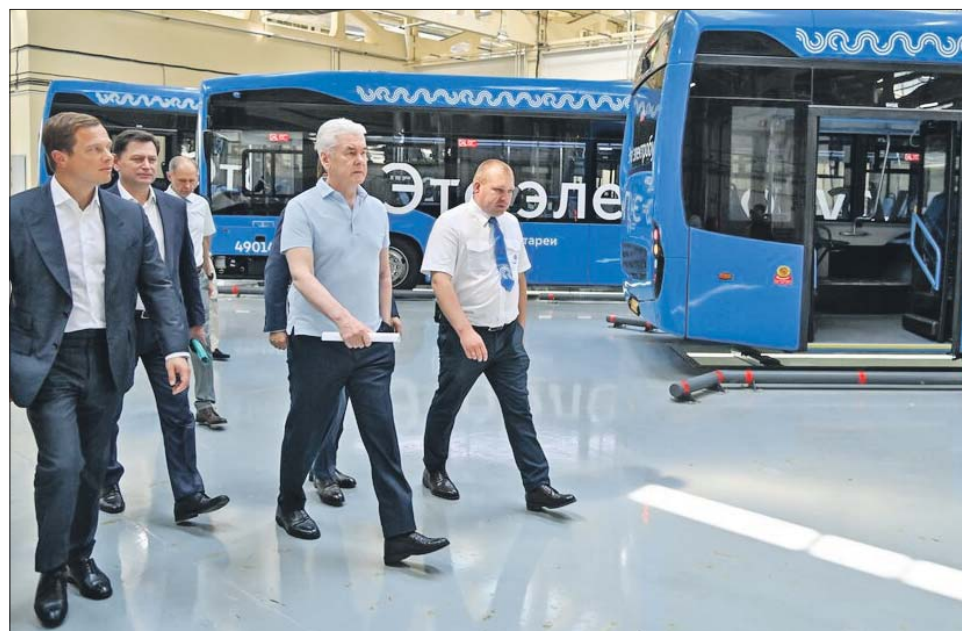
Сергей Собянин на открытии нового электробусного парка в Митине 7 июля этого года

«Бесшумные, экологичные, надёжные электробусы идеально подходят для такого динамичного мегаполиса, как Москва. Поэтому количество электробусных маршрутов будет только расти», — сообщил Собянин.