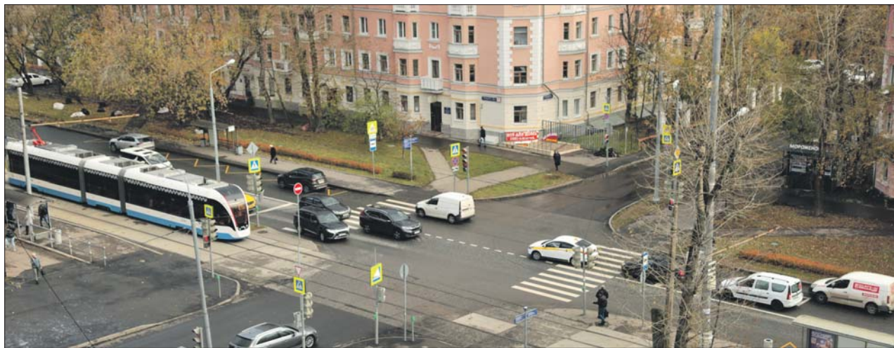
На перекрёстке Сходненской и Нелидовской улиц в этом году произошло уже пять столкновений, в которых было ранено пять человек

О самых аварийных участках на дорогах СЗАО рассказали в Центре организации дорожного движения