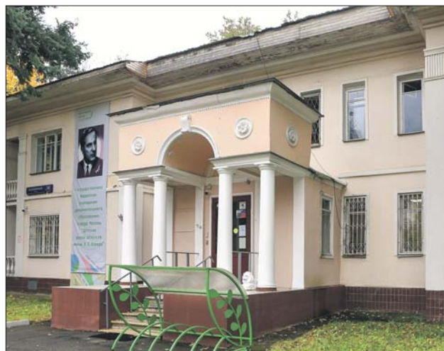
Здание музыкальной школы имени Я.В.Флиера на Родионовской улице