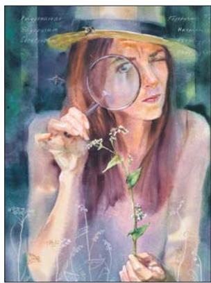
Работа Марины Трушниковой «Знакомая незнакомка»

Галерея «Тушино»: бул. Яна Райниса, 19, корп. 1. Цена билета — 100 рублей, льготного — 50 рублей