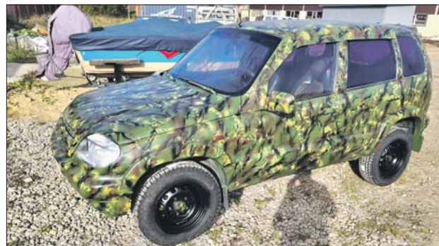
Машину купили на средства волонтеров