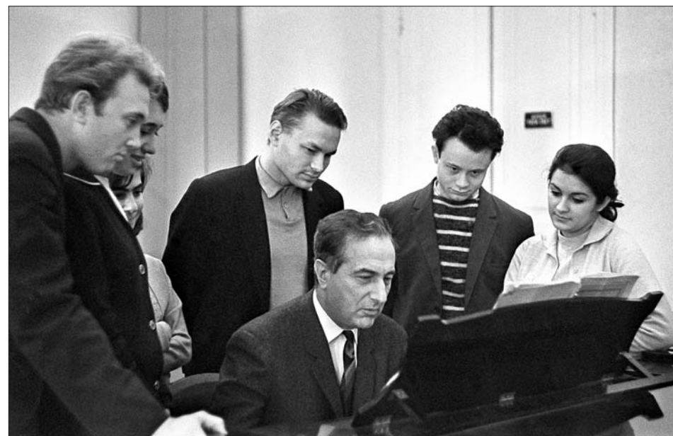
Профессор Московской государственной консерватории имени П.И.Чайковского Яков Флиер со своими студентами. Февраль 1967 года

С началом Великой Отечественной Яков Флиер, как и многие музыканты, стал членом фронтовой бригады: играл для бойцов действующей армии классические произведения и советские песни, сопровождал артистов. Сценой обычно служил грузовик,