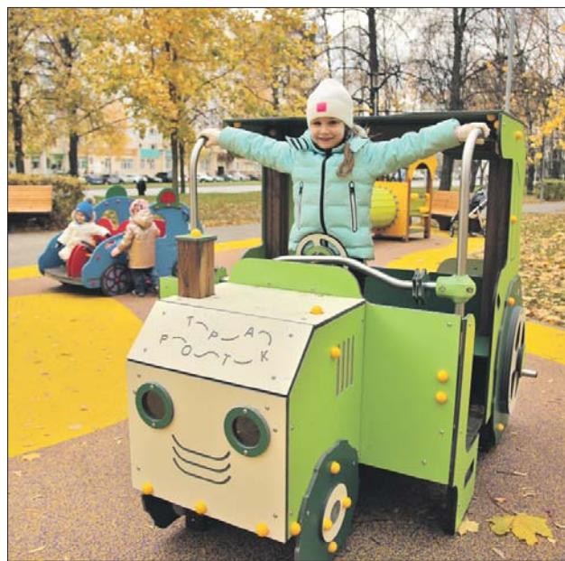
На бульваре Яна Райниса после благоустройства малышам есть чем заняться