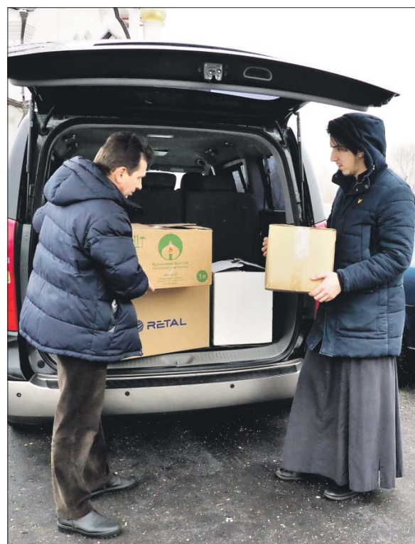
Идёт отгрузка гуманитарной помощи