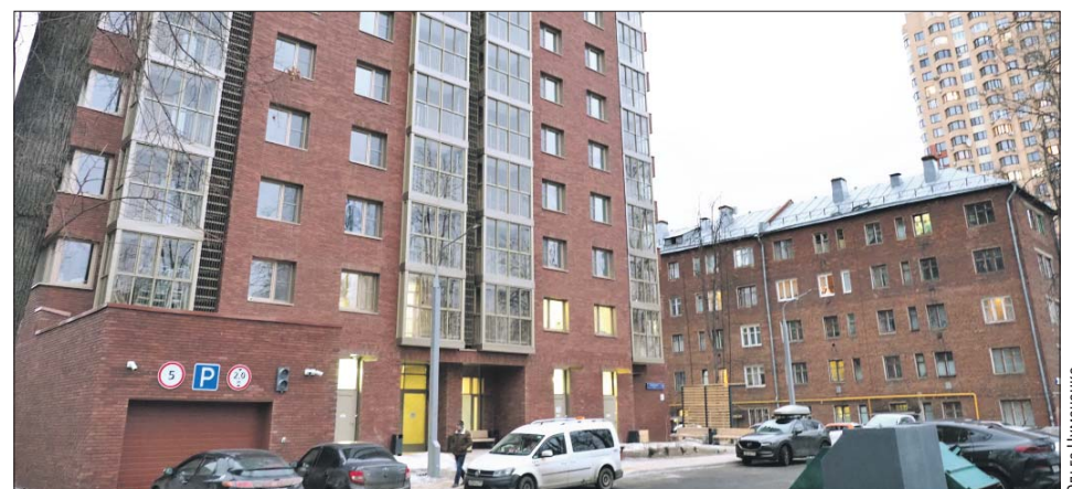
Дом построен по индивидуальному проекту