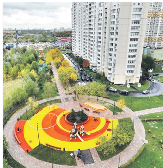
А так выглядит после благоустройства микрорайон 1А в Митине