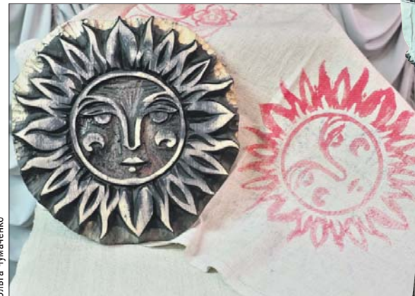
Набойная доска для нанесения рисунка на ткань

На выставке можно увидеть не только костюмы,