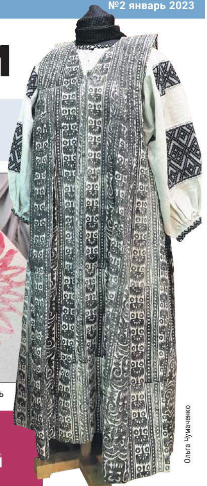
Сарафан повитухи из Вологодской области

— Сарафан воссоздан по рассказу правнучки пови-