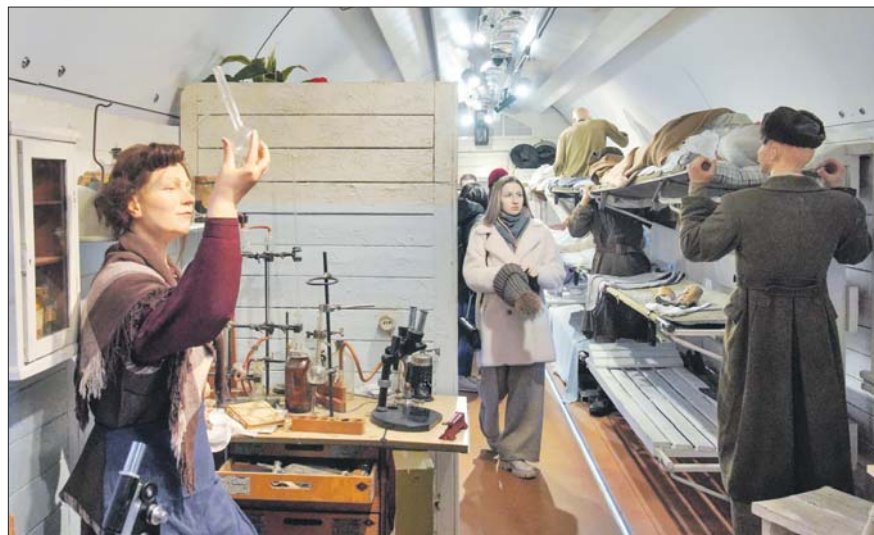
Выставка в движущемся поезде создаёт эффект погружения в события