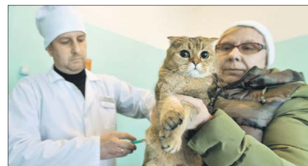
Вакцинировать от бешенства нужно не только собак, но и кошек

В феврале пункты будут работать в Митине, Строгино, Покровском-Стрешневом, Хорошёво-Мнёвниках,