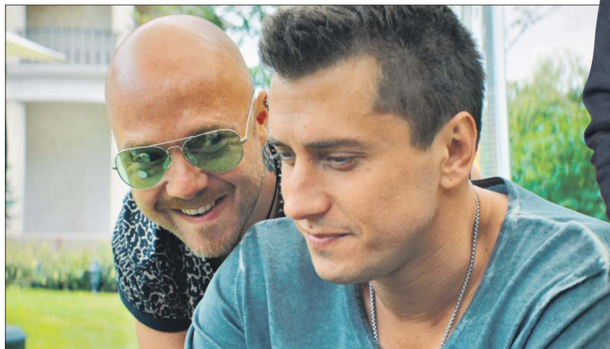
Сериал «Мажор» стал частью жизни актёра

— На экраны кинотеатров недавно вышел фильм «Слон», где вы играете главную роль. Ваш