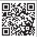
Все новости района: «Митинский экспресс»

Ландшафтный парк «Митино» вошёл в число лучших мест города для зимней фотосессии по версии туристического портала Discover Moscow и Мосгорпарка. Об этом со ссылкой на Телеграм-канал «Митино. Pro@mitino» сообщает интернет-издание «Митинский экспресс». Сделать селфи в парке можно на фоне светящихся инсталляций, арок, скульптурных ёлочных игрушек.