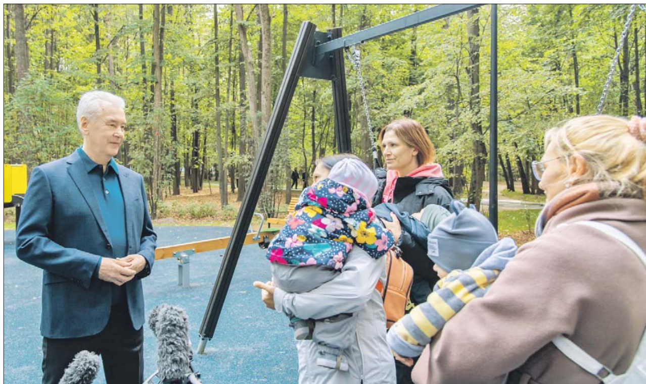
Сергей Собянин осмотрел работы по реабилитации Щукинского парка и Всехсвятской рощи в сентябре прошлого года и пообщался с горожанами