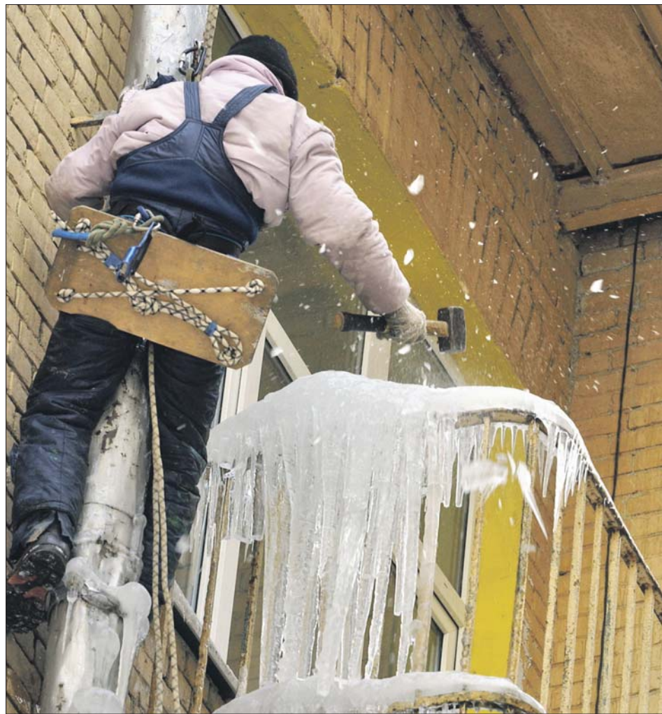
Если жителю трудно самому убрать налесь с балкона, он может обратиться за помощью в управляющую компанию

Состояние кровель и фасадов сотрудники коммунальных служб должны мониторить каждый день. А после снегопада удалять снег и налесь в течение двух суток: делают это промышленные альпинисты в спе-