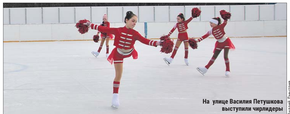
На улице Василия Петушкова выступили чирлидеры