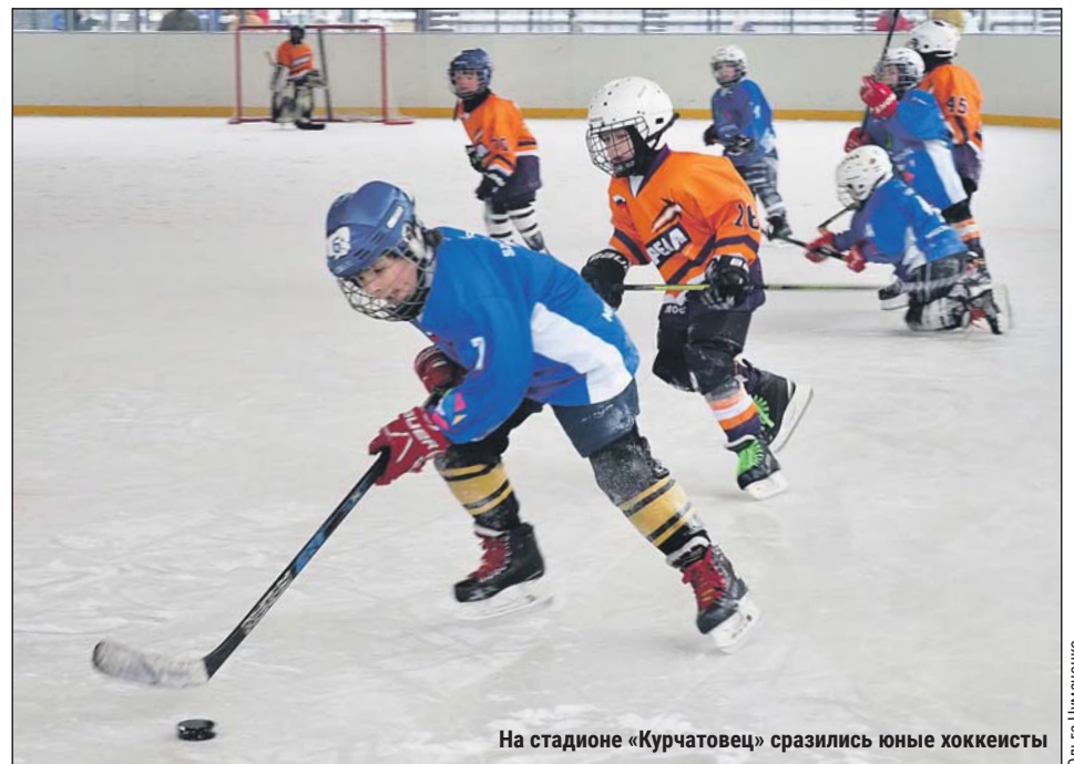
На стадионе «Курчатовец» сразились юные хоккеисты