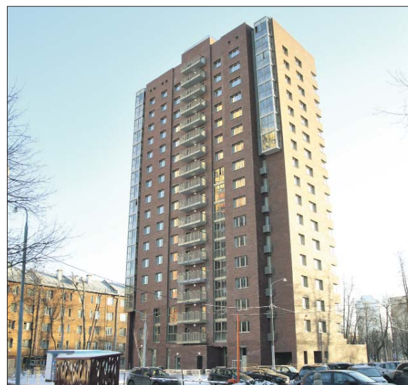
В здании один подъезд и 96 квартир