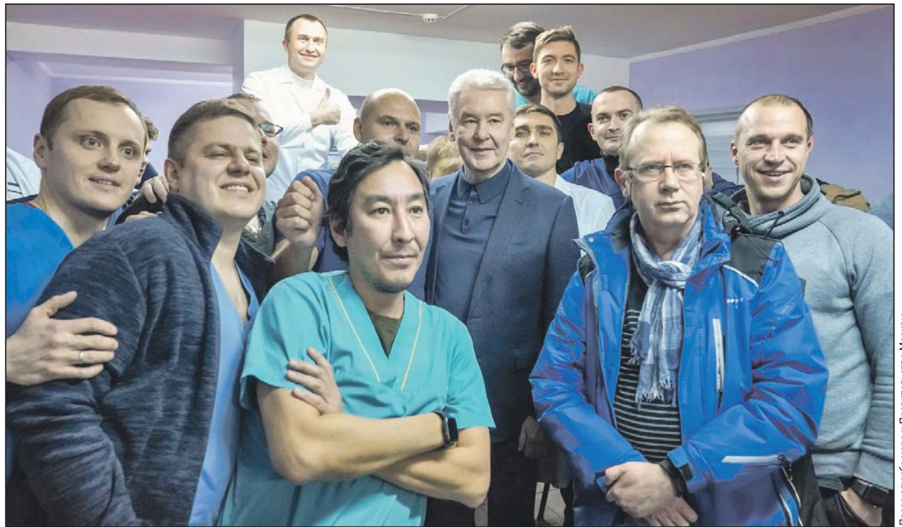
Сергей Собянин встретился 2 декабря с московскими врачами в Луганске

Пресс-служба мэра и Правительства Москвы