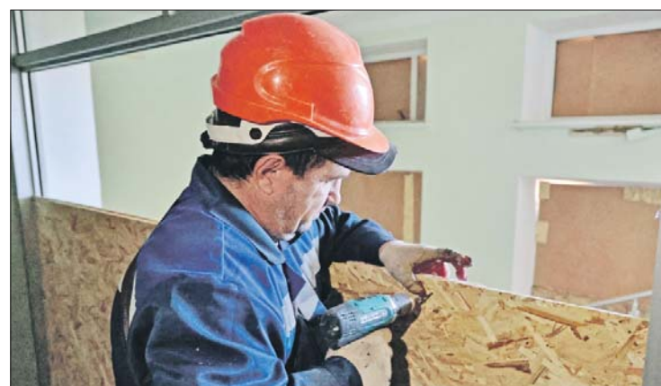
Рабочий закрывает окна администрации Донецка, пострадавшей от артобстрелов ВСУ, для сохранения теплового контура здания