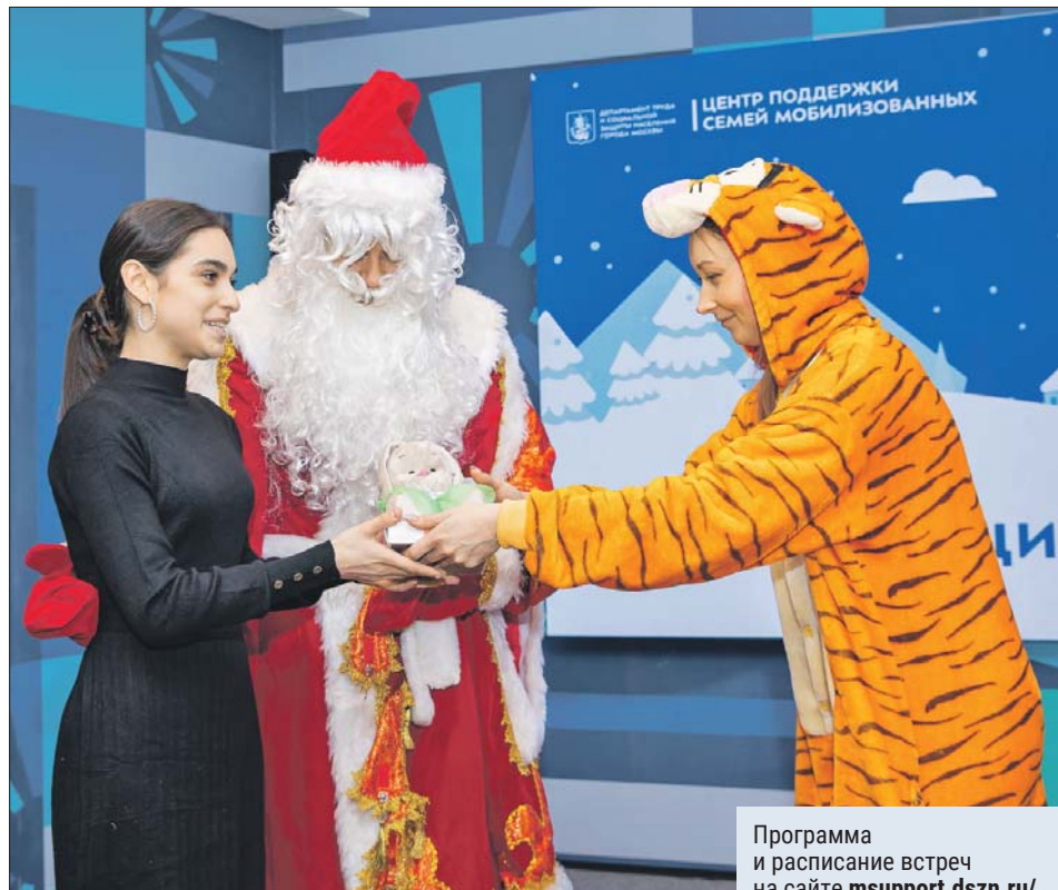
Департамент труда и социальной защиты населения г. Москвы

В сказочном почтовом ящике уже накопилось около 250 детских писем Деду Морозу