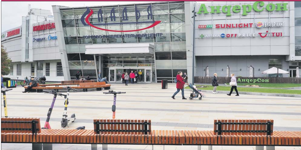
После реконструкции на площади появилось много скамеек

Этим летом в районе Митино комплексно благоустроена территория около местной станции метро. Все работы проводились по программе «Мой район». Об этом сообщили в управе района Митино.