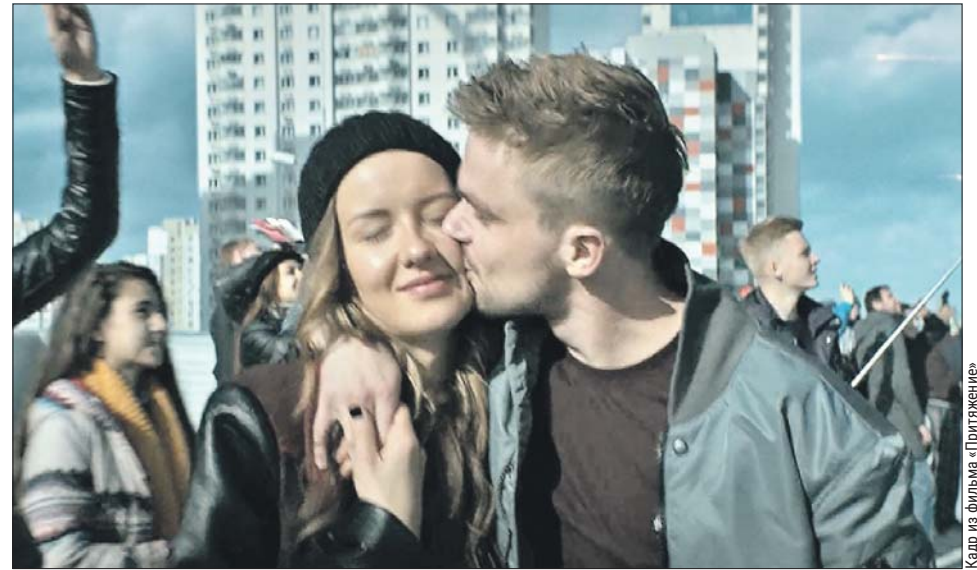
Ирина Старшенбаум и Александр Петров в фильме «Притяжение»