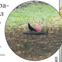
Это голубь в западне...

— В конце августа подобрал кота, который получил травму позвоночника от сильного удара. Его не слу-