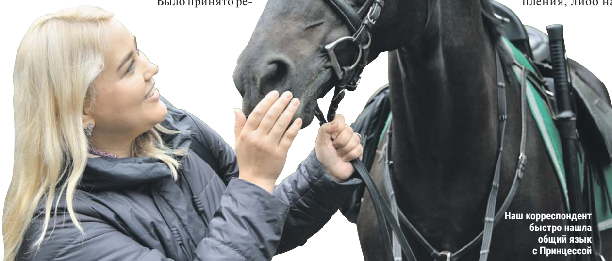
Наш корреспондент быстро нашла общий язык с Принцессой

Желающие поступить на службу в 1-й специальный полк полиции ГУ МВД России по г. Москве могут узнать подробности по тел. 8-926-326-4675 . Адрес: ул. Викторенко, 10