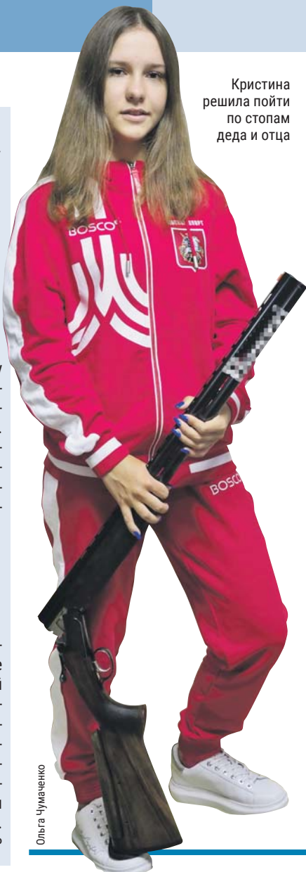
Кристина решила пойти по стопам деда и отца

20 сентября на Планерной улице горели четыре гаражных бокса. 33-летний мужчина делал в гараже ремонт, когда произошло короткое замыкание в электропроводке. Его срочно доставили в больницу с ожогами лица и рук. Пожар был оперативно ликвидирован. Ирма КОТИЯР