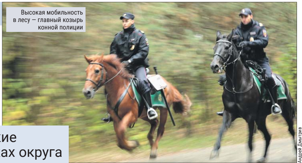
Высокая мобильность в лесу — главный козырь конной полиции

Корреспондент «СЗ» увидела, как полицейские на лошадях следят за безопасностью в парках округа