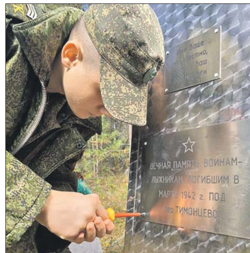
А ещё кадеты отремонтировали воинский обелиск, изуродованный вандалами