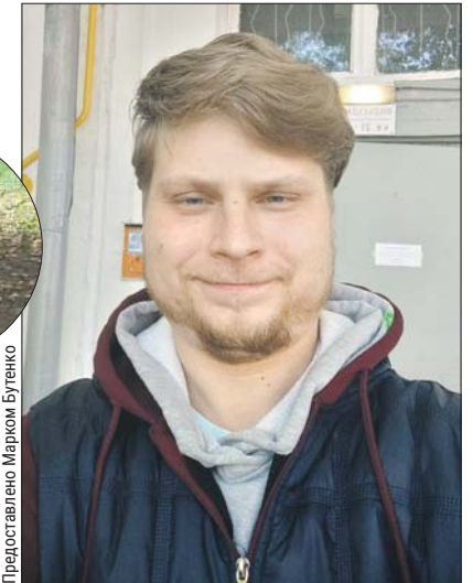
Предоставлено Марком Бутенко