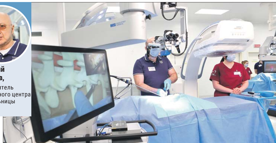
Прооперированные по новой методике пациенты уже через три-четыре недели включаются в привычный режим

абилитации. Год-полтора пациентам противопоказаны агрессивные физические нагрузки.