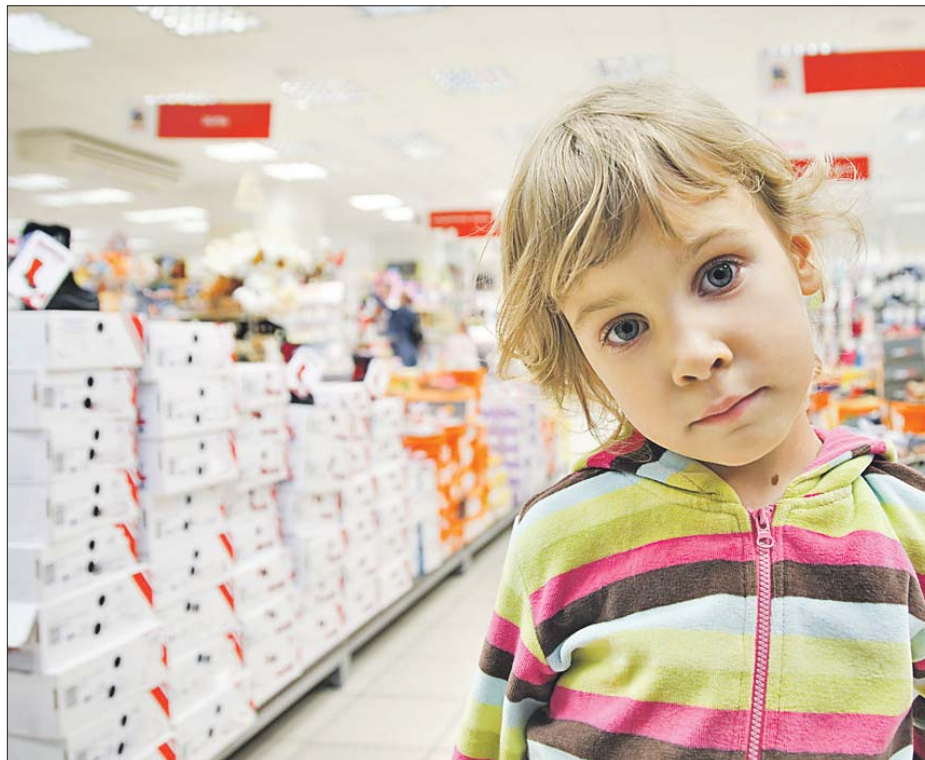
Не важно, какой фирмы детская обувь, главное — чтобы она была качественной и удобной

продаётся, пошита в Китае, Турции и России. Перебоев с поставками нет, качество не ухудшилось, и скидки хорошие, — объясняет работник торгового зала. И предлагает купить отличные дутые сапожки с натуральным мехом внутри всего за 1,6 тыс. рублей.