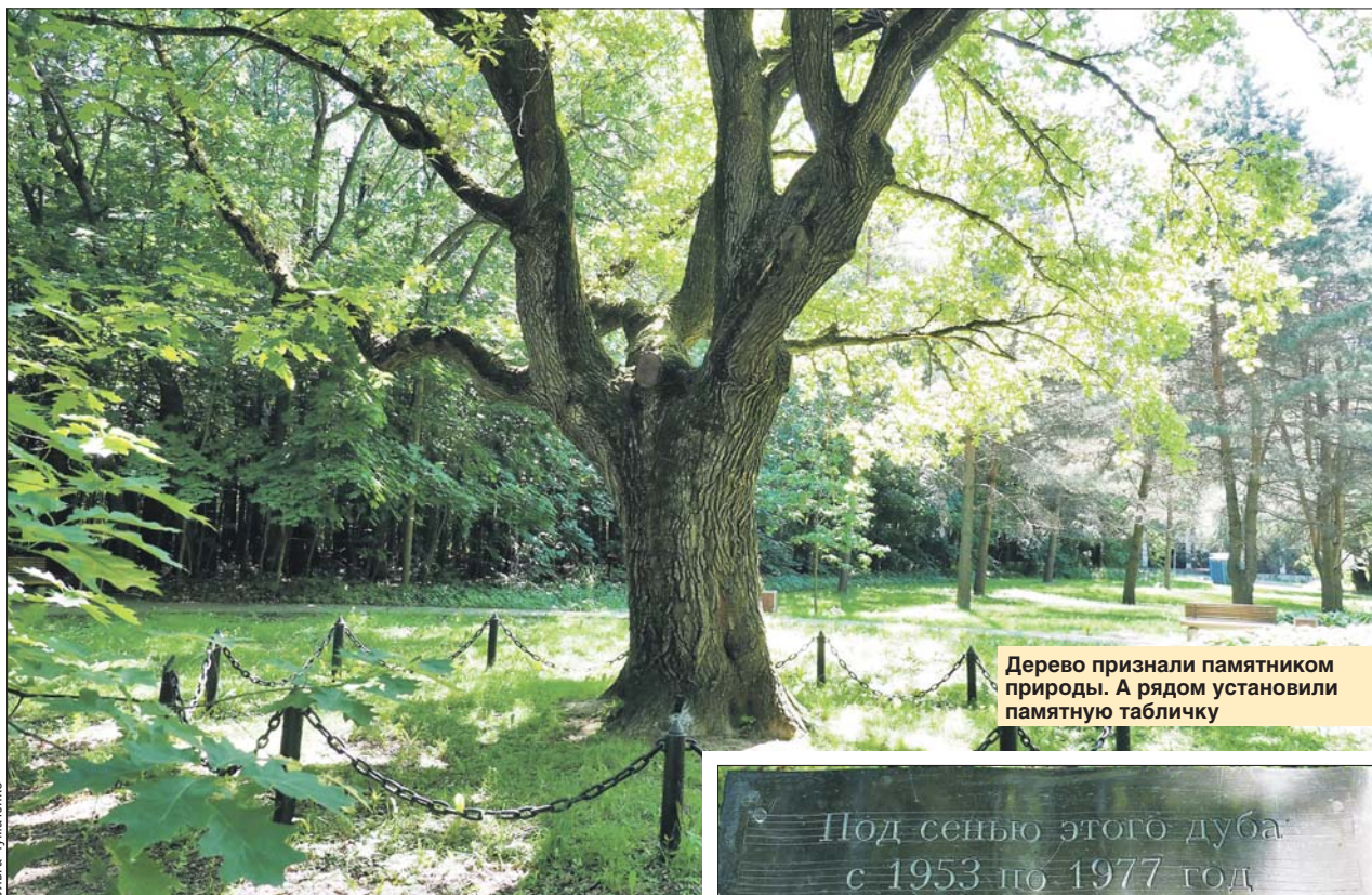
Дерево признали памятником природы. А рядом установили памятную табличку

Дубровский на всю жизнь останется любимым героем певца. Он исполнял его партию вплоть до 1951 года.