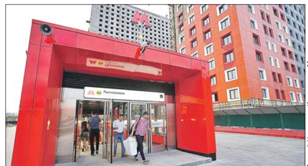
«Рассказовка» — одна из восьми станций метро, построенных в ТиНАО

Начиная с 2012 года в Новой Москве построе-