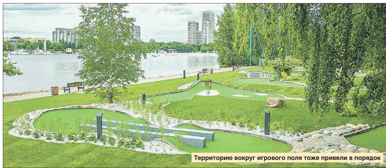
Территорию вокруг игрового поля тоже привели в порядок