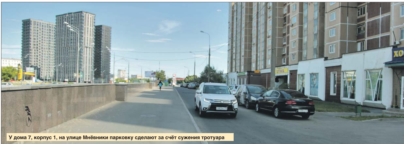
У дома 7, корпус 1, на улице Мнёвники парковку сделают за счёт сужения тротуара

Как обустроить дополнительные парковки на дороге или во дворе