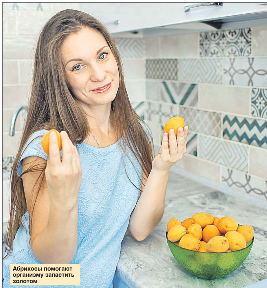
Абрикосы помогают организму запастись золотом

Супы в жару не запрещены. Но горячие первые блюда логично заменить холодным свекольником или окрошкой.