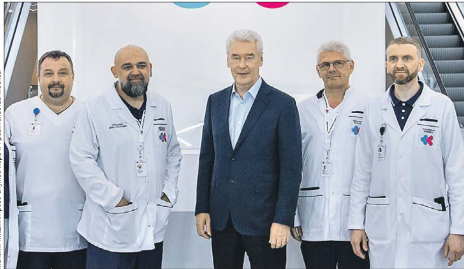
Сергей Собянин на открытии перинатального центра «Коммунарки» в июне этого года

Новую больницу в Коммунарке начали строить в 2017 году. Уже через два года четыре первых корпуса были готовы принять пациентов. Во время пандемии часть помещений полностью переоборудовали для лечения пациентов с коронавирусом.