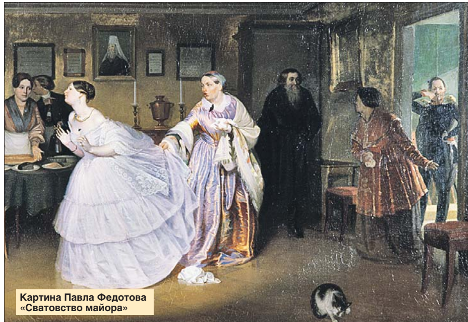
Картина Павла Федотова «Сватовство майора»

Где в округе отметить День любви, семьи и верности