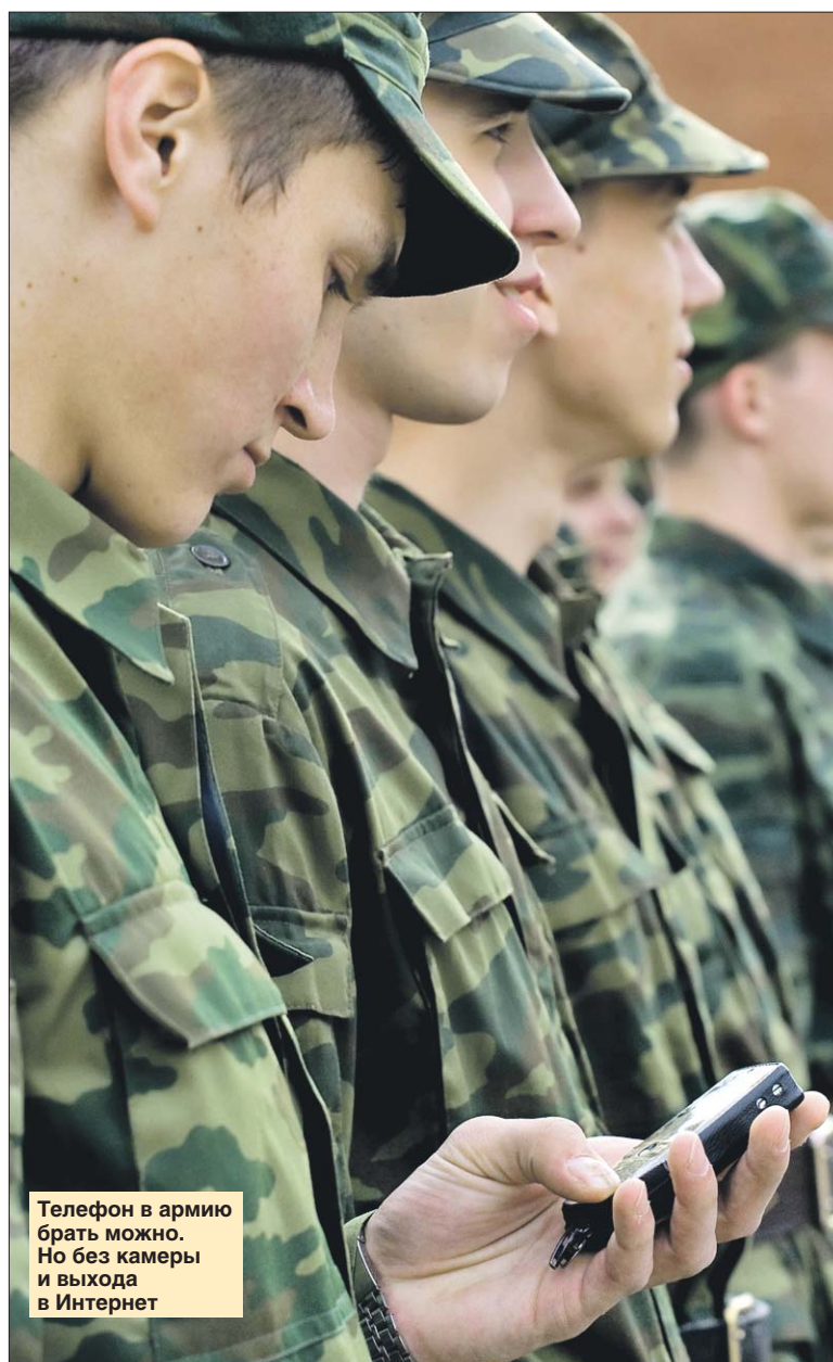
Телефон в армию брать можно. Но без камеры и выхода в Интернет