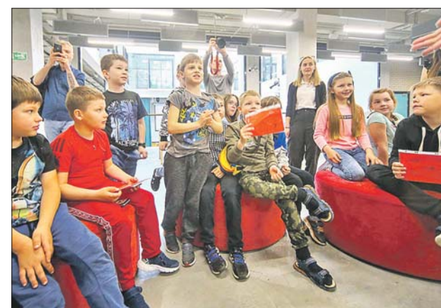
Юные шахматисты в образовательном комплексе «Формула», ЖК «Белые ночи»

Активное строительство социальных объектов в ТиНАО привело к тому, что число жителей Новой Москвы увеличилось с 2012 года более чем в два раза и сейчас составляет почти 650 тысяч человек. Если 10 лет назад лишь 17% москвичей, покупающих новую квартиру, выбирали жильё в ТиНАО, то в 2022 году эта цифра выросла до 60%. Большинство новосёлов — молодые семьи с детьми.