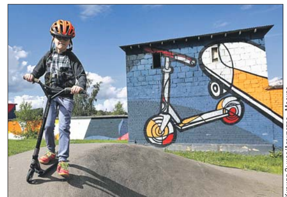
Спортивный парк в посёлке Ватутинки в ТиНАО

В Новой Москве также можно организовать концерты, выставки, спортивные состязания и фестивали на открытом воздухе.