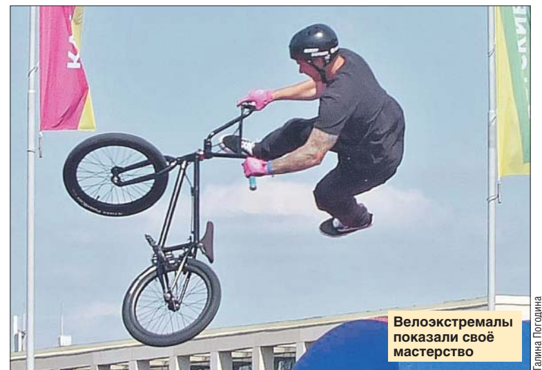
Велосипедисты показали своё мастерство

— Праздник отлично организован, всё сделано душевно, неформально, весело и доступно для всех,