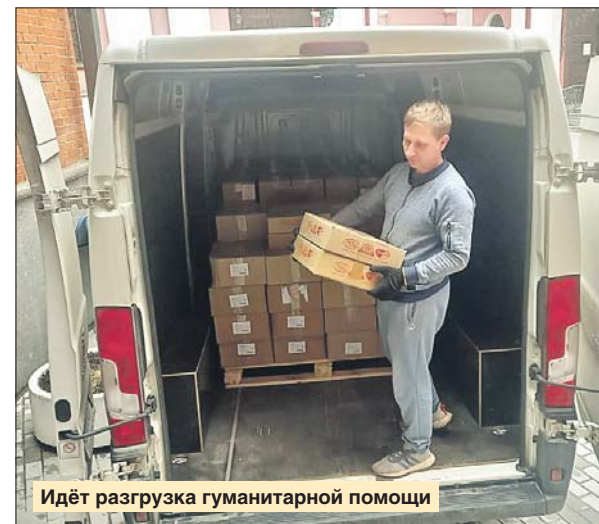
Идёт разгрузка гуманитарной помощи

Благотворительный фонд «Спаси жизнь» помогает малообеспеченным семьям с детьми и будущим мамам, попавшим в кризисную ситуацию. Отправляет в глубинку продукты, предметы первой необходимости, школьные канцтовары, оказывает психологическую и юридическую помощь. Сейчас волонтеры фонда участвуют в гуманитарных сборах для Донбасса.