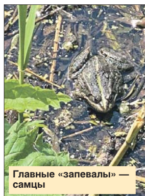
Главные «запевалы» — самцы

Самые громкие и многоголосые лягушачьи «вы-