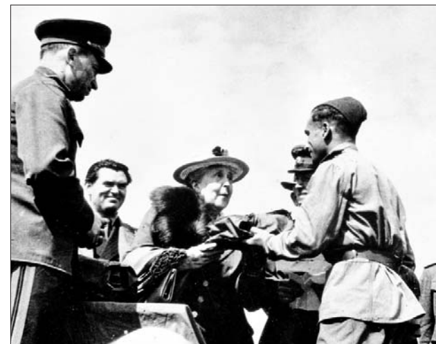
Передача самолётов Красной армии. В центре — народная артистка СССР Александра Яблочкина

Кроме наличных денег, в фонд обороны только от москвичей поступили сотни килограммов ювелирных украшений из платины, золота и серебра. А в первые дни войны почтовые слу-