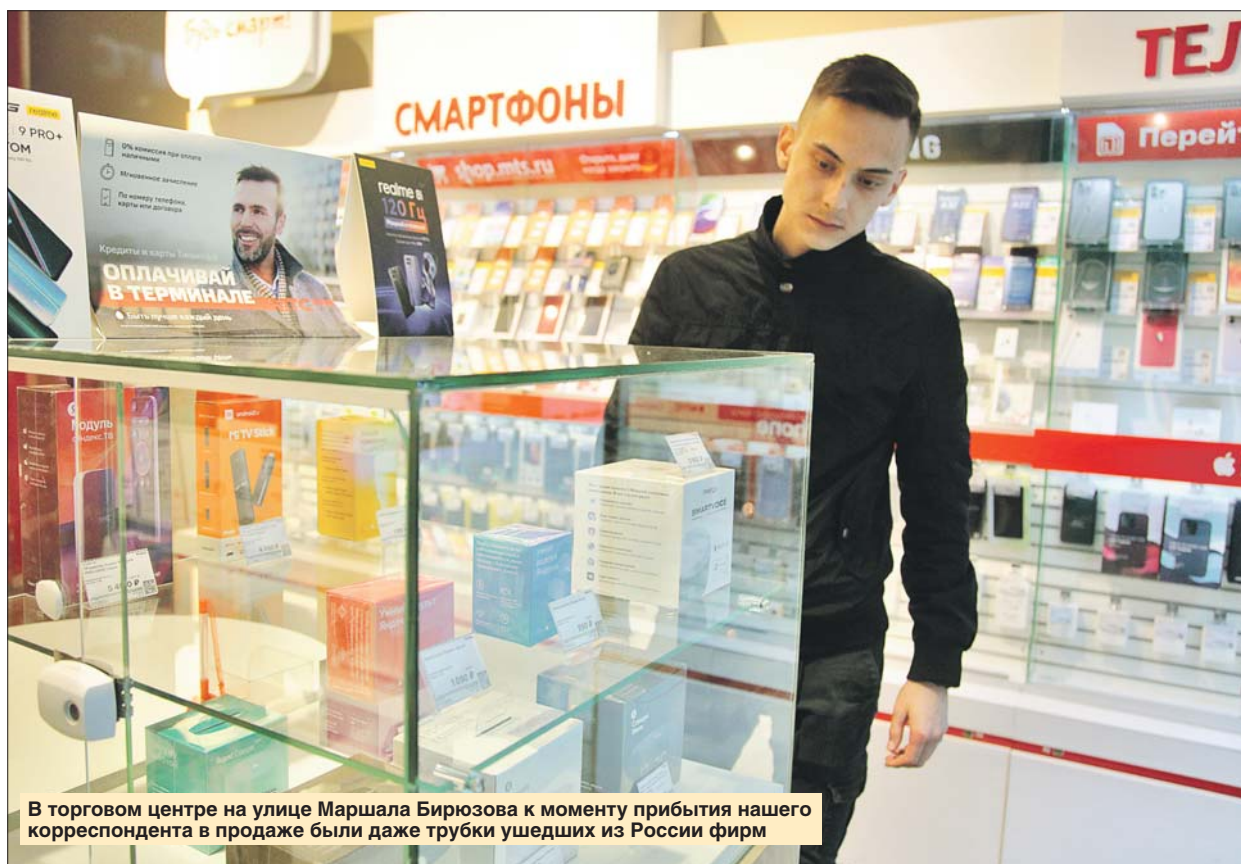
В торговом центре на улице Маршала Бирюзова к моменту прибытия нашего корреспондента в продаже были даже трубки ушедших из России фирм

— Весной от такой формы продажи мы отказались, а сейчас снова это