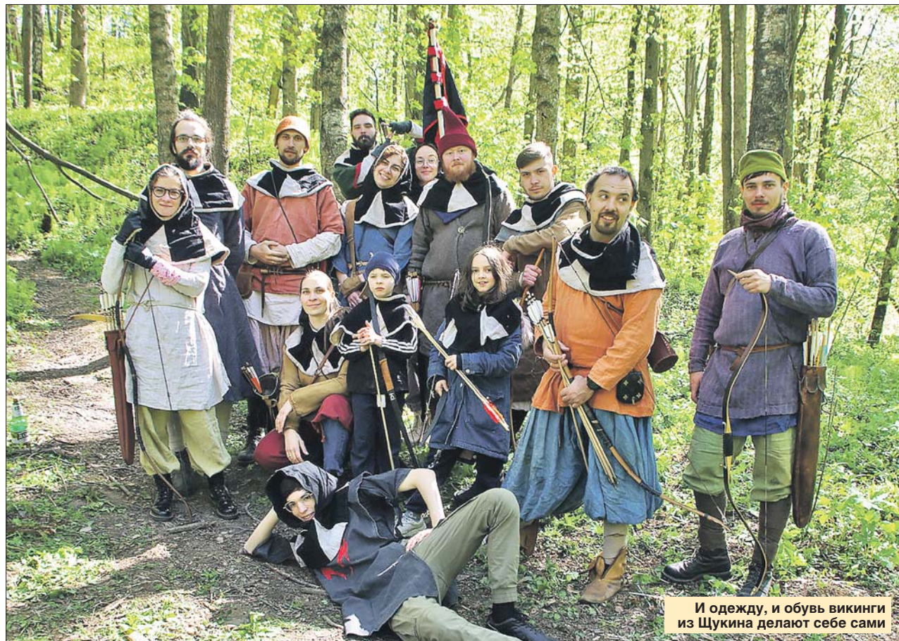
И одежду, и обувь викинги из Щукина делают себе сами

Конечно, до абсурда погружение в прошлое не доходит. В поход берут и аптечку, и мобильные телефоны. Но вот спать не в спальниках, а завернувшись в овчину. По словам Терешкова, комфортно и не холодно!