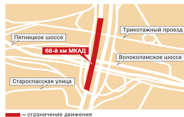
— ограничение движения