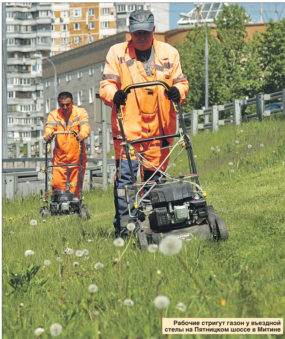
Рабочие стригут газон у въездной стелы на Пятницком шоссе в Митине

К слову, если жители хотят, чтобы во дворе у дома перестали стричь газон, можно написать коллективное заявление в «Жилищник». Для этого нужно