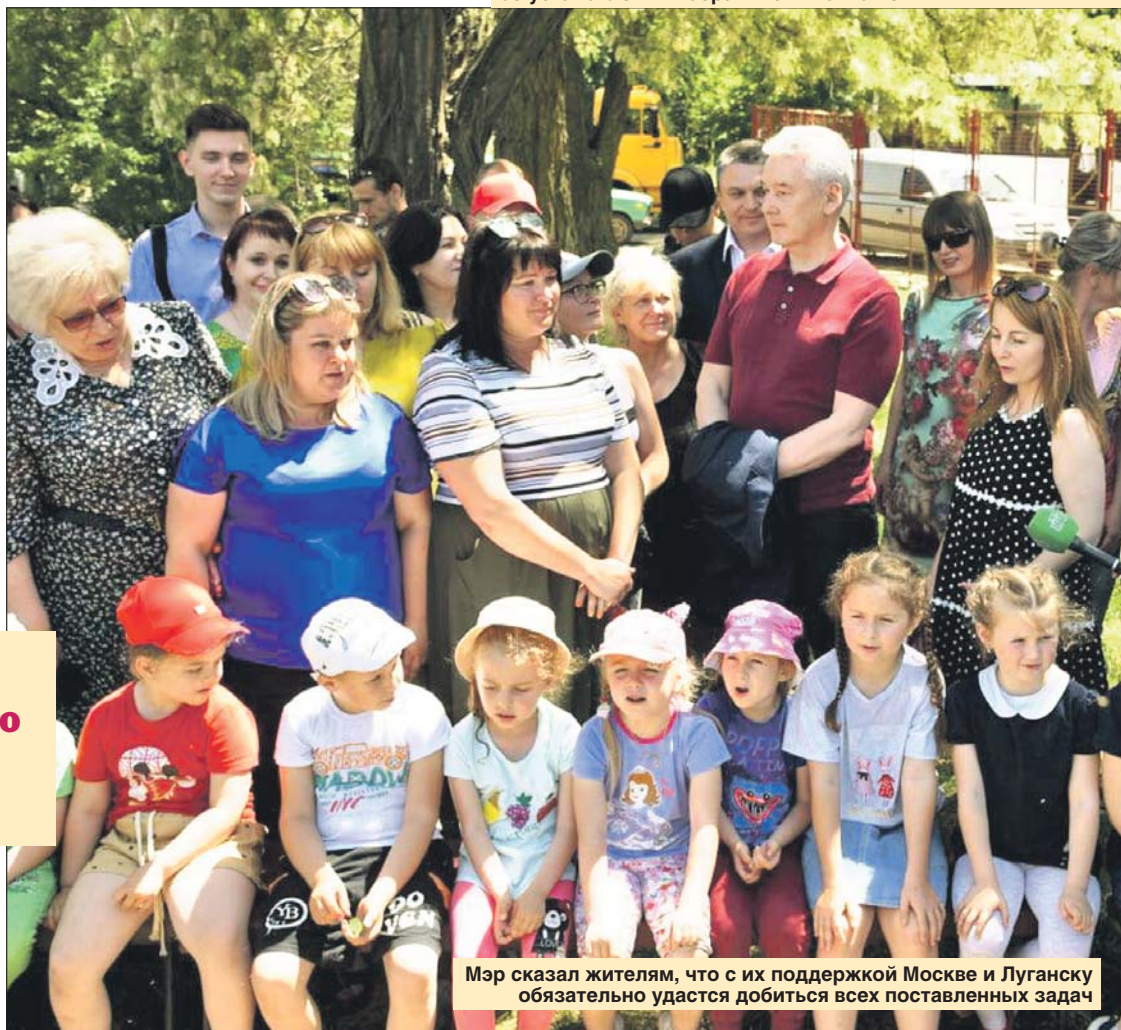
Мэр сказал жителям, что с их поддержкой Москве и Луганску обязательно удастся добиться всех поставленных задач