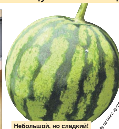
Небольшой, но сладкий!