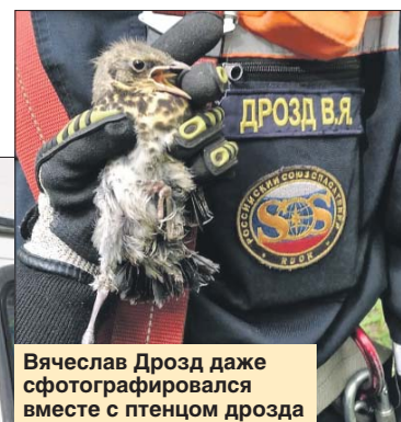
Вячеслав Дрозд даже сфотографировался вместе с птенцом дрозда