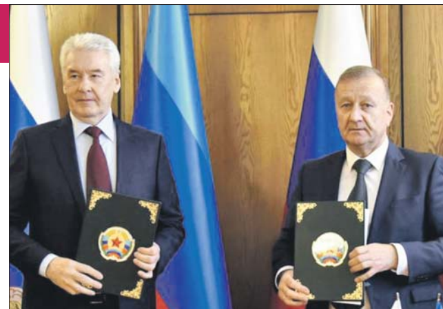
Мэр Москвы Сергей Собянин и глава администрации Луганска Манолис Пилавов подписали декларацию об установлении побратимских отношений