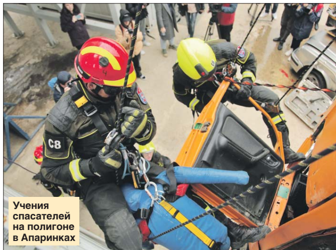
Учения спасателей на полигоне в Апаринках