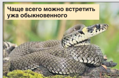
Чаще всего можно встретить ужа обыкновенного