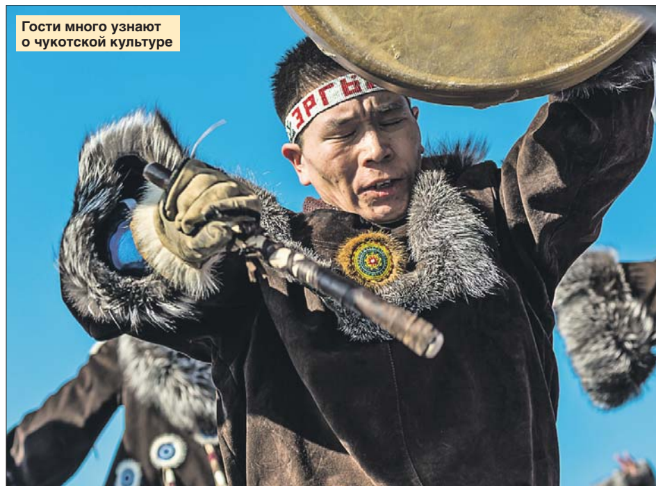
Гости много узнают о чукотской культуре