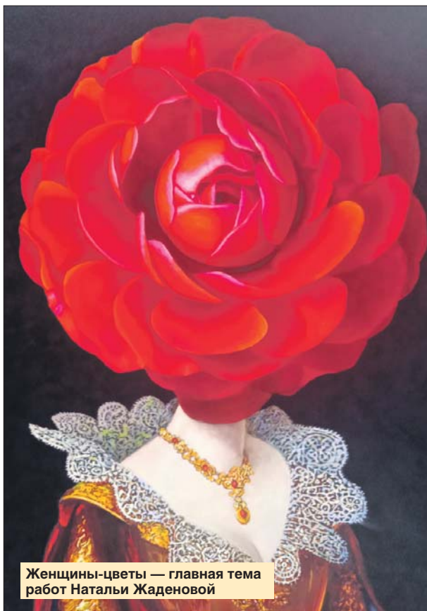
Женщины-цветы — главная тема работ Натальи Жаденовой

Впрочем, удивительно ли это? Ведь ещё в дет-