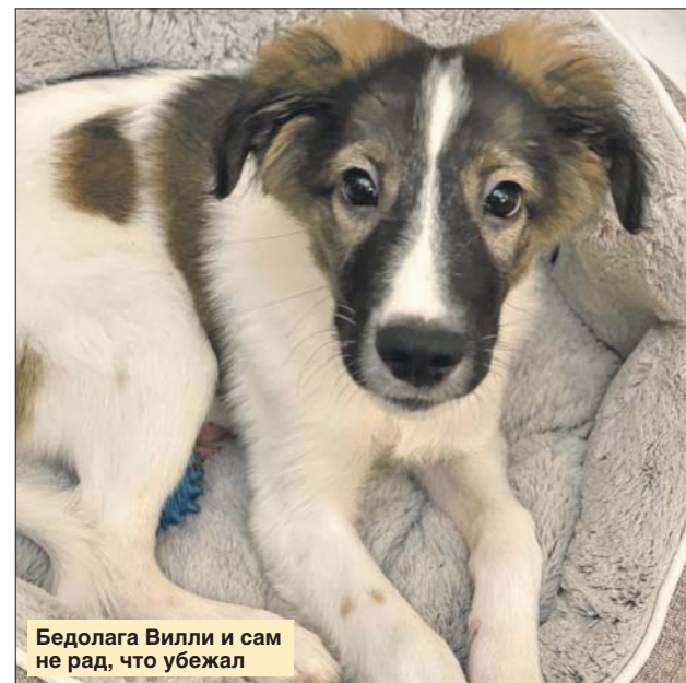
Бедолага Вилли и сам не рад, что убежал