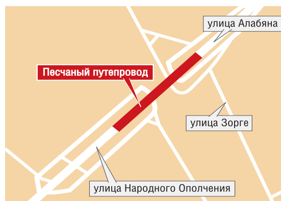
— ограничение движения