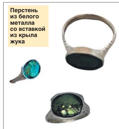
Перстень из белого металла со вставкой из крыла жука