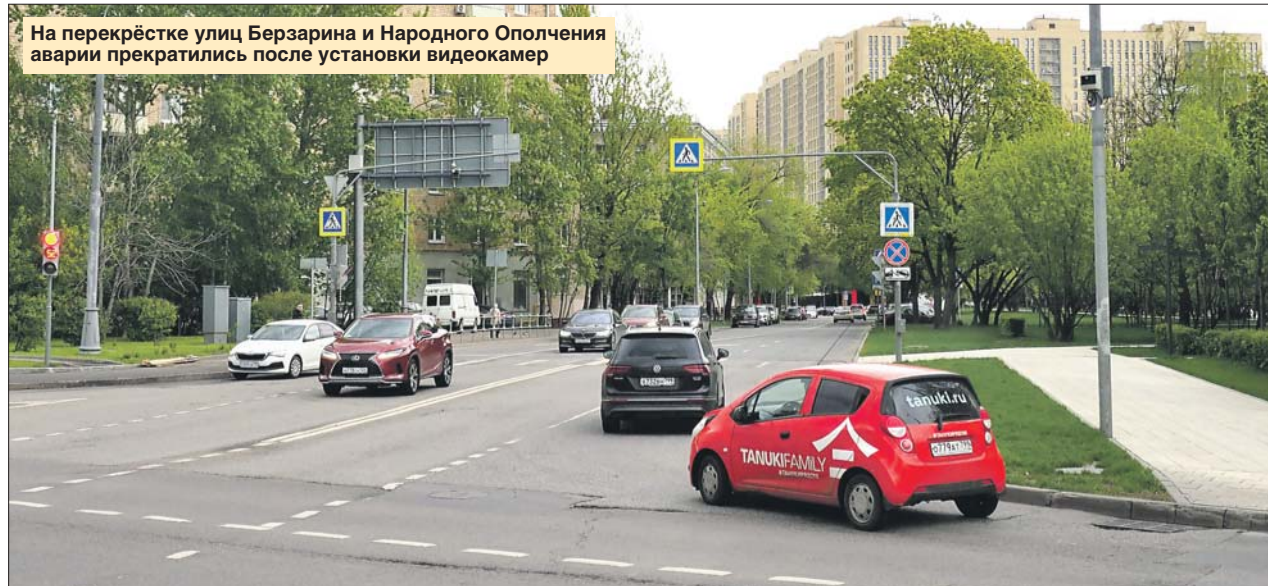
На перекрёстке улиц Берзарина и Народного Ополчения аварии прекратились после установки видеокamеры

43-летняя водительница второго «Киа» получила серьёзные ушибы.