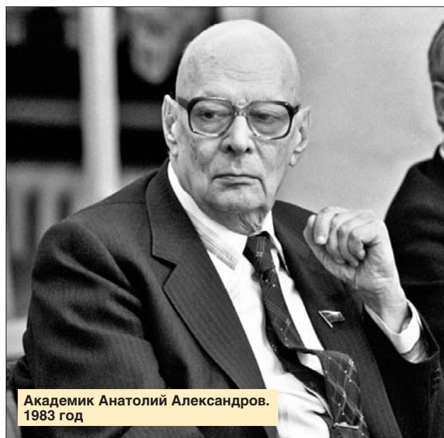
Академик Анатолий Александров. 1983 год

О дин из создателей советской атомной энергетики академик Анатолий Александров с 1960 по 1988 год возглавлял Институт атомной энергии, сменив на этом посту своего соратника и друга Игоря Курчатова после его скоропостижной смерти. А пятью годами раньше Александров с семьёй поселился на Пехотной улице в одном из коттеджей для сотрудников института. В его честь названа улица в Щукине рядом с Курчатовским институтом.