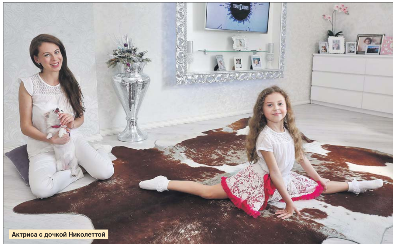
Актриса с дочкой Nicolette

Светлана Марголис