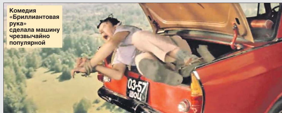
Комедия «Бриллиантовая рука» сделала машину чрезвычайно популярной

На «Москвиче-401/420» Николай в фильме «Москва слезам не верит» (1979) везёт свою неве-