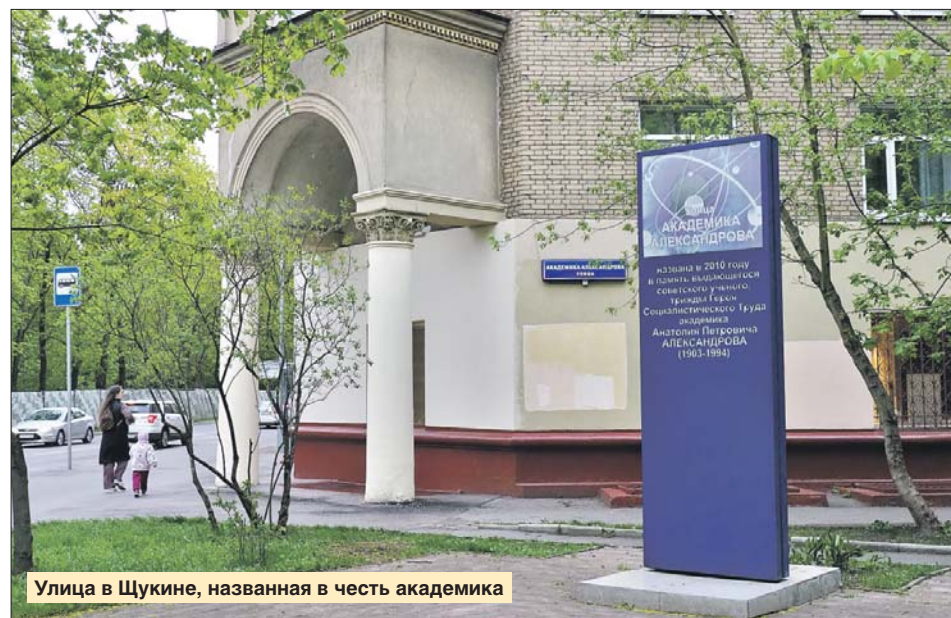
Улица в Щукине, названная в честь академика