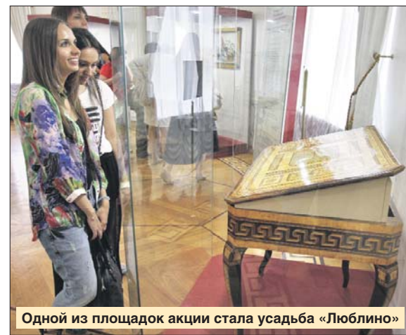
Одной из площадок акции стала усадьба «Люблино»