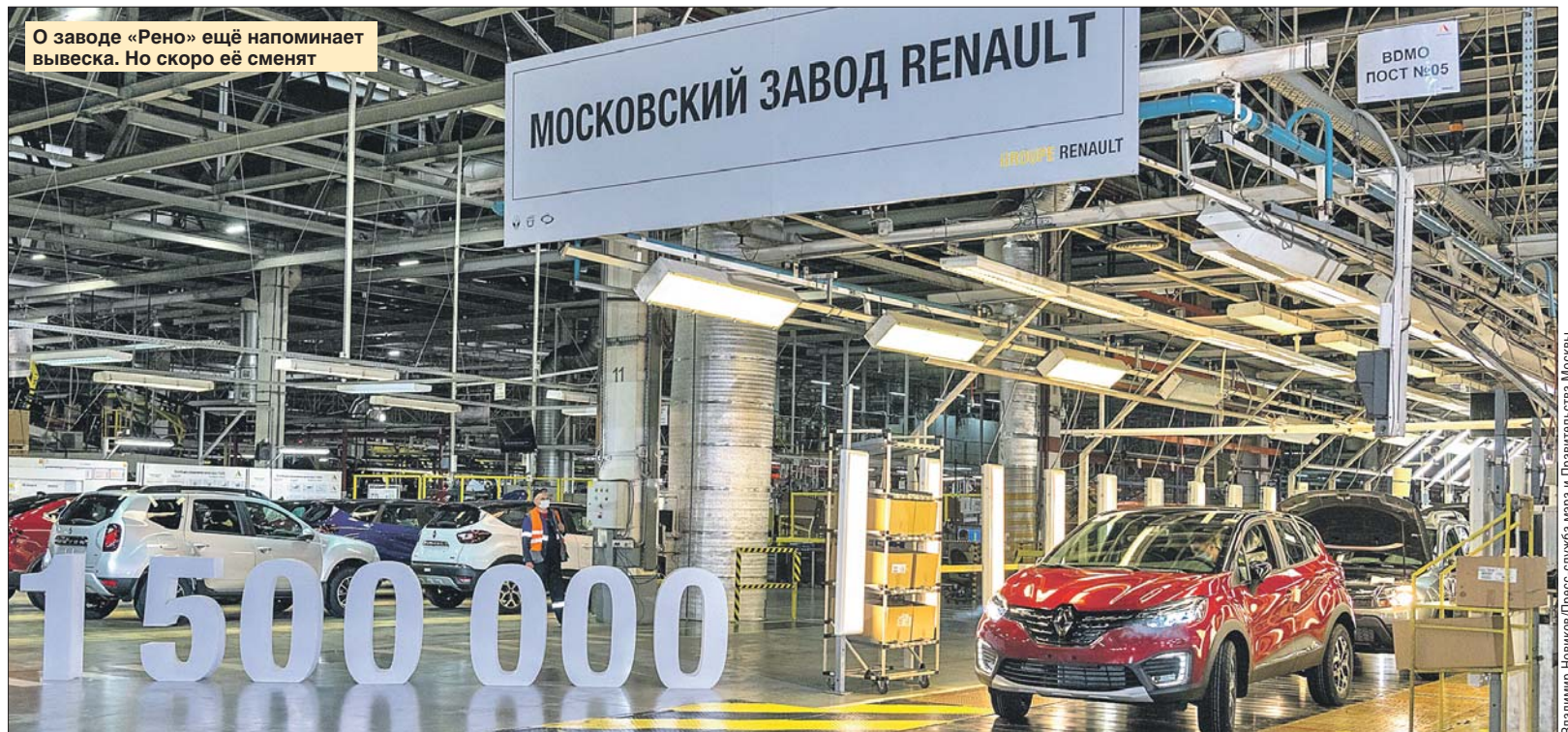
О заводе «Рено» ещё напоминает вывеска. Но скоро её сменят

власти постараются сохранить большую часть коллектива, непосредственно работающего на заводе и у его смежников. И смежники, по-видимому, без работы не останутся, ведь власти Москвы вместе с главным технологическим партнёром «Москвича» — КамАЗом — и Минпромторгом России намерены добиваться того, чтобы максимальное количество деталей производилось именно в России.