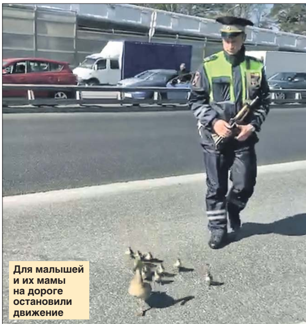
Для малышей и их мамы на дороге остановили движение