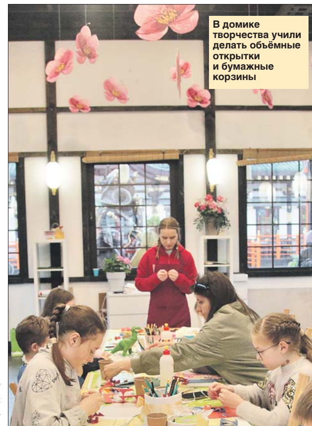
В домике творчества учили делать объёмные открытки и бумажные корзины

Концертная программа тоже была насыщенной. Корреспондент «СЗ» успела посмотреть выступление фольклорного ансамбля «Кладезь». У сцены собрались почти все