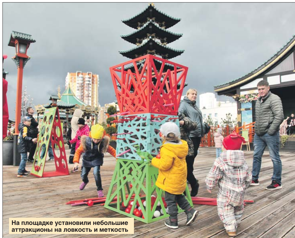
На площадке установили небольшие аттракционы на ловкость и меткость

нование Дня Победы, поэтому программа была особенной. Можно было смастерить памятную шкатулку и открытку-треугольник.