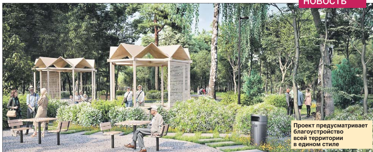
Проект предусматривает благоустройство всей территории в едином стиле

В 2022 году в Щукинском парке в районе улицы Маршала Василевского в рамках реабилитации данной территории и Всехсвятской роши установят беседки в историческом