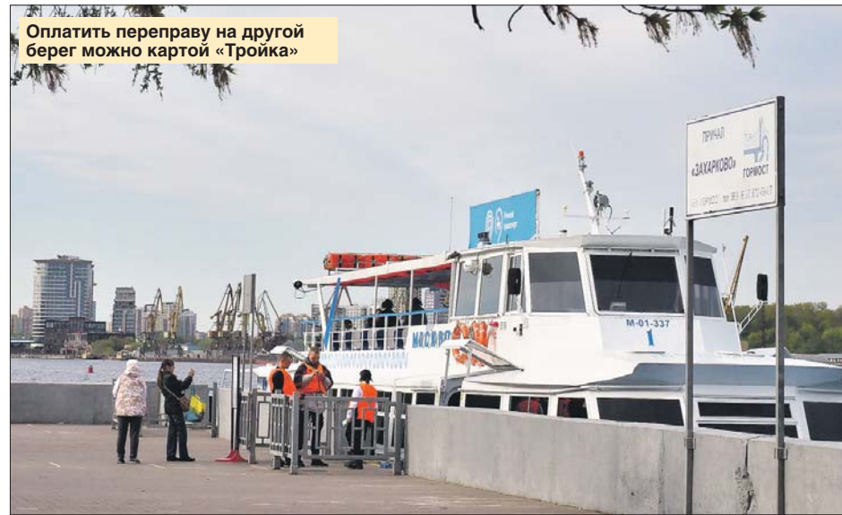
Оплатить переправу на другой берег можно картой «Тройка»