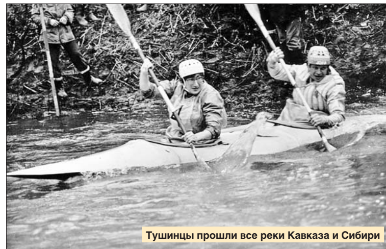
Тушинцы прошли все реки Кавказа и Сибири