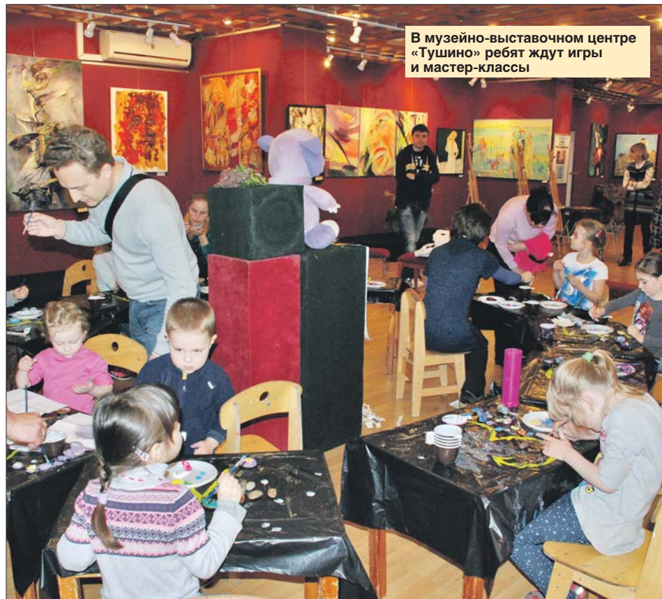
В музейно-выставочном центре «Тушино» ребята ждут игры и мастер-классы