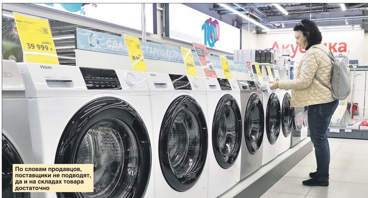
По словам продавцов, поставщики не подводят, да и на складах товара достаточно

Магазины бытовой техники в СЗАО находят замену ушедшим иностранным производителям