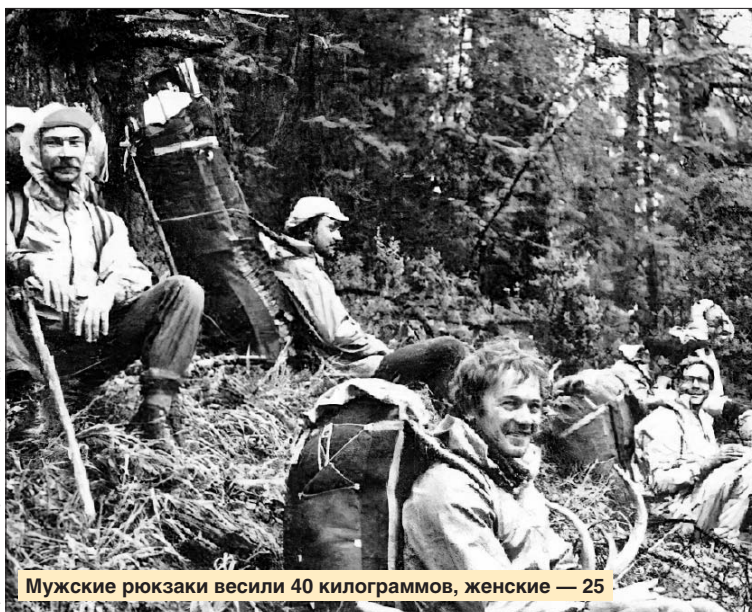
Мужские рюкзаки весили 40 килограммов, женские — 25

Тренировки на Сходне были более эффективными: в реку