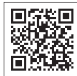
Все новости района: «Покровское-Стрешнево»