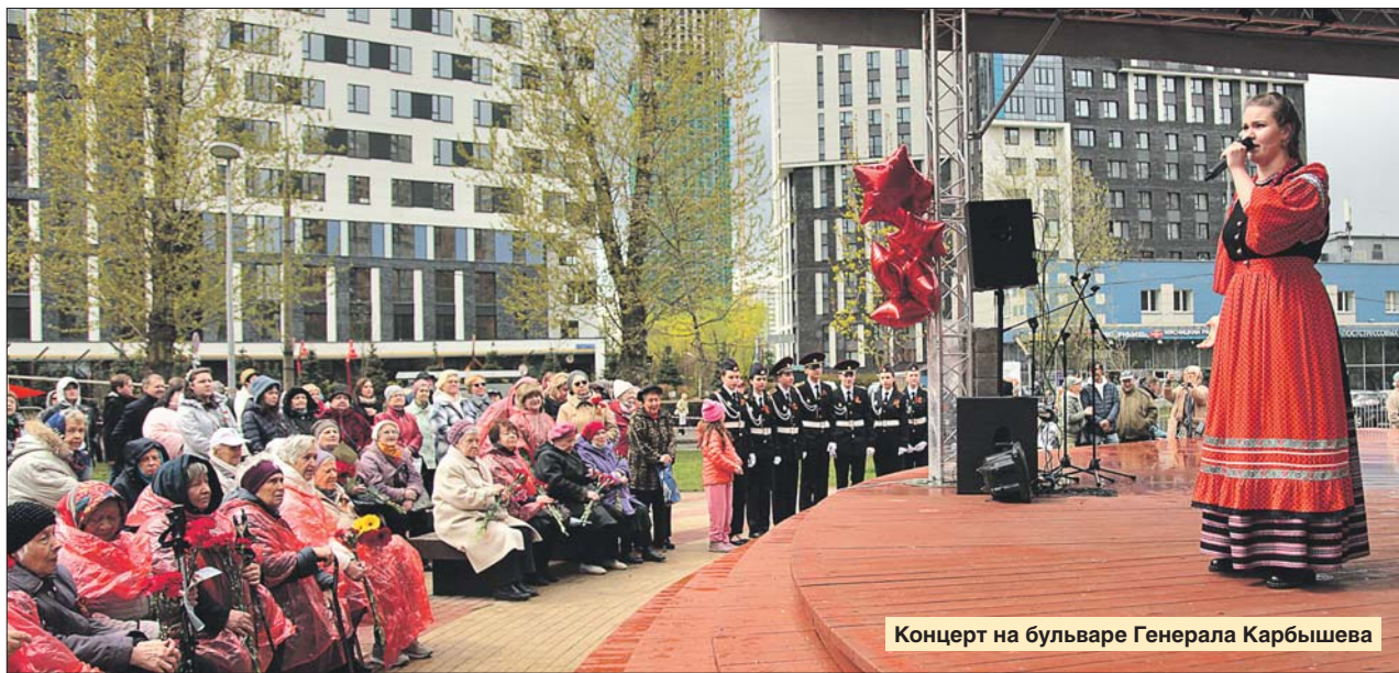
Концерт на бульваре Генерала Карбышева