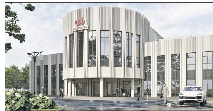
Форма здания будет напоминать соединённые свадебные кольца