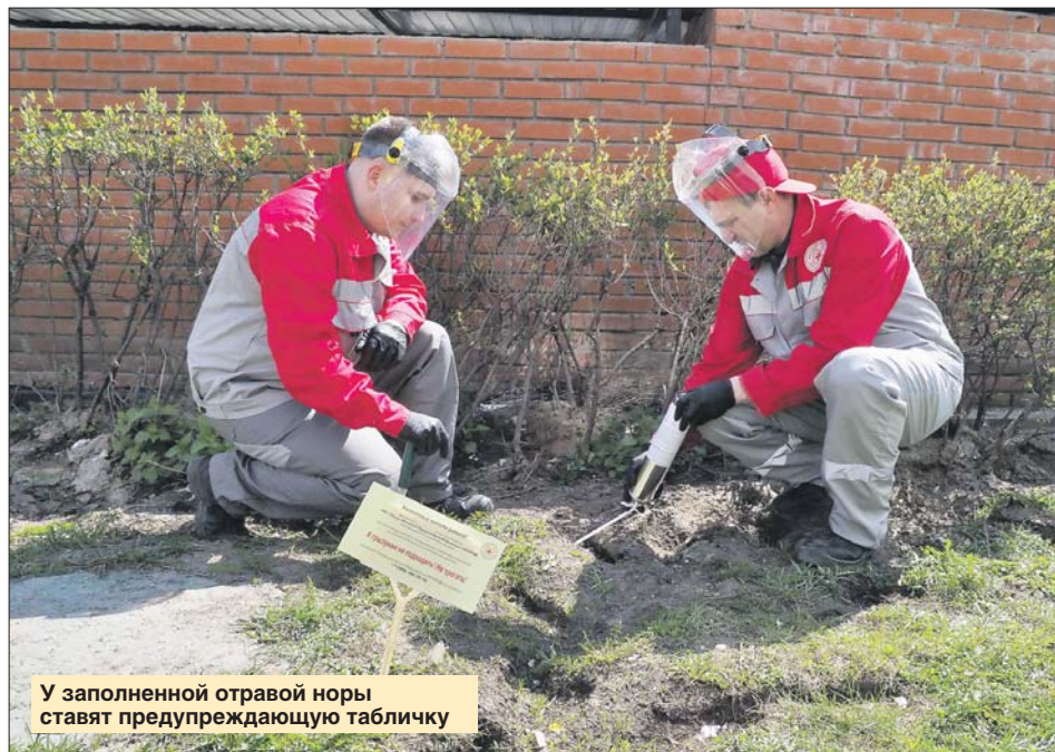
У заполненной отравой норы ставят предупреждающую табличку

По её словам, в городах полностью избавиться от крыс невозможно, ведь рядом с людьми им