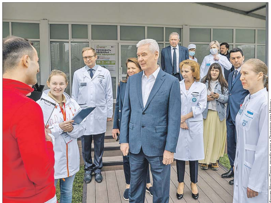
Сергей Собянин дал старт работе павильонов «Здоровая Москва», посетив площадку на Ходынке