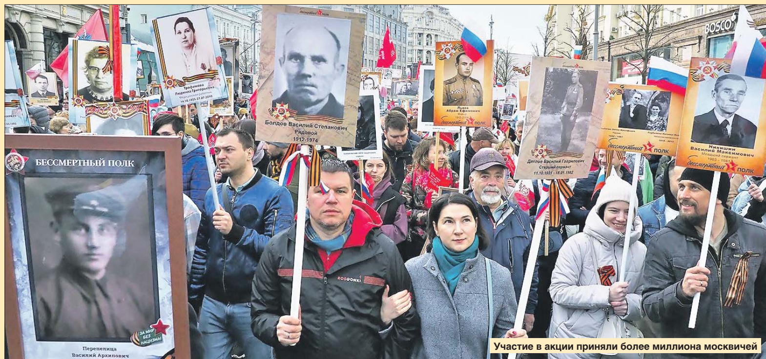
Участие в акции приняли более миллиона москвичей