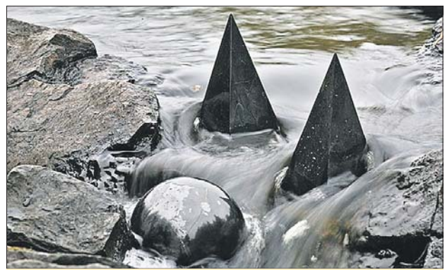
Шунгит — одна из самых древних горных пород на планете

— В 14.00 дети старше девяти лет смогут поучаствовать в мастер-классе по дизайну бейсболок. Руководитель студии «Вер-