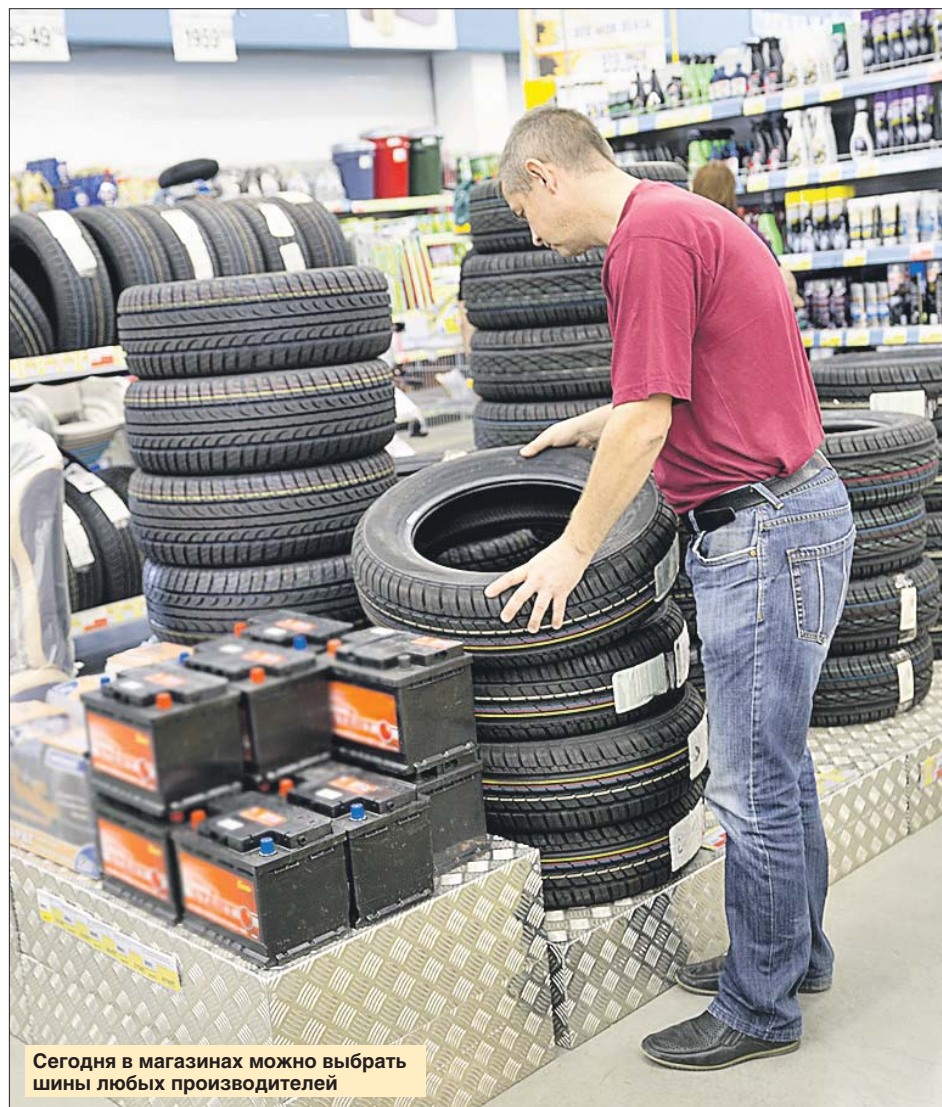
Сегодня в магазинах можно выбрать шины любых производителей