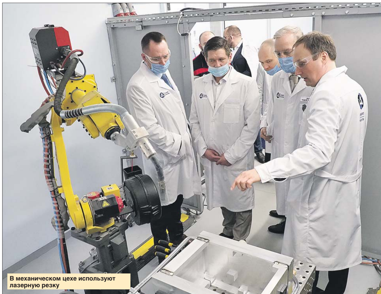
В механическом цехе используют лазерную резку

Лаборатория находится глубоко под землёй. Поражают массивные метал-