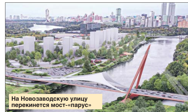
На Новозаводскую улицу перекинется мост-«парус»