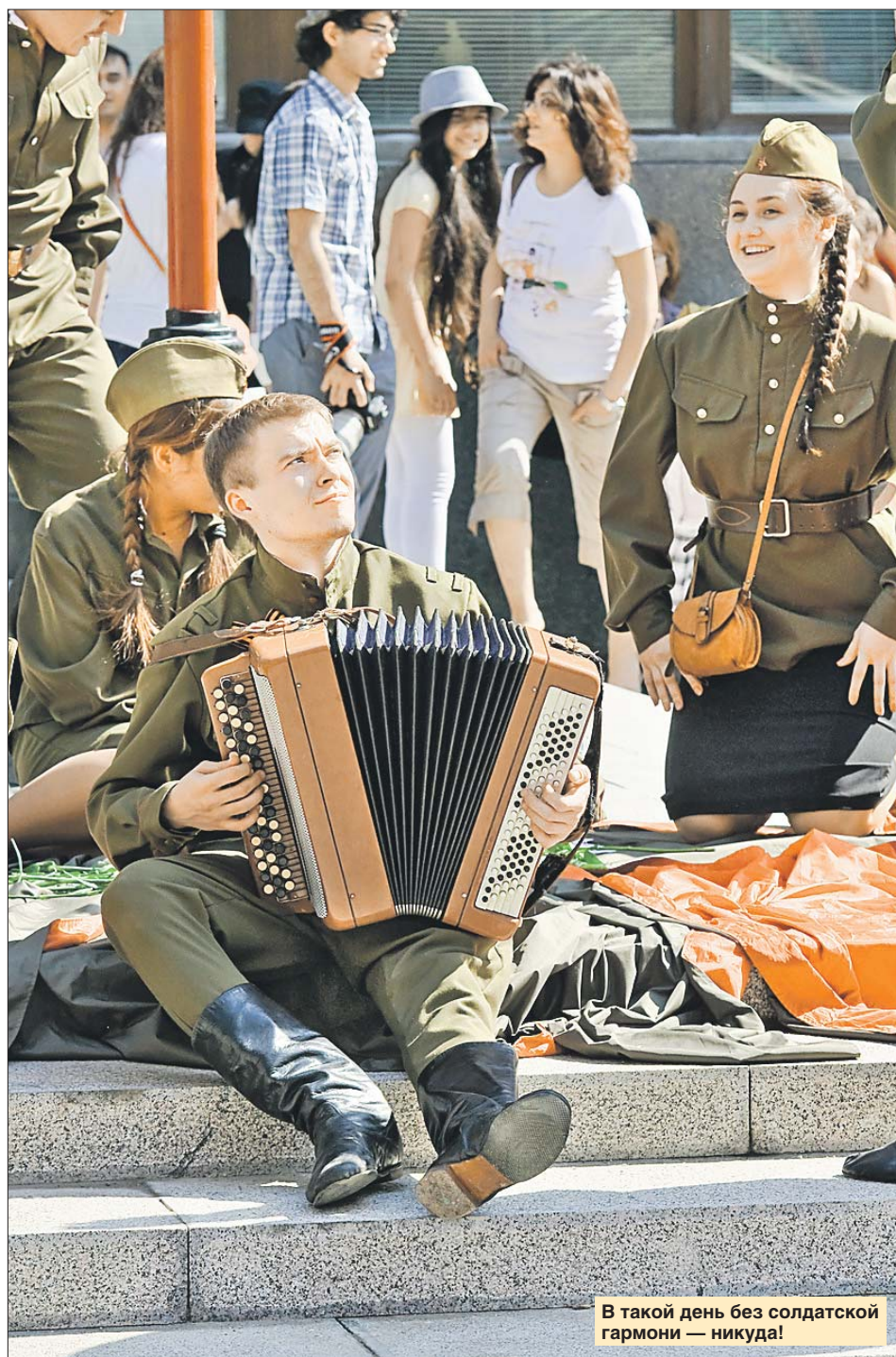
В такой день без солдатской гармонии — никуда!

Здесь же будет работать интерактивная площадка «Медсанбат», посвящённая медицинским сёстрам времён Великой Отечественной. Гости смогут принять участие в мастер-классах по оказанию первой медицинской помощи при ранениях. А на танцевальной площадке — потанцевать под музыку военных лет.