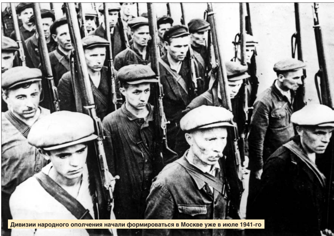
Дивизии народного ополчения начали формироваться в Москве уже в июле 1941-го

Жители Щукина, Тушина, Митина воевали в рядах 18-й стрелковой дивизии народного ополчения