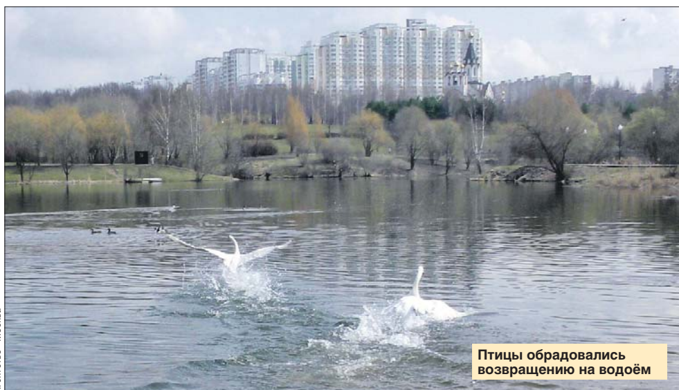
Птицы обрадовались возвращению на водоём