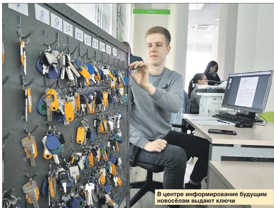
В центре информирования будущим новосёлам выдают ключи