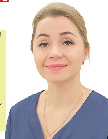
Лиц. на осуществление медицинской деятельности № ЛО-77-01-020827 от 21.12.2020 г.

О ВОЗМОЖНЫХ ПРОТИВОПОКАЗАНИЯХ ПРОКОНСУЛЬТИРУЙТЕСЬ У СПЕЦИАЛИСТА