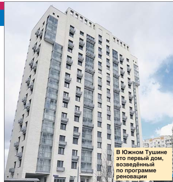
В Южном Тушине это первый дом, возведённый по программе реновации

По её словам, в старой однокомнатной квартире прописаны пять человек. В новостройке однушка больше по площади, но