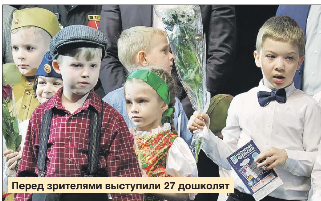
Перед зрителями выступили 27 дошколят

Конкурс чтецов, посвящённый 9 Мая, «Мы помним! Мы гордимся!» среди дошколят округа прошёл в культурно-досуговом центре «Строгино». Ребята прочитали стихи о войне и Победе, а жюри, в состав которого вошли ветераны и активные жители района, выбрали лучших.