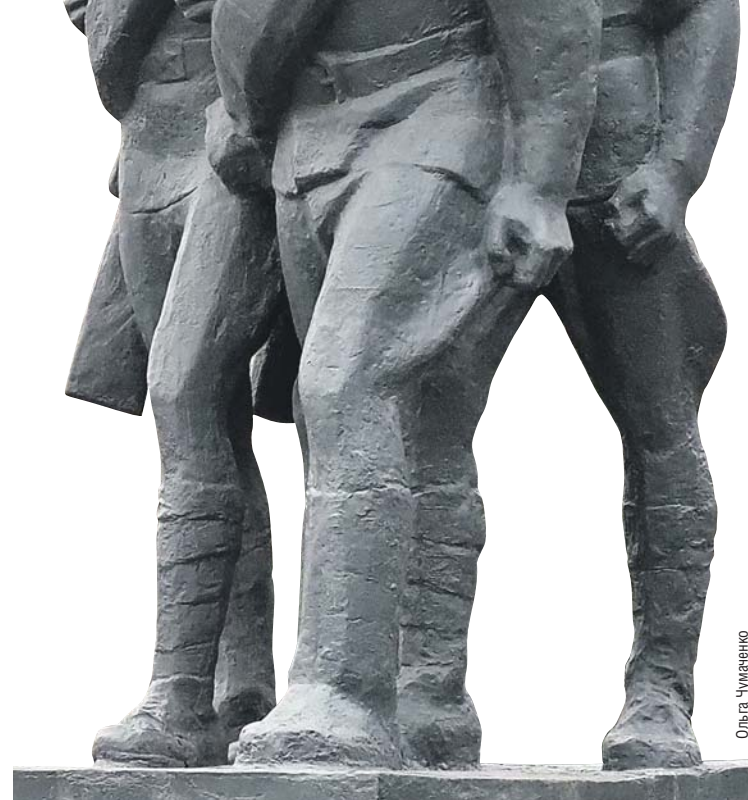
Памятник ополченцам на улице Народного Ополчения