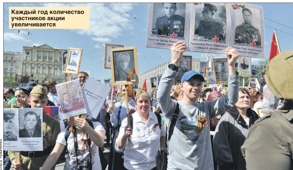
Каждый год количество участников акции увеличивается

В этом году 9 Мая после двухлетнего перерыва, связанного с пандемией, «Бессмертный полк» вновь пройдёт по улицам столицы и обещает стать рекордным по числу участников.