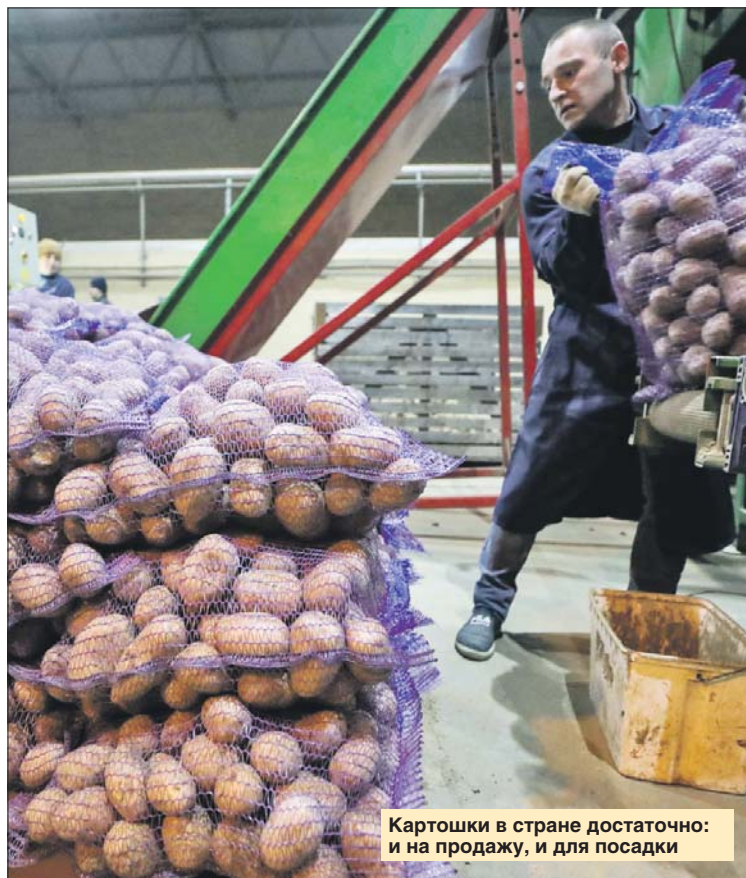
Картошки в стране достаточно: и на продажу, и для посадки

— У нас такая тоже есть. Недавно она сломалась. Мы нашли поставщиков деталей, аналогичных поломанным, из России, но ждать поставки пришлось две недели вместо трёх