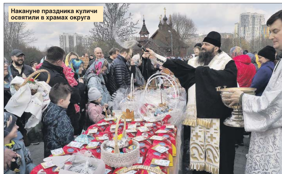
Накануне праздника куличи освятили в храмах округа

— Конечно, люди были рады подаркам, но я и сама получила заряд положитель-