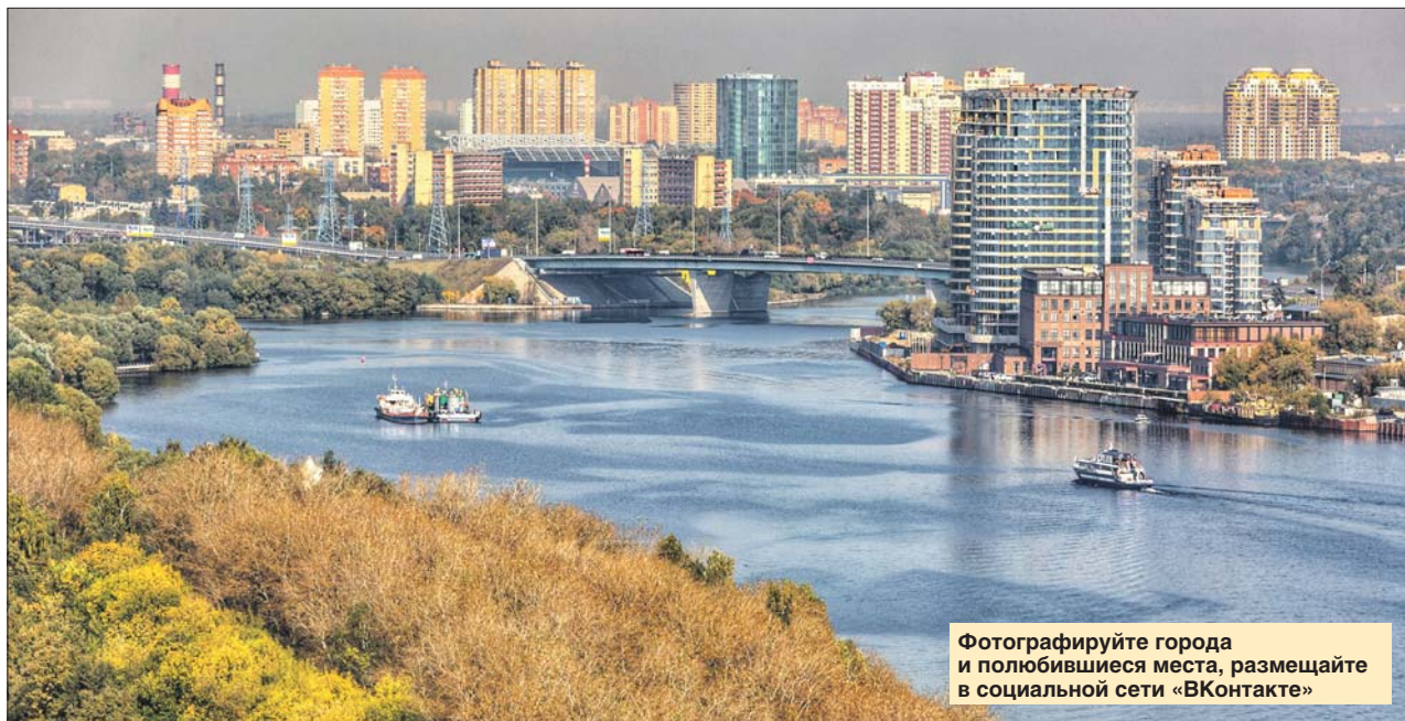
Фотографируйте города и любимые места, размещайте в социальной сети «ВКонтакте»