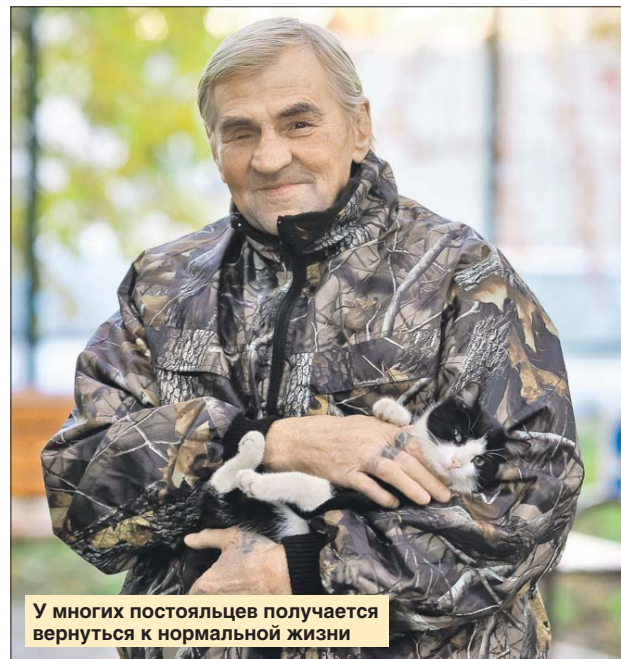
У многих постояльцев получается вернуться к нормальной жизни

— С каждым постояльцем приюта я раз в неделю беседую индивидуально, ведь люди здесь разные. Для некоторых бродяжничество стало образом жизни, — рассказывает она. — Я пытаюсь мотивировать таких найти работу, снять жильё. И у многих это получается. Например, у одного 36-летнего мужчины не было никакой цели в жиз-