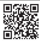
Все новости района: «Покровское-Стрешнево»

Мост «поймал» в ловушку пассажирский автобус возле стадиона «Открытие Арена», сообщает интернет-издание «Покровское-Стрешнево» со ссылкой на «Telegram»-канал «ДТП и ЧП Москва и Московская область». Автобус не прошёл по высоте под мостом, повредив крышку кондиционера. Пользователи предположили, что автобус перевозил сотрудников полиции перед матчем Российской премьер-лиги, в котором «Спартак» со счётом 1:2 проиграл «Краснодару».