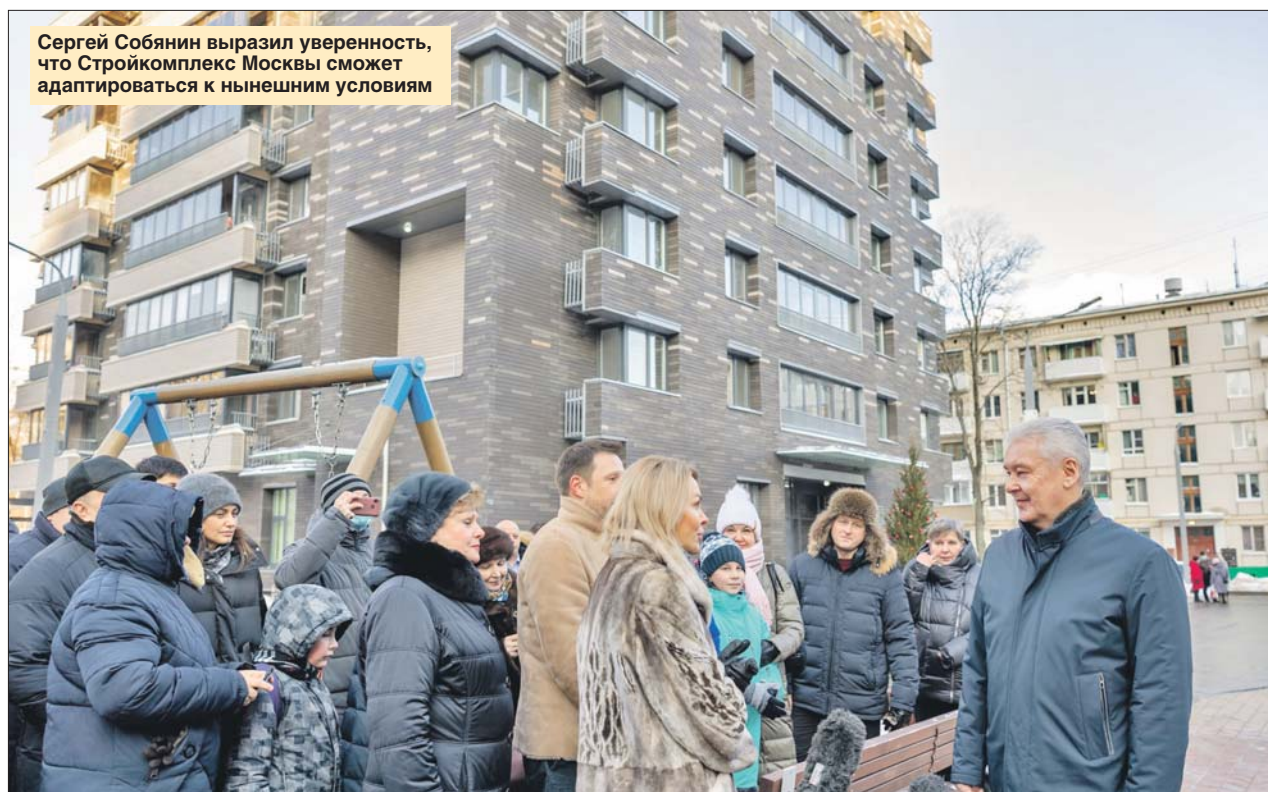
Сергей Собянин выразил уверенность, что Стройкомплекс Москвы сможет адаптироваться к нынешним условиям

Эта мера уже применялась, когда столичный