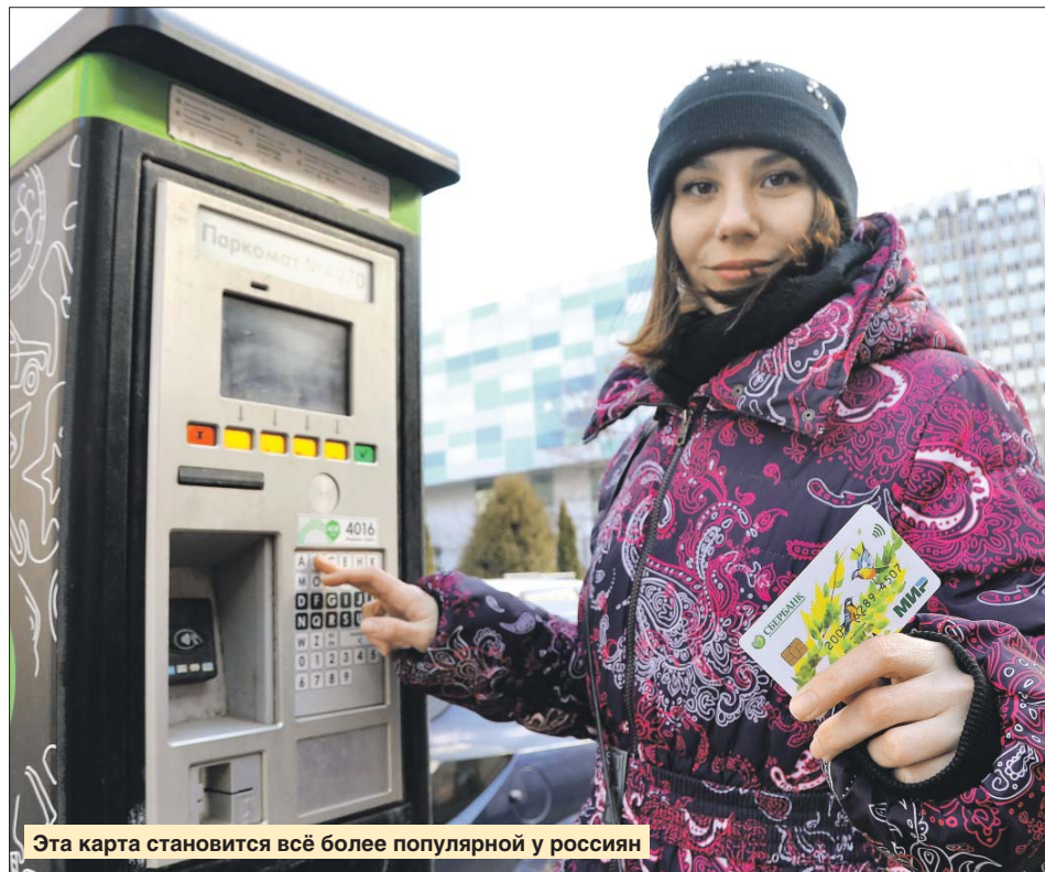
Эта карта становится всё более популярной у россиян

Работа платёжной системы «Мир» не зависит от внешних факторов