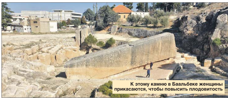
К этому камню в Баальбеке женщины прикасаются, чтобы повысить плодовитость

Заниматься уборкой самостоятельно в этой стране считается не солидно