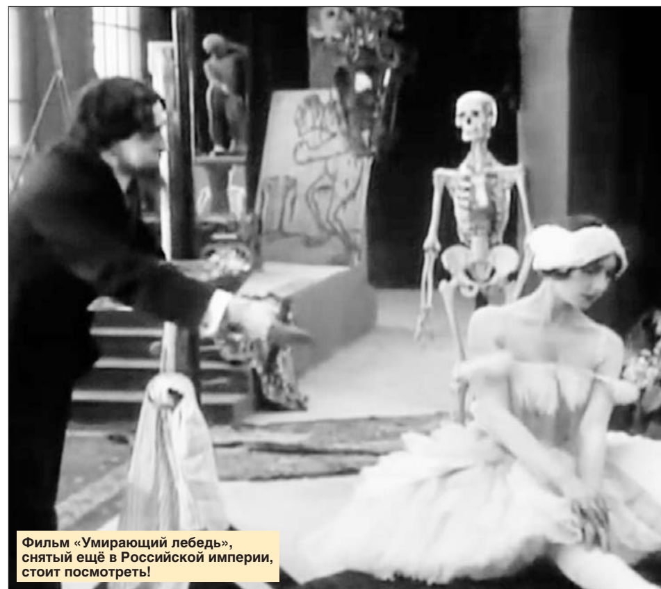
Фильм «Умиравший лебедь», снятый ещё в Российской империи, стоит посмотреть!