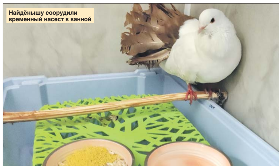
Найдёнышу соорудили временный насест в ванной

У Татьяны дома живут две собаки породы джек-рассел и кошка, так что голубя решено было