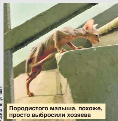
Породистого малыша, похоже, просто выбросили хозяева