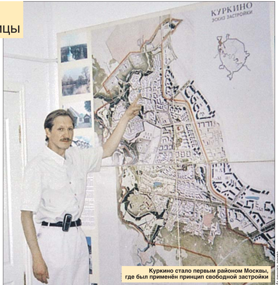
Куркино стало первым районом Москвы, где был применён принцип свободной застройки