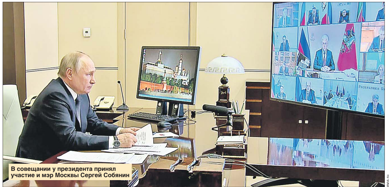
В совещании у президента принял участие и мэр Москвы Сергей Собянин

Он напомнил, что ещё в декабре было принято решение направить дополнительные средства в слу-