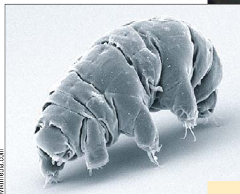
Человечеству есть чему поучиться у этих беспозвоночных

— Водяные медведи в зависимости от вида могут жить до 200 лет. При этом в неблагоприятных условиях, когда совсем нет воды, они просто надолго впадают в криптиобиоз: состояние, похожее на анабиоз, в основе которого — обезвоживание тканей, — рассказывает Артём. — Недавно учёные из Сингапура провели эксперимент: заморозили их