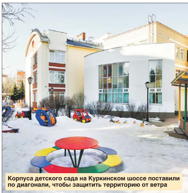
Корпуса детского сада на Куркинском шоссе поставили по диагонали, чтобы защитить территорию от ветра

— Парк задумывался как Диснейленд, только с нашим содержанием: с городком мастеров, творческими студиями. Мы ра-