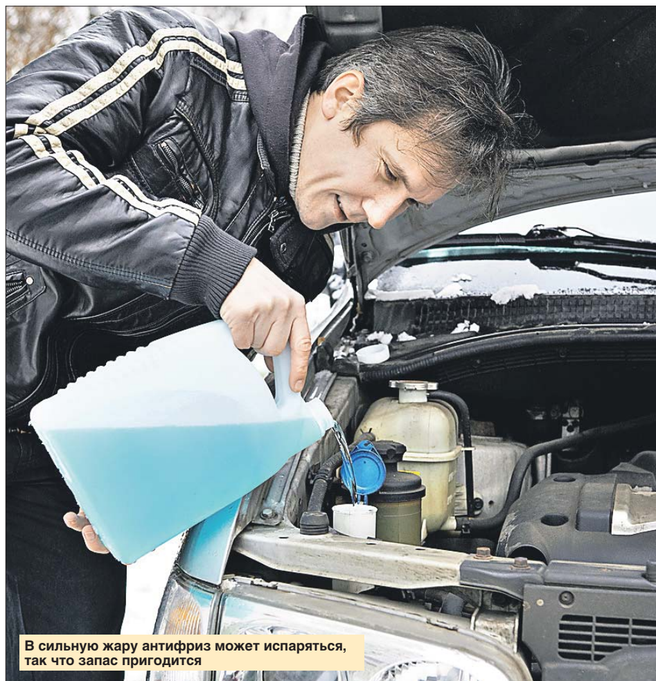
В сильную жару антифриз может испаряться, так что запас пригодится

Время сезонной смены колёс ещё не пришло. На зимней резине днём в тёплую погоду нужно трогаться плавно, избегать резких торможений. Так колёса будут изнашиваться меньше, а шипы на них