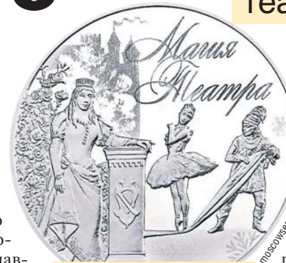
Можно увидеть изображения памятных монет, посвящённых театру

щицы Гизеллы сыграла прима-балерина Императорского Большого театра, участница «Русских сезонов» в Париже Вера Каралли. Фильм рассказывает о трагической судьбе девушки.