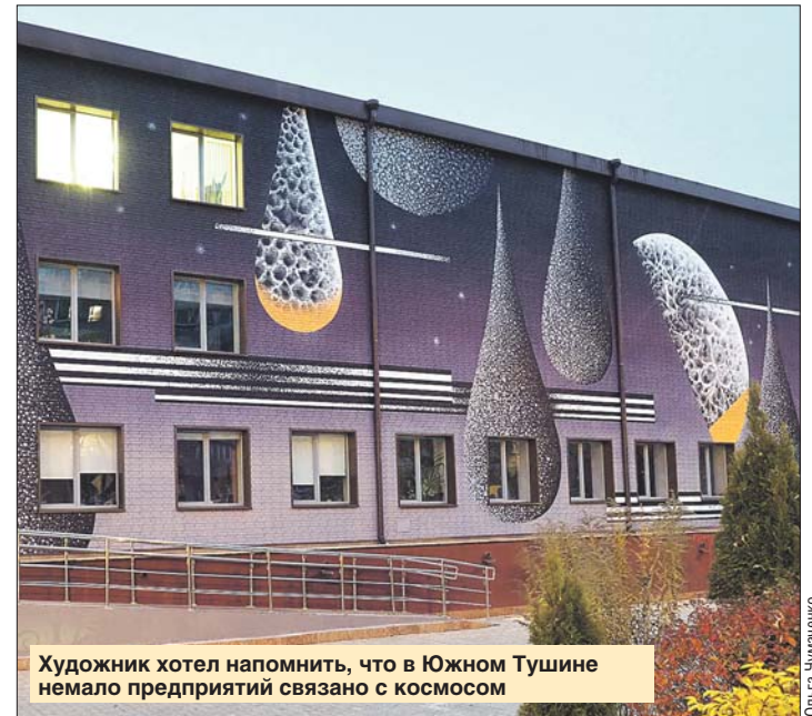
Художник хотел напомнить, что в Южном Тушине немало предприятий связано с космосом