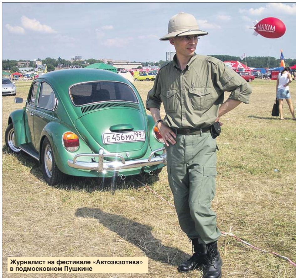
Журналист на фестивале «Автоэкзотика» в подмосковном Пушкине

— Особенность ралли в том, что один из его этапов участники преодолевают верхом на лошади, — говорит он.