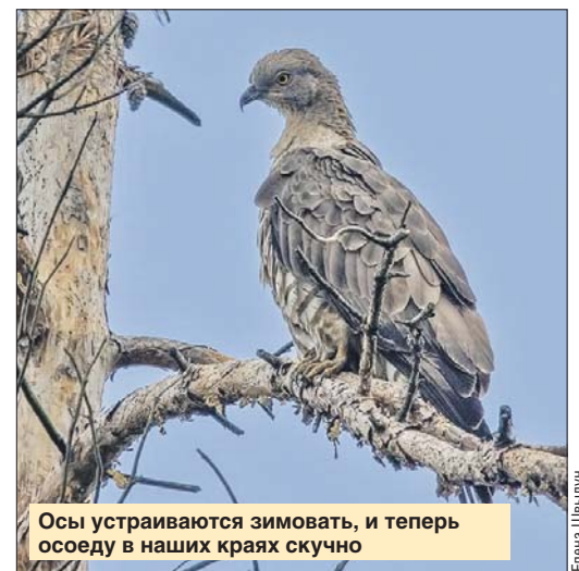
Осы устраиваются зимовать, и теперь осоеду в наших краях скучно