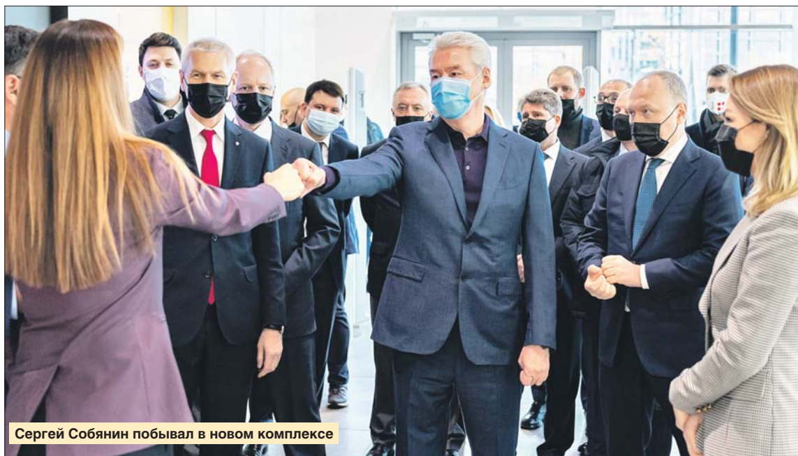
Сергей Собянин побывал в новом комплексе

Напомним, что сегодня здесь, на площади 200 гектаров, возводятся жилые дома, школы, детские сады. Появятся поликлиника, бизнес-парк, новые парки и благоустроенная набережная.