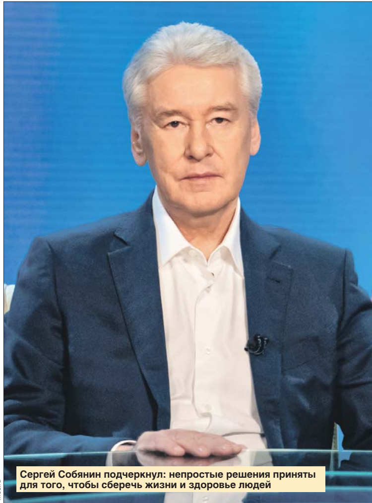
Сергей Собянин подчеркнул: непростые решения приняты для того, чтобы сберечь жизни и здоровье людей

Рестораны и кафе могут работать навынос и на доставку готовых блюд. Не ограничивается работа корпоративных предприятий общественного питания и ресторанов в гости-