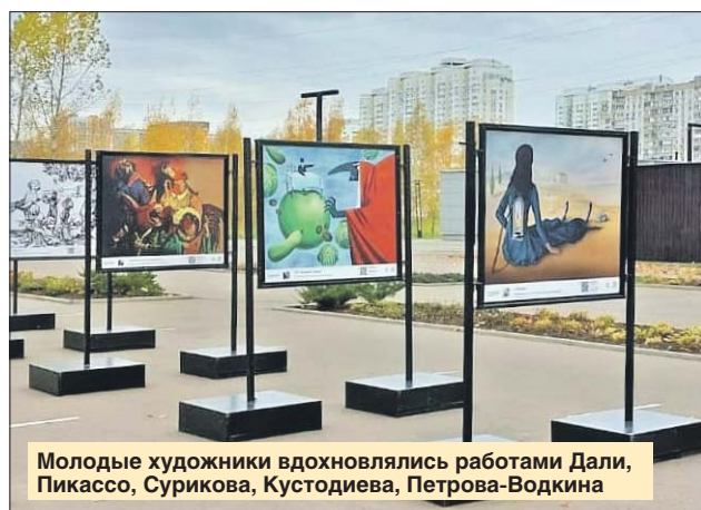
Молодые художники вдохновлялись работами Дали, Пикассо, Сурикова, Кустодиева, Петрова-Водкина

Закройте глаза, сделайте глубокий вдох и полный выдох. Услышьте, какие запахи сопровождают вас сейчас. Скорее всего, это будет целый букет. Попробуйте выделить из него тот аромат, который вам кажется наиболее интересным. Ответьте себе: что именно для вас важно в этом аромате? Побудьте с ним и запомните это ощущение.