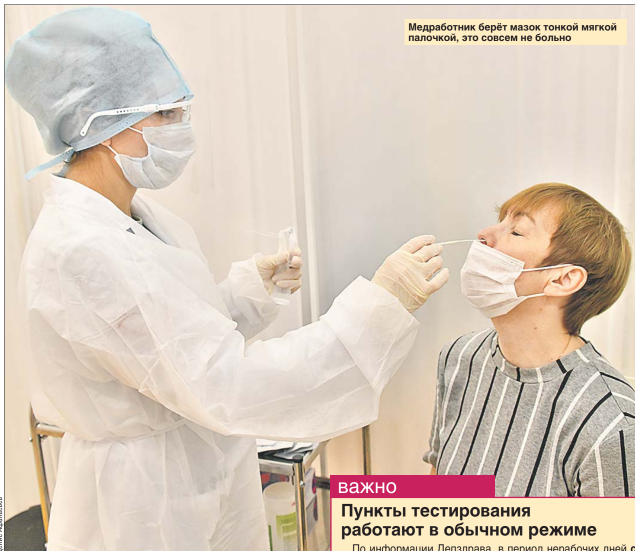
Медработник берёт мазок тонкой мягкой палочкой, это совсем не больно

— Пройти тестирование могут не только взрослые, но и юные пациенты, ведь дети, которые сами в основном переносят COVID-19 легко или бессимптомно, могут заразить пожилых родственников, — объясняет главврач поликлиники №115 Игорь Трусов. — Доступность и простота процедуры позволяют прервать цепочку