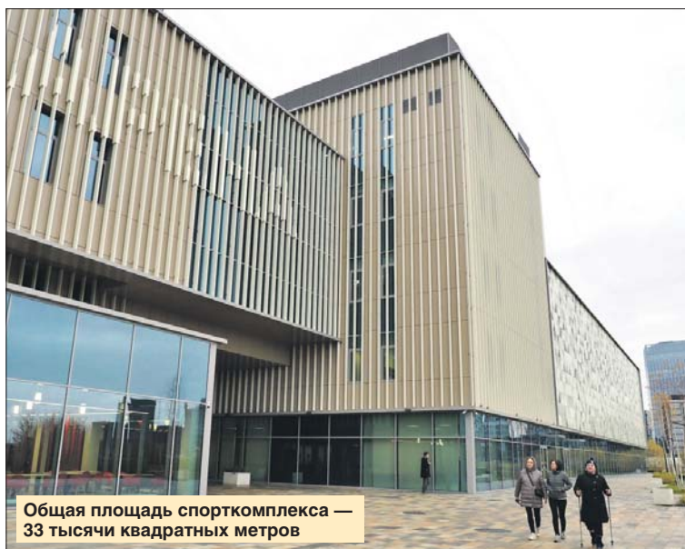
Общая площадь спорткомплекса — 33 тысячи квадратных метров