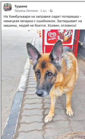
Татуяна Зельнова · 3 дн · G На Химбульваре на заправке сидит потеряшка - немецкая овчарка с шейником. Заглядывает на машины, людей не боится. Хозяин, отзовись!

Об этом сообщает интернет-издание «Наше Северное Тушино» со ссылкой на публикацию в паблике «Тушино» в «Фейсбуке». Неравнодушные пользователи откликнулись на пост, накормили и напоили ов-