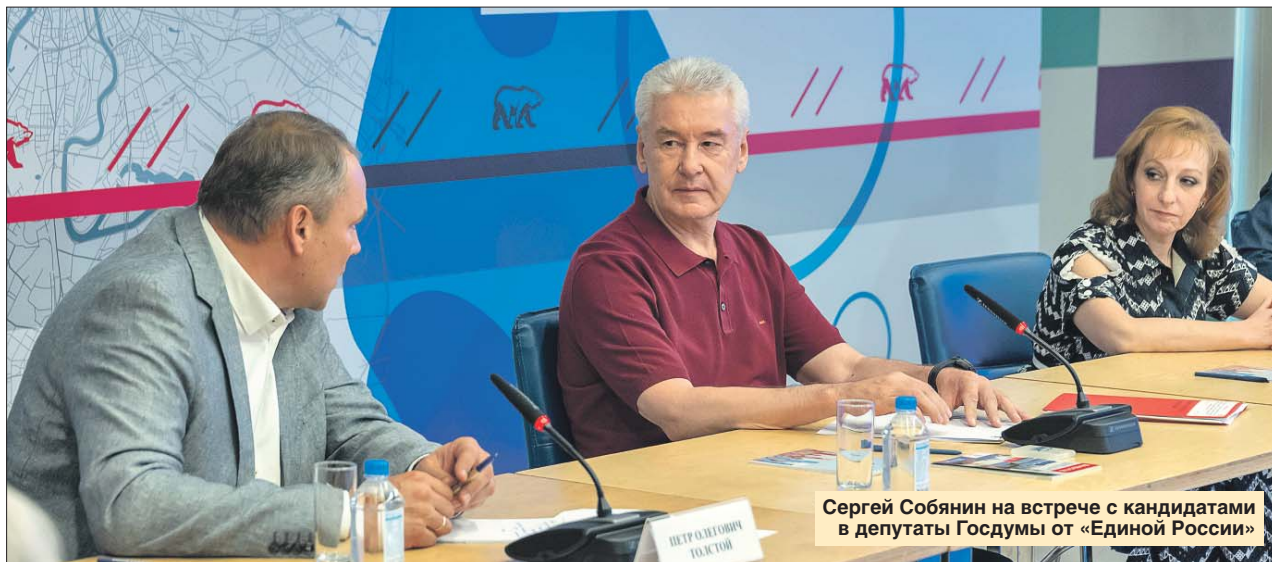
Сергей Собянин на встрече с кандидатами в депутаты Госдумы от «Единой России»

Наибольшие опасения вызывает штамм «Дельта», который в последнее время задавил своим присутствием остальные