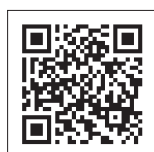
Все новости района: «Наше Северное Тушино»