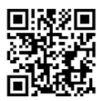
Все новости района: «Куркино»

Об этом рассказывает интернет-издание «Куркино» со ссылкой на паблик «Куркино online» «ВКонтакте». Как сообщил очевидец, водитель машины вез в детский сад детей, в столб он въехал по невнимательности. К счастью, в ДТП никто не пострадал.