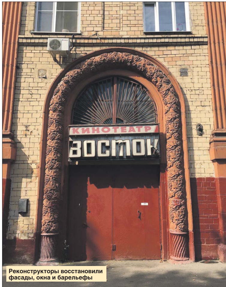
Реконструкторы восстановили фасады, окна и барельефы

В 2014 году дряхлеющий кинотеатр был передан в ведение ГБУ «Московское агентство по развитию территорий» (Мосарт). Предполагалось, что здесь будет создан мультисервисный центр, который знакомил бы жителей и гостей района с искусством анимации. Но и эта попытка не привела к успеху. Казалось, не поможет