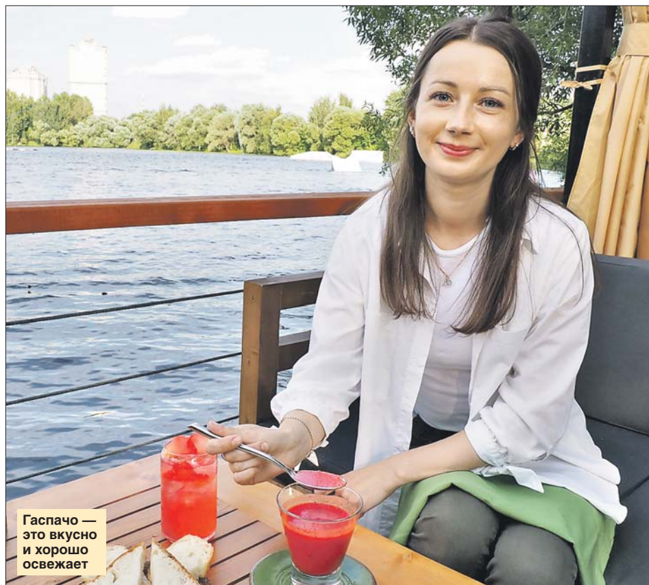
Гаспачо — это вкусно и хорошо освежает

Шеф-повар из Митина рассказал о холодных супах