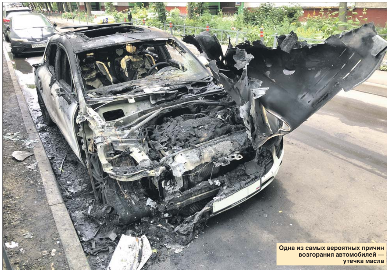
Одна из самых вероятных причин возгорания автомобилей — утечка масла

Отчего загораются машины и как предупредить проблему