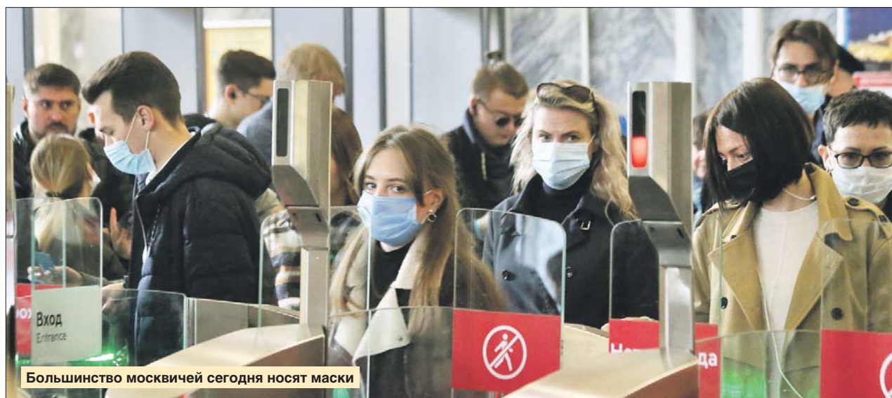
Большинство москвичей сегодня носят маски

Эффект от ношения маски изучили учёные Гонконгского университета. Группа испытуемых, болевших ОРВИ и