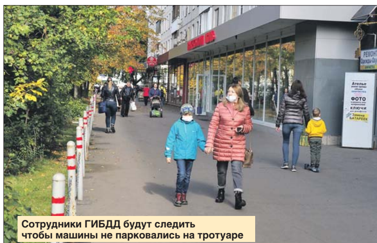
Сотрудники ГИБДД будут следить чтобы машины не парковались на тротуаре

— Сотрудники «Жилищника» очистили от мусора козырьки над нежилыми помещениями первого этажа дома на Планерной, 12, корпус 1, — сообщили в управе района Северное Тушино.