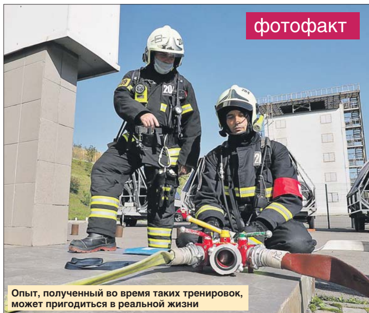
Опыт, полученный во время таких тренировок, может пригодиться в реальной жизни