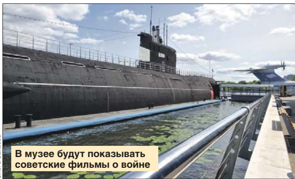
В музее будут показывать советские фильмы о войне

На подводной лодке-музее Б-396 «Новосибирский комсомолец», что стоит у причала в парке «Северное Тушино», 8 октября стартует цикл кинопоказов, посвящённых 75-летию Победы.