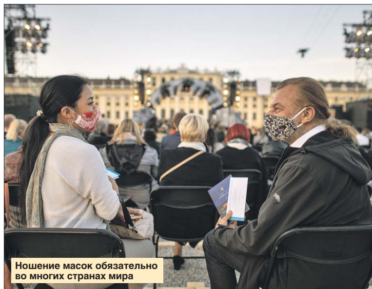
Ношение масок обязательно во многих странах мира

В Южной Корее с конца сентября возобновилась работа школ и детских садов в Сеуле и в других городах, но часть учеников продолжают онлайн-обучение. В начальных и средних классах ограничено количество детей — не более 1/3 обычной наполняемости, а в старшей