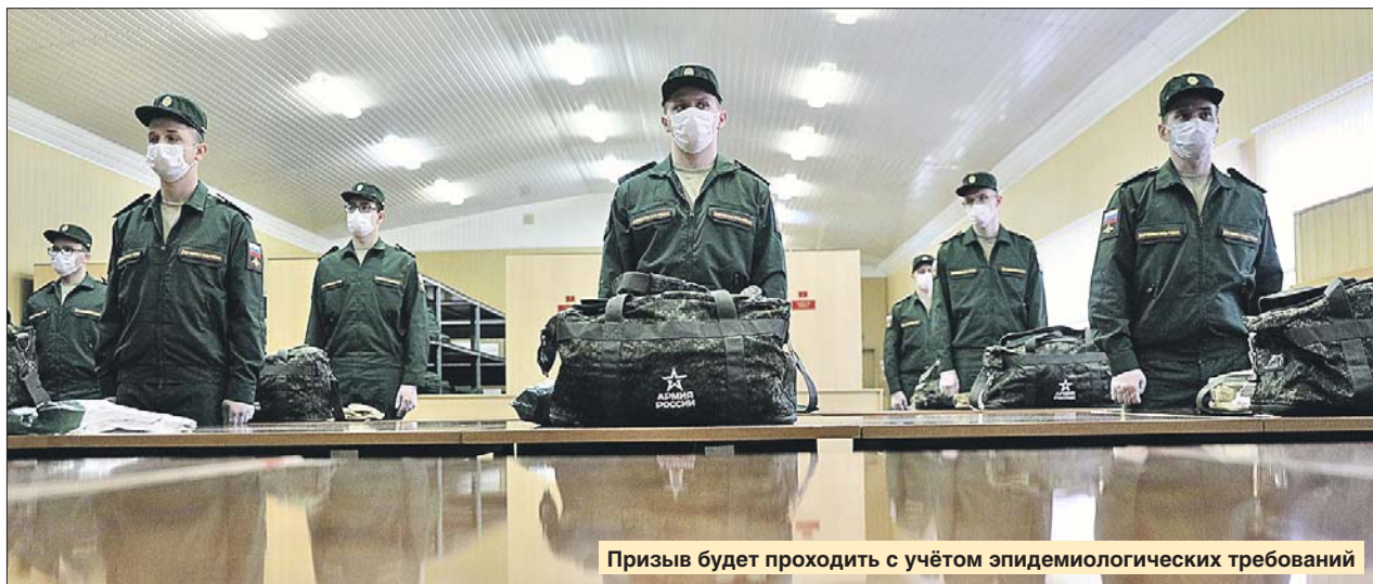
Призыв будет проходить с учётом эпидемиологических требований

В военкомат юношей приглашают небольшими группами