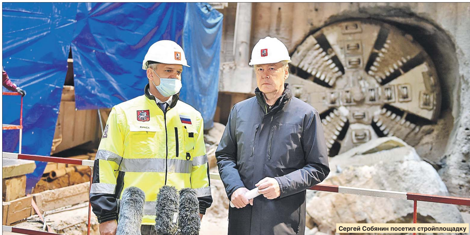
Сергей Собянин посетил стройплощадку

Строить левый перегонный тоннель северо-восточного участка БКЛ начали в июне 2017 года. И за три года полностью завершили проходку на этом участке. Для прокладки тоннеля использовали тоннелепроходческий механизированный комплекс «Татьяна», изготовленный в Германии. Стартовав с площадки на Семёновской набережной за станцией «Лефортово», щит прошёл под действующей станцией метро «Сокольники» и одноимённым парком, а также под железнодорожными путями. На этих участках во время работы комплекса были приняты дополнительные меры для безопасности метро и железнодорожного транспорта. Конечная точка пути расположена на глубине 45 метров недалеко от будущей станции БКЛ «Рижская», где появится крупный транспортно-пересадочный узел. Всего «Татьяна» прошла 4661 метр.