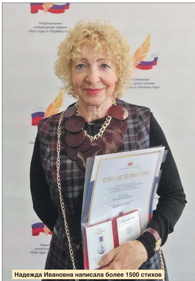
Надежда Ивановна написала более 1500 стихов