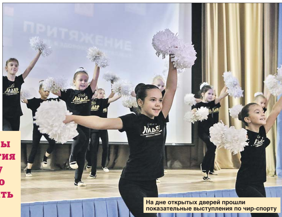
На дне открытых дверей прошли показательные выступления по чир-спорту

В Хорошёво-Мнёвниках открылся центр «Притяжение» для всех поколений