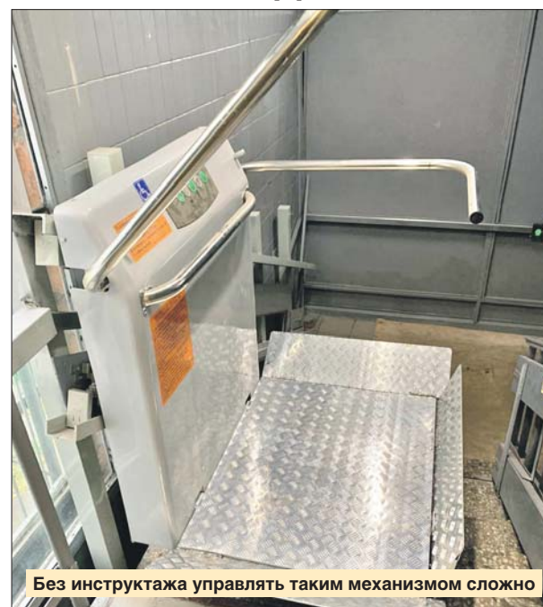
Без инструктажа управлять таким механизмом сложно