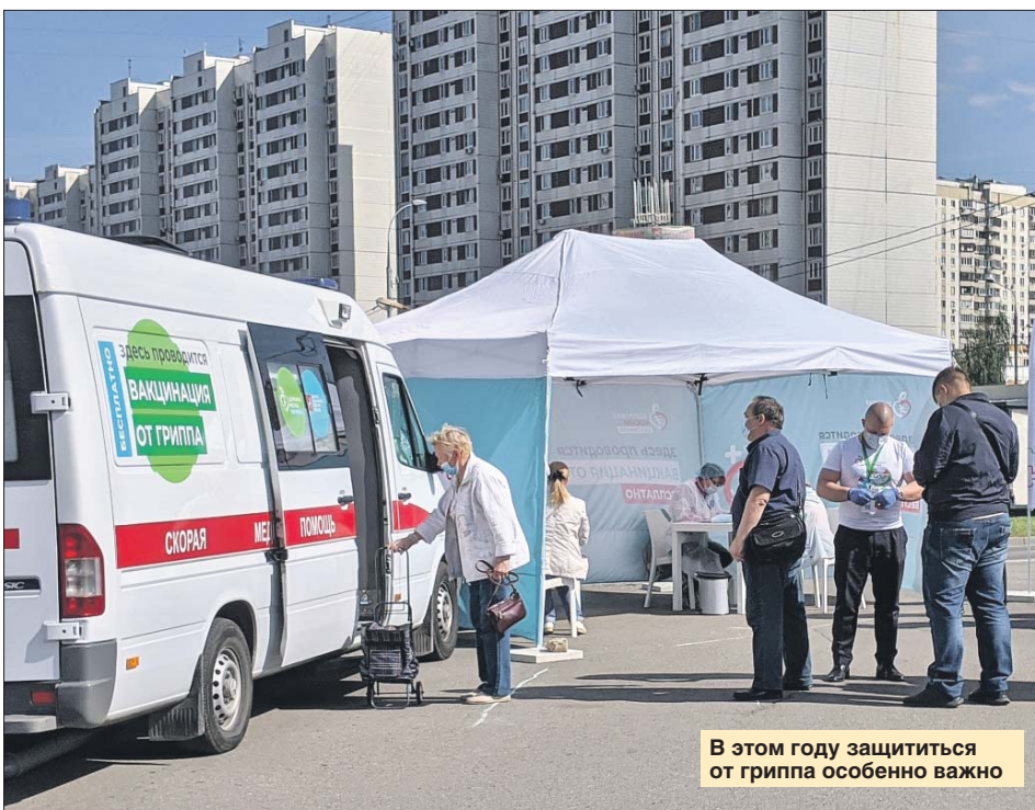
В этом году защититься от гриппа особенно важно

Для удобства жителей в этом году она пройдёт на