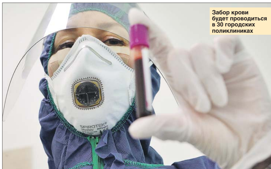
Забор крови будет проводиться в 30 городских поликлиниках

Отдельные детали ещё могут уточняться, но в