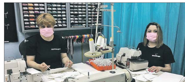
Малое предприятие решило не останавливаться из-за отсутствия заказов на платья