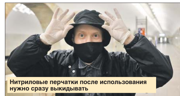
Нитриловые перчатки после использования нужно сразу выкидывать