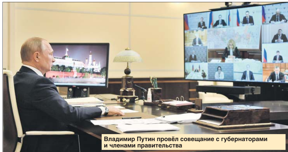
Владимир Путин провёл совещание с губернаторами и членами правительства

Во время совещания Владимир Путин расска-