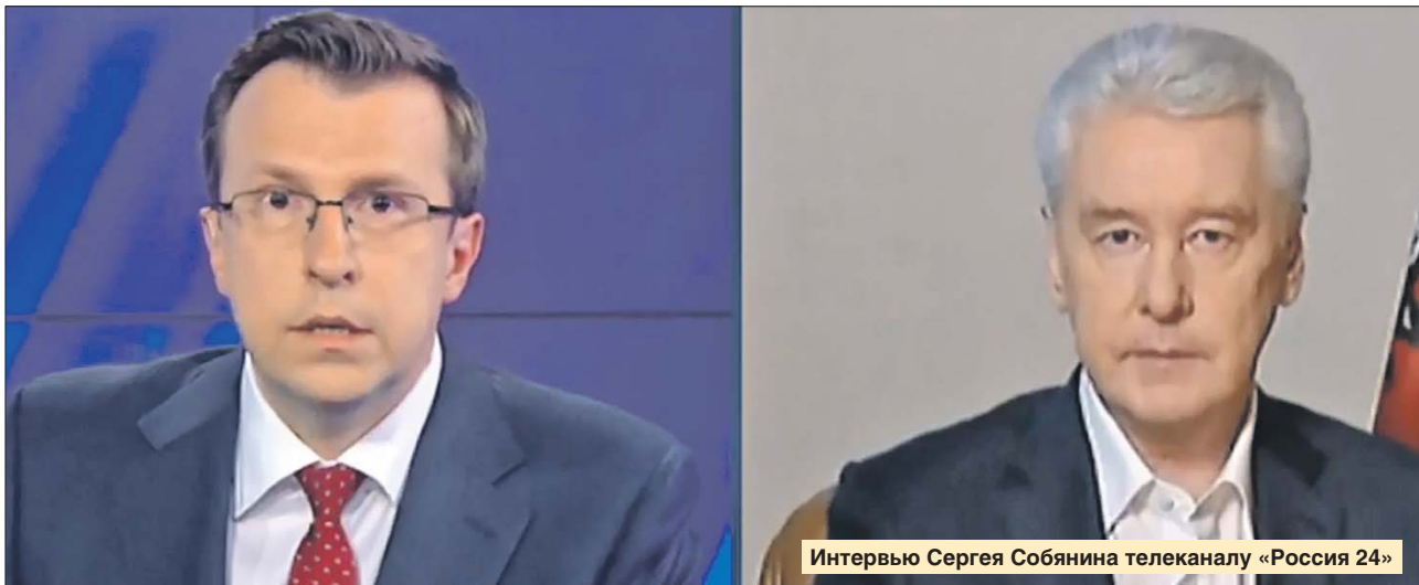
Интервью Сергея Собянина телеканалу «Россия 24»

Снимать ограничения в Москве начнут не раньше конца мая