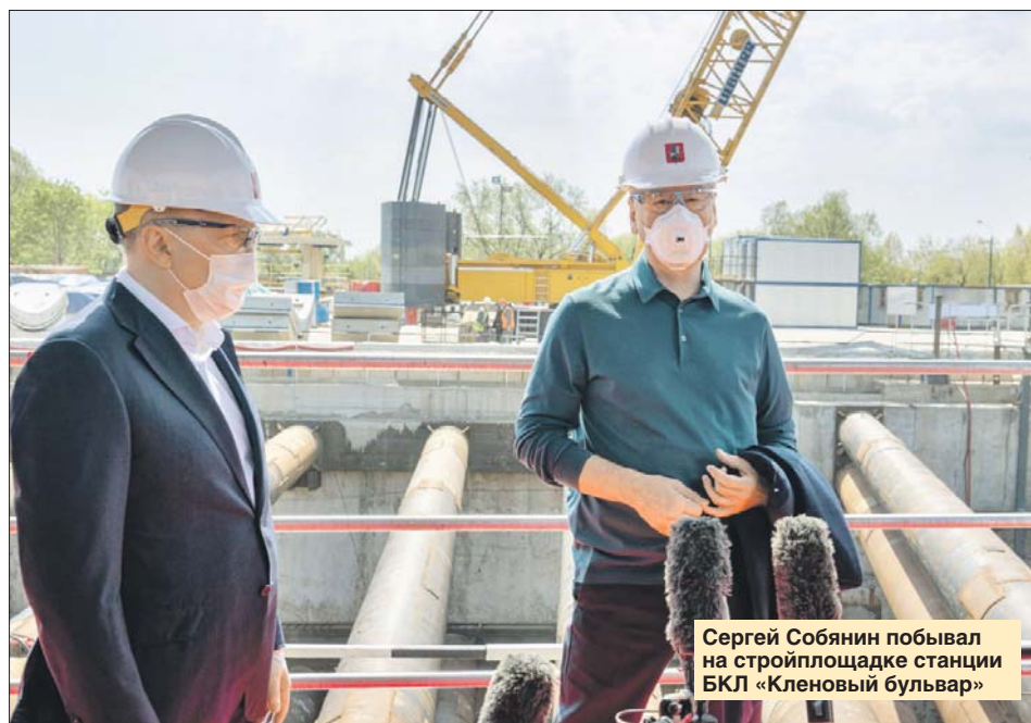
Сергей Собянин побывал на стройплощадке станции БКЛ «Кленовый бульвар»

По словам Сергея Собянина, тщательно взвешены все за и против — 12 мая в нашем городе стар-