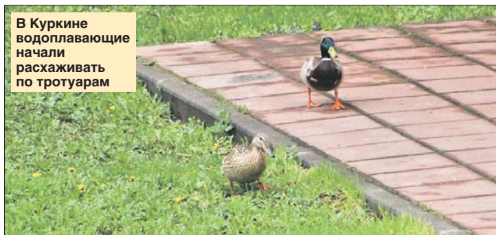
В Куркине водоплавающие начали расхаживать по тротуарам