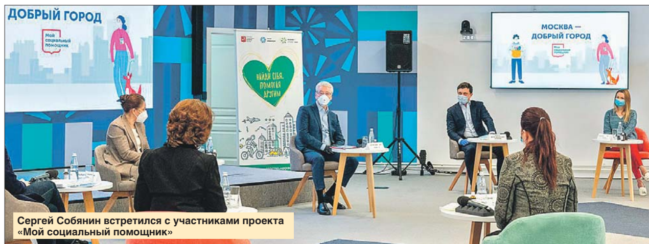
Сергей Собянин встретился с участниками проекта «Мой социальный помощник»

С началом пандемии центры соцобслуживания перевели работу в онлайн-режим, виртуаль-