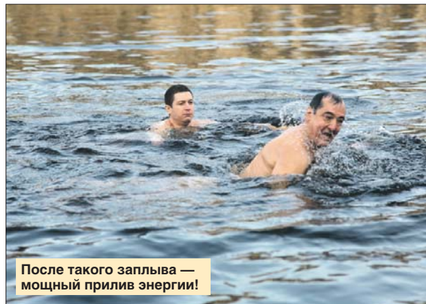
После такого заплыва — мощный прилив энергии!