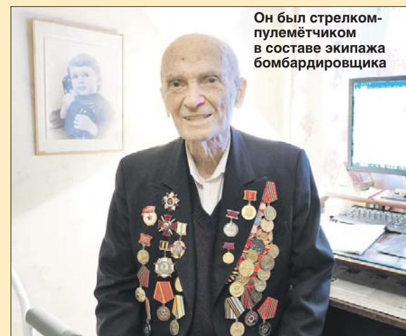
Он был стрелком-пулемётчиком в составе экипажа бомбардировщика