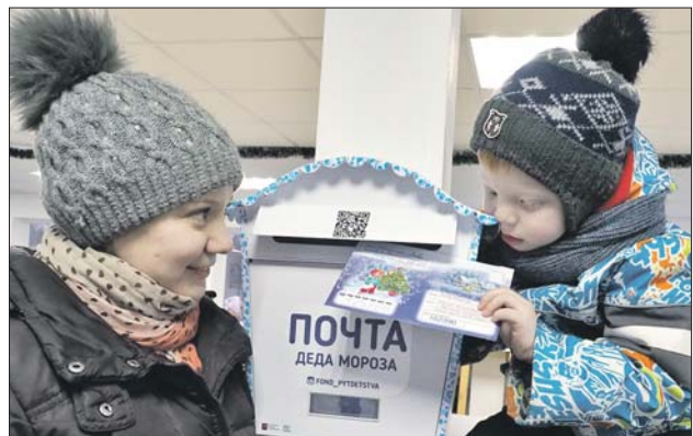
Чтобы получить ответ, надо написать на конверте своё имя и адрес