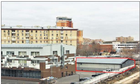
Металлический ангар был возведён в нарушение условий аренды