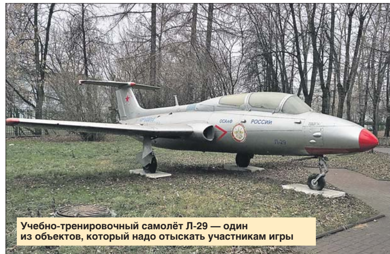
Учебно-тренировочный самолёт Л-29 — один из объектов, который надо отыскать участникам игры

Всего в квесте больше 20 заданий. Путь проходит через стадион «Открытие», Тушинский тоннель, над шлюзами канала им. Москвы и приводит в парк «Покровское-Стрешнево».