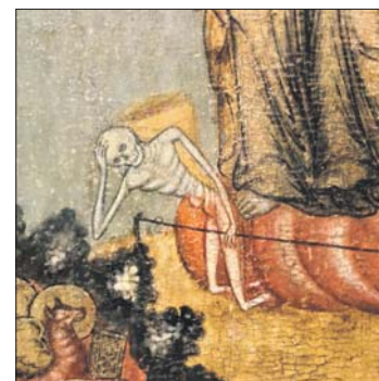
На вологодской иконе XVIII века побеждённая Христом смерть закручинилась у ног Спасителя

Подобное публичное зрелище было немыслимо в России. Даже неистовые новации Петра, который умел по-азиатски отсекал головы и по-европей-