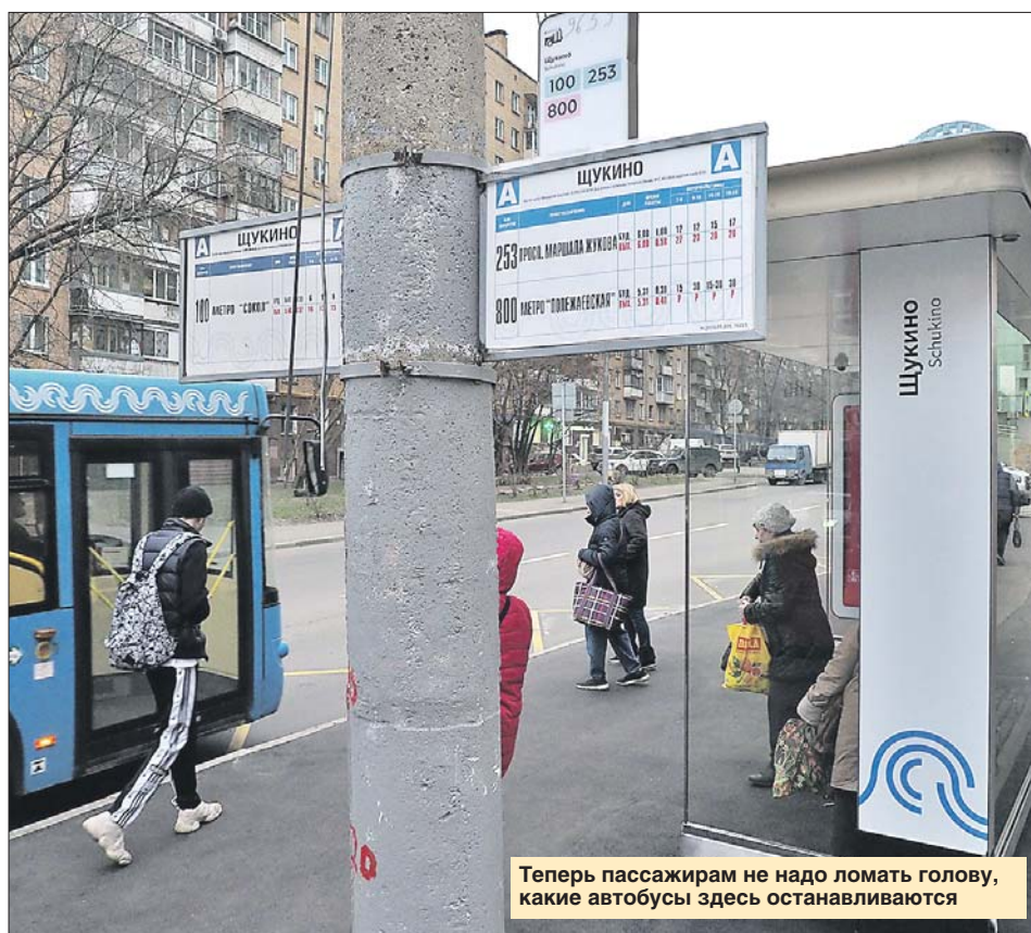
Теперь пассажирам не надо ломать голову, какие автобусы здесь останавливаются