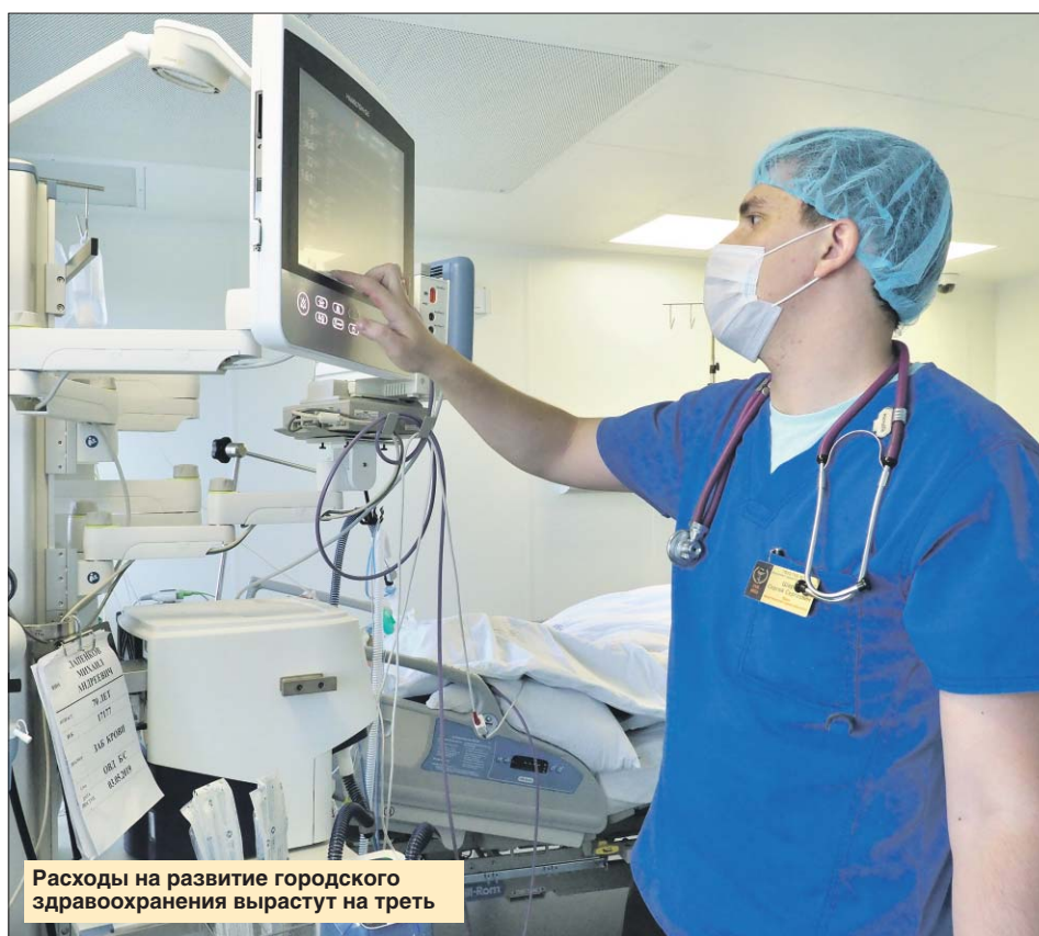
Расходы на развитие городского здравоохранения вырастут на треть

По словам столичного градоначальника, муниципальные депутаты, представители партий и общественных организаций, а также жители столицы внесли в проект большое количество поправок. Все они были обсуждены, и власти города смогли найти ресурсы для увеличения расходов по некоторым при-