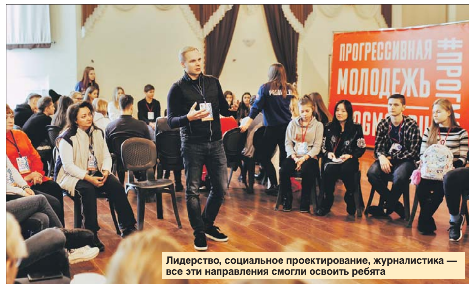
Лидерство, социальное проектирование, журналистика — все эти направления смогли освоить ребята