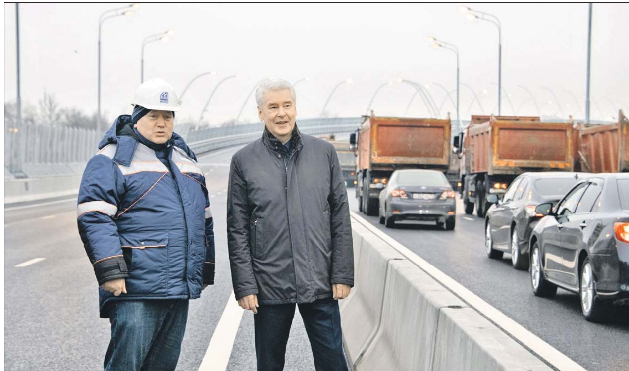
Сергей Собянин отметил, что новый мост даёт водителям возможность полноценно пользоваться Северо-Западной хордой

— Сегодня этот уникальный для страны с точки зрения инжене-