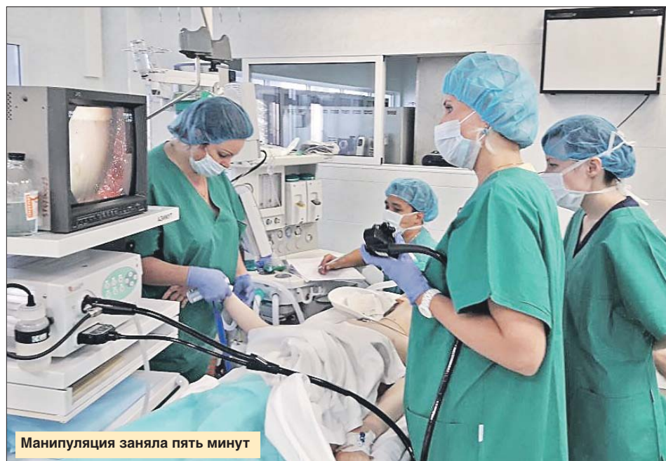
Манипуляция заняла пять минут

— В момент проглатывания инородного тела у детей дошкольного возраста возникает испуг, который может выра-