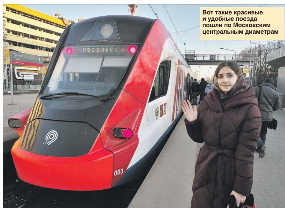
Вот такие красивые и удобные поезда пошли по Московским центральных диаметрам

Кстати, МЦД и работает в режиме подземки: с 5.30 до 1.00.