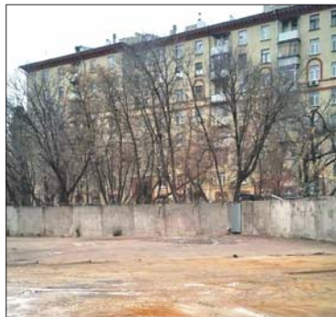
Сейчас участок освобождён