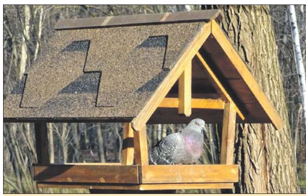
Выгнав синиц и воробьёв, птица заняла всю кормушку