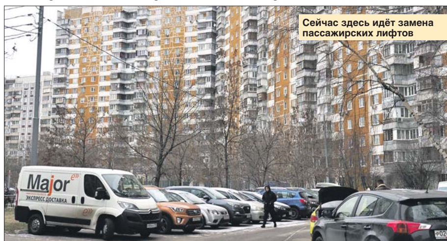
Сейчас здесь идёт замена пассажирских лифтов

Управа района Митино: ул. Митинская, 35, тел. (495) 751-1492. Эл. почта: mitino@ru.mos.ru. ГБУ «Жилищник района Митино»: Пятницкое ш., 23, тел. (495) 753-1222. Эл. почта: gbu-mitino@mail.ru