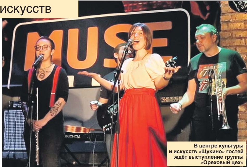
В центре культуры и искусств «Щукино» гостей ждёт выступление группы «Ореховый цех»

В доме культуры «Берендей» пройдёт фестиваль детской книги «Пиши/Рисуй!». С 18.00 до 21.00 посетителей ждут встречи с детскими писателями, музыкантами и иллюстраторами.