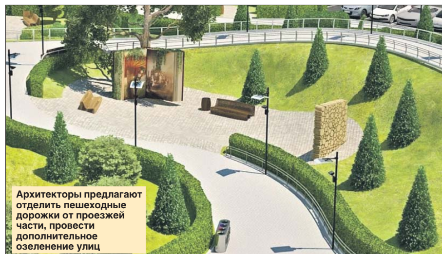
Архитекторы предлагают отделить пешеходные дорожки от проезжей части, провести дополнительное озеленение улиц