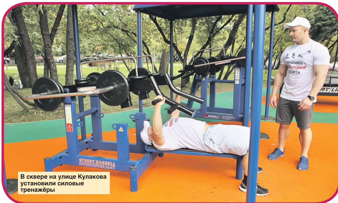
В сквере на улице Кулакова установили силовые тренажёры