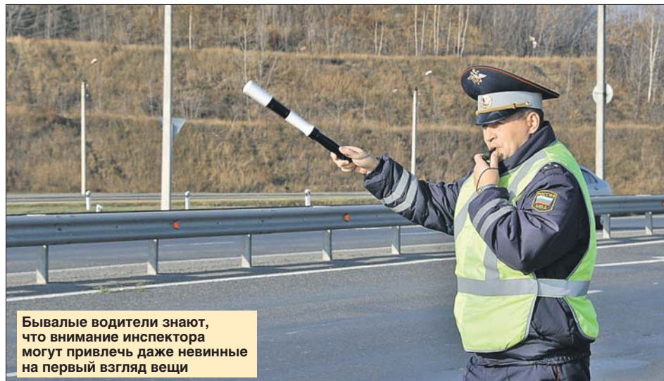
Бывалые водители знают, что внимание инспектора могут привлечь даже невинные на первый взгляд вещи

Впрочем, даже если у вас новое авто, но на кузове вмятины, будьте готовы остановиться. Сотрудник ГИБДД может