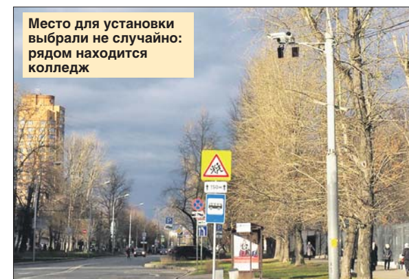
Место для установки выбрали не случайно: рядом находится колледж

Новый комплекс фотовидеофиксации установили у пересечения улиц Фабрициуса и Сходненской в Южном Тушине. Как сообщили в Центре организации дорожного движения г. Москвы, камера «видит» превышение скоростного режима и нарушение требований разметки.