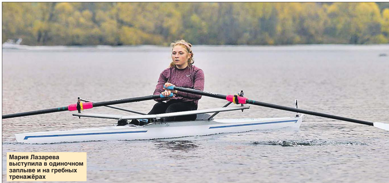
Предоставлено спортивной №26