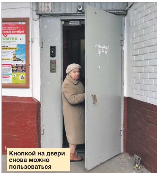
Кнопкой на двери снова можно пользоваться

ГБУ «Жилищник района Щукино»: ул. Маршала Соколовского, 2, тел. (499) 194-8637. Эл. почта: help1948637@yandex.ru. Сайт: gbu-shukino.rf