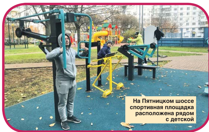
На Пятницком шоссе спортивная площадка расположена рядом с детской