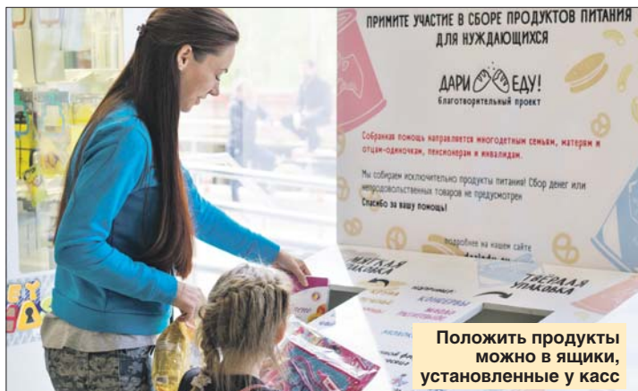
Положить продукты можно в ящики, установленные у касс

Адреса новых боксов: супермаркеты на ул. Твардовского, 2, корп. 4, на Пятницком ш., 29, корп. 2, в Ангеловом пер., 6. Адреса всех боксов смотрите на сайте dariedu.ru