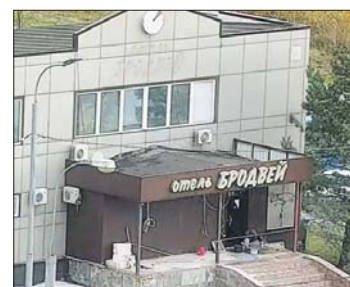
Владелец гостиницы сам демонтировал пристройку