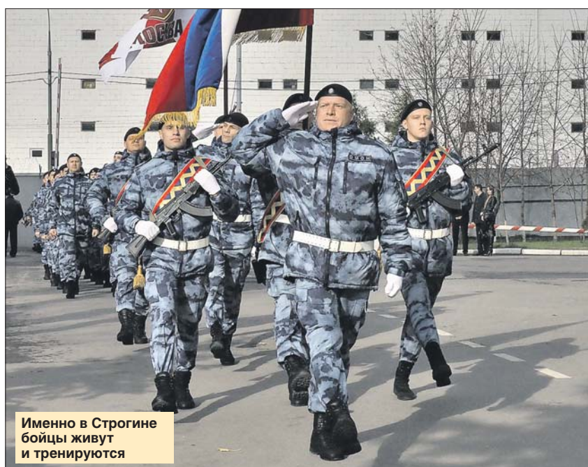
Именно в Строгине бойцы живут и тренируются