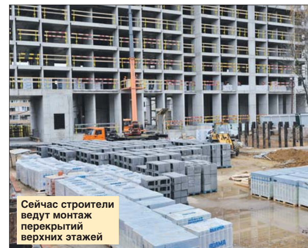
Сейчас строители ведут монтаж перекрытий верхних этажей