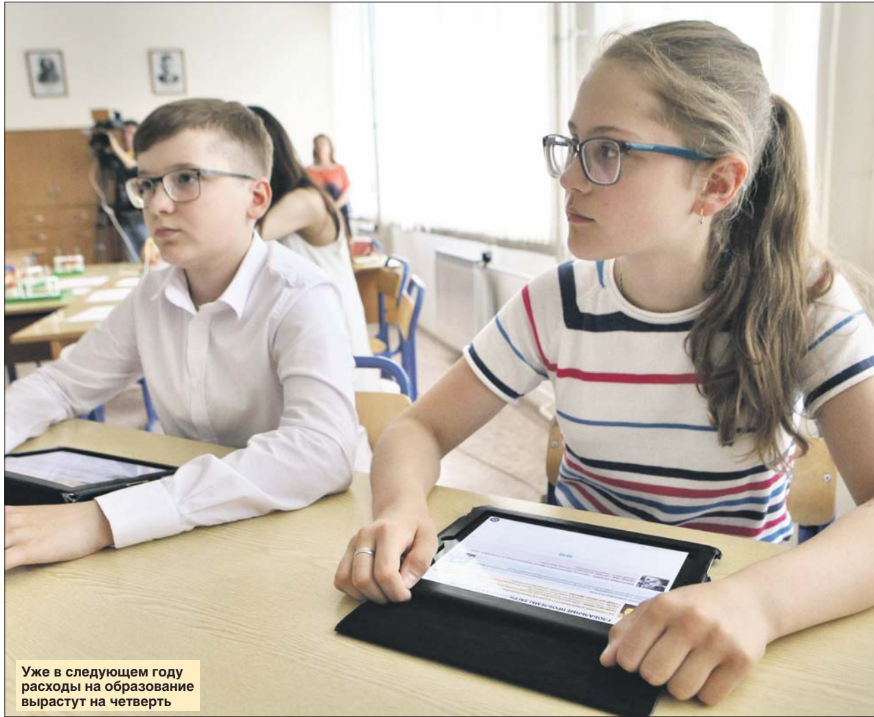
Уже в следующем году расходы на образование вырастут на четверть

Поскольку 1,8 млн москвичей имеют право на получение льготных лекарств, город закупает для них почти 1 тысячу