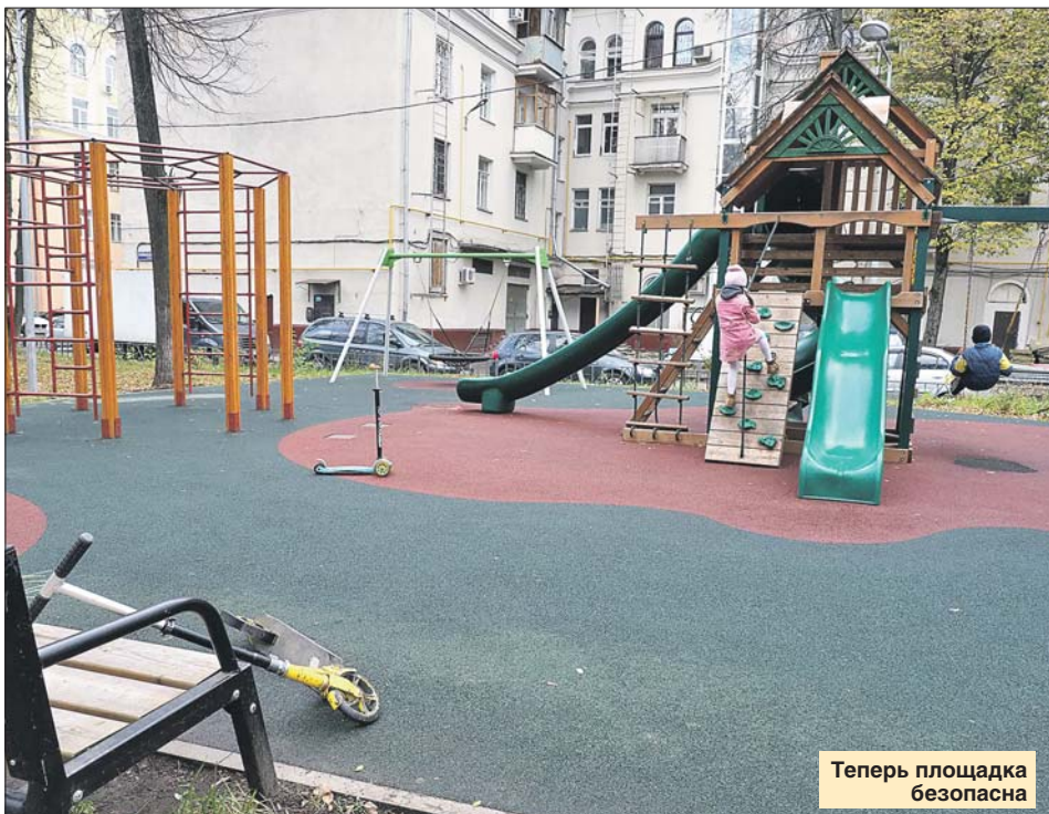
Теперь площадка безопасна

Управа района Щукино: ул. Расплетина, 9, тел.: (499) 194-3651, (499) 197-2917. Эл. почта: shukino-uprava@mos.ru. Сайт: schukino.mos.ru