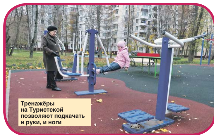
Тренажёры на Туристской позволяют подкачать и руки, и ноги