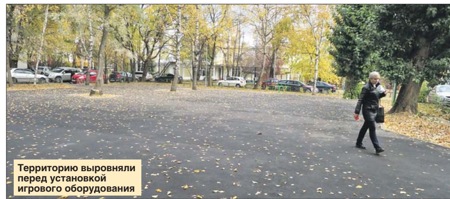
Территорию выровняли перед установкой игрового оборудования

ГБУ «Жилищник района Строгино»: ул. Маршала Катукова, 9, корп. 3, тел. (495) 758-3822. Сайт: gbu-strogino.ru