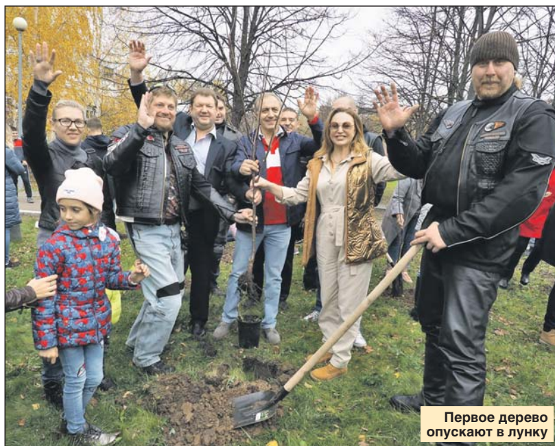
Первое дерево опускают в лунку