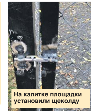
На калитке площадки установили щеколду