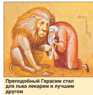
Преподобный Герасим стал для льва лекарем и лучшим другом

Основатель христианской церкви в Древней Ирландии Кевин Глендалохский часто выходил из своего монастыря и долго молился, воздев руки к небу. Однажды на его ладонь сел дрозд. Кевин не шелохнулся. Птичка начала вить гнездо. Кевин глубоко ушёл в молитву. Дрозд нашёл подружку и вскормил птенцов на руке святого. Кевин продолжал молиться, а для укрепления его сил дрозд принёс ему в клюве ягоду.