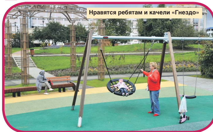
Нравятся ребятам и качели «Гнездо»

В Куркине завершили работы по благоустройству одного из самых масштабных объектов округа — детского парка в 3-м микрорайоне. В рамках программы «Мой район» на площади 4,1 га появились зоны отдыха, амфитеатр, детские и спортивные площадки.