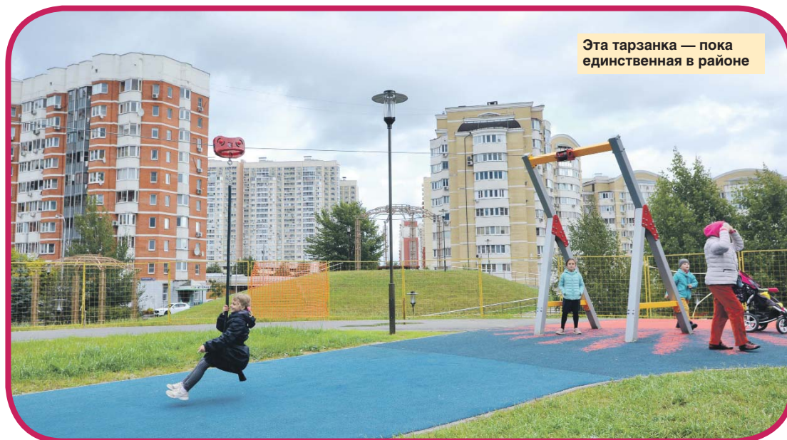
Эта тарзанка — пока единственная в районе