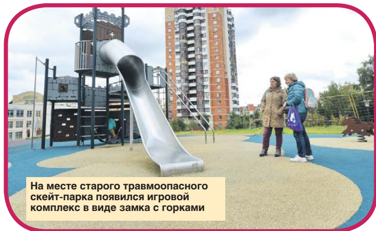
На месте старого травмоопасного скейт-парка появился игровой комплекс в виде замка с горками