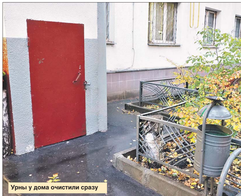
Урны у дома очистили сразу