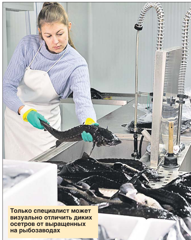
Только специалист может визуально отличить диких осетров от выращенных на рыбозаводах

Остро стоит вопрос об улучшении материально-технического обеспечения проведения экспертизы икры и ценных пород осетровых, изъятых в ходе проверок. Важно, чтобы не только сотрудники правоохранительных органов, проводящие проверки, но и предприниматели могли отличить контрафактную продукцию. Дикие породы рыб и рыба, выращенная в аквакультуре, различаются. Однако если специалист может выявить эти различия визуально, то обычный человек может не понять, что покупает или продаёт рыбу, которая выросла в дикой среде и охраняется законом.