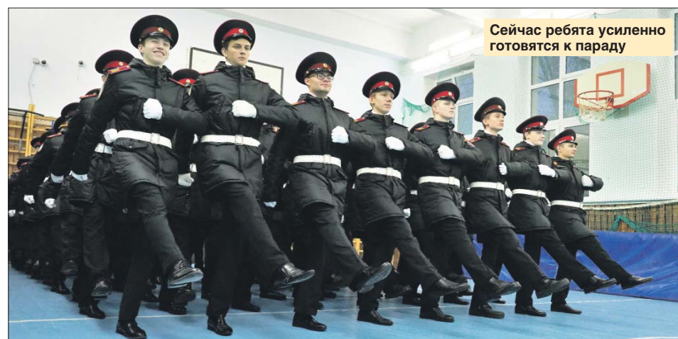
Сейчас ребята усиленно готовятся к параду