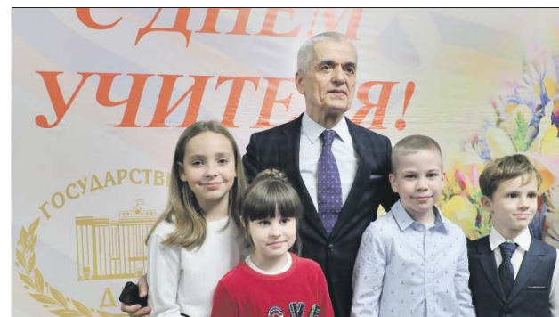
В церемонии открытия выставки детских работ принял участие депутат Госдумы Геннадий Онищенко

Свои работы в Госдуме представили ученики шко-