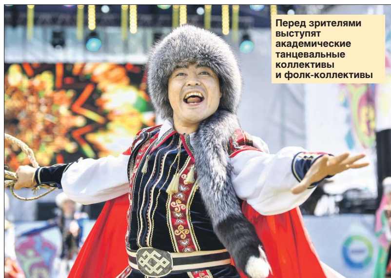
Перед зрителями выступят академические танцевальные коллективы и фолк-коллективы

Так, с 13 по 22 сентября в парке «Зарядье» пройдёт фестиваль Русского географического общества. Здесь можно будет побывать в башкирской юрте и участвовать в мастер-классах. В парке «Красная Пресня» с 17 по 30 сентября будет работать фотовыставка достопримечательностей Башкортостана. А познакомиться с башкирским кинематографом можно будет 19 сентября с 15.00 в кинотеатре «Спутник».