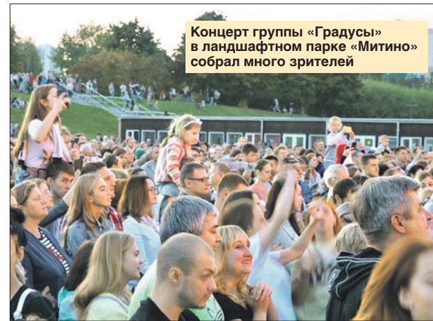
Концерт группы «Градусы» в ландшафтном парке «Митино» собрал много зрителей