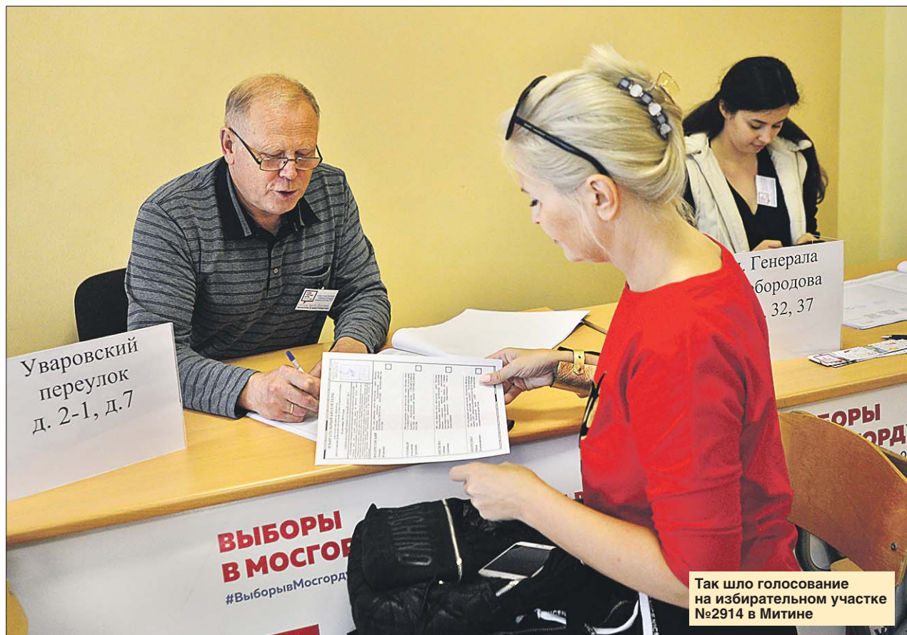
Так шло голосование на избирательном участке №2914 в Митине

Московская городская избирательная комиссия смогла подвести итоги голосования уже к середине понедельника. После обработки протоколов всех избирательных комиссий средняя явка на выборы составила 21,77%. Активность избирателей не намного, но превысила показатель 2014 года, когда москвичи выбрали предыдущий состав МГД. Тогда на избирательные участки пришли 21,04% избирателей. По оценкам экспертов-политологов, такой показатель яв-