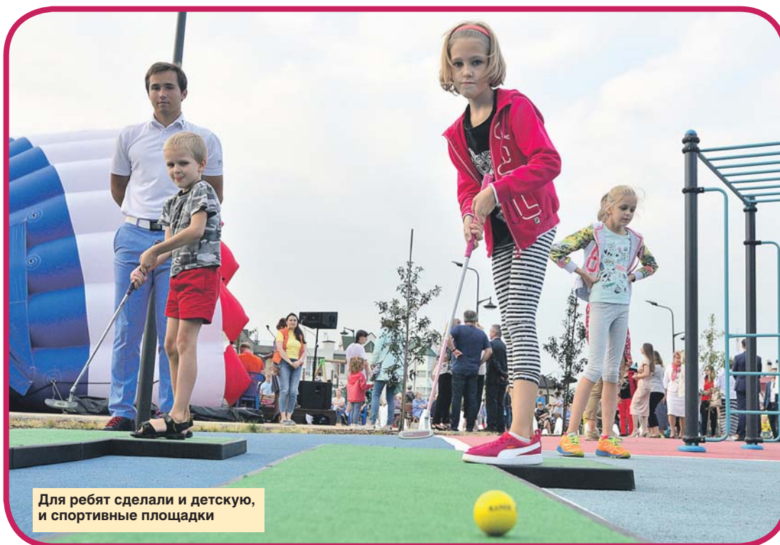
Для ребят сделали и детскую, и спортивные площадки

Здесь есть даже аптекарский огород с полезными травами