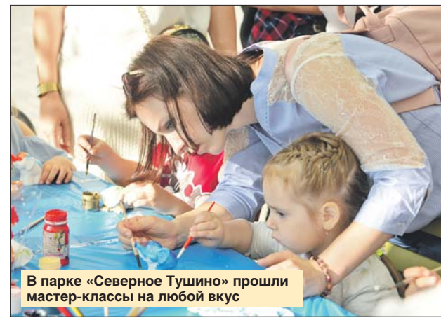
В парке «Северное Тушино» прошли мастер-классы на любой вкус