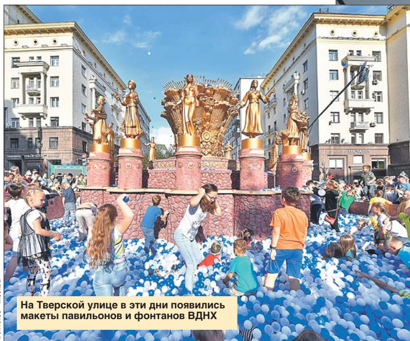
На Тверской улице в эти дни появились макеты павильонов и фонтанов ВДНХ

М осквичи отметили 872-летие столицы. Два дня, 7 и 8 сентября, по всему городу в парках и на площадях, в культурных центрах и на спортплощадках шли праздничные программы. Темой торжества стал 80-летний юбилей ВДНХ.