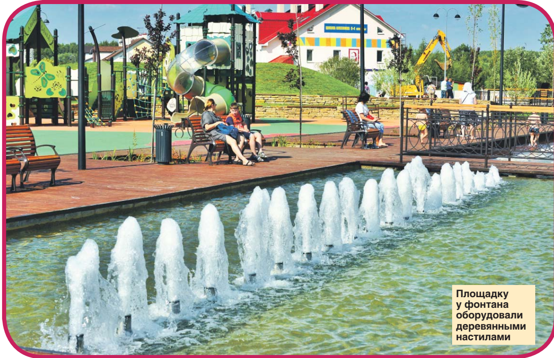
Площадку у фонтана оборудовали деревянными настилами