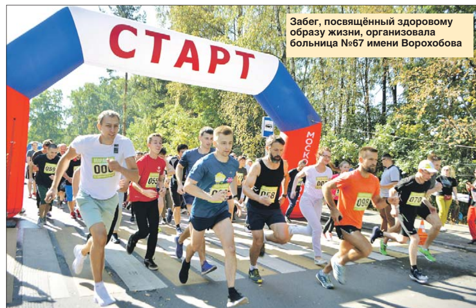
Забег, посвящённый здоровому образу жизни, организовала больница №67 имени Ворохобова

Пресс-служба городской клинической больницы № 67 им. Л. А. Ворохобова