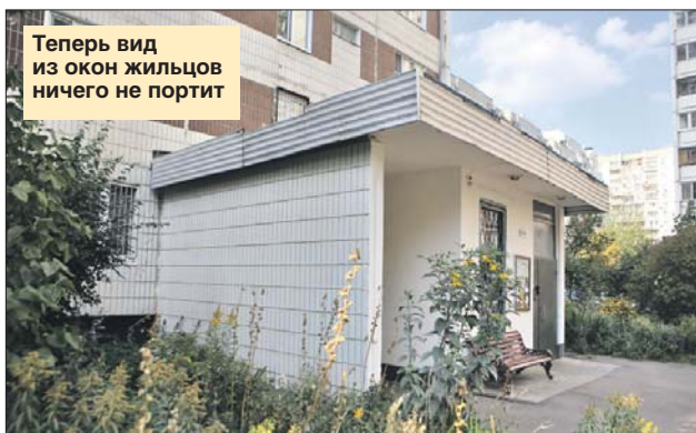
Теперь вид из окон жильцов ничего не портит