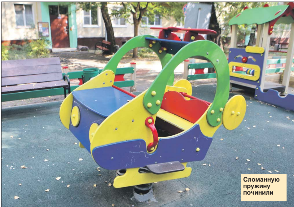
Сломанную пружину починили