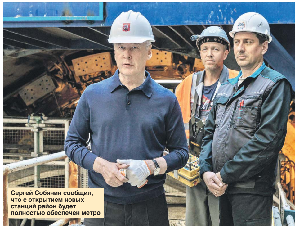
Сергей Собянин сообщил, что с открытием новых станций район будет полностью обеспечен метро

Здесь должны быть построены четыре станции. Станция «Улица Народного Ополчения» строится на пересечении проспекта Маршала Жукова и улицы Демьяна Бедного, станция «Карамышев-