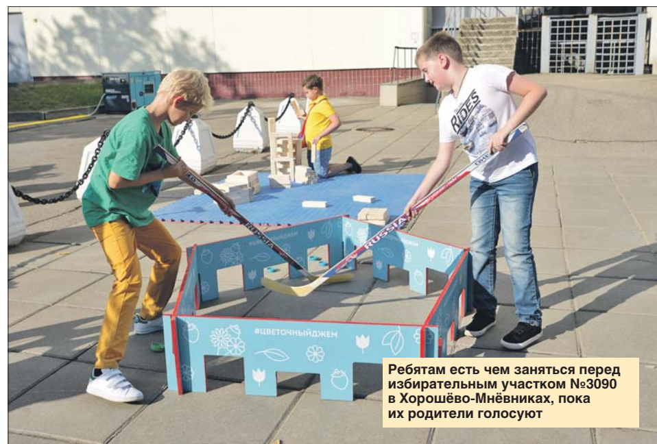
Ребятам есть чем заняться перед избирательным участком №3090 в Хорошёво-Мнёвниках, пока их родители голосуют