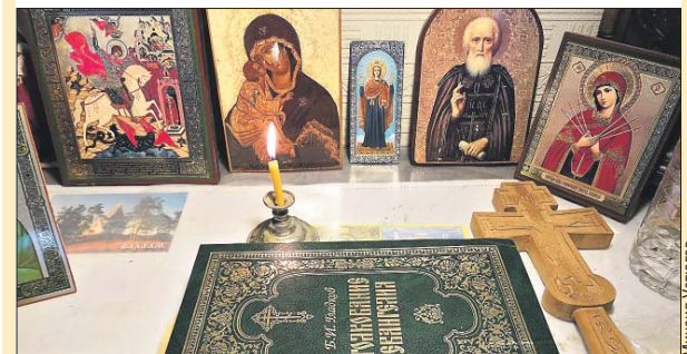
Полный смысл евангельских фраз часто ускользает от современного человека

Да, есть смысл читать толкования, не надеясь на свою догадку. Наташа Ростова тут для нас не пример.