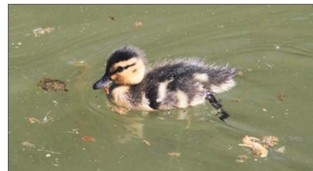
За неделю птенцы вполне освоились на речке