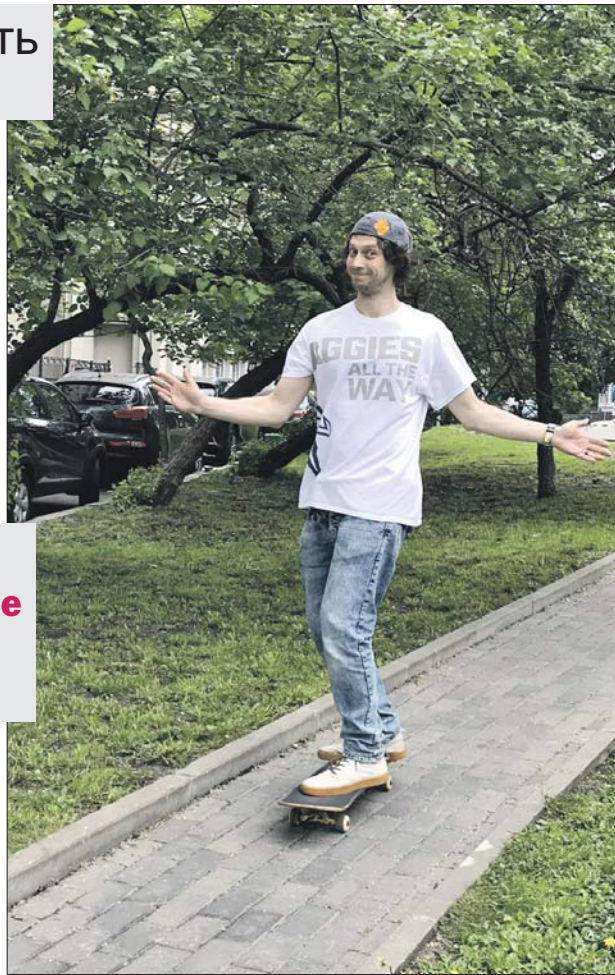
Корреспондент «СЗ» без проблем доехал и до родника, и до магазина