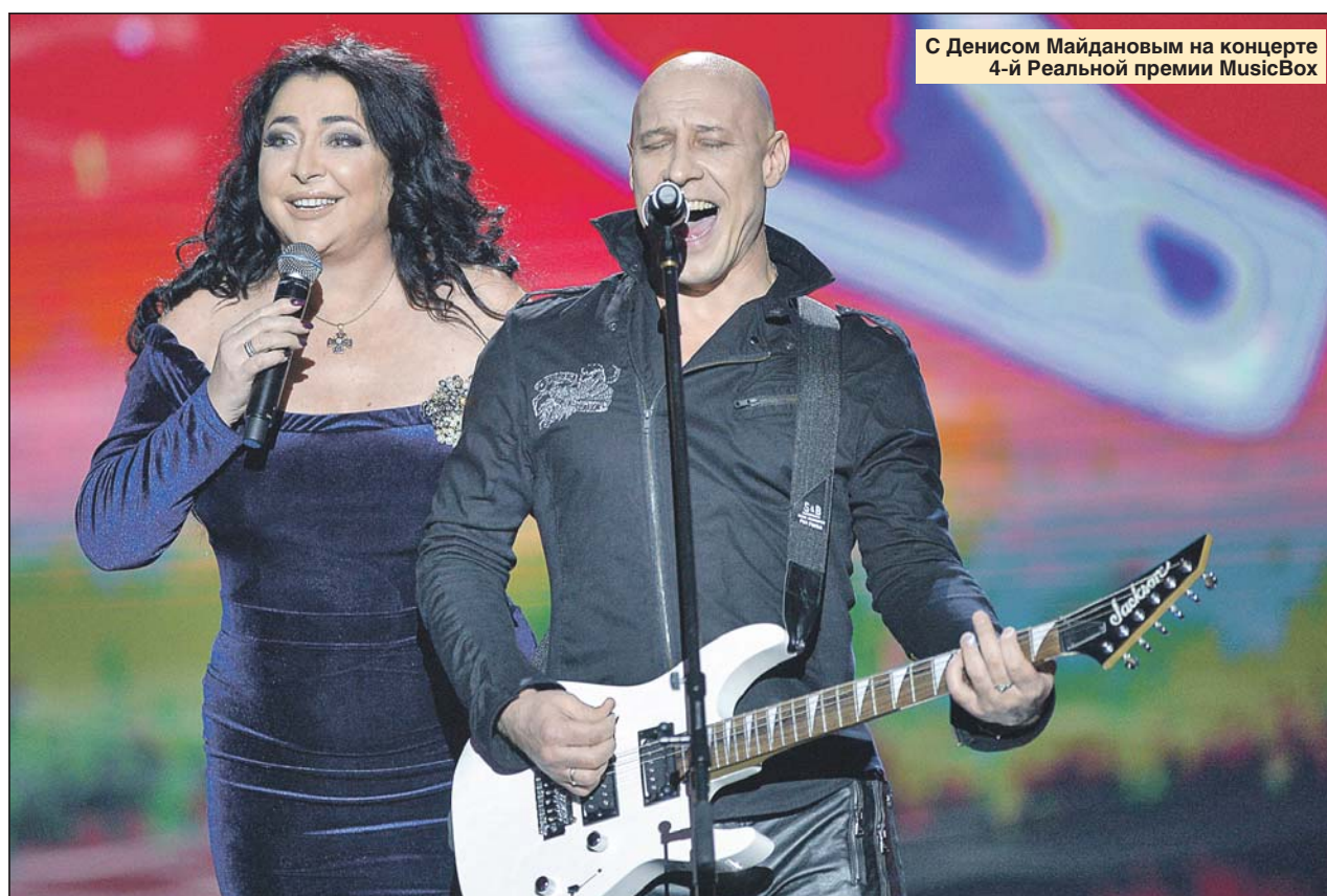
С Денисом Майдановым на концерте 4-й Реальной премии MusicBox

— У меня есть такие вещи от зрителей, которые сопровождали меня в очень тяжёлых жизнен-