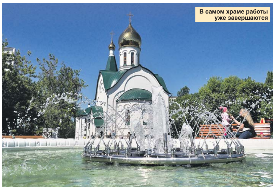
В самом храме работы уже завершаются