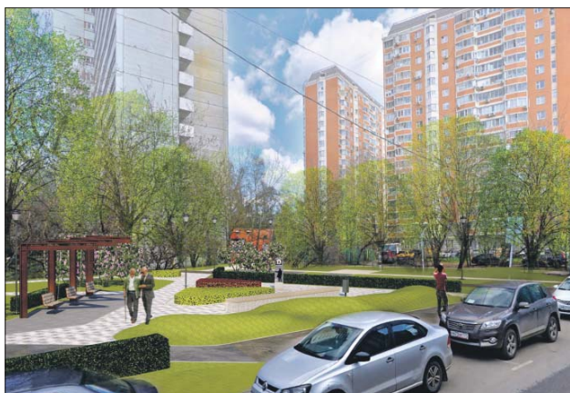
Так будет выглядеть после благоустройства сквер на улице Маршала Тухачевского

Кроме того, на улице Саляма Адила завершается реконструкция Государственного научно-исследовательского центра колопроктологии. Здание расширили и адаптировали для людей с ограниченными возможностями здоровья.