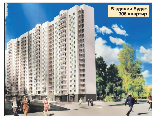
В здании будет 306 квартир