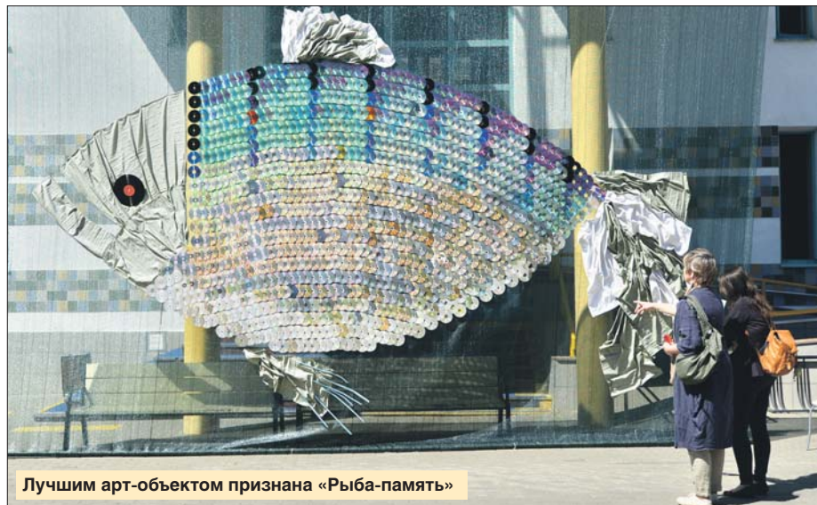
Лучшим арт-объектом признана «Рыба-память»