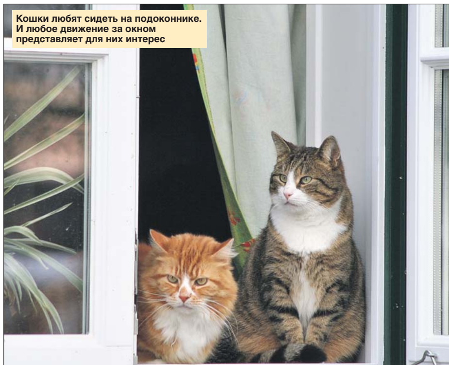
Кошки любят сидеть на подоконнике. И любое движение за окном представляет для них интерес

Вопреки расхожим представлениям, при прыжке кошка далеко не всегда приземляется на лапы, травмы при падении совсем не редкость. Чаще всего это переломы, черепно-мозговые травмы, ушибы, разрывы внутренних органов. Самые тяжёлые травмы