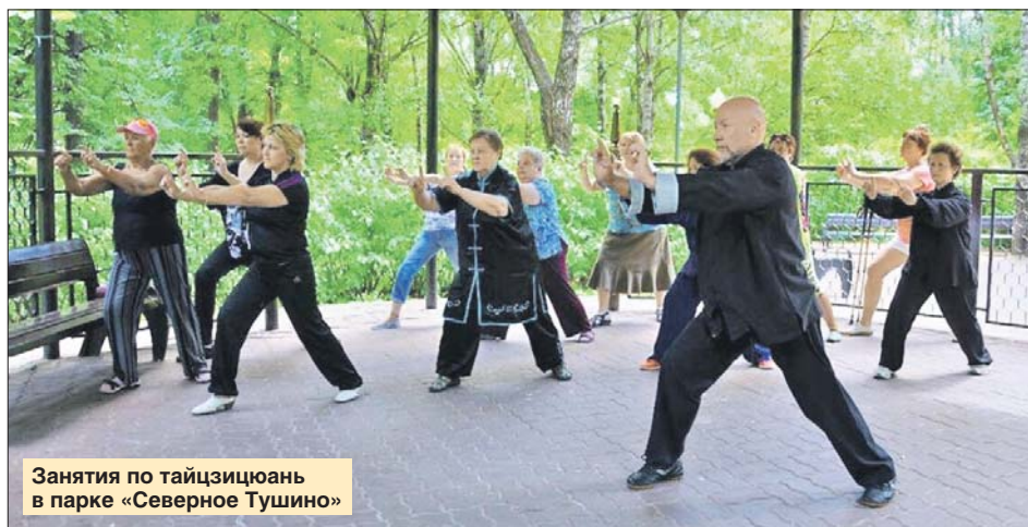
Занятия по тайцзицюань в парке «Северное Тушино»

— Встретить лето можно будет на двух площадках парка: на Археологической площади (Новотушинский пр., 5, стр. 1) аниматоры проведут программу со спортивными