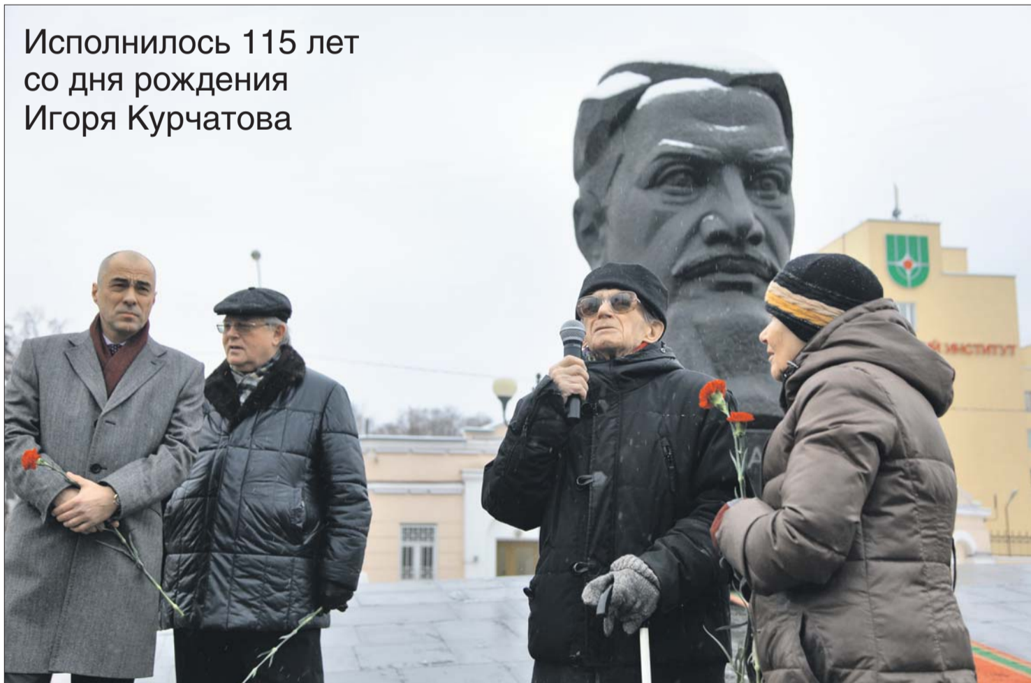
Торжественный митинг у здания НИЦ «Курчатовский институт» в районе Щукино

Исполнилось 115 лет со дня рождения Игоря Курчатова