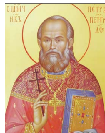
Из архива редакции

В тот же день патриарх Тихон обратился к революционерам: «Опомнитесь, безумцы, прекратите ваши кровавые расправы! Запрещаем вам наступать к Тайнам Христовым, анафематствуем вас...» Однако слова «большевики» в послании нет. Святитель подчёркнуто дистанцировался от политики, партий, идеологий. Он отлучал от Церкви не за убеждения, а за преступные действия. Он ставил каждого