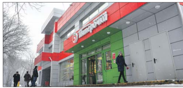
Многие нужные продукты в этой «Пятёрочке» находятся как раз на 2-м этаже

— Сбой в работе нового лифта — обычное дело.