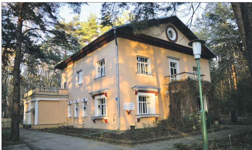
Игорь Васильевич работал в этом доме с 1946 по 1960 год, до самой смерти

— Игорь Васильевич умел отдыхать культурно, в меру, — рассказывает директор музея. — Однажды он прогуливался с женой по набережной Москвы-реки. Курчатов ходил с тростью, носил пальто до пят, шапку-пирожок и имел длинную бороду. К нему подошёл пожилой мужичок и, приняв за священника, спросил, в каком храме он служит. «А, наверное, судя по внешнему виду, в Ело-