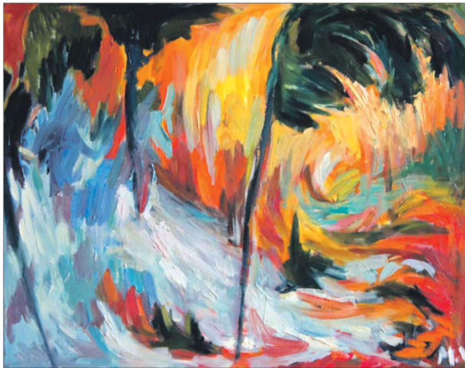
Их работы находятся в музеях и частных коллекциях во многих странах