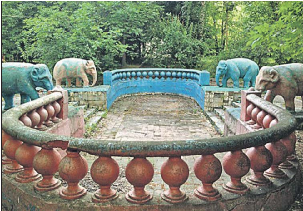
Детский садик №333 на улице Маршала Василевского был построен в 1934 году. Здание возведено по уникальному проекту, в котором объединены два стиля — конструктивизм и сталинский ампи́р

— Этот детский садик знаменит не только как памятник архитектуры, но и как пример активной позиции местных жителей. Дискуссия на предмет его судьбы была очень