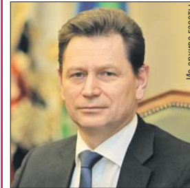
Из архива газеты