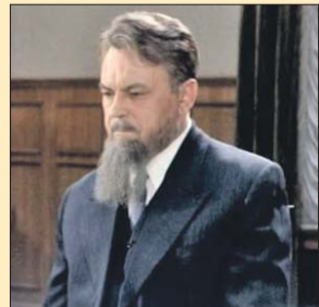
Курчатова сыграл Сергей Бондарчук