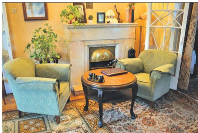
В музее полностью сохранена обстановка, как было при жизни учёного

ховском или в Загорске?» — предположил он и стал жаловаться на попа из своей местной церкви, что тот не знает меры в алкоголе, потому что, мол, «за людей переживает». На что Курчатов ответил: «Я тоже за людьми переживаю, но меру знаю».