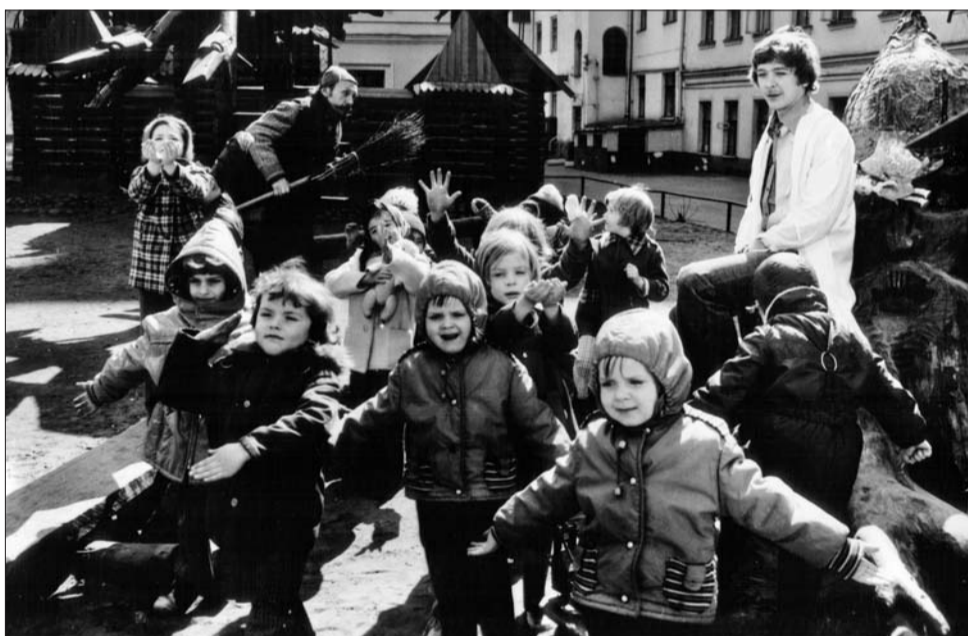
На съёмках фильма «Усатый нянь» один из мальчиков попросил актёра назваться его папой

от мужчин на шикарный остров в параллельном мире под названием Матри, а мужчины оказываются на острове Архат. Немножко затронул и тему России и Украины. Мне хотелось провести мысль: чего ругаться-то? Только хуже будет. Жизнь всё равно короче, чем мы думаем. Премьера запланирована на февраль.