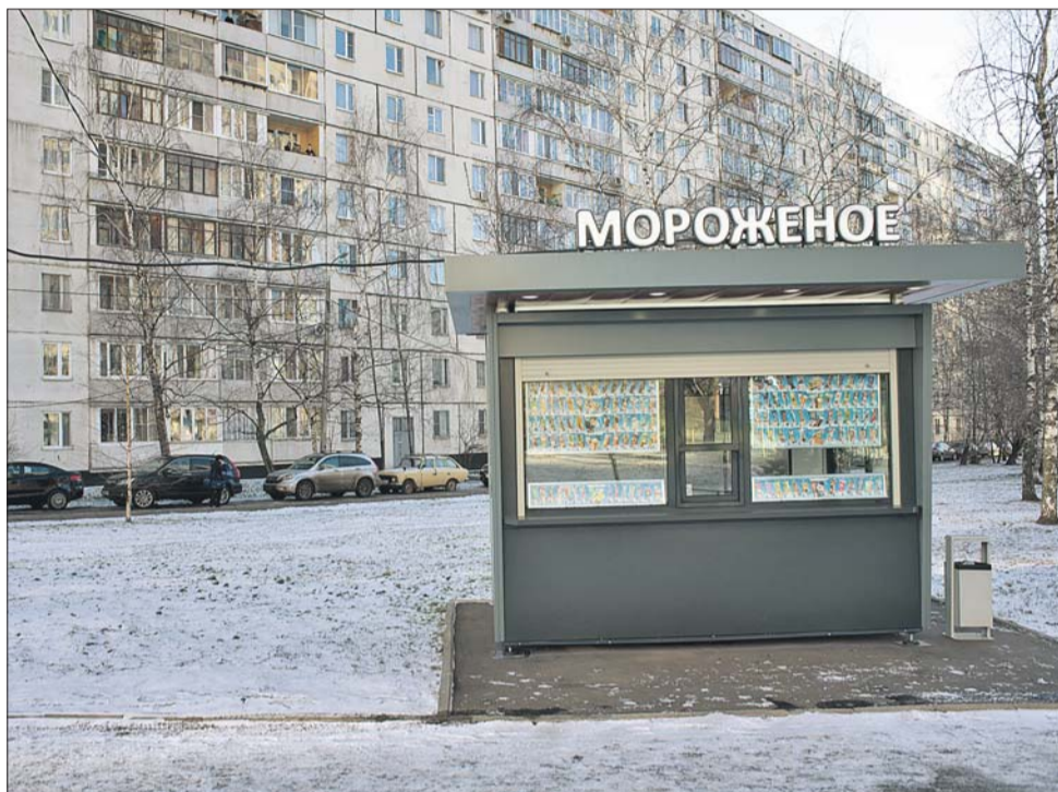
Адрес киоска одобрили муниципальные депутаты, а точку доступа подключения дало ОАО «МОЭСК»

Чьи киловатты потребляет киоск «Мороженое» на улице Твардовского?