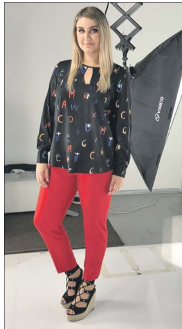
И это даёт ей возможность неплохо зарабатывать