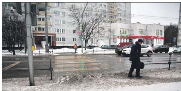
Вопрос о расширении тротуара рассмотрят на окружной комиссии по безопасности движения

— Данный участок улично-дорожной сети находится в эксплуата-