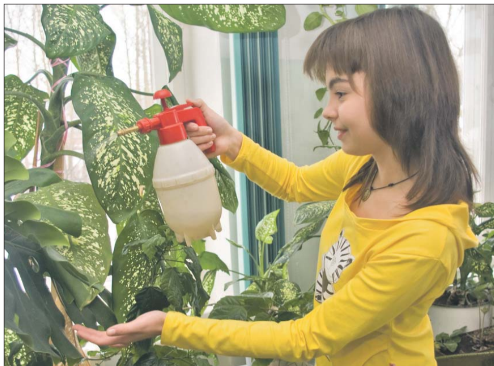
Диффенбахия прекрасно поглощает вредные вещества из воздуха и насыщает атмосферу фитонцидами

Комнатные растения создают не только красоту и уют