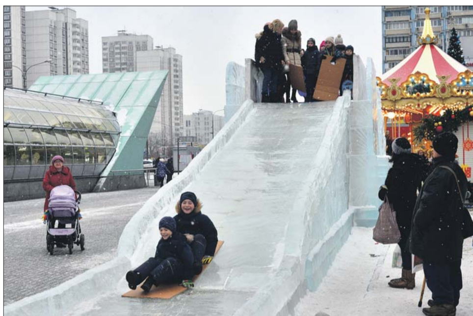
Ледяная горка на Строгинском бульваре полюбилась детворе

Но жители округа приходили на фестиваль не только за покупками, но в основном за развлече-