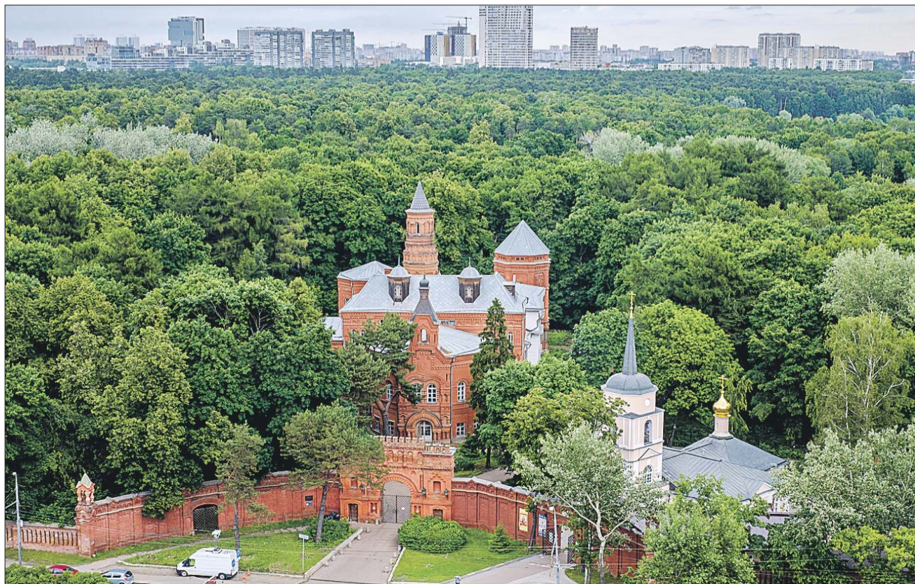
Усадьба Покровское-Стрешнево, переданная в 2017 году в городскую собственность, в ближайшие годы будет реставрироваться