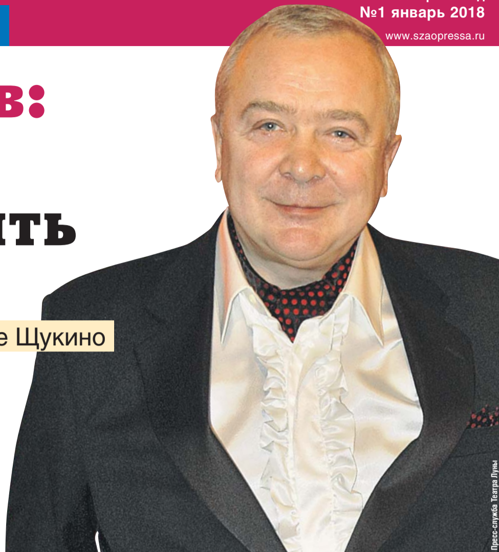
Пресс-служба Театра Луны

Актёр и режиссёр сочиняет пьесы в районе Щукино