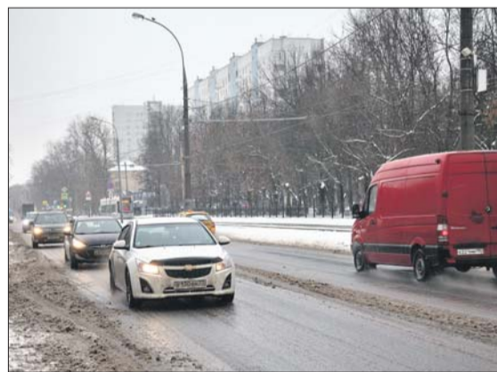
Изменения в организации движения на Сходненской должны произойти во II квартале этого года