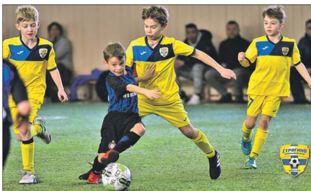
Момент игры юных строгинцев (в жёлтом) с итальянцами

— Ребята впервые играли с иностранной командой, для них это ценный опыт, новые знакомства, общение, эмоции, — рассказал «СЗ»