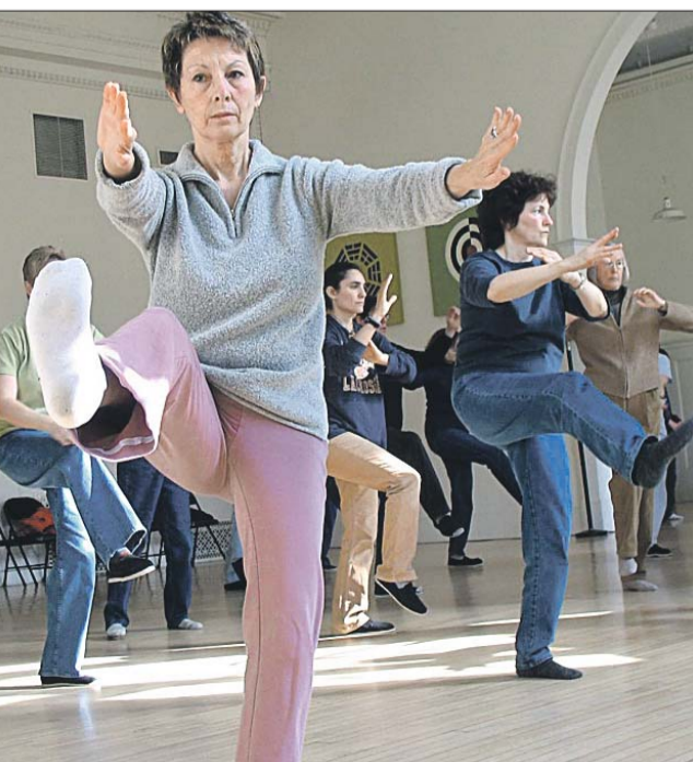
Тайцзицюань помогает экономно расходовать и правильно пополнять свой энергетический запас