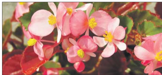
Бегония убивает большинство грибов и микробов, увлажняет воздух

фенбахию запрещено держать в детских садах, — говорит Островская. — Но влияние её яда выборочно. Знаю два случая с кошками: один поиграл опавшим листом растения, и его еле откачали, а второй съел весь цветок, включая листья и стебель, и хоть бы что. При этом диффенбахия прекрасно поглощает вредные вещества из воздуха, в том числе ла-