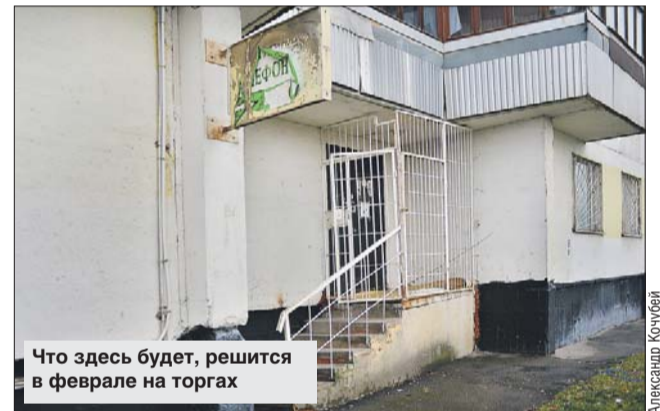
Что здесь будет, решится в феврале на торгах

В управе района Митино нам пояснили, что указанные нежилые помещения находятся в собственности города Москвы. В настоящее время они выставлены на торги на право заключения договора аренды.