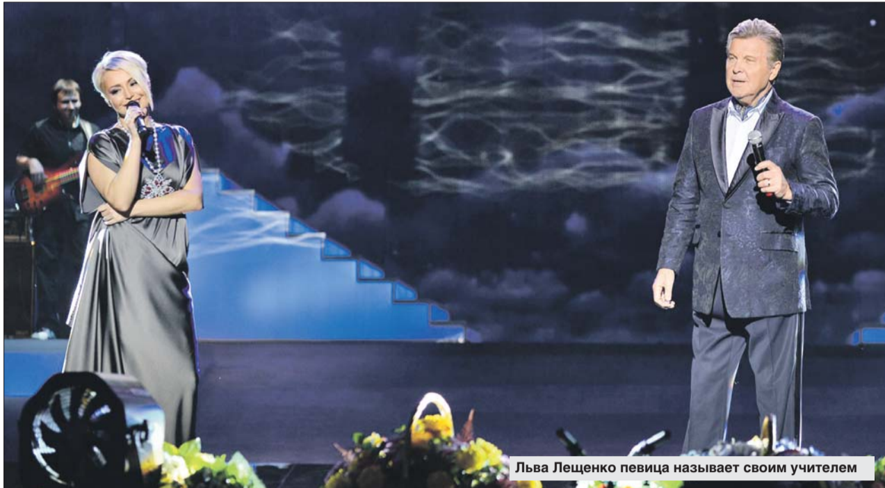
Льва Лещенко певица называет своим учителем