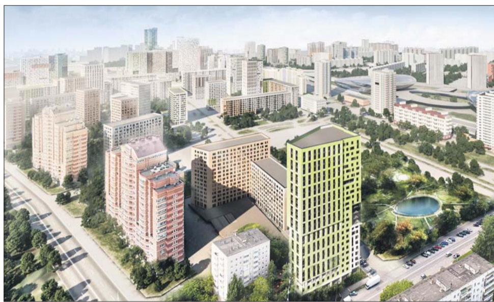
Вариант планировки, который предлагают архитекторы из компании «А-Проект.к», дизайн-бюро Carlo Ratti Associati и ООО «Альт Проект», предполагает, что будет больше общественных пространств, парков и скверов

Консорциум, объединяющий специалистов архитектурных бюро UNK project, Nikken Sekkei, Drees&Sommer, заложил в основу своего проекта принцип квартальной застройки территории района Хорошёво-Мневники. Такой подход позволяет эффективно использовать всю площадку и отделить приватные пространства от обществен-