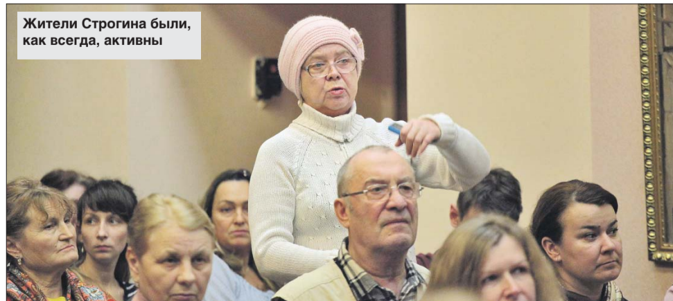
Жители Строгино были, как всегда, активны

На встрече присутствовали жители улиц Твардовского, Таллинской, Маршала Каткуова, Кулакова, Исаковского, села Троице-Лыкова и Неманского проезда