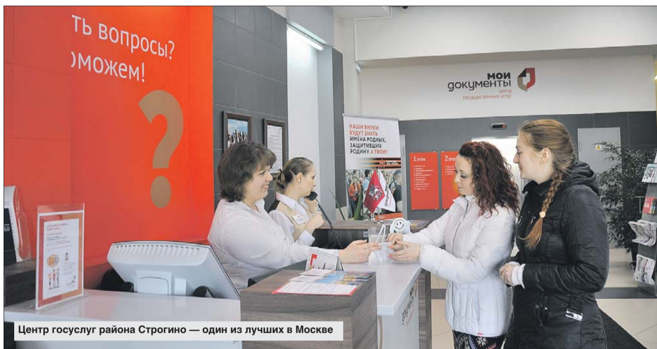
Центр госуслуг района Строгино — один из лучших в Москве

Чтобы мотивировать сотрудников центров работать по новым требованиям, Собянин принял