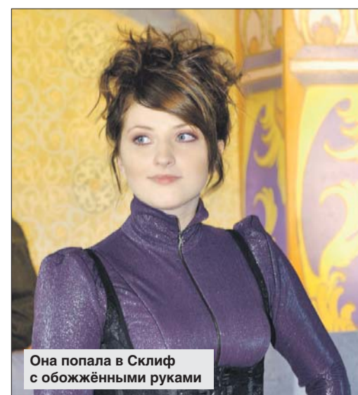
Она попала в Склиф с обожжёнными руками