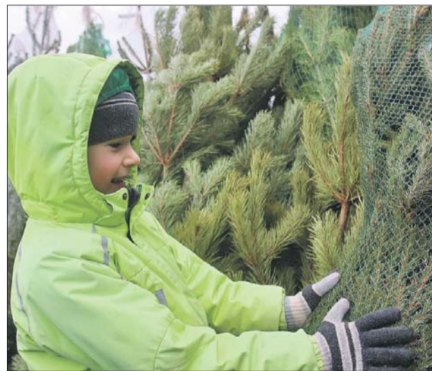
Отечественные ёлки будут стоить от 900 рублей за метр