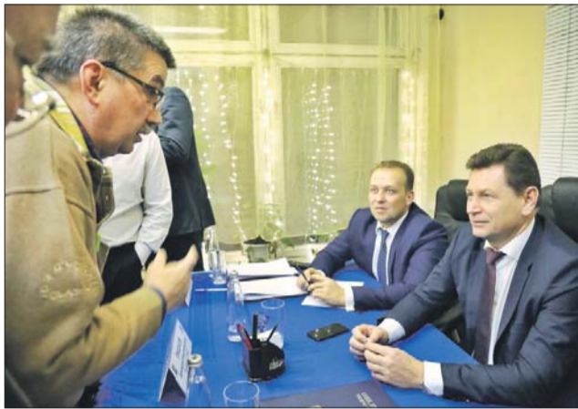
Префект Алексей Пашков внимательно выслушал каждый вопрос

— В этом году в Строгино было выполнено около 90% от общего объема благоустройства в округе — это шесть новых скверов и более 20 дворовых территорий. В настоящее время