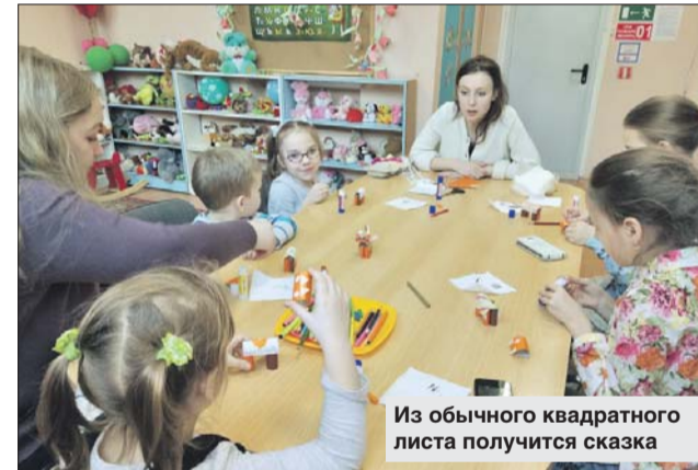
Из обычного квадратного листа получится сказка

20 декабря в ДК «Салют» состоится мастер-класс «Детская мастерская» для детей от пяти лет по созданию зимних поделок своими руками.