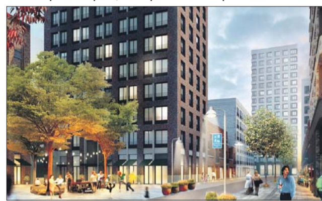
Архитекторы и проектировщики компаний MLA+, BuroMoscow, Mobility in Chain S.r.l., Felixx Landscape Architects & Planners, Habidatum предлагают переселять жителей целыми подъездами