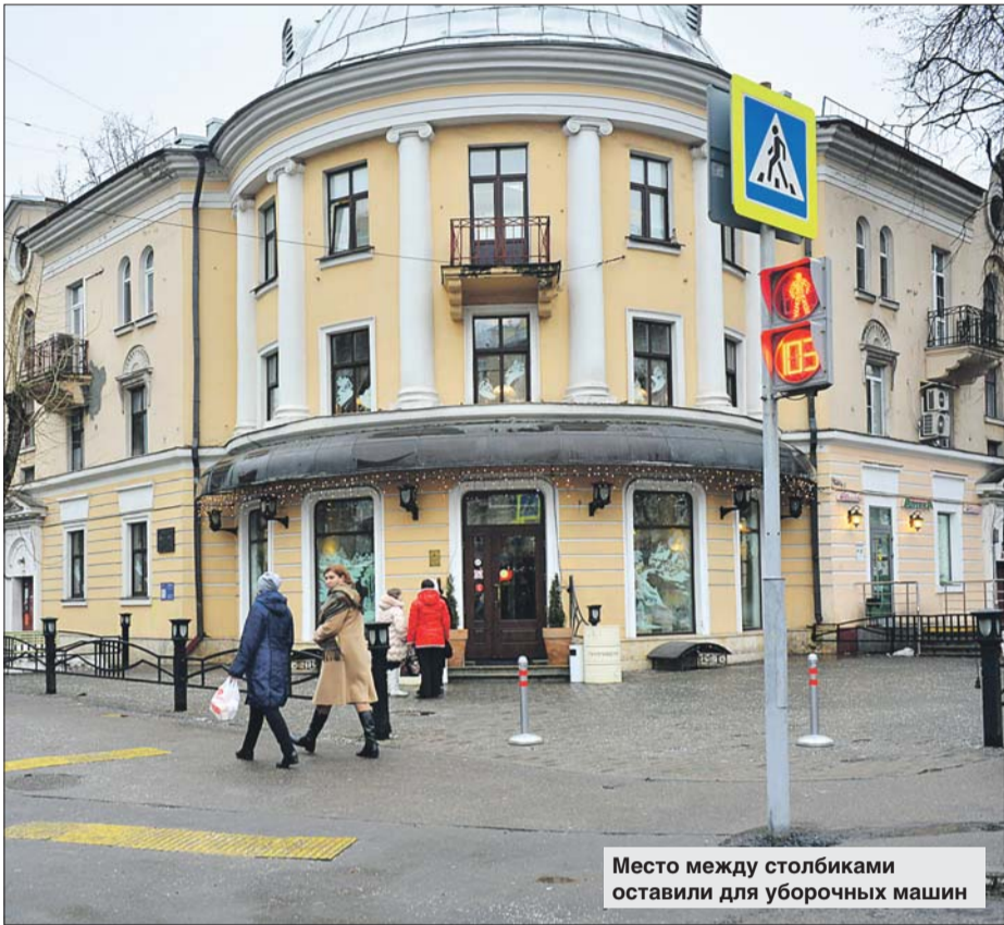
Место между столбиками оставили для уборочных машин