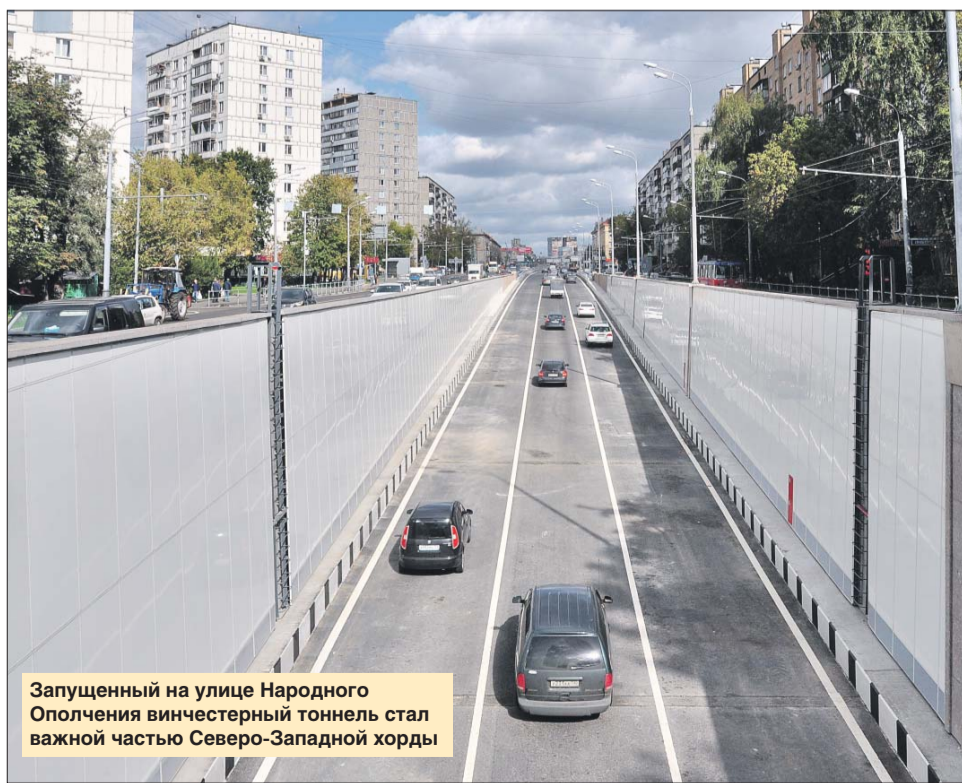
Запущенный на улице Народного Ополчения винчестерский тоннель стал важной частью Северо-Западной хорды

Другой проект, о котором мы уже доложили президенту, и он его одобрил, — строительство Московских центральных диаметров (МЦД). Они будут работать по принципу МЦК. С точки зрения администрирования, удобства соединения с метрополитеном: тактовость движения, комфортный подвижной состав, интеграция с действующими линиями метро и станциями пригородного сообщения. Вместо разорванных радиусов пригородов мы получим сквозные диаметры, скоростные, которые кардинально улучшат ситуацию с точки зрения перевозки пассажиров, живущих в Москве и ближайшем Подмосковье. Первые две линии мы должны получить уже в 2019 году, поэтому следующий год будет посвящён активной работе по запуску данного проекта. Планов у нас громадье, но я уверен, что мы с ними со всеми справимся.