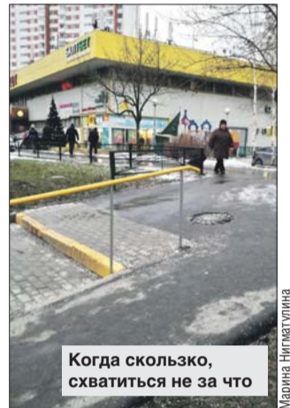
Когда скользко, схватиться не за что