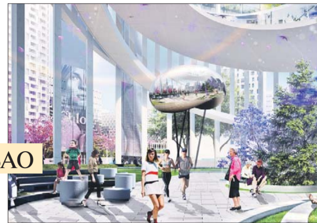
Консорциум, объединяющий специалистов архбюро UNK project, Nikken Sekkei, Drees & Sommer, заложил в основу своего проекта принцип квартальной застройки

Специалисты хотят преобразовать Хорошёво-Мневники в общественно-образовательный центр. Здесь должны быть и транспортно-пересадочный узел, и культурно-просветительский кампус, и предприятия торговли, сервиса и спорта. Расположенная в середине квартала городская площадь станет центром всего района, тут можно будет проводить праздники, ярмарки и фестивали.