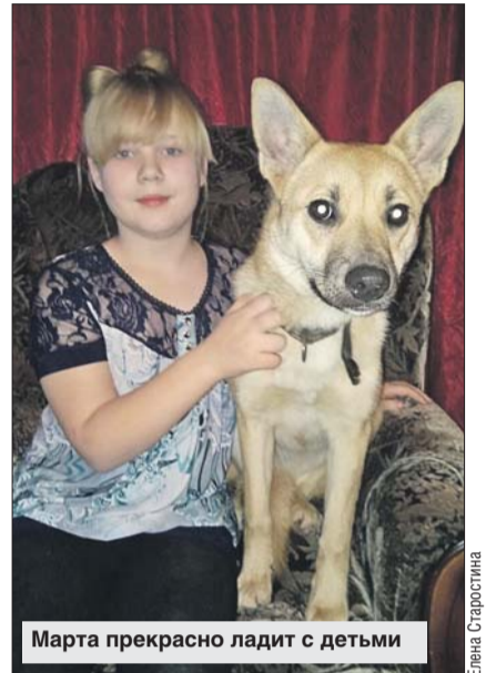
Марта прекрасно ладит с детьми