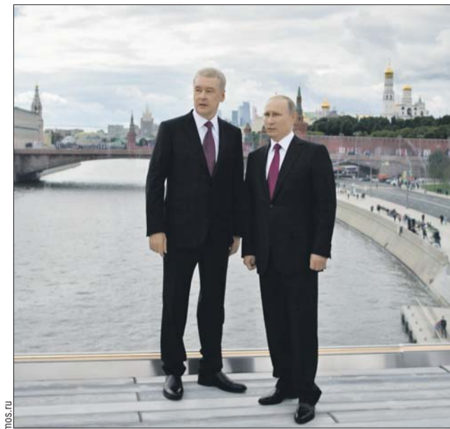
Президент Владимир Путин и мэр Сергей Собянин на открытии парка

На 15-20-минутных бесплатных экскурсиях рассказывают про объекты и ландшафт