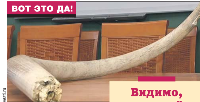
Бивень довольно неплохо сохранился