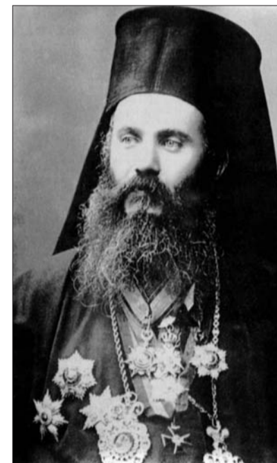
Митрополит Хризостом мог спасти себе жизнь, но решил остаться со своей паствой

В официальной истории Турции ничего этого нет. Считается, что греки сами подожгли свои дома и никакая резня там не было. От прежней Смирны почти ничего не осталось, сегодня на её месте город Измир, где живут мусульмане. И только православные хранят память о греческом владыке, добровольно избравшем мученическую смерть.