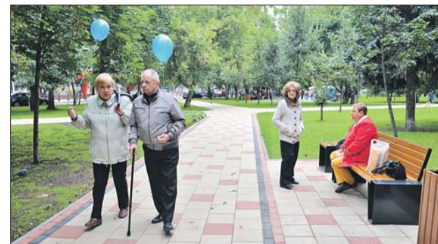
В сквере на улице Народного Ополчения есть всё для приятных прогулок