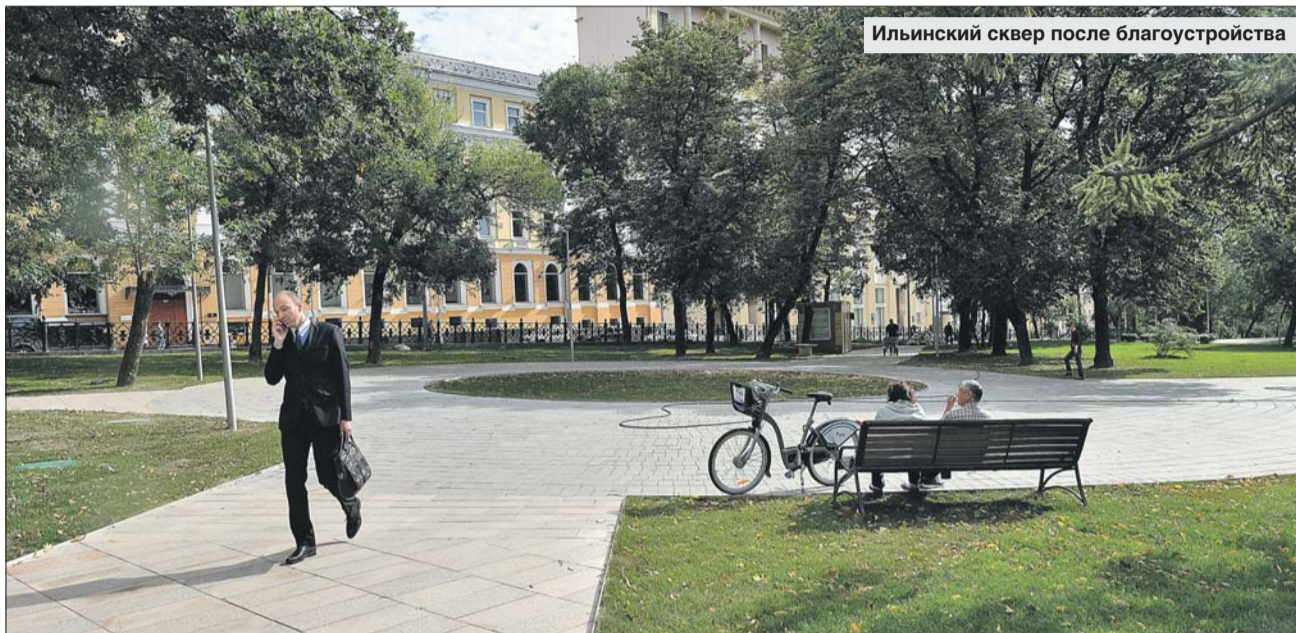
Ильинский сквер после благоустройства

возвращён отреставрированный памятник Максиму Горькому. Здесь восстановлены фасады зданий и воссозданы по чертежам исторические фонари. По площади сегодня курсируют современные трамваи «Витязь-М».