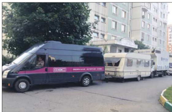
Съёмки на улице Барышихе, 14

Самый «долгоиграющий» сериальный проект российского телевидения, которому в этом году исполнилось 10 лет, снимается в Митине. Сериал «След» рассказывает о буднях выдуманной федеральной экспертной службы, сотрудники которой с помощью уникальной лаборатории и профессиональных навыков раскрывают самые запутанные преступления. Прежде он снимался в разных районах Мо-