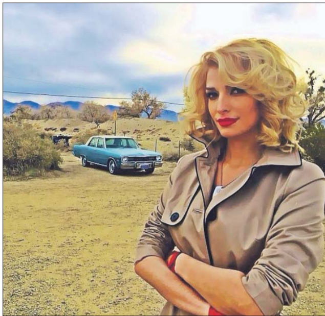
Кадр из фильма «Что творят мужчины!-2»

Роль Кэт подошла мне идеально. Но попросила режиссёра убрать откровенные постельные сцены