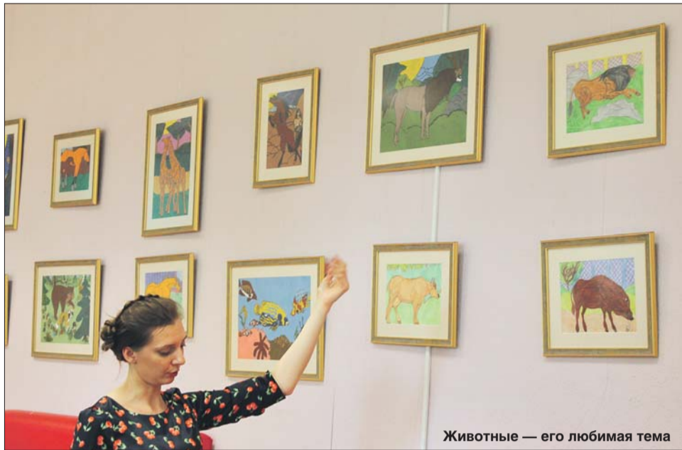
Животные — его любимая тема