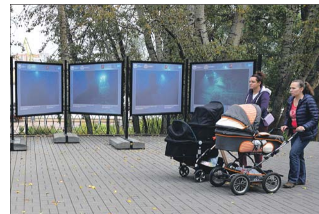
Выставка под открытым небом

Адрес музейно-паркового комплекса «Северное Тушино»: ул. Свободы, 56. Чтобы попасть на выставку, необходимо пройти от центрального входа в музейно-парковый ком-