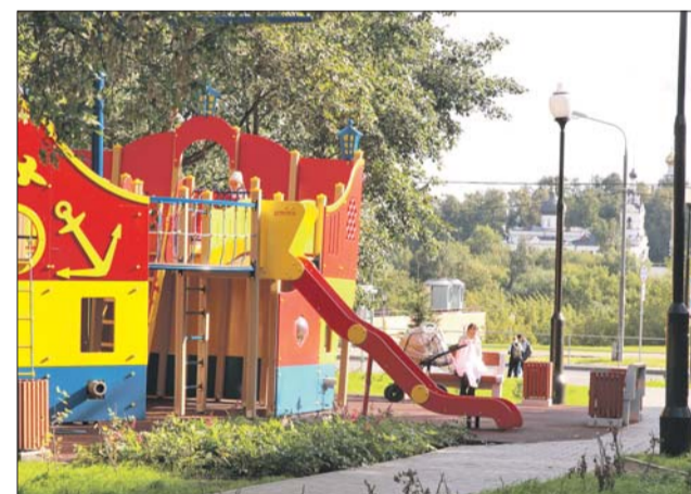
Площадка на улице Твардовского