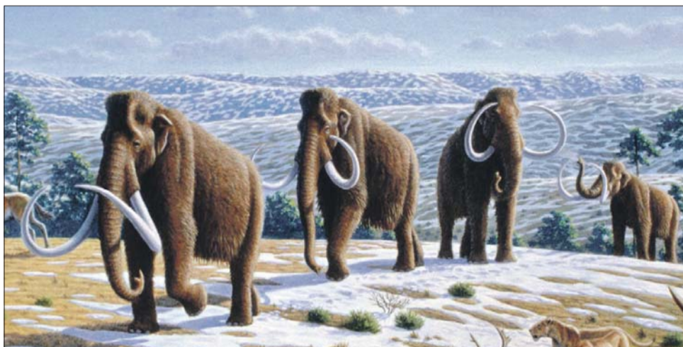
30 тысяч лет назад ледник стал отступать, появилась первая растительность, и за ней пришли мамонты

Бивень мамонта нашли на стройке в Митине