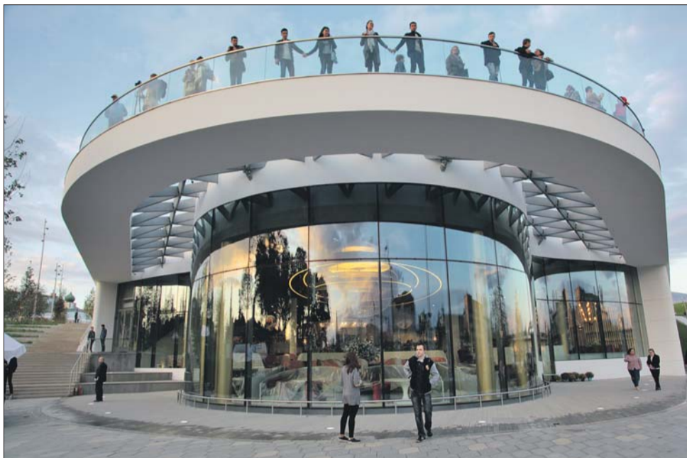
В «Зарядье» есть на что посмотреть

За новыми впечатлениями корреспондент «СЗ» отправилась в «Зарядье»