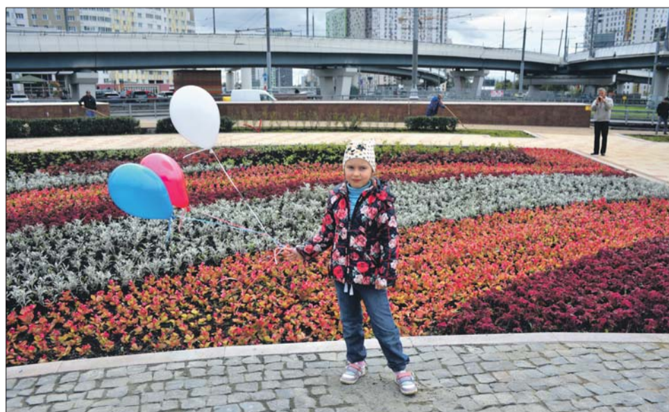
Море цветов в сквере Народных Ополченцев