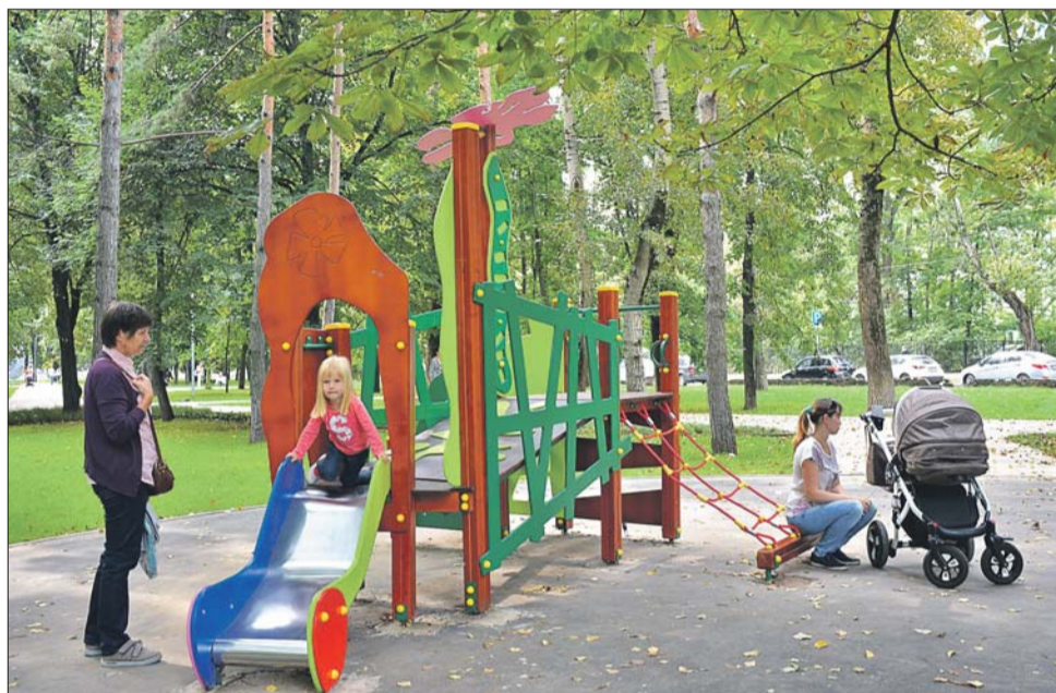
Новая детская площадка на бульваре Генерала Карбышева

— Наш бульвар — это одно из центральных мест района, — рассказывает глава управы Хорошёво-Мневников Сергей Панфилов.