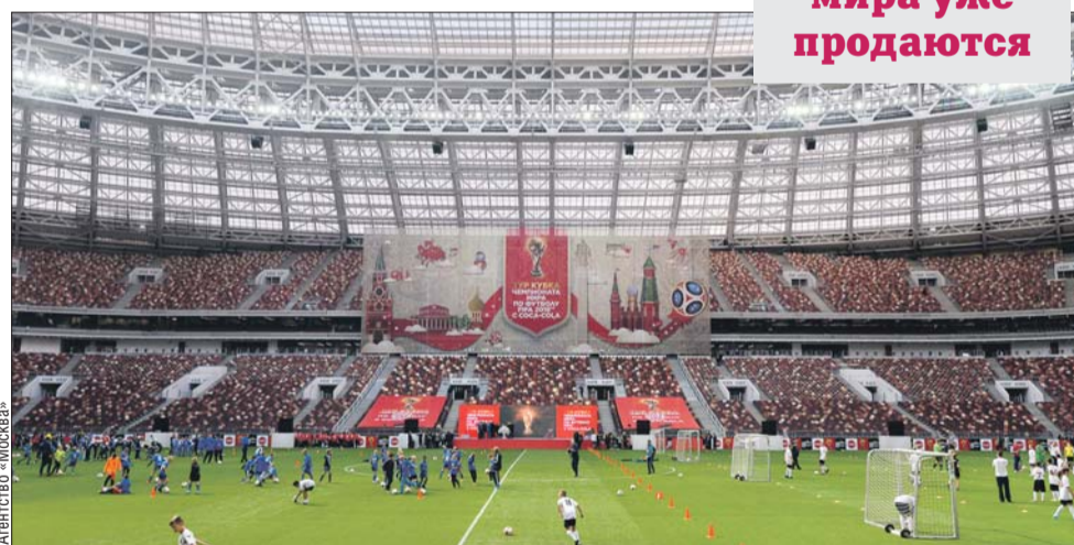
Открытие «Лужников» после реконструкции

Билеты на матчи чемпионата мира уже продаются