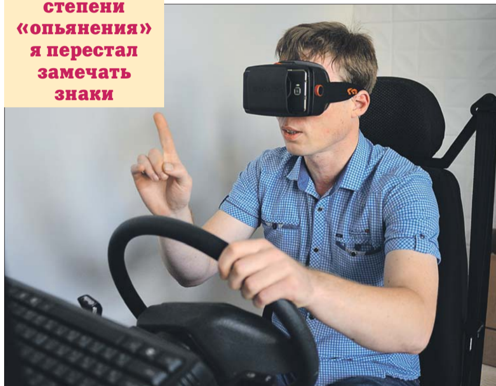
Наш корреспондент в специальных очках, которые вызывают у человека ощущение опьянения

Уже в слабой степени «опьянения» я перестал замечать знаки