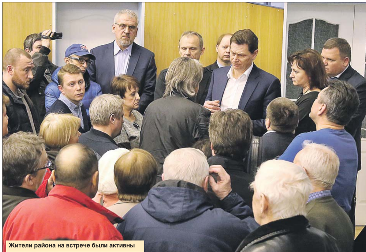
Жители района на встрече были активны