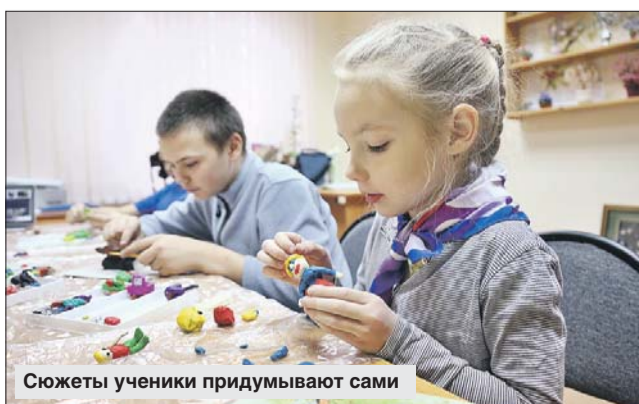
Сюжеты ученики придумывают сами