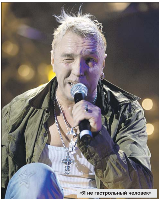
«Я не гастрольный человек»

в Питере всё объяснимо и понятно — я как-то сформулировал отношение к нему: «В этом городе хорошо безответно влюбляться и умирать», — то Москва — город, который начинаешь необъяснимым образом придумывать. Придумывать людей, ко-