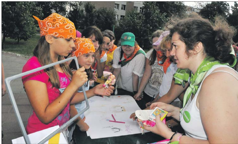
Финальный перечень баз отдыха появится не позднее первой половины апреля

Если заявителю не понравится ни один из предложенных вариантов баз отдыха, можно получить денежный сертификат и поехать отдыхать самим. Правда, это правило не касается детей-сирот и детей-инвалидов. Сертификат на 30 тыс. рублей можно будет получить с 18 апреля по 6 июня.