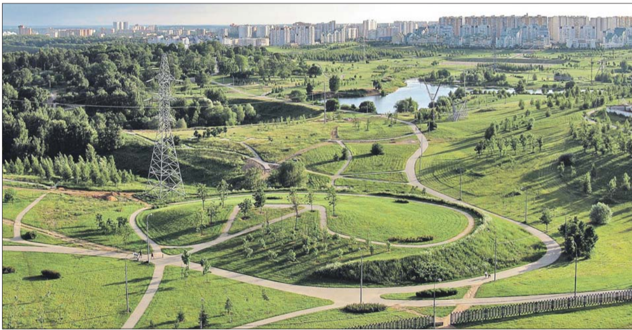
Ландшафтный парк в Митине ждёт новая жизнь

В округе планируют благоустроить дворы и парки