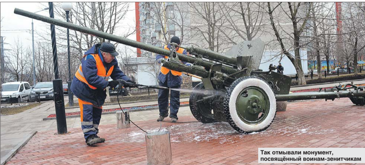
Так отмывали монумент, посвящённый воинам-зенитчикам

Коммунальные службы приводят округ в порядок в рамках месячника благоустройства