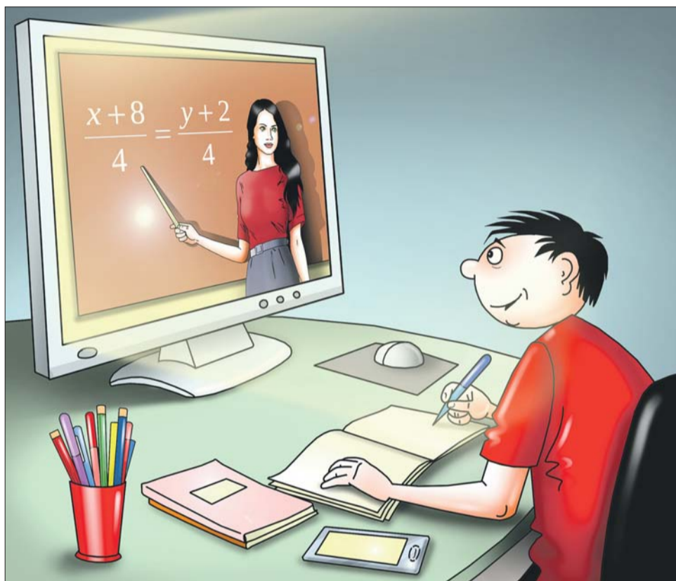
Приложение «Лекции и шпаргалки» постоянно пополняется новым материалом

В Интернете можно скачать и специальные приложения, которые помогут освоить тот или иной курс прямо на экране телефона, например приложение «Stepik: бесплатные курсы». Найти здесь можно онлайн-уроки по про-