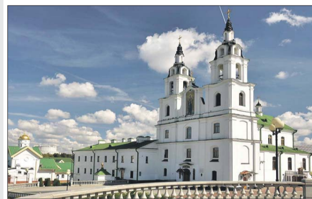
Мощи святой Софии хранятся в минском соборе Сошествия Святого Духа

Радость омрачало слабое здоровье княгини. Двое её детей умерли совсем маленькими, а при рождении третьего умерла и она. В народе ей молятся как помощнице будущих мам, младенцев, больных малышей и сирот.