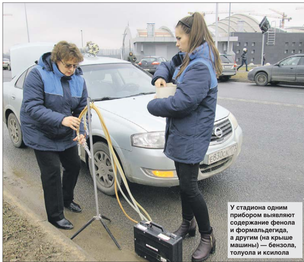
У стадиона одним прибором выявляют содержание фенола и формальдегида, а другим (на крыше машины) — бензола, толуола и ксилола