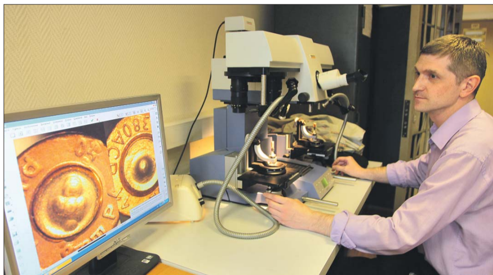
С помощью микроскопа в лаборатории ЭКЦ проводят баллистические экспертизы

Наш корреспондент посмотрела на работу окружных экспертов-криминалистов