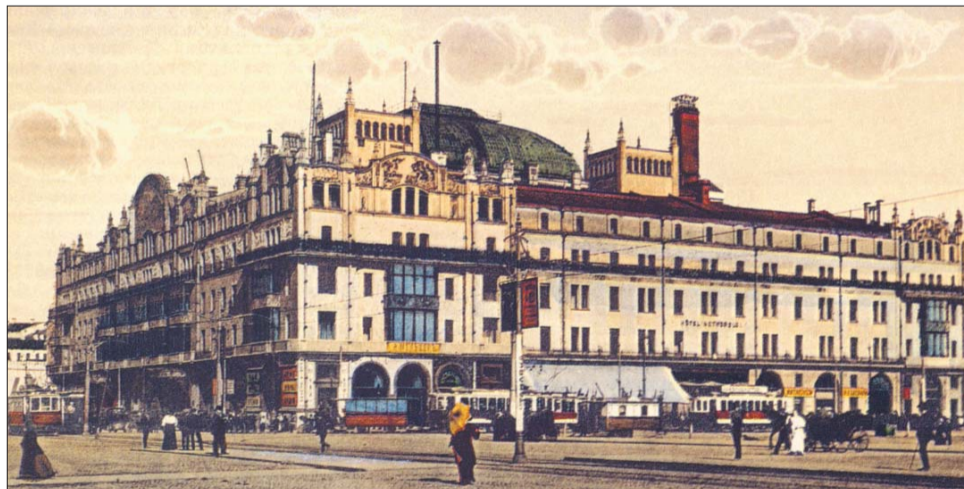
Гостиница «Метрополь». 1899-1905 годы. Открытка начала XX века

Впервые так массово будут представлены фотографии города позапрошлого века