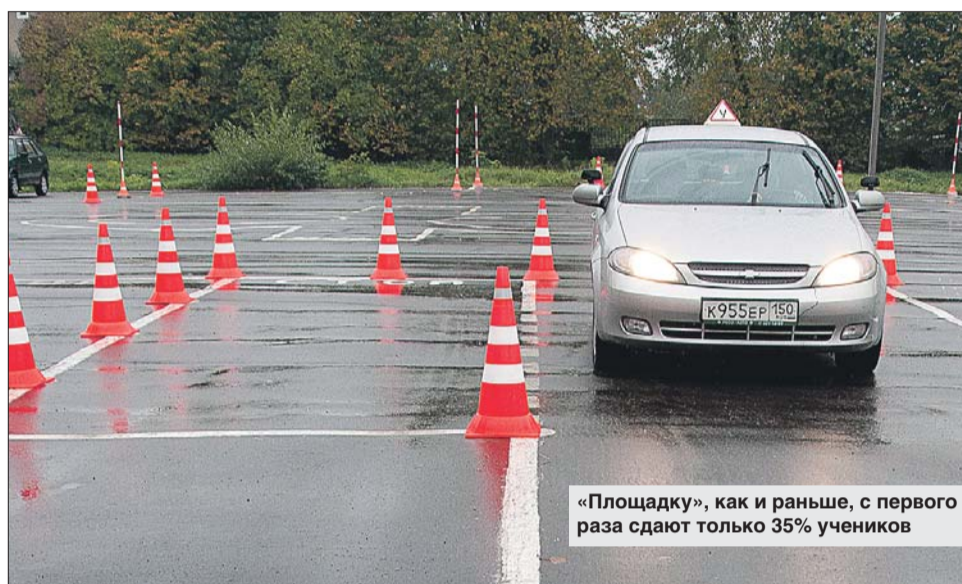
«Площадку», как и раньше, с первого раза сдают только 35% учеников