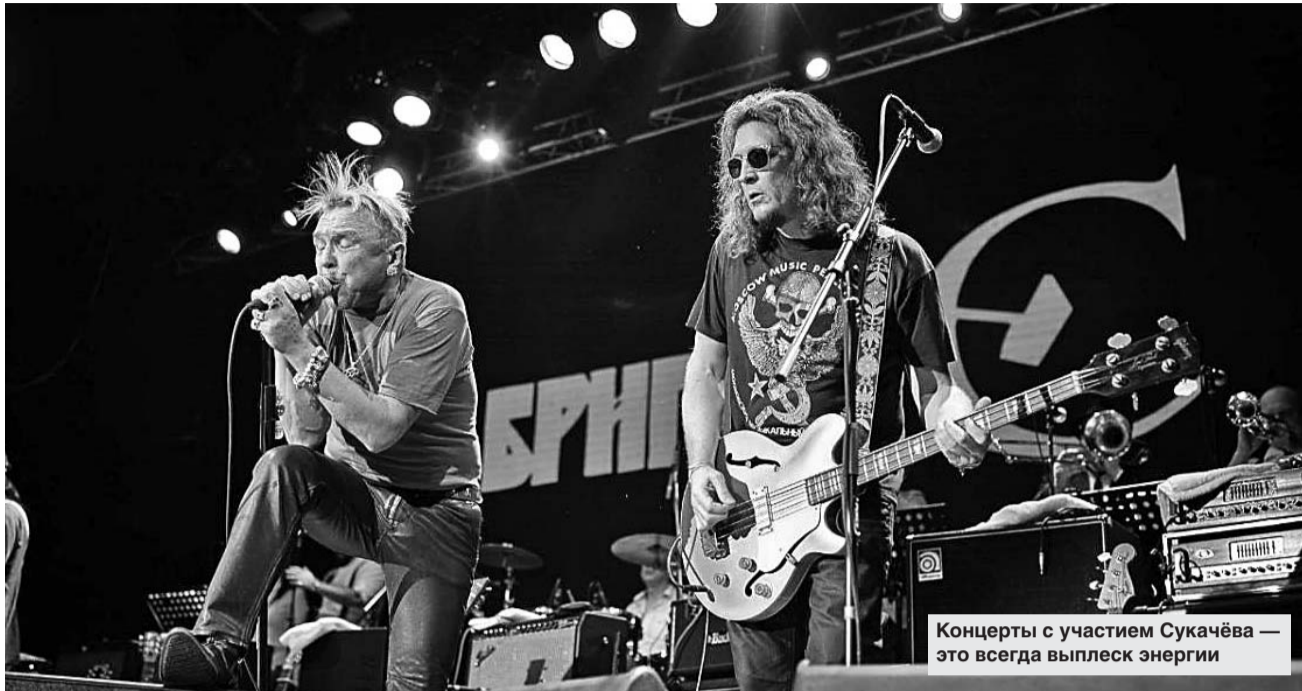
Концерты с участием Сукачёва — это всегда выплеск энергии

— Это всё большая ложь. Такой Москвы не существует: она целиком и полностью придумана и опозитизирована — и Высоцкий, и Окуджавой... Их Москва — странный романтический образ. Если