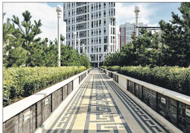
На 1-м этаже будут ресторан, стоматология, пекарня, аптека...

ритории разместят классические скульптуры, беседки, площадки для спорта и развлечений на открытом воздухе. Кстати, идея дизайна всех этих сооружений принадлежит итальян-