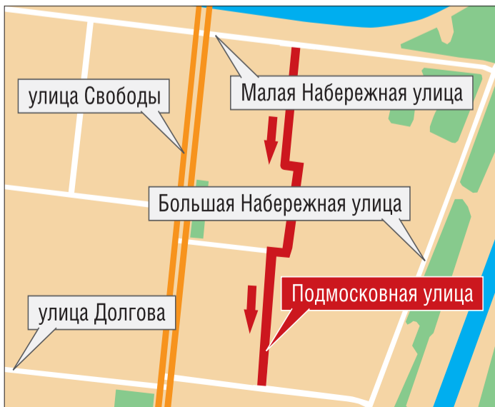
Новая схема позволит увеличить количество парковочных мест до 50