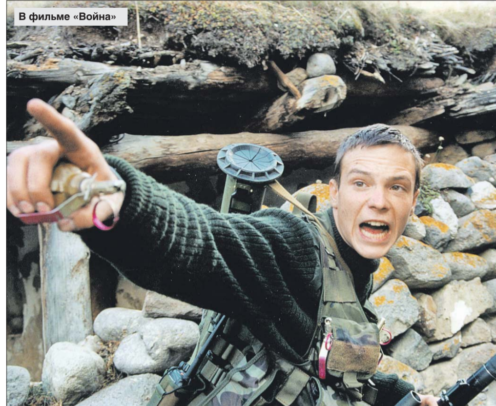
В фильме «Война»

— От плохого материала, длинных сериалов, от ситкомов — это не мой формат. Хотя, знаете, Чарли Шин — замечательный актёр. Сказать, что у него не было отношений с удачей, — ничего не сказать, а после «Взвода» он был просто в топе. И где он сейчас снимается? Правильно — в сериале! Получает 20 миллио-