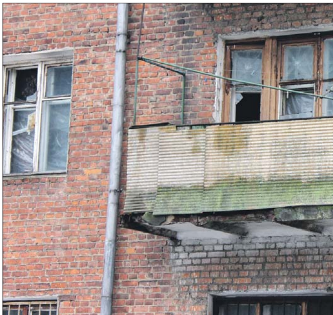
В пятиэтажках устарели фундаменты, расходятся стены, проседают потолки, отваливаются балконы

Списки сносимых пятиэтажек, которые сегодня гуляют по Интернету, составлены риелторскими агентствами. Это неофициальная информация, которой не следует доверять на сто процентов. Лучше подождать утверждения официальной программы реновации.