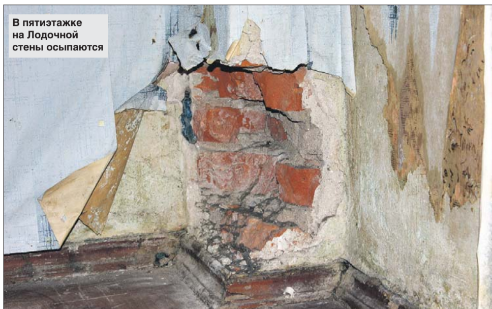
В пятиэтажке на Лодочной стены осыпаются

Напомним, что в рамках программы предусматривается расселение