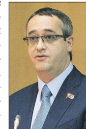
Председатель Мосгордумы Алексей Шапошников

— От того, как исполняются налоговые поступления в столичный бюджет, зависит реализация городских государственных программ и выполнение социальных обязательств перед москвичами, — сказал Алексей Шапошников.