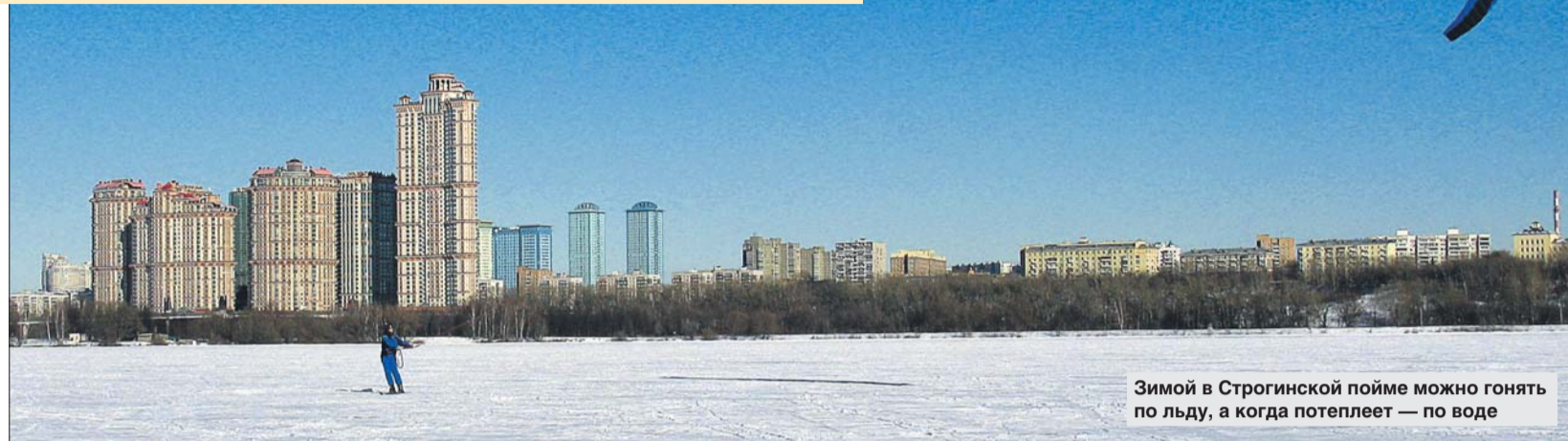
Зимой в Строгинской пойме можно гонять по льду, а когда потеплеет — по воде

Тем не менее, по словам специалиста, и у катания