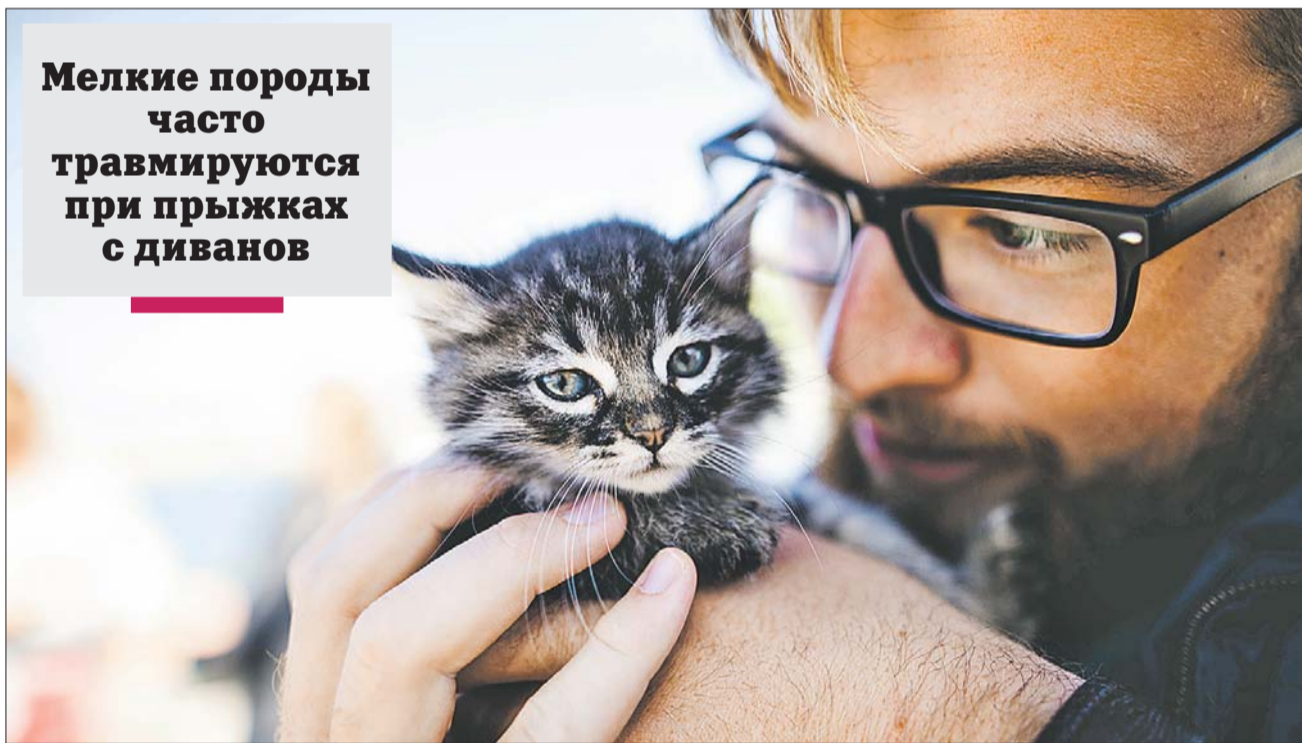
После каждой прогулки пробирайте шерсть руками: там могут быть клещи

Мелкие породы часто травмируются при прыжках с диванов