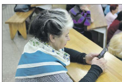
Расскажут и о популярных видах СМС-мошенничества

— Лекцию проведут сотрудники проекта «Безопасная столица». На уроке расскажут, какие современные методы обмана используют мошенники, — поясняет специалист