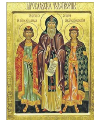
Мощи святого князя Феодора хранятся в Успенском соборе Ярославля

Святой Феодор был выдающимся христианским миссионером. Он сумел добиться учреждения епархии Православной Церкви в Сарая — столице Золотой Орды, расположенной вблизи нынешней Астрахани. Многие знатные татары тогда приняли крещение.