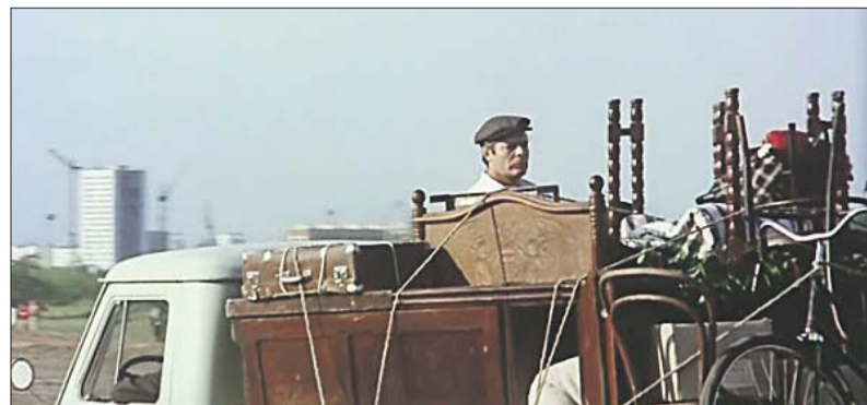
По сюжету герой Мastroяни переезжает в новый дом — на заднем плане видны белые многоэтажки за каналом на Ленинградском шоссе

Фильм «Подсолнухи» снимали на территории нынешнего СЗАО