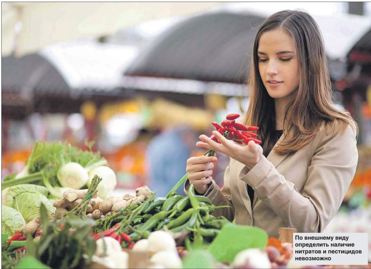
По внешнему виду определить наличие нитратов и пестицидов невозможно

Как относиться к информации о пестицидах в сельхозпродуктах