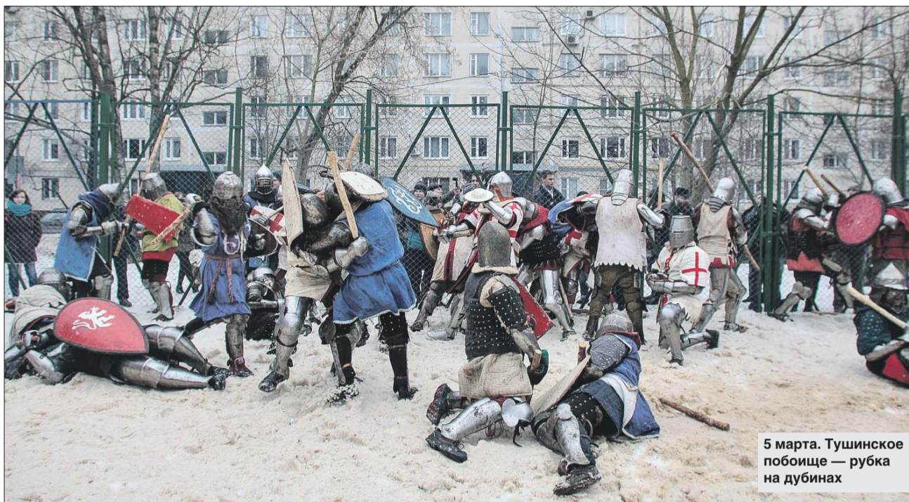
5 марта. Тушинское побоище — рубка на дубинах

Я, конечно, не могла не спросить Дмитрия, насколько опасно участие в сражении.