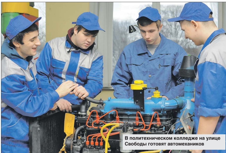
В политехническом колледже на улице Свободы готовят автомехаников

Студентов обучают на двух площадках. На ул. Свободы, 33, получить можно технические