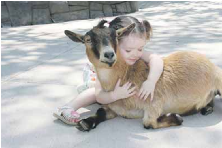
Для малышек на фестивале будет работать мини-зоопарк с козочками, кроликами, курочками и овечками

На сцене юные зрители увидят шоу научных экспериментов - полчаса чудес, происходящих прямо у вас на глазах. Химические реакции, опыты из физики,