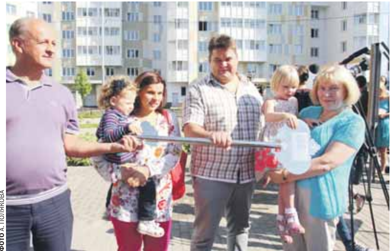
Символический ключ от нового дома