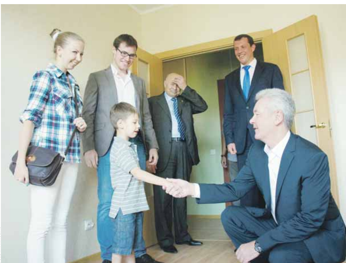
Дом сдан - дом принят