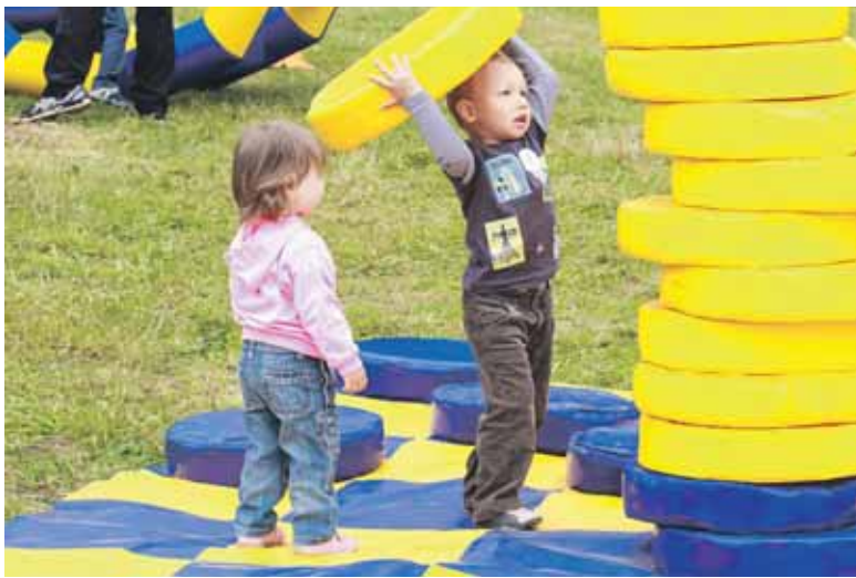
Гигантские шашки, городки, петанк, лапта. Эти необычные игры тоже часть программы

Главный организатор события - Департамент природопользования и охраны окружающей среды Москвы.