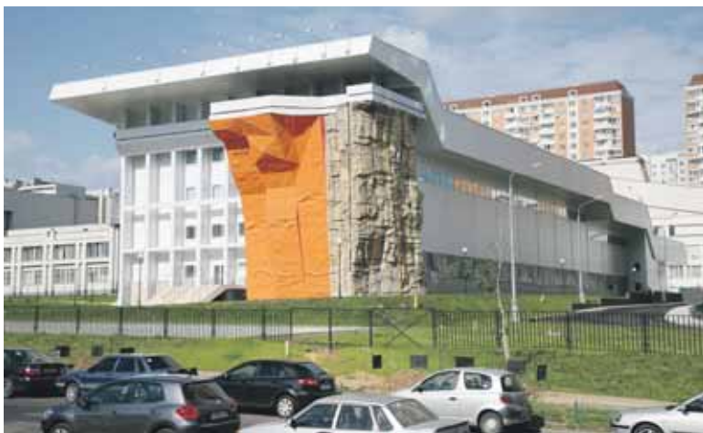
Соревнования пройдут в спортивно-оздоровительном центре МИТХТ им. М.В. Ломоносова

Заявку на участие в играх необходимо отправить в электронном виде в оргкомитет игр до 1 сентября (для спортсменов старше 18 лет) и до 5 сентября (7 - 18 лет). Электронный адрес оргкомитета: parasport@mitht.ru .