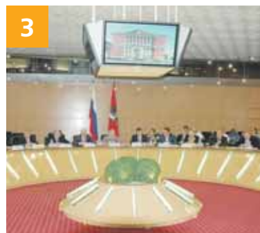
Шаг навстречу честным выборам