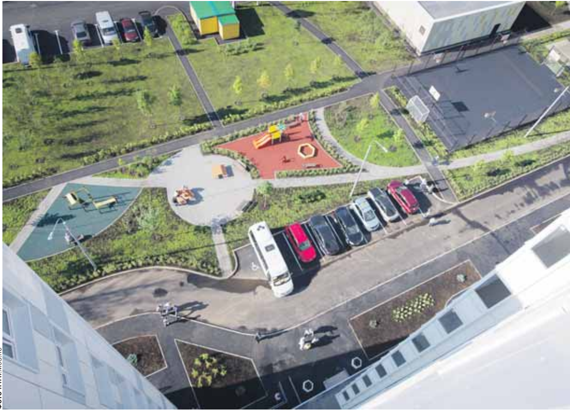
Этот уютный двор достался новоселам в подарок

улицы панорама квартала также значительно похорошела и должна будет понравиться всем въезжающим в Москву по Новой Риге. Всего в новостройках 825 квартир, и более чем в 700 из них жилье получат семьи из 9 пятиэтажек, находящихся