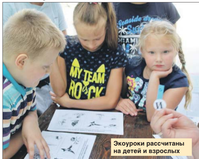
Экоуроки рассчитаны на детей и взрослых

Кружок «Юные натуралисты» поможет разгадать тайны окружающего мира, посмотреть на природу с иной стороны, узнать, какие цветы называются первоцветами, почему снежинки белые, и распознавать голоса птиц. Занятия проходят каждый вторник с 16.00. Кружок «Мир вокруг нас» — для юных иссле-