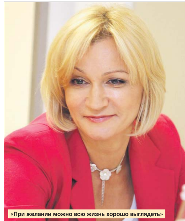
«При желании можно всю жизнь хорошо выглядеть»

— Взрослых детей поздно чему-то учить. Характер вообще до пяти лет