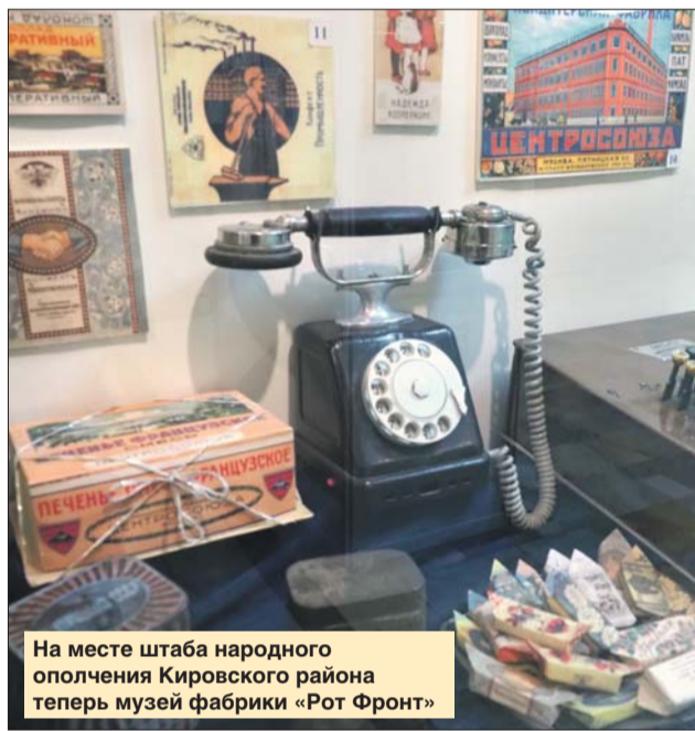
На месте штаба народного ополчения Кировского района теперь музей фабрики «Рот Фронт»

Скептики говорят, что ополченцы были плохо вооружены, не обучены, полурядзеты. Это далеко не так. Завсектором Государственного музея обороны Москвы генерал-майор в отставке Владимир Каримов утверждает, что после формирования дивизии ополченцев были выведены за город, в лагеря. Там бойцам выдали единую форму, заменили старое оружие на современ-