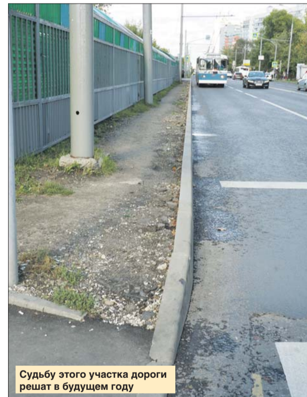
Судьбу этого участка дороги решат в будущем году

ГБУ «Жилищник района Южное Тушино»: ул. Свободы, 42, тел.: (499) 493-0305, (499) 492-1112. Эл. почта: dezut@yandex.ru. Сайт: gbu-utushino.ru