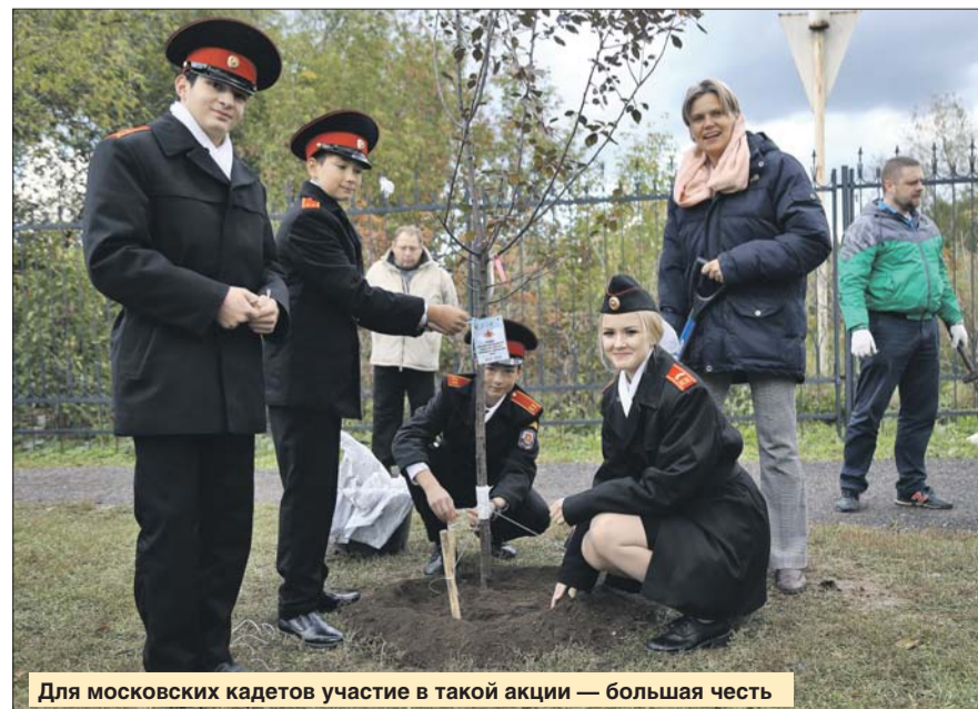
Для московских кадетов участие в такой акции — большая честь