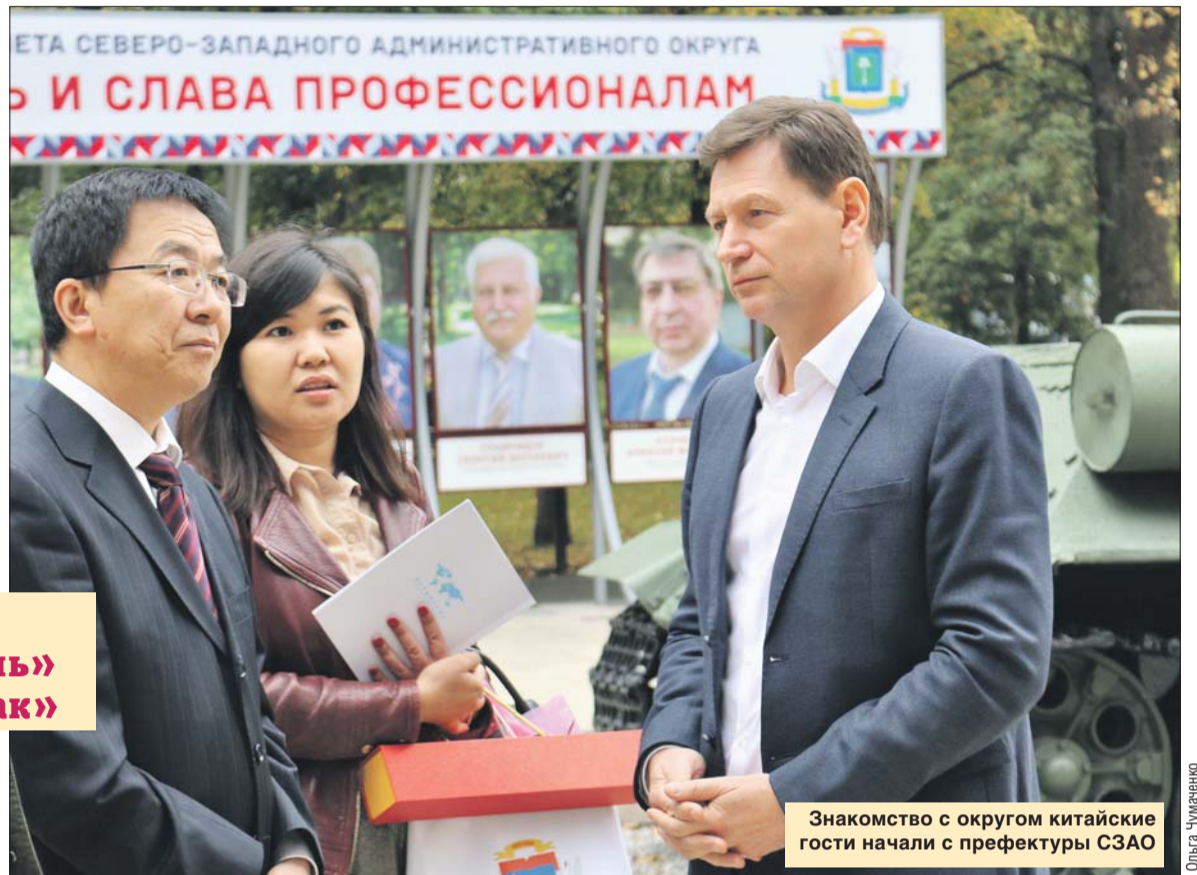
Знакомство с округом китайские гости начали с префектуры СЗАО

— Я провёл в Москве всего один день, но за это время успел ощутить национальный колорит, познакомился с традициями и культурой, осмотрел один