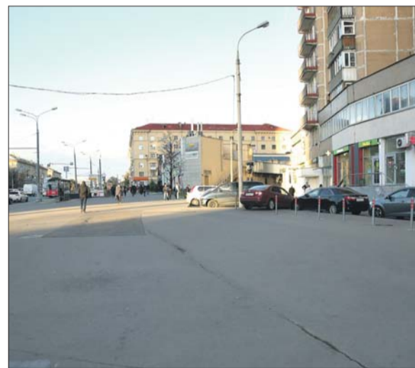
Судьбу этого участка решат муниципальные депутаты

Управа района Щукино: ул. Расплетина, 9, тел. приёмной (499) 194-3651. Эл. почта: shukino-uprava@mos.ru. Сайт: schukino.mos.ru