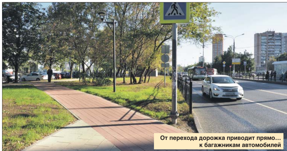
От перехода дорожка приводит прямо... к багажникам автомобилей

Почему в сквере на улице Героев Панфиловцев на месте дорожки к метро «Сходненская» сделали газон? Дорожку перенесли, но теперь она упирается в парковку. Людям приходится ходить по газону! Наталья Вениаминовна, Химкинский бул., 14, корп. 2