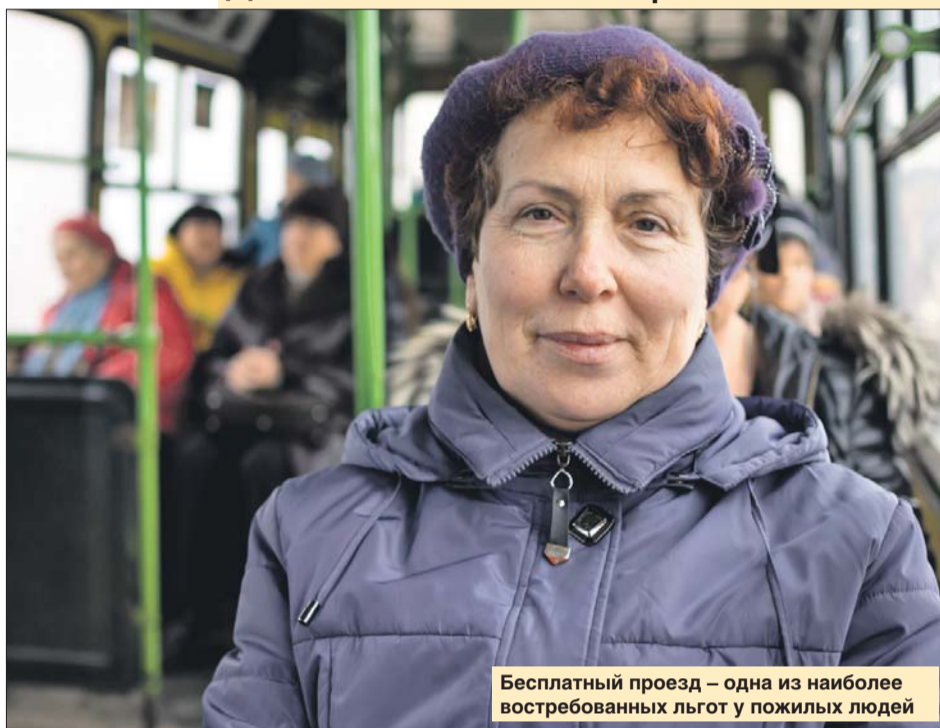
Бесплатный проезд — одна из наиболее востребованных льгот у пожилых людей

К привычным мерам поддержки добавят и новые. Так, для тех, кому больше 50 лет, появится особая программа бесплатной диспансеризации. Предусмотрена и адресная социальная помощь для людей, оказавшихся в трудной жизненной ситуации. Им при необходимости предоставят денежные выплаты, продукты, вещи, субсидии на оплату услуг ЖКХ.