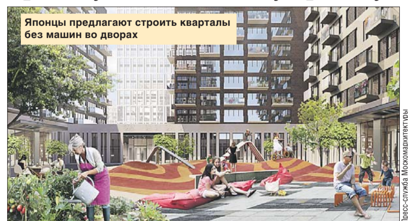
Японцы предлагают строить кварталы без машин во дворах