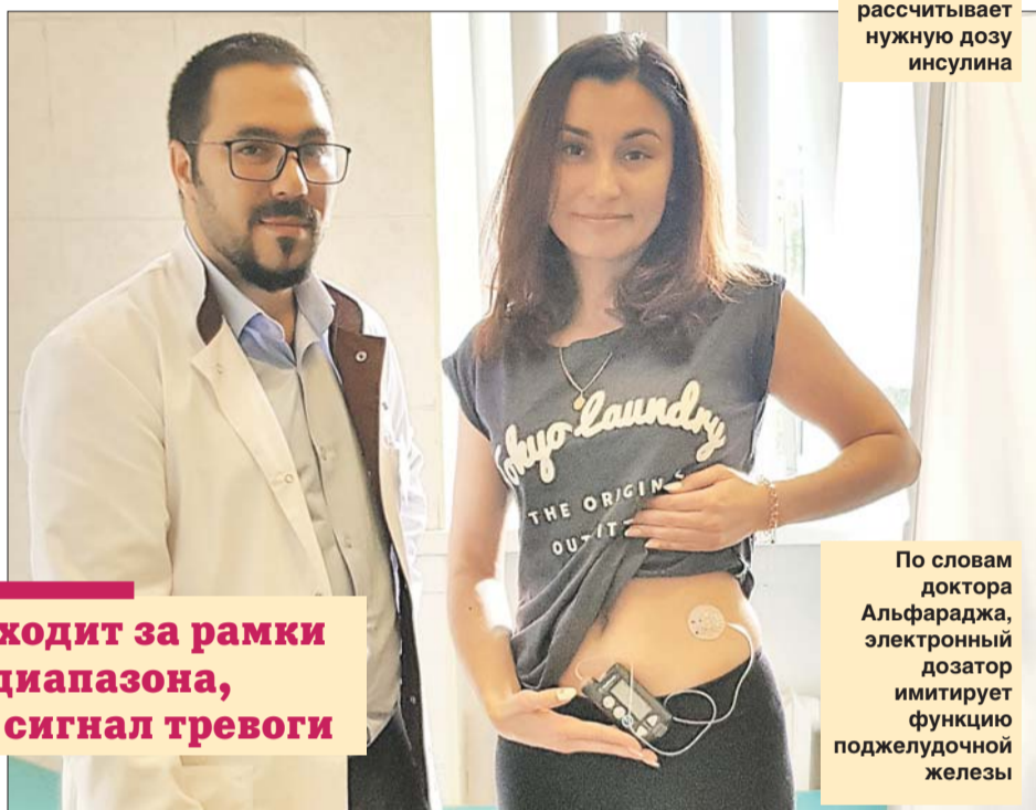
Помпа сама рассчитывает нужную дозу инсулина

— Человек вводит в систему данные: целевой уровень глюкозы и потребность в лекарстве в разные периоды суток. Затем перед приёмом пищи остаётся указать