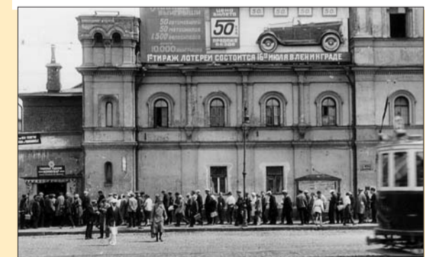
До разрушения в 1937 году собор Страстного монастыря использовали как тумбу для афиш и лозунгов

Посещал ли народ такие выставки? Да. Но эффект был неожиданный: перепись 1937 года показала, что в стране 55 млн верующих — значительно больше, чем атеистов. Пропаганда не сработала. Поставленная цель — покончить с религией к 1937 году — оказалась недостижимой. Пришлось считаться с реалиями. И вскоре, когда на русскую землю двинулся смертельный враг, власть обратилась к народу, как встарь, по-христиански: «Братья и сёстры!»