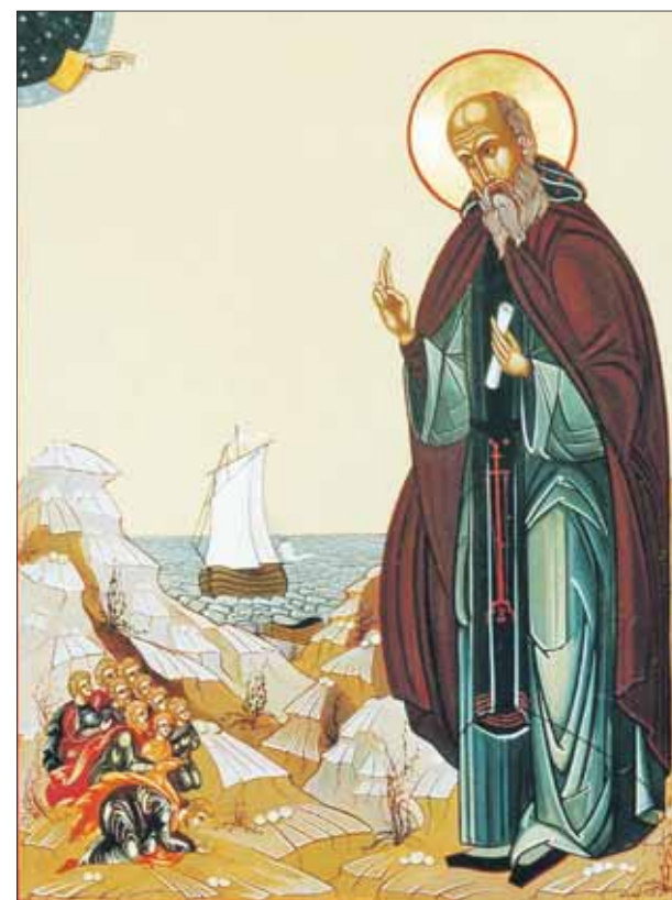
Преподобный Варлаам Керетский считается небесным покровителем мореплавателей

Выставка с образами трёхсот русских святых будет открыта в Манеже до 21 августа. Советую её посетить, посмотреть уникальные иконы, побывать на замечательных бесплатных экскурсиях (по будням в 14.00 и в 19.00, в выходные — в 13.00 и в 17.00). Верующий человек откроет здесь новых небесных заступников, а тот, кто не слишком верит, узнает много интересного об особенностях русской православной традиции.