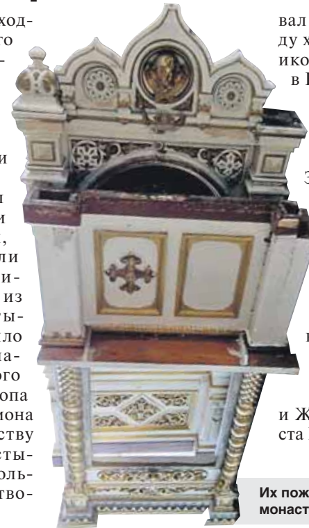
Их пожертвовали Донской монастырь и храм в Куркине