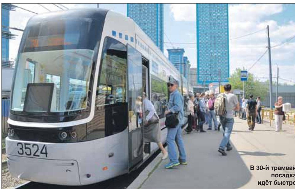
В 30-й трамвай посадка идёт быстро

Первые итоги нововведения на маршрутах Краснопресненского депо