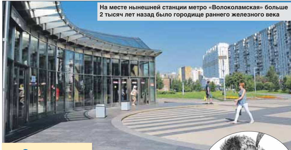
На месте нынешней станции метро «Волоколамская» больше 2 тысяч лет назад было городище раннего железного века