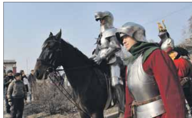
За хорошее знание «рыцарского кодекса» обещают подарки

Встреча предполагает проведение различных конкурсов и мастер-классов. Мальчикам, например, будет предложено придумать собственный герб, а девочкам — нарисовать платок прекрасной дамы. Дети посоревнуются