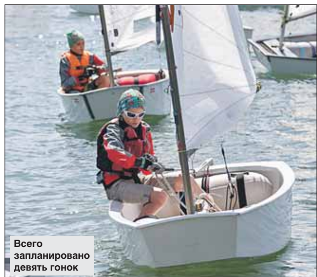
Всего запланировано девять гонок

С 12 по 14 августа в акватории Строгинской поймы состоится традиционная открытая детская парусная регата «Весёлый ветер». Она пройдёт в Москве уже в 35-й раз. Её организатор — спортшкола №26 Москомспорта.