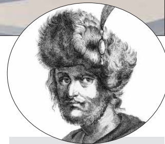
Тушинский вор — Лжедмитрий II успел в Москве обогатиться

Взять район Митино. В 90-х годах XX века начали строить станцию метро «Волоколамская». По незнанию запроектировали её прямо