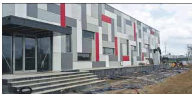
Общая площадь новой базы «красно-белых» составит 2,5 тысячи квадратных метров

Во время чемпионата мира здесь будут тренироваться его участники