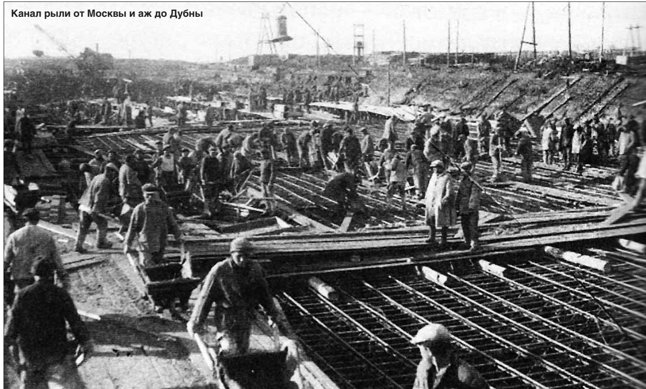
Канал рыли от Москвы и аж до Дубны