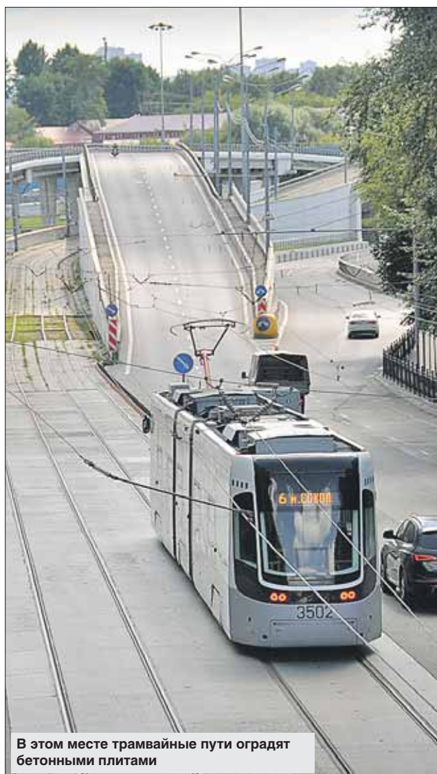
В этом месте трамвайные пути оградят бетонными плитами