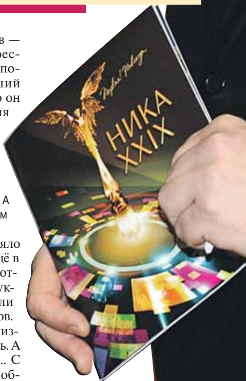
Екатерина Ченокова/РИА Новости

— Да никак не обстояло — не пил я никогда. Ещё в училище делали как-то отрывок по рассказам Шукшина, где должны были играть пьяных мужиков. Решили «для правды жизни» в самом деле выпить. А потом такое показали!.. С тех пор веду здоровый об-