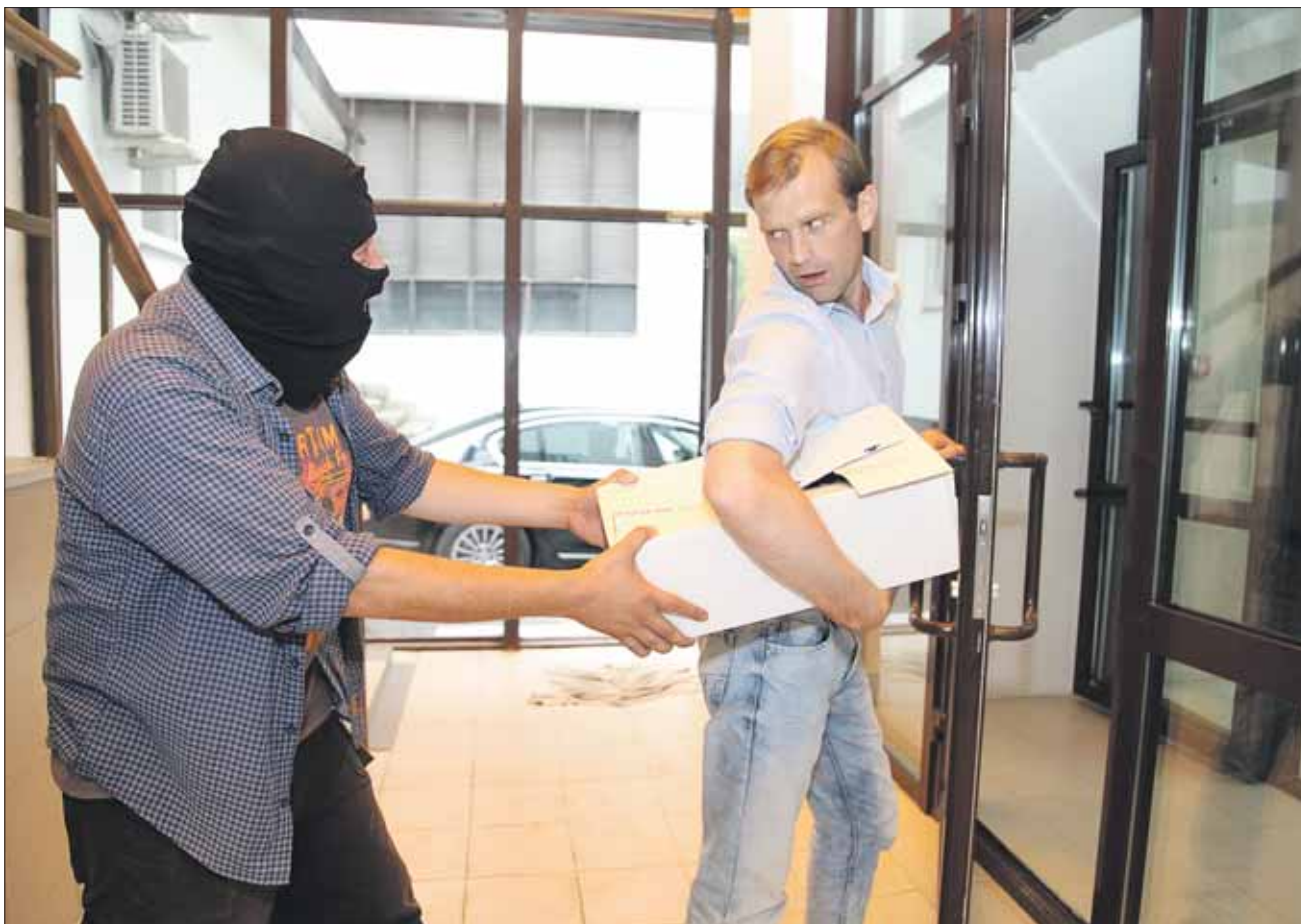
Дневное время, как ни странно, более удобно для грабителя: меньше людей в подъезде