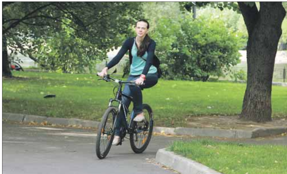
Даже путешествие по сокращённому маршруту заняло 2,5 часа