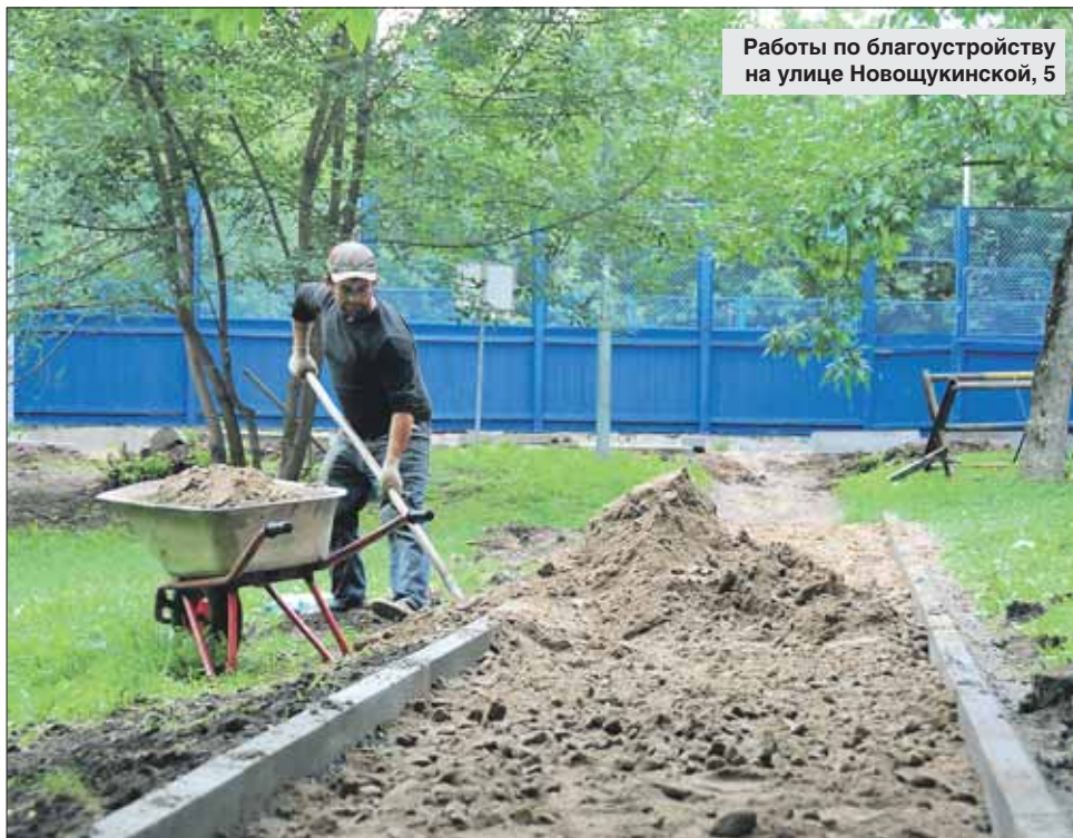
Работы по благоустройству на улице Новошукшинской, 5

нему адресу реконструируют ещё и спортивную площадку. Депутаты также посодействовали в ремонте асфальта на улицах Маршала Новикова, 1, 3, Максимова, 8, и в установке дополнительных МАФ на детской площадке на улице Маршала Рыбалко, 7.