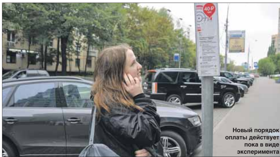
Новый порядок оплаты действует пока в виде эксперимента

Сначала система запросит четырёхзначный номер платной парковки (он указан на табличках у парковочных мест) и время, на которое вы оставляете машину. Если система не распознает произнесённый вами номер парковки, она может попросить вас повторить его по одной цифре. Далее нужно сообщить но-