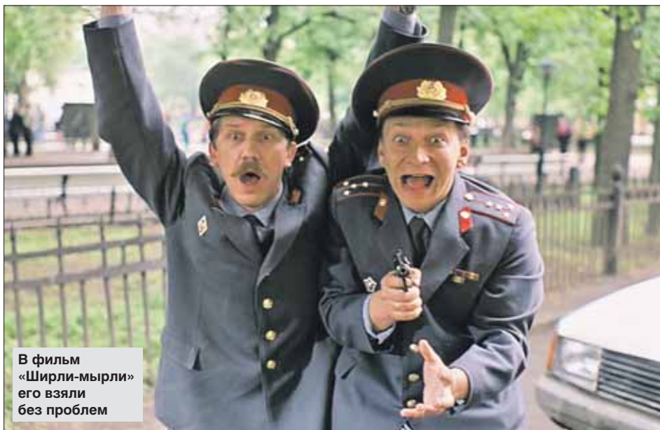
В фильме «Ширли-мырли» его взяли без проблем