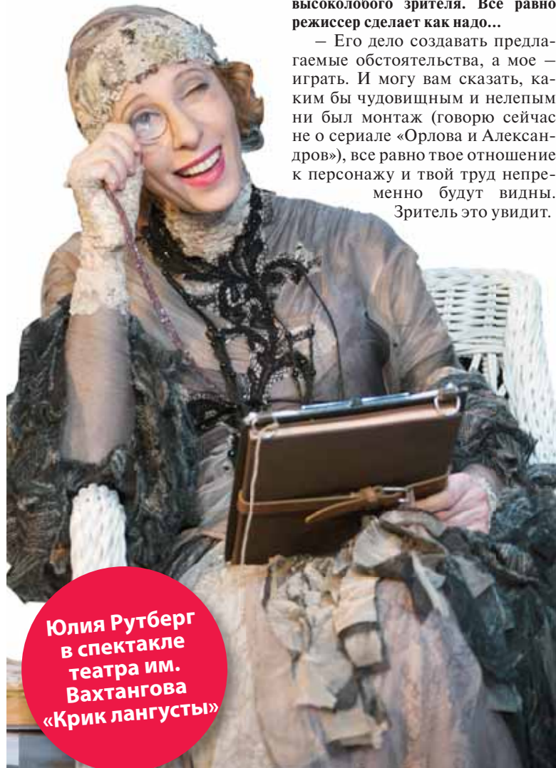
Юлия Рутберг в спектакле театра им. Вахтангова «Крик лангусты»