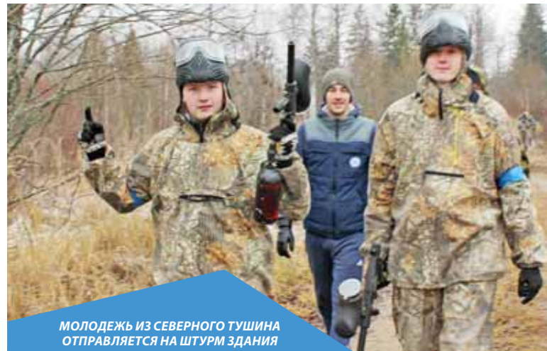
МОЛОДЕЖЬ ИЗ СЕВЕРНОГО ТУШИНО ОТПРАВЛЯЕТСЯ НА ШТУРМ ЗДАНИЯ

Ребята увлеченно метали ножи, топоры, упражнялись в сборке и разборке автомата, стреляли по мишеням. А самым долгожданным и, пожалуй, радостным событием стала игра в пейнтбол.