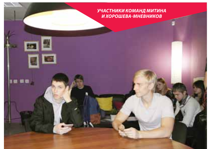
УЧАСТНИКИ КОМАНД МИТИНО И ХОРОШЕВА-МНЕВНИКОВ

В финале выбрали новую тему дебатов - «Деньги - самая главная и эффективная мотивация для сотрудников». Теперь щу-