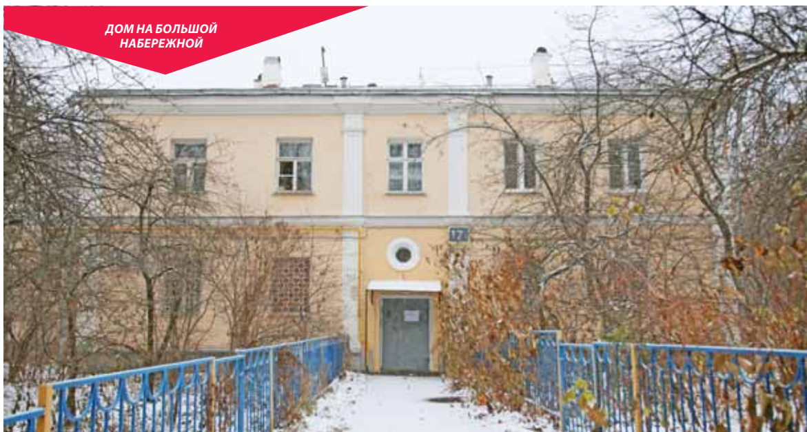
ДОМ НА БОЛЬШОЙ НАБЕРЕЖНОЙ