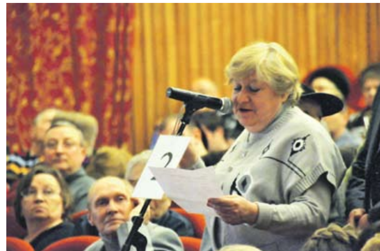
На встрече прозвучало немало вопросов от жителей

Участники встречи назвали сразу несколько адресов, где плата за отопление странным образом подскочила вдвое. Судя по единственному платежному документу, в квартирах должно