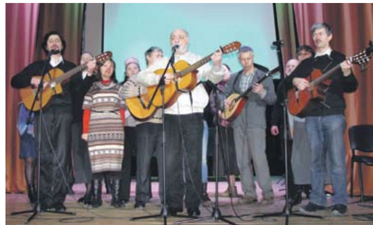
Как здорово, что все мы здесь сегодня собрались