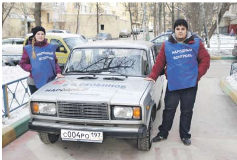
Народный контроль: всегда готов прийти на помощь

коробка, отремонтирована оконная решетка на 3-м этаже, заменено разбитое стекло балконной двери и ликвидирована мусорная свалка на 12-м этаже, отремонтированы крышки люков шахты инженерных коммуникаций, заделана дыра в чердачном люке.