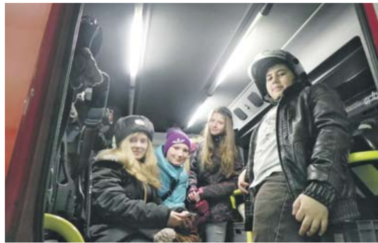
Ребят интересовало все

Школьники сделали много фотографий на мобильные телефоны для того, чтобы разместить их в социальных сетях и рассказать сверстникам об интересной и полезной экскурсии в пожарную часть. ■