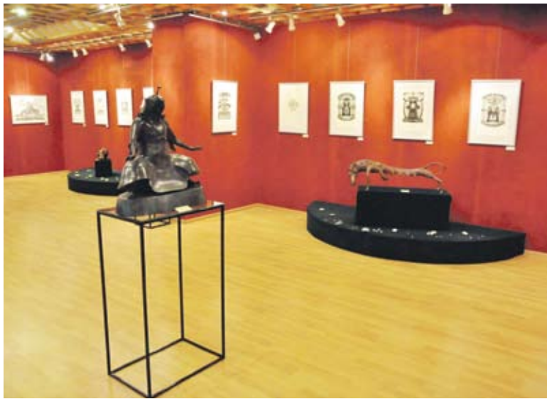
Выставка бурятских мастеров

На открытии выступали творческие коллективы Бурятии, исполняли народные бурятские