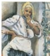
З. Серебрякова. «Мароканка в белом»