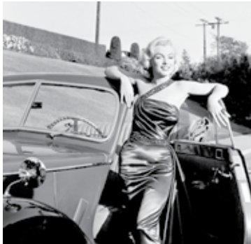
Ф. Ворт. «Мэрилин Монро»

Имя Хельмута Ньюта хорошо известно столичной публике: его выставки его не раз проходили в Москве, альбомы с его работами легко найти в продаже, в Интернете о нем достаточно информации. А его нередко откровенные черно-белые фотографии, прославляющие красоту обнаженного женского тела, врезаются в память... Фрэнк Ворт знаком немногим. При жизни он не снискал славы, популярность пришла к нему случайно и только после смерти. В его архиве обнаружилось более 10 000 фотографий, запечатлевших частную жизнь звезд Голливуда. Мэрилин Монро, Софи Лорен, Джейн Мансфилд, Джеймс Дин, Фрэнк Синатра и др. – вот герои снимков Ворты. И это не удивительно, ведь Ворт со многими из них был дружен. В его работах перед нами предстает гламурный, шикарный Голливуд времен своего расцвета – 1930-1960-х гг. Любопытный тандем двух фотографов можно увидеть в галерее «Кино».