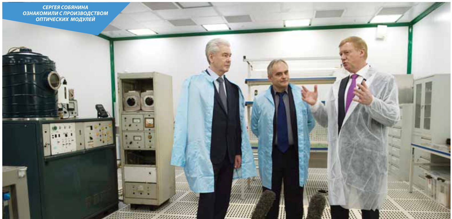
СЕРГЕЙ СОБЯНИН ОЗНАКОМИЛИ С ПРОИЗВОДСТВОМ ОПТИЧЕСКИХ МОДУЛЕЙ

Мэр подчеркнул, что несмотря на кризисные явления инвесто-