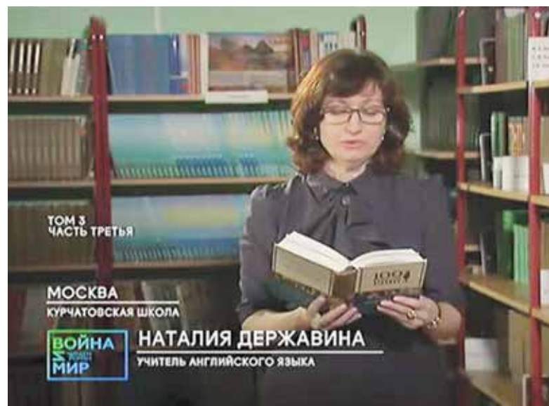
ТОМ 3 ЧАСТЬ ТРЕТЬЯ