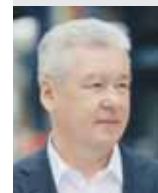
Сергей СОБЯНИН, мэр Москвы:

Отдельно мэр Москвы рассказал о том, какие направления в