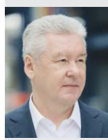
Сергей СОБЯНИН, мэр Москвы:

Таким образом, дополнительные льготы по уплате взносов на капитальный ремонт будут установлены для 1,57 млн чело-