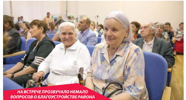
НА ВСТРЕЧЕ ПРОЗВУЧАЛО НЕМАЛО ВОПРОСОВ О БЛАГОУСТРОЙСТВЕ РАЙОНА

«Ежедневно сотрудниками эксплуатирующих организаций осуществляется проверка