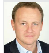
Александр СИДЯКИН, зампредседателя Комитета ГД по жилищной политике и ЖКХ:

Минимальный размер взноса на капитальный ремонт, установленный в Москве, был определен по результатам консультаций со специалистами по капитальному ремонту, строительству и жилищному хозяй-