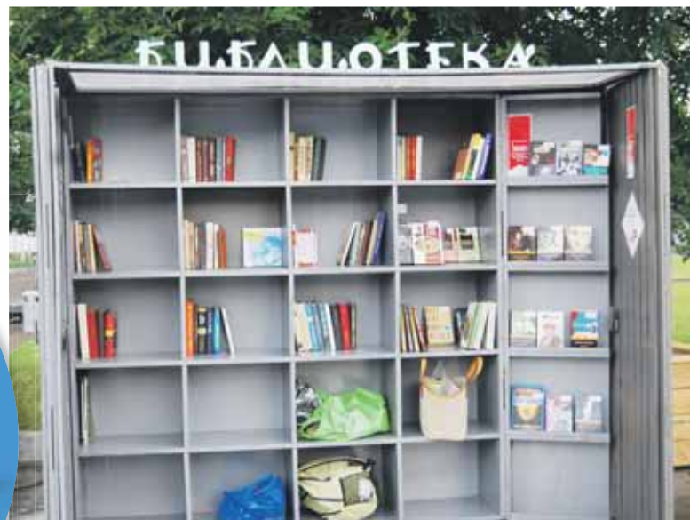
В московских парках этим летом снова поставят книжные полки

В перспективе библиотек, работающих допоздна, будет больше. Перемены рассчитаны на то, чтобы дать возможность посетить библиотеки москвичам, которые обычно до вечера заняты на работе.