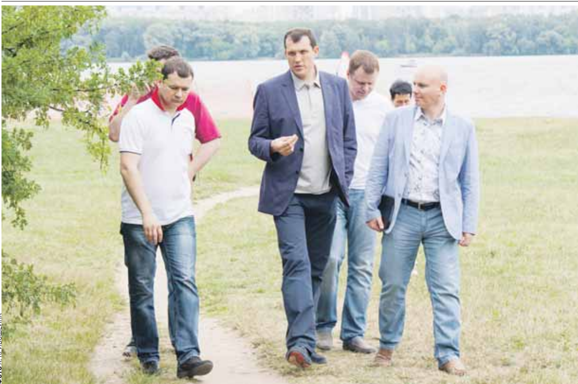
Поручение от префекта округа В. Говердовского: «Здесь должна появиться современная и комфортная береговая зона»