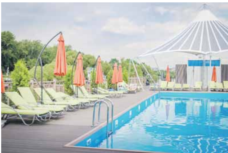
Бассейн в парке «Северное Тушино» оборудован всем необходимым: лежаками, зонтиками, кабинками для переодевания и туалетами

Но главная новость этого лета – открытие бассейна на плавучем понтоне. На пляже есть вся инфраструктура (шезлонги, зонты, кабинки для переодевания, туалеты), и работает он с 10.00 до 23.00 без перерывов и выходных. Стоимость посещения довольно