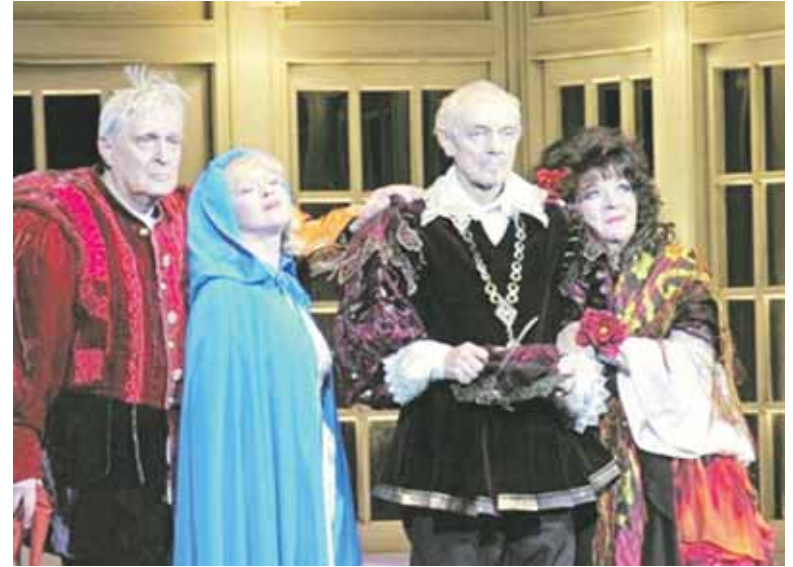
В знаменитом «Квартете» БДТ

Но мои просчеты на личном фронте отнюдь не означают, что я не знала женского счастья. Я его знала! И еще какое! Я проживала его вместе