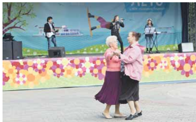
Под звуки нестарящего вальса