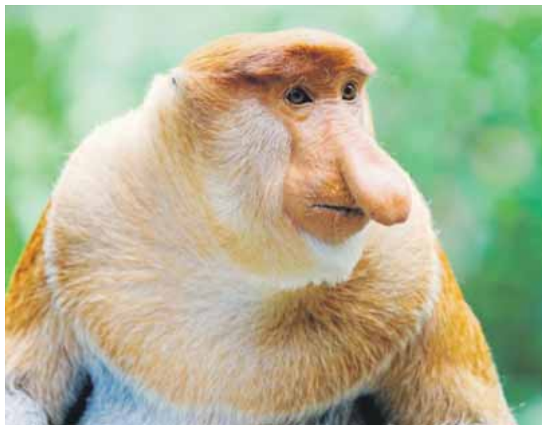
Одно из «100 чудес света» - «Носатая обезьяна заповедника Лабук Бей», снята Хьерстом Йоргенсеном на Борнео. Этот вид находится на грани исчезновения и встречается только на этом острове

Контакты: (499)493-14-67, бульв. Яна Райниса, 19, корп. 1. Режим работы: вторник – воскресенье – с 11.00 до 21.00. Сайт: www.vz-tushino.ru .