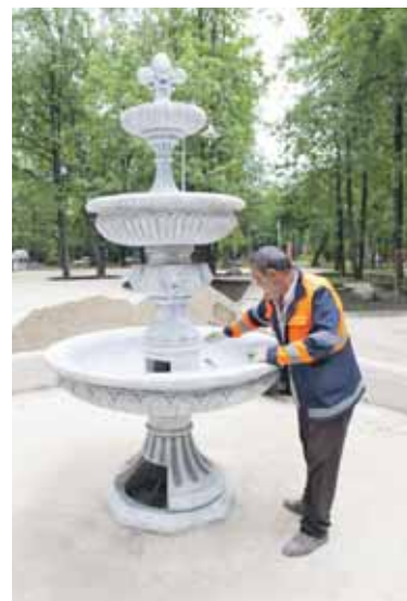
В сквере «Юность» на прежнем месте вновь появился фонтан

Подъезжаем к дому 12, корпус 2, по Маршала Новикова. Сквер «Юность». Работа — в самом разгаре: идет укладка плитки. Старожилы помнят — раньше здесь