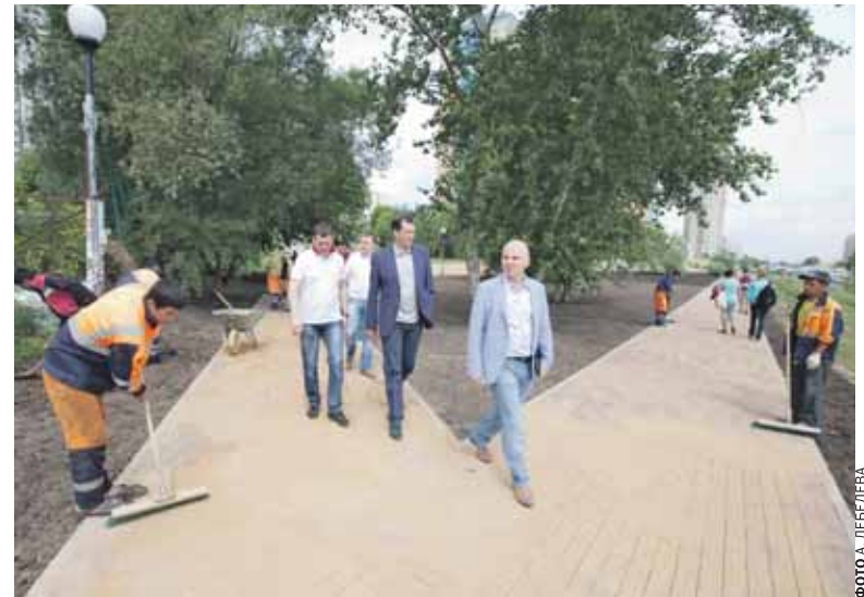
Обустройство идет полным ходом

был фонтан и небольшая парковая зона. Потом сквер перепланировали, оставив посередине круглую площадку, где до недавних пор в новогодние праздники устанавливали елку. Теперь вновь появится фонтан, вокруг — оригинальные архитектурные формы, плиточные дорожки и зеленые насаждения. По словам префекта, идея создания таких «народных парков» понравилась жителям округа.