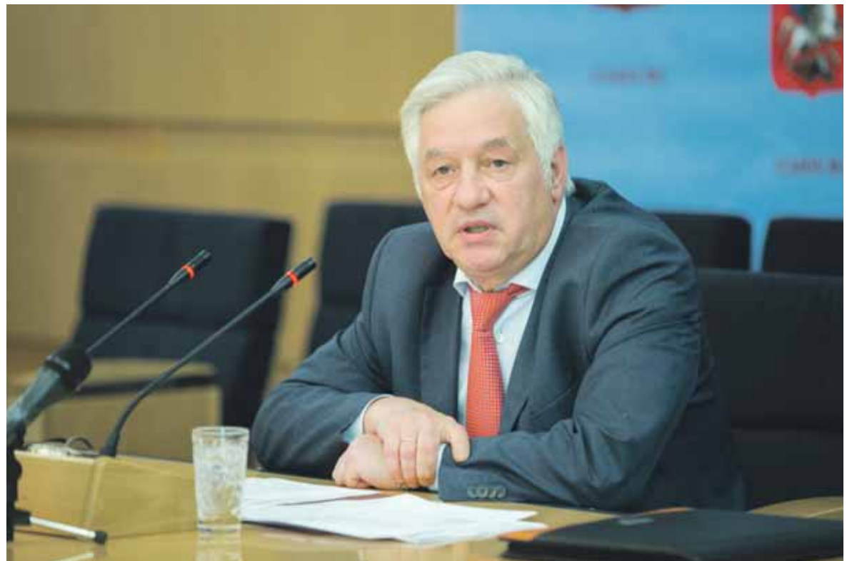
Председатель Московской городской избирательной комиссии Валентин Горбунов

Одной из мер, призванных сделать выборы открытыми, является организация видеонаблюдения на избирательных участках. Опыт прошлогодних выборов мэра Москвы показал, что веб-камеры на голосовании положительно влияют на всех участников избирательно-