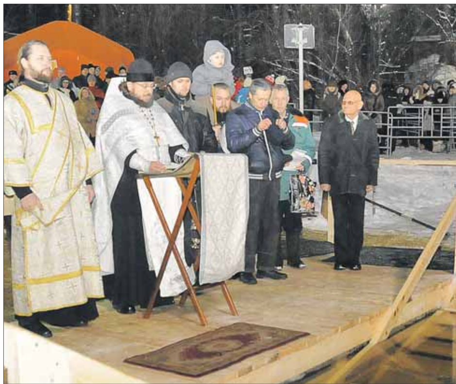
Тысячи москвичей окунулись в озеро Бездонное в Серебряном Бору