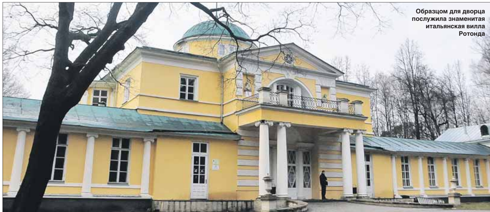
Образцом для дворца послужила знаменитая итальянская вилла Ротонда

В 1780 году у Нарышкиных Братцево купил их родственник, граф Александр Сергее-