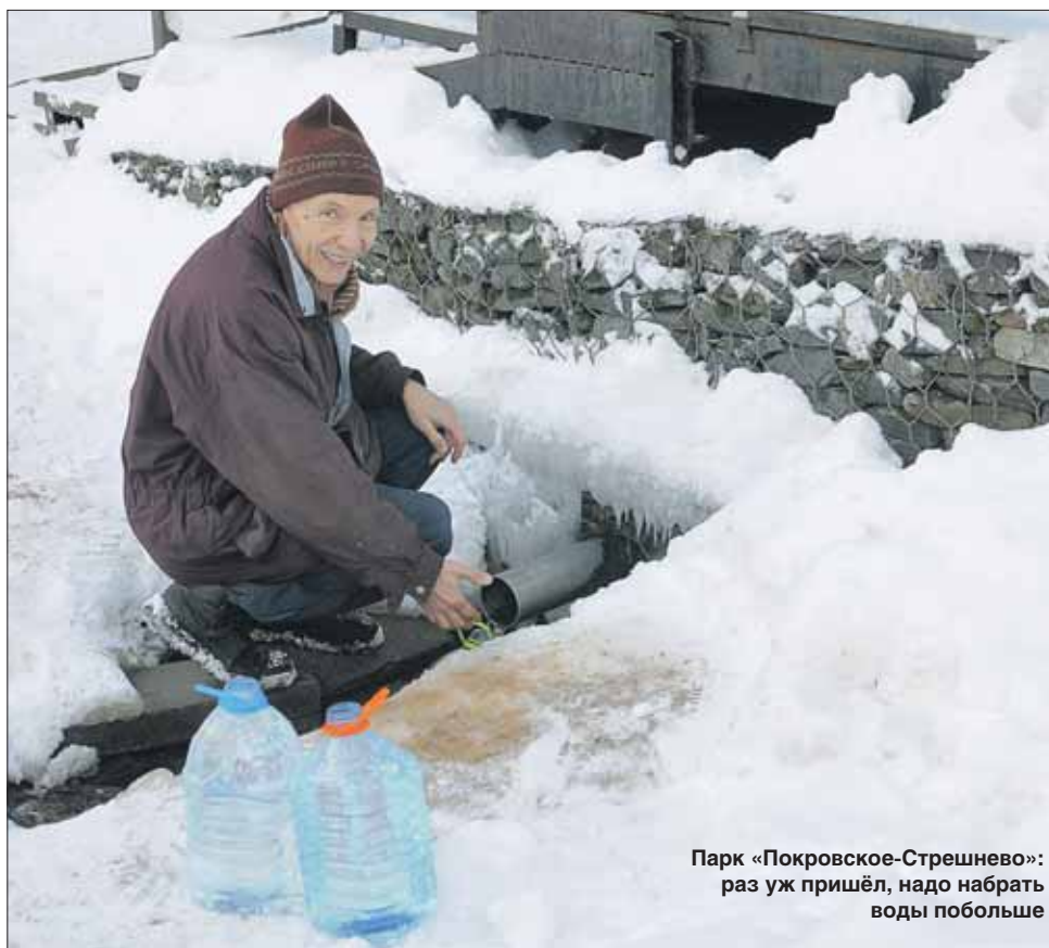
Парк «Покровское-Стрешнево»: раз уж пришёл, надо набрать воды побольше

— Конечно! — даже удивляется моему вопро-