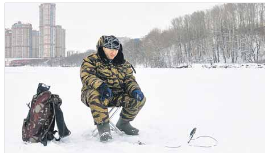
Район Строгино: рыбаки присели у лунок на Москве-реке. Клёвёт, однако! Кстати, 30 января в Волоколамском районе на рыболовной базе «Львово» состоится уже третий рыболовный фестиваль по ловле сига со льда — «Сиголов». В его организации участвует отделение партии «Единая Россия» в СЗАО. Половим?