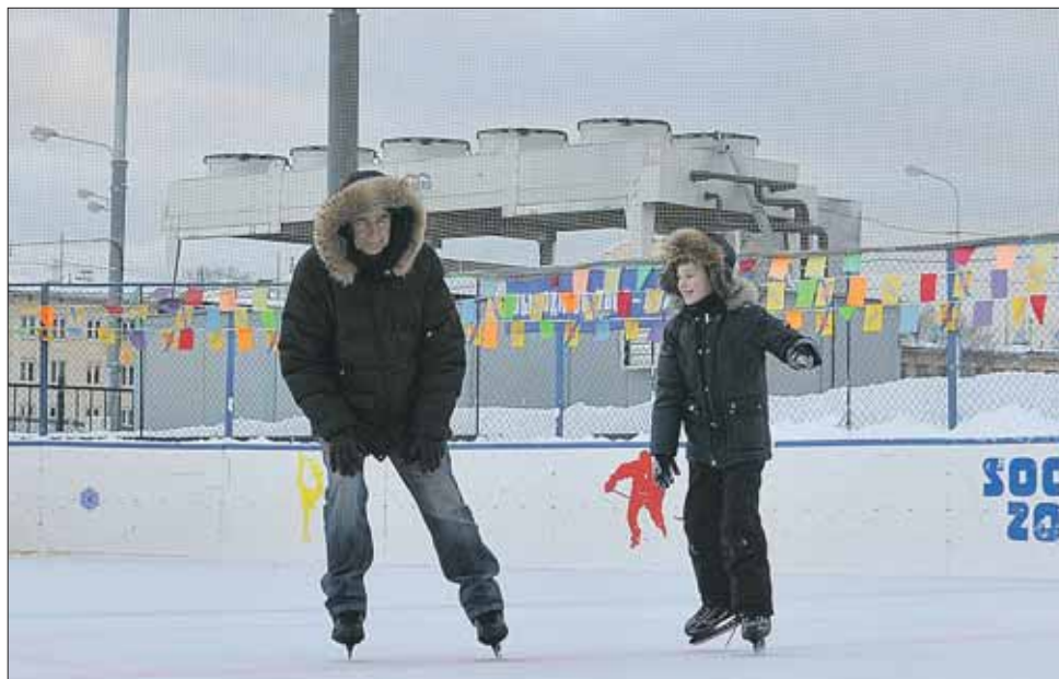
Каток на улице Народного Ополчения, 11