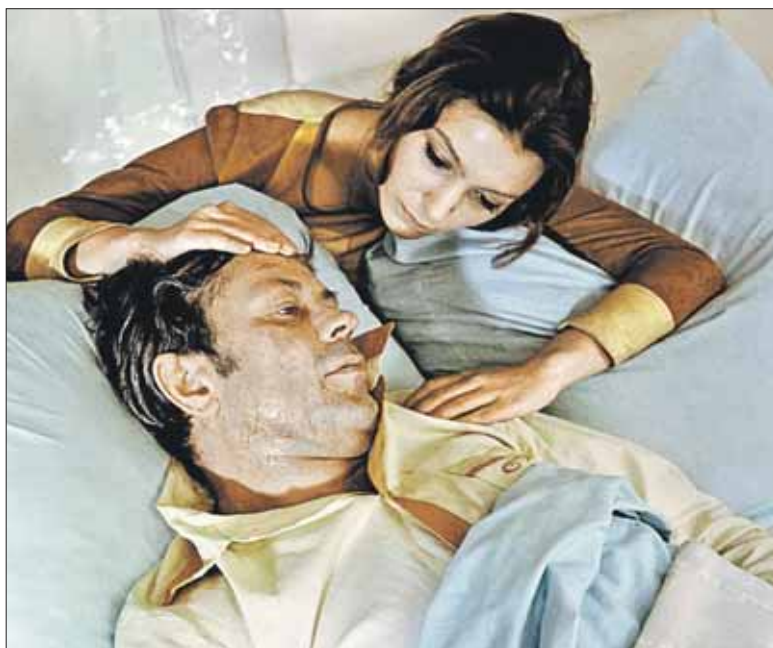
В фильме «Солярис» с Донатасом Банионисом