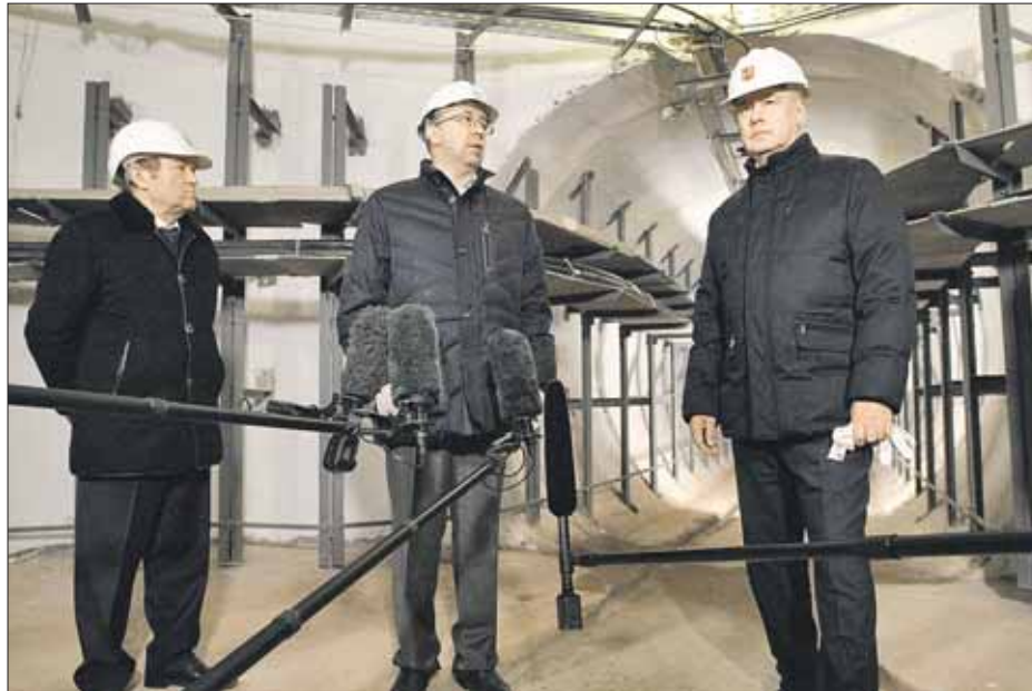
Сергей Собянин внимательно осмотрел новый объект

Такие новые коллекторы, как запущенный в Восточном округе, позволяют держать под постоянным контролем автоматику. На всём протяжении трубы расставлены многочисленные датчики, в том числе дымовые, те-