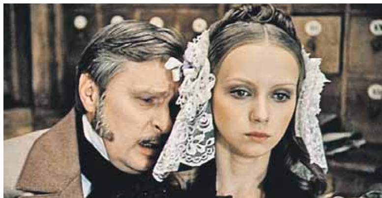
Фильм «О бедном гусаре замолвите слово» снимали в этой усадьбе

Сейчас главный дом находится в частной собственности и частично занят арендаторами под кафе и гостиницу. Для любителей отдыха на природе перед дворцом поставили мангал. Юрий СТАРОДУБОВ