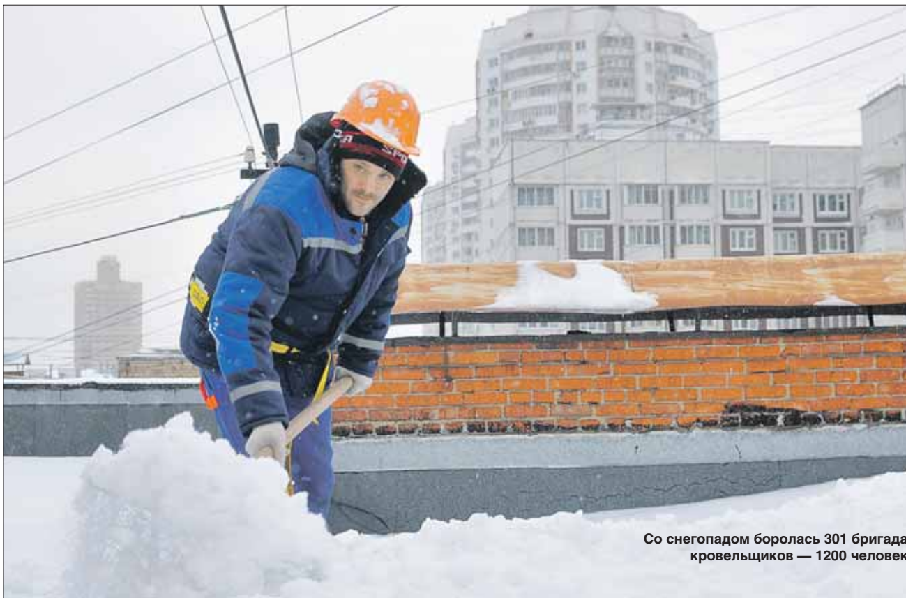
Со снегопадом боролась 301 бригада кровельщиков — 1200 человек

Январские снегопады выдались поистине эпическими. Так, после сильного снегопада, который прошёл 12 января, за сутки в округе было очищено 300 крыш. Кровельщики работают только на скатных крышах: именно с них снег может съехать и упасть, травмируя людей. Плоские крыши очищать от снега не обязатель-