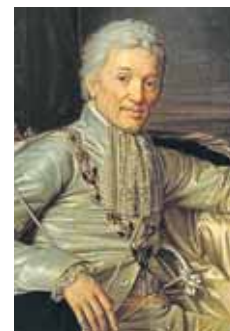
Пожилому Строганову графиня предпочла молодого Римского-Корсакова

ют известного архитектора Андрея Воронихина, а образцом для него послужила знаменитая итальянская вилла Ротонда эпохи Возрождения.