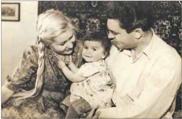
Маленькая Наташа со своими знаменитыми родителями — Инной Макаровой и Сергеем Бондарчуком

— Родители расстались рано, и в восемь лет я полностью потеряла связь с отцом. Он не появлялся, я обижалась, переживала. А потом узнала: он искал встречи, приходил, но мама не хотела, чтобы мы виделись. Наверное, зря. В школе и во дворе взрослые придумывали разные уловки, чтобы узнать у меня, что там происходит в знаменитой семье. А я ничего не знала о папе, видела его только на экране. Он даже не знал, что я поступаю во ВГИК к Герасимову. Но потом он пришёл посмотреть мой дипломный спектакль «Красное и чёрное», зашёл за кулисы, и мы, обнявшись, заплакали. Он говорит: «Как жаль, что ты повзрослела без меня».