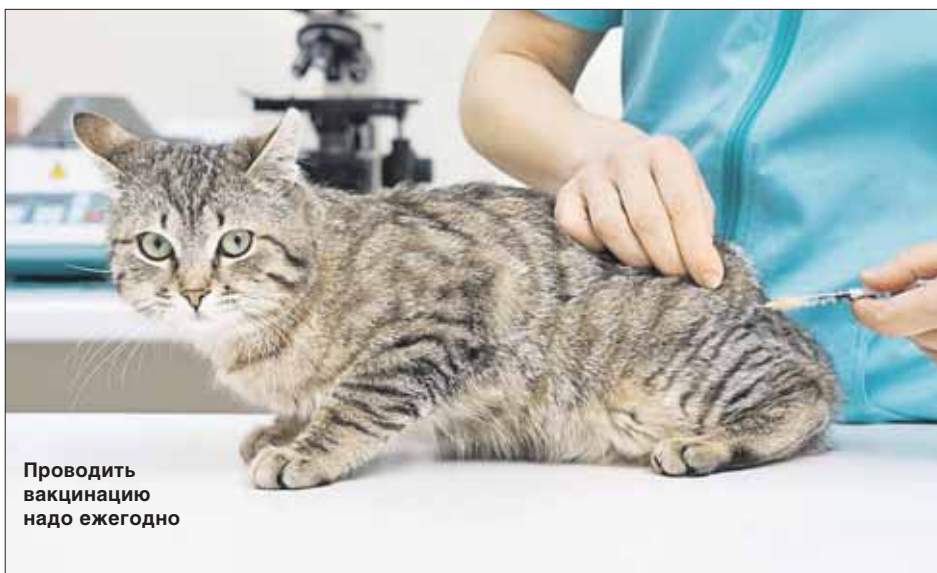
Проводить вакцинацию надо ежегодно

В Куркине до 8 марта объявлен карантин по бешенству. В районе запрещается проведение