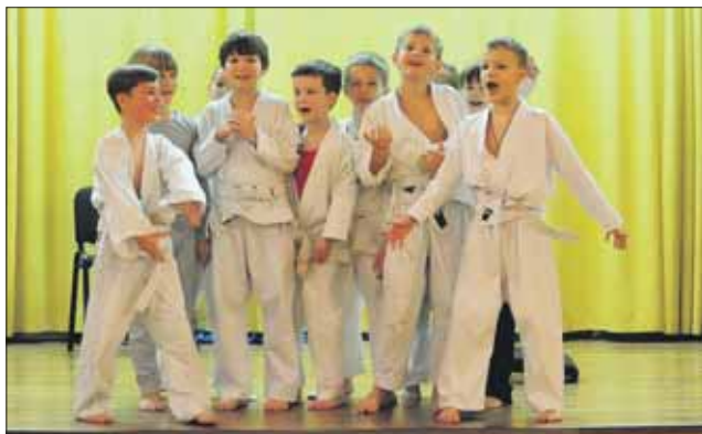
Репетиции в разгаре

Театру при школе №1874 (ул. Маршала Новикова, 13) уже больше 20 лет. Его труппа — как нынешние школьники, так и уже выросшие, те, кто впервые пришёл в «Кай» ещё в де-