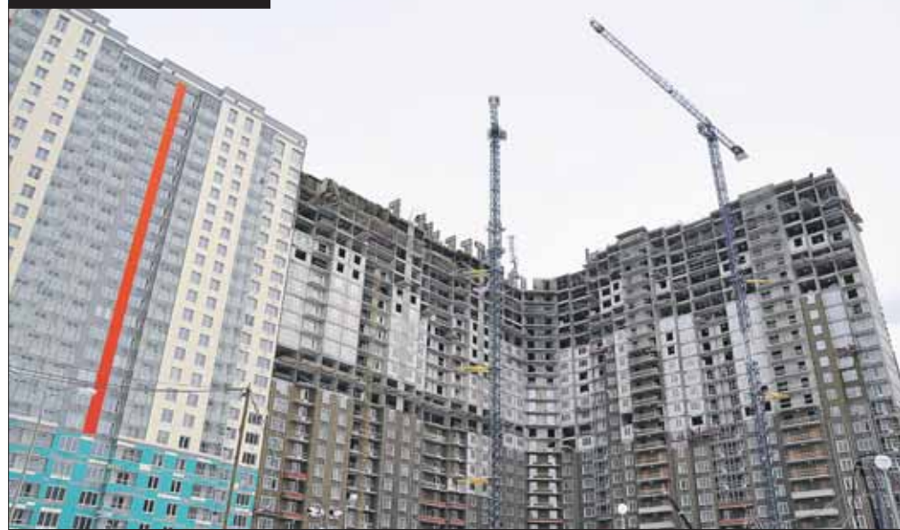
Работы идут на 24-м и 25-м этажах

На Митинской ул., 22, завершается сооружение второго корпуса — 1Б — нового квартала «LIFE-Митинская ECOPARK». Здание уже построено, сейчас идут работы на последних — 24-м и 25-м этажах.