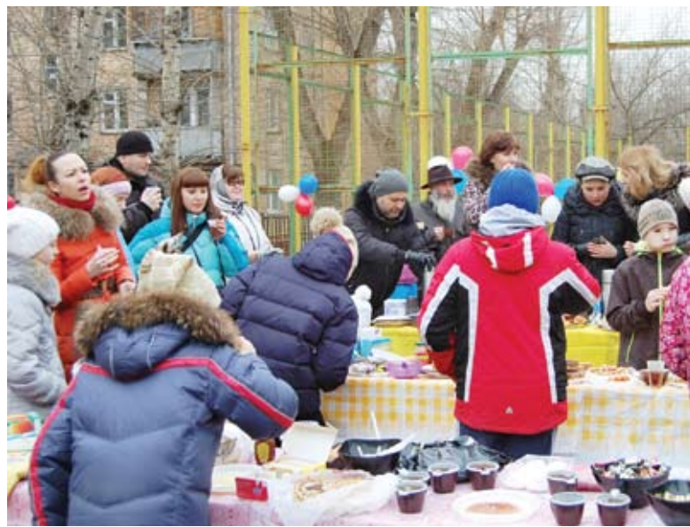
Для гостей были накрыты праздничные столы