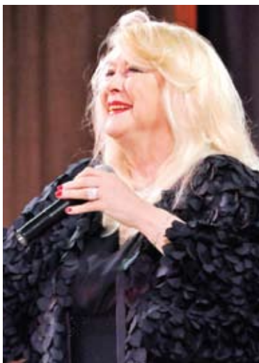
Выступает народная артистка России Ирина Мирошниченко