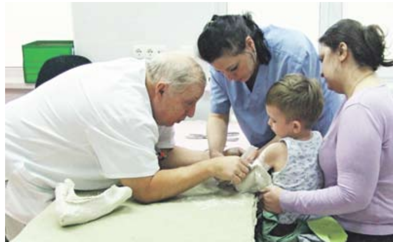
Травмопункт: сюда везут ребят со всей Москвы