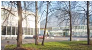
Концертно-выставочный зал «Сокольники»

Современному человеку, зависящему от всевозможных гаджетов, Интернета и т.п., регулярно предлагается куча вариантов вернуть физическое и душевное равновесие – йога, сыроедение, возвращение к корням и проч. Регулярный стресс на работе предлагается компенсировать правильным питанием и выполнением асан. Как не потеряться в великом разнообразии духовных практик, как найти в нем себя? Чем еще, кроме знакомой всем йоги, можно заняться с пользой для здоровья? Ответить на эти вопросы поможет фестиваль конфессий и духовных практик. Здесь любой желающий найдет то, что ищет! Под одной крышей соберутся духовные школы, компании, занимающиеся оздоровительным туризмом, производители экотоваров, школы искусств и танцев и др. Вас ждут массаж и оздоровительная гимнастика, школы восточной медицины, спа-процедуры, ароматерапия, цигун, медитативные практики, психотерапия. Плюс дизайнерская одежда и украшения и многое другое. Подробную программу ищите на официальном сайте фестиваля – www.filosofi21.com .