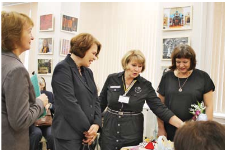
Участники «круглого стола» обменялись мнениями

В конце февраля в Межрайонном отделении социальной реабилитации инвалидов ТЦСО «Тушино» прошел «круглый стол» на тему «Инновационные практики реабилитации инвалидов, в том числе детей-инвалидов, в учреждениях системы социальной защиты населения города Москвы».