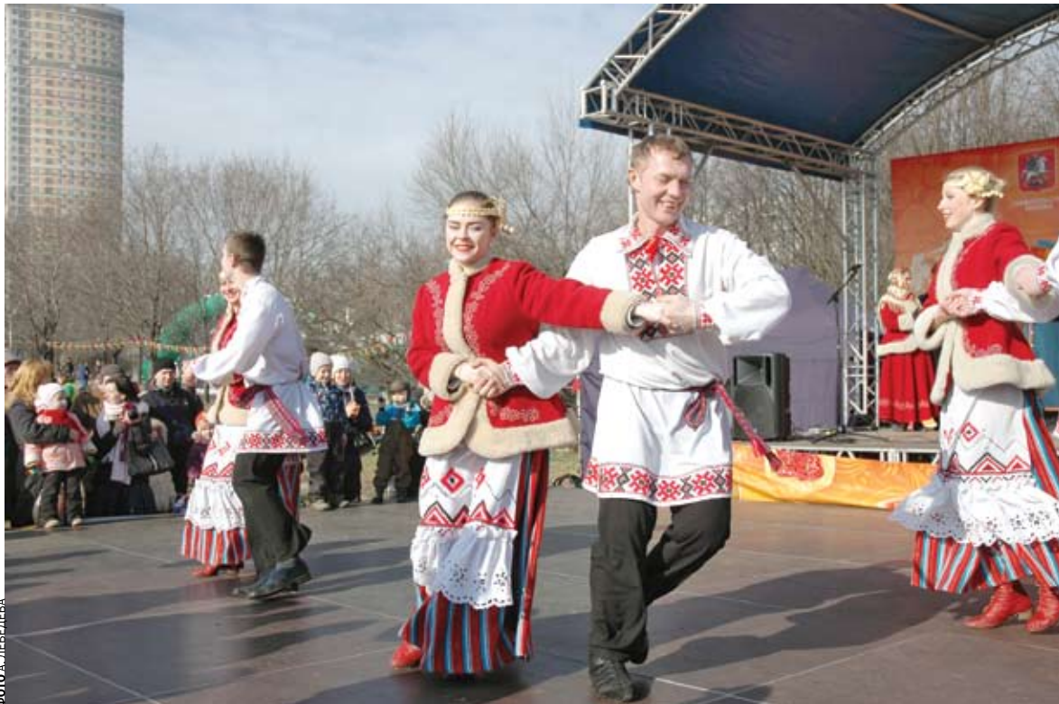
Выступали коллективы самодеятельности

С утра все уже было готово к наплыву гостей: манили яркие балаганы ярмарки, где продавались сувениры, воздушные шары, какие-то невиданные чаи, орехи. А рядом умелые молодые люди прямо на глазах радостной публики на огромных сковородах выпекали блины. Горячие, золотые, со сметаной и сгущенкой, они шли нарасхват. Интересные викторины, беспроигрышная лотерея, различные игры и забавы очень радовали и детей, и взрослых. Возле сцены