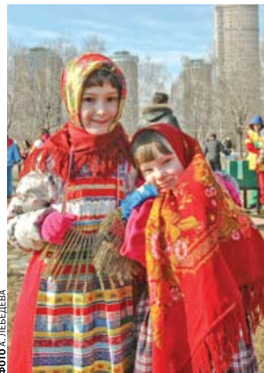
Игры и забавы радовали маленьких гостей Масленицы

Ближе к вечеру началась любимая русская забава - перетягивание каната, а завершился праздник сжиганием чучела Мораны – богини зимы у древних славян. ■