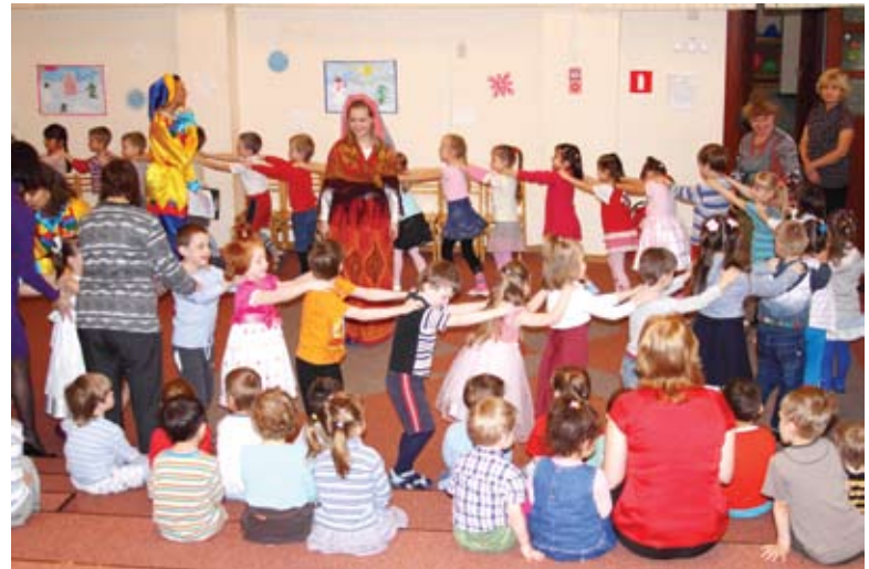
Волонтеры подготовили веселую программу