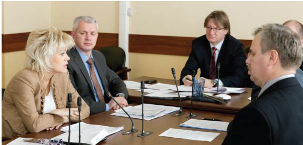
На расширенном заседании Совета предпринимателей

Важно то, что, по словам начальника Управления городским иму-