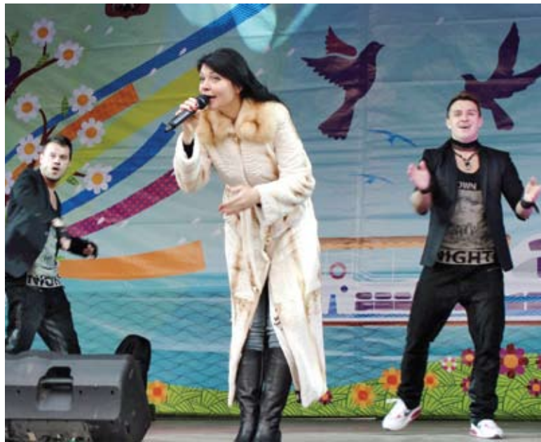
На сцене - популярная певица Света

порядка обеспечивали сотрудники отдела МВД «Северное Тушино». К счастью, помощь ни тех, ни других никому не понадобилась.