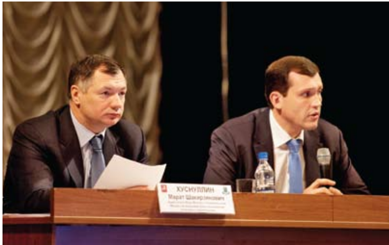
Заместитель мэра Москвы Марат Хуснуллин и префект СЗАО Владимир Говердовский

округу, появится 5 транспортно-пересадочных узлов (а всего на территории округа планируется построить 16 ТПУ).