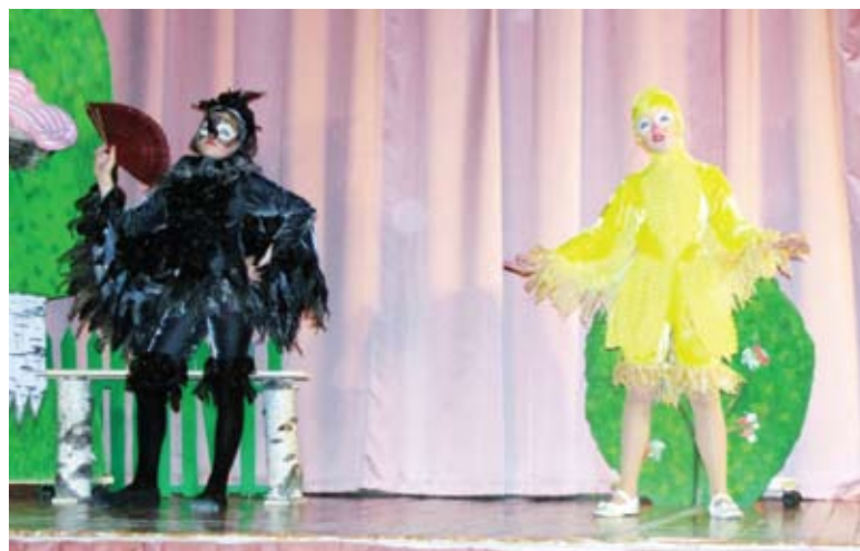
Увлекательнейший музыкальный спектакль о добре и дружбе «Ворона и Канарейка» представил музыкальный театр «Галлагрант»