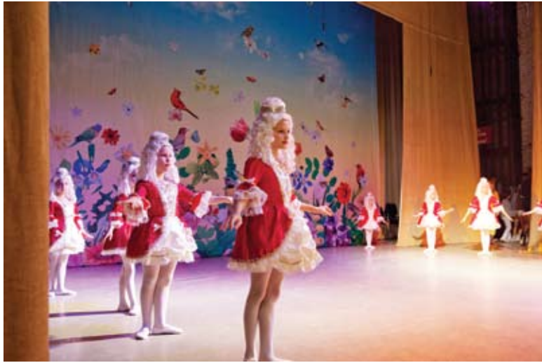
Соревновались в талантах и коллективы, и солисты