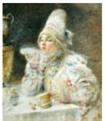
К. Маковский. За чаем

Портреты царей и вельмож, великосветских дам и кавалеров – явление широко распространенное и, можно сказать, типичное. Но было еще одно сословие, которое не меньше чиновников влияло на ход истории и развитие общества, – купцы. И они, конечно же, тоже хотели запечатлеть себя для потомков. Выставка в Историческом музее демонстрирует, как воспринимало себя купеческое сословие, как менялись его вкусы, как в целом развивался жанр портрета – от безличной, условной парусны до психологически тонких реалистических вещей. Любопытно разглядывать изображения давно ушедших людей и представлять себе, как они жили, как чувствовали, что думали, когда позировали художнику, о чем мечтали... Подлинная патриархальность соседствует с попытками следовать веяниям моды, самодостаточность с желанием казаться лучше, богаче, интереснее. Вы увидите работы безымянных живописцев и признанных мастеров жанра – В. Тропинина, К. Маковского, В. Серова и др. Кроме живописи представлены дагерротипы (дагерротипия предшествовала фотографии и существовала совсем недолго – с 1840-х до конца 1850-х гг.).