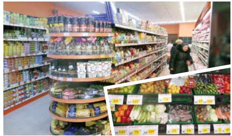
Новый магазин приятно удивляет не только просторным, светлым и удобным торговым залом, но и низкими ценами