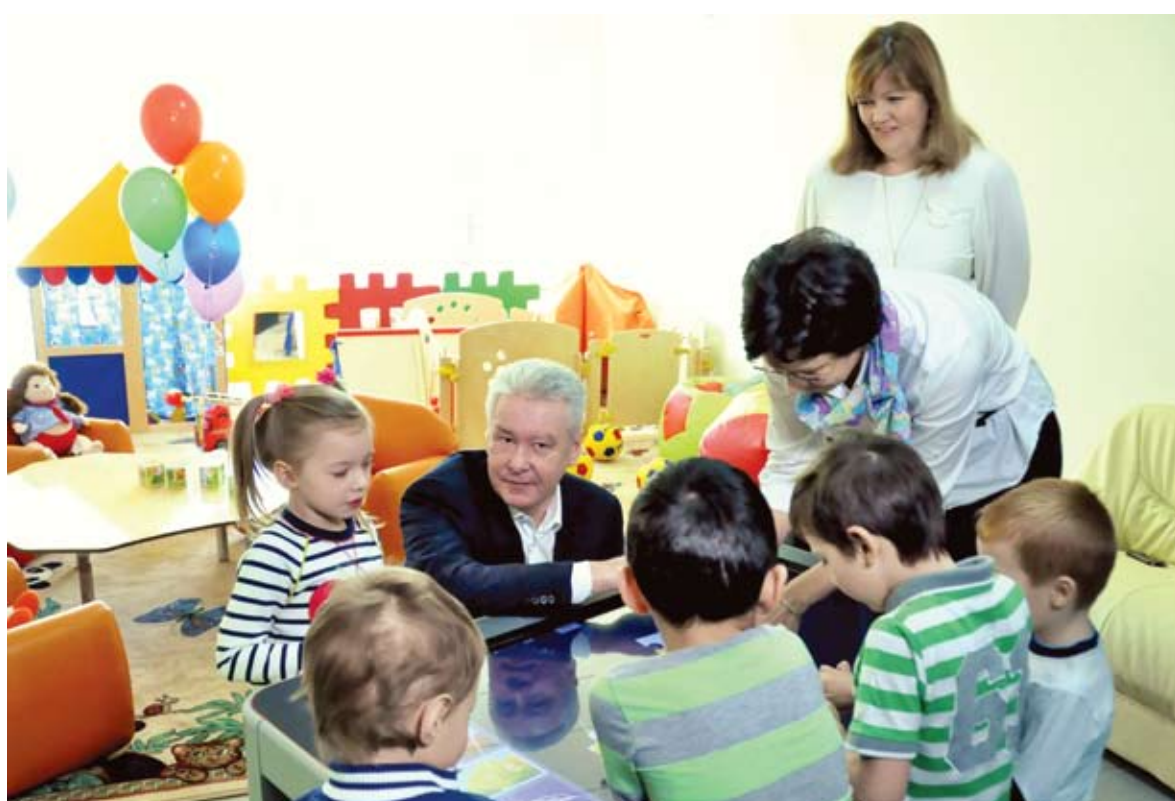
Сергею Собянину показали детский сад «Карамельки»