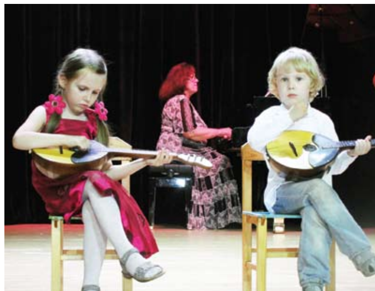
Детский ансамбль народных инструментов ДК «Берендей»

Концертную программу открыли хозяева - хор «Серебряный