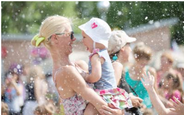
На карнавале взрослые могут почувствовать себя детьми

Эту карнавальную сборную готовили в нашем округе два месяца. В Центре детских и молодежных социальных инициатив «Крылья» (Покровское-Стрешнево) учились жонглировать, ходить на ходулях, играть на барабанах и делать арт-объекты