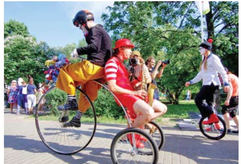
К празднику готовились два месяца

- У ребят уже было представление о том, как работать в драматическом театре. Поэтому нашей задачей стало показать им, как делается уличный театр. Здесь ведь свои особенности – нужно уметь заполнять голое пространство, правильно двигаться (мелкие движения на открытой площадке не видны). Кроме того, мы хотели, чтобы за время репетиций ребята открыли в себе новые человеческие качества, задумались о важных вещах. Для этого на первой же встрече я предложил участникам мастерской вспомнить вопросы, на которые нет ответа. Идея им понравилась и уже на следующей репетиции они представили огромный список – от смысла жизни до законов Вселенной. Самым оригинальным, на мой взгляд, оказался вопрос одной девочки про то, откуда появился первый памятник. Его мы и взяли за основу спектакля – каждый участник придумал свою историю памятника и обыграл ее. У нас не было цели показать какие-то конкретные памятники, но у каждого этюда есть внутренняя логика. Мы вместе фантазировали, пробовали, размышляли и соединяли этюды воедино. Так за двенадцать репетиций родился небольшой, философский спектакль, - рассказал режиссер.