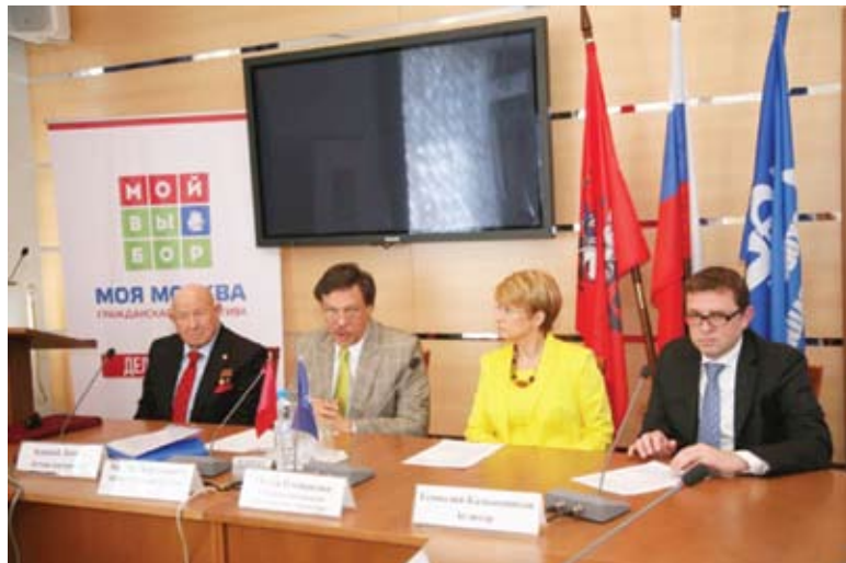
Заседание городской счетной комиссии гражданской инициативы «Моя Москва»