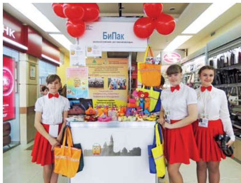
Школьная компания «Би Пак»

Программа стартует с началом учебного года. На пути к фи-