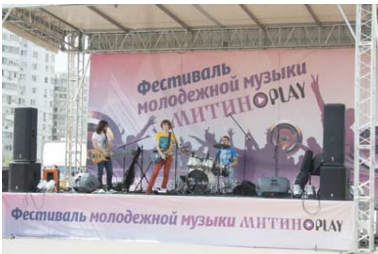
Конкурсанты и гости выступали в разных стилях