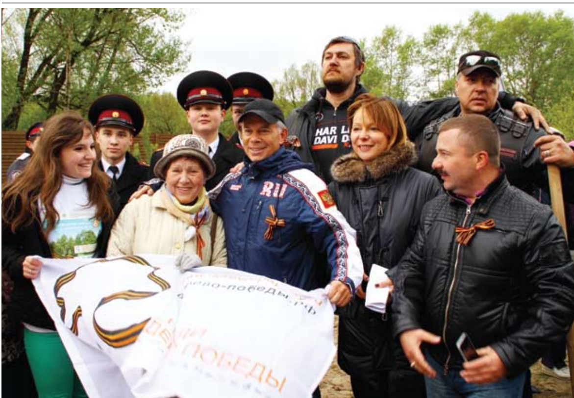
Народный артист России Олег Газманов вместе с участниками акции