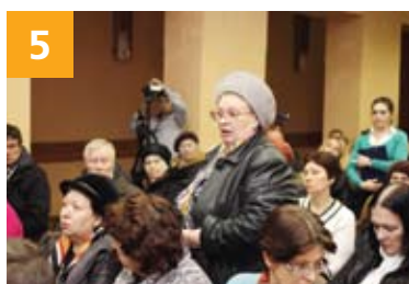
График встреч с населением глав управ районов СЗАО в мае