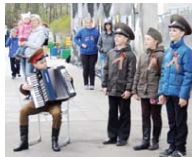
Музыкальные зарисовки на военную тематику

Стартовал пробег в 11 утра с улицы Ландышевой, далее по Воротынской, разворот у школы № 1298 по Юровской улице — и завершение у памятника жителю Куркина, погибшим в годы Великой Отечественной войны.