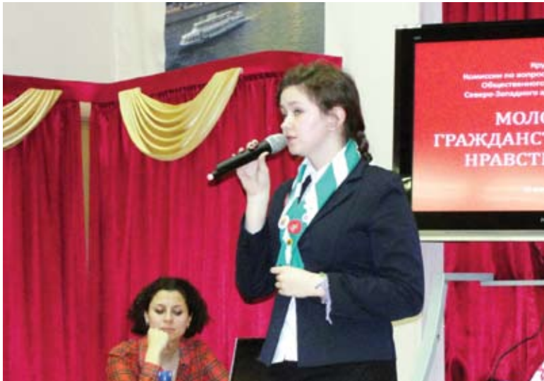
О мероприятиях, проводимых в округе, рассказали представители детских и молодежных объединений