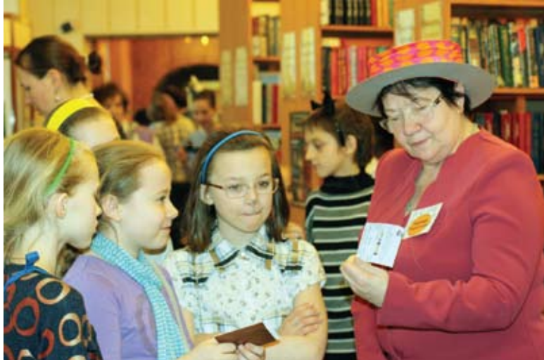
Каждому гостю нашлось дело

В рамках общероссийской акции в поддержку чтения «Библионочь-2014» в библиотеке № 51 (Хорошево-Мневники) прошла тематическая вечеринка «Брандашмыг, или Времяисчисление по Кэрролла».