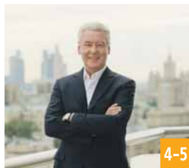
Четыре года на посту мэра