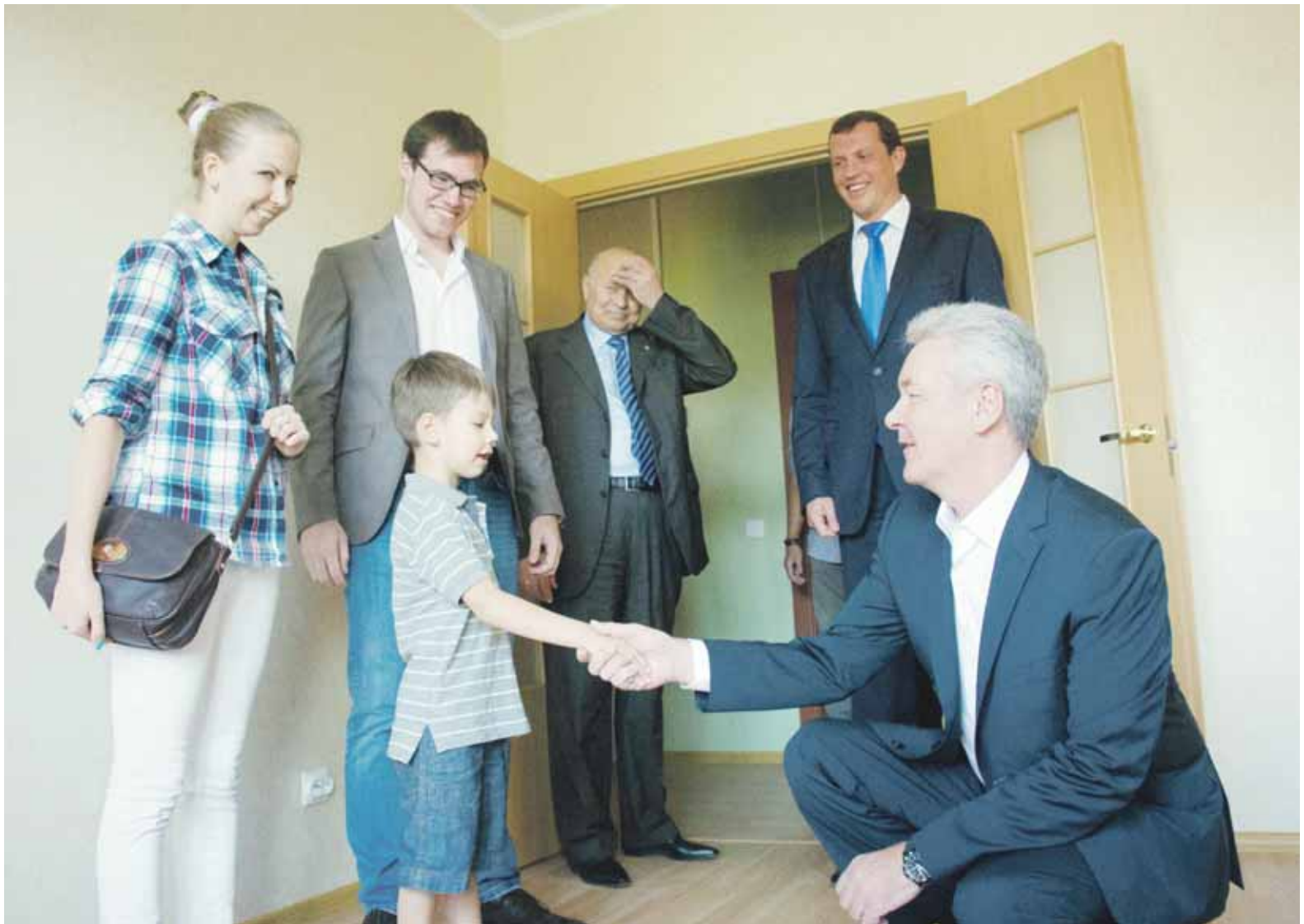
Мэр лично поздравил первых жителей дома № 23 по улице Мневники, переехавших в современные квартиры из отживших свой век пятиэтажек

В самом деле, посмотрите, насколько изменилась Москва за эти годы. Чистая и ухоженная, она вновь становится самой зеленой столицей мира. На месте заброшенных пыльных сквериков, любимых только алкоголиками, возникают «народные парки» - обустроенные места отдыха горожан рядом с домом, в шаговой доступности. Городские магистрали становятся ровнее и просторнее. Новые дома растут уже не как поганки после дождя - на любом мало-мальски доступном месте, - а в соответствии с полноценными архитектурными проектами, имеющими все необходимое обоснование. В том числе - конкретное и детальное согласование с общественностью. Исчезли из наших дворов многочисленные, разнообразные, но одинаково безобразные гаражи-«ракушки». Вечная, казалось бы, очередь в