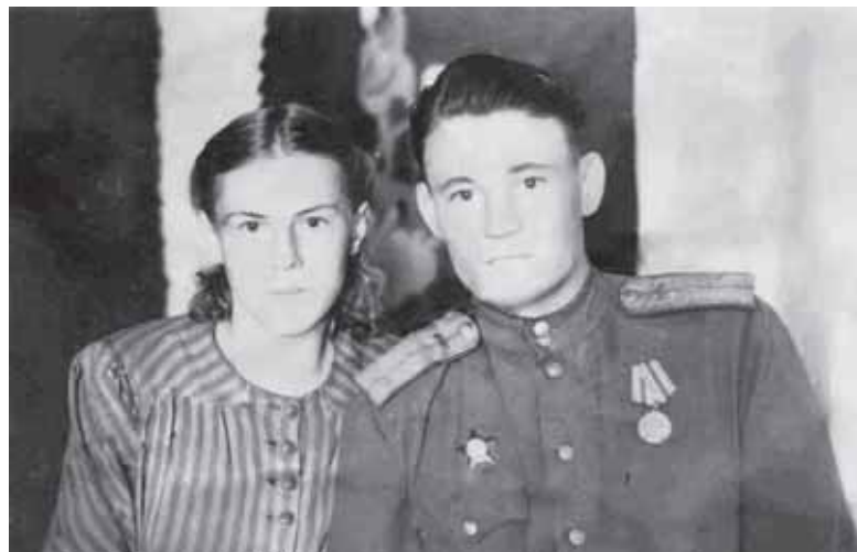
Родители в день их свадьбы 30 ноября 1945 года

Мама ушла на фронт с последнего курса иныа. Сначала забрали на войну мальчишек-однокурсников, а затем подошла очередь девичьей половине курса. Никогда, ни единым словом мама не раскрыла тайну своей военной деятельности. Может, эту тайну хранили бесчисленные призы, которые она получила за сверхметкую стрельбу и забила ими наш немецкий сервант. Мама не только стреляла лучше многих офицеров, она еще и лучше всех