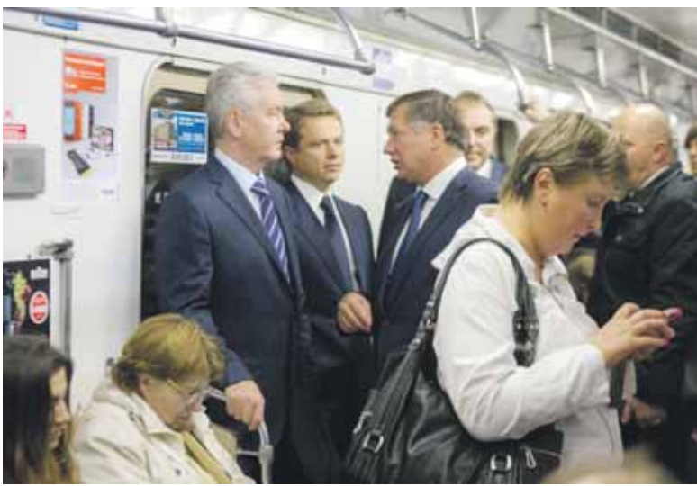
Столичный мэр стал одним из первых пассажиров на открытой вместе со стадионом станции «Спартак»