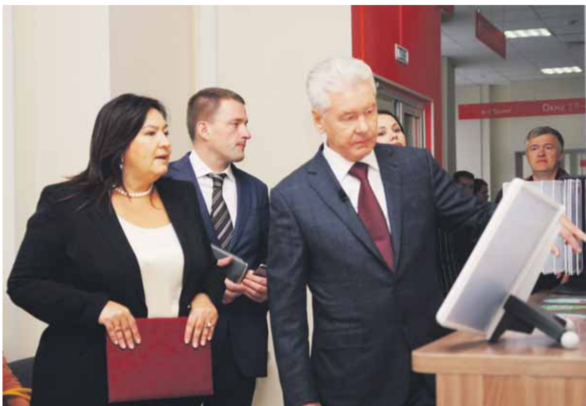
Сергей Собянин открыл в районе Щукино долгожданный многофункциональный центр

37 школ нашего округа, вошедших в «Топ-400» лучших школ Москвы. Масса новых детских садов: в одном только Куркине их построено четыре в расчете на более чем 600 детишек! Новое суперсовременное «тяжелое» оборудование у медиков округа. Строительство новой поликлиники в Щукине на базе 52-й больницы, нового перинатального центра (вместо старого роддома) в 67-й больнице в Хорошево-Мневниках, - причем он сможет принимать матерей и младенцев с сердечной патологией. Только с начала этого года - 6 новых домов, это 95 тыс. кв. м комфортного жилья для переселенцев из сносимых «хрущевок». Новые станции метро. Новые храмы. Новые стадионы - один спартаковский «Открытие Арена» чего стоит!