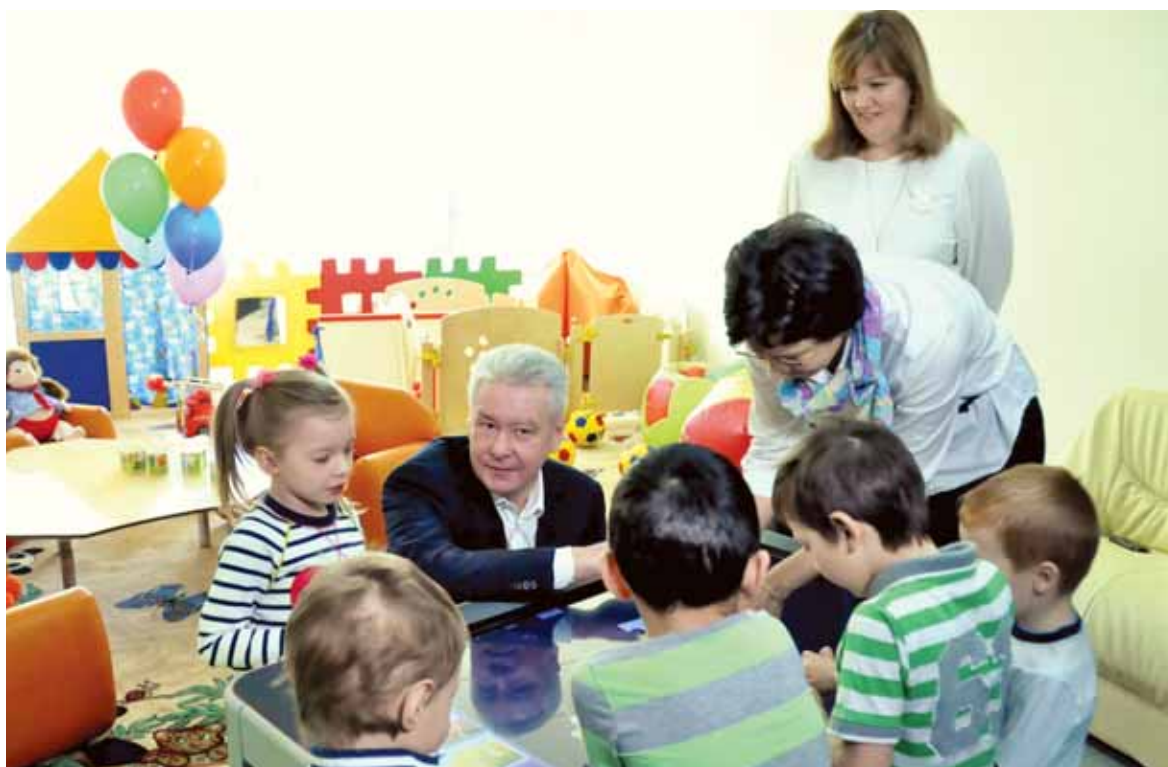
Мэр Москвы, посетивший новый куркинский детский сад «Карамельки», отметил, что «острая проблема нехватки детских садов, которая существовала в районе Куркино, этим современным детским садом закрывается»