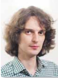
КАЦ Максим Евгеньевич

1986 года рождения, проживает в городе Москве, депутат Государственной Думы Федерального Собрания Российской Федерации, выдвинут избирательным объединением «Московское городское отделение Политической партии ЛДПР - Либерально-демократической партии России», член Политической партии ЛДПР - Либерально-демократической партии России.