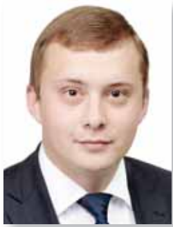
АНИСИМОВ Егор Игоревич

1987 года рождения, проживает в городе Калининград Калининградской области, депутат Государственной Думы Федерального Собрания Российской Федерации, выдвинут избирательным объединением «Московское городское отделение Политической партии ЛДПР – Либерально-демократической партии России», член Политической партии ЛДПР – Либерально-демократической партии России.