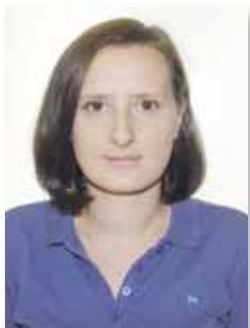
ЗОЛОТАРЁВА Светлана Андреевна

1987 года рождения, проживает в городе Калининград Калининградской области, депутат Государственной Думы Федерального Собрания Российской Федерации, выдвинут избирательным объединением «Московское городское отделение Политической партии ЛДПР – Либерально-демократической партии России», член Политической партии ЛДПР – Либерально-демократической партии России.