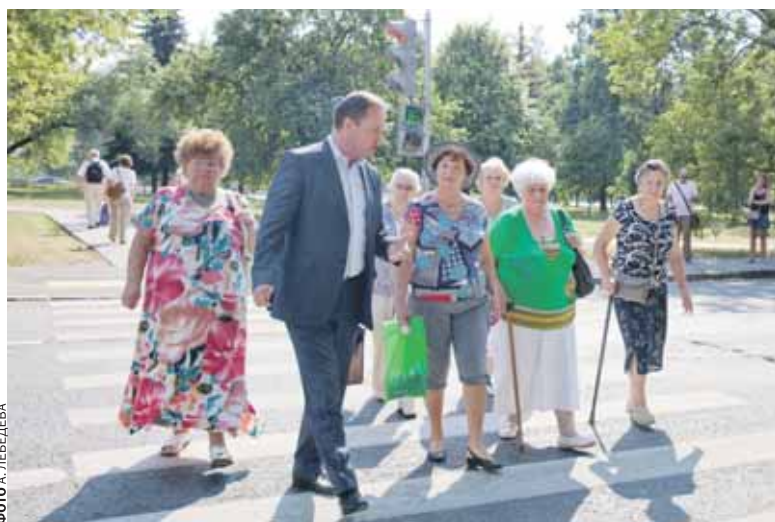
Встреча на «зебре»

- Да нет, «Народный контроль» никуда не денется, он войдет в качестве составляющей в новый проект. Во время тех самых дворовых встреч с людьми, вообще во время любого общения с избирателями я понял, что остро необходима оперативная связь, скажем так, «многоквартирный дом – МГД». А то часто опаздываем вовремя среагировать на какую-то проблему, а переделывать потом – достаточно сложно... У каждого депутата МГД может быть до 40 помощников на общественных началах. И вот я сейчас создаю такой институт общественных помощников – активных, неравнодушных. Кандидатуры подсказывают сами жители – в каждом доме есть такие люди. Да и я во время встреч их обычно сразу отмечаю: знаете, покрывать многие горазды, а есть особая категория людей, которые не просто критикуют, но предлагают решение, которые готовы к диалогу – наверное, это главное. Я рассчитываю, что будет двадцать таких активистов в Митине и по десять в Покровском-Стрешнево и Щукино. Они получат официальное